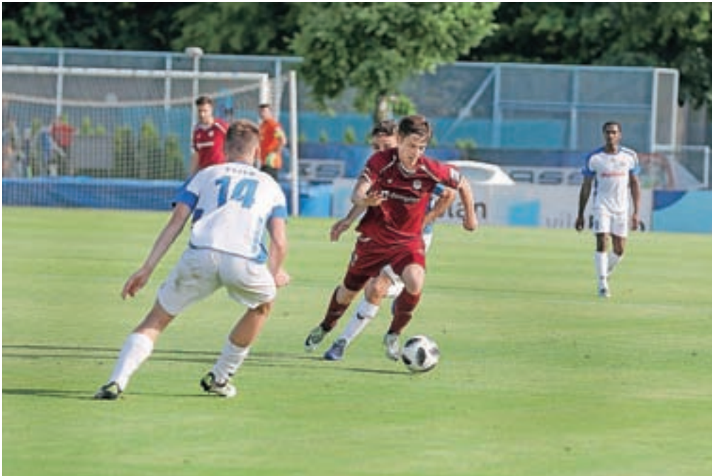
Nogometaši Triglava, ki so se po končanem rednem delu sezone borili za obstanek med slovensko elito, so ekipo Drave v dodatnih kvalifikacijah najprej premagali na Ptuj, nato pa so bili boljši tudi na domači zelenici.

Te dni po svetu vlada nogometna mrzlica, saj se je sredi junija v Rusiji začelo svetovno prvenstvo, ki se bo končalo sredi drugega meseca. Še pred začetkom enega največjih športnih spektaklov na svetu so nogometaši Triglava na domači zelenici v dodatnih kvalifikacijah poskrbeli, da bo Kranj tudi v novi sezoni imel nogometnega prvoligaša. Za ljubitelje plavanja in poletne rekreacije pa je tudi letos dosti priložnosti na kranjskem letnem kopališču.