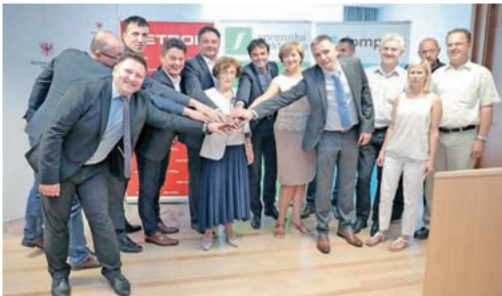
Projekt energetskega pogodbeništvaja so podprli številni, ki so se zbrali ob podpisu pogodbe.

Objekti, ki jih bodo celovito energetske sanirali, so: občinska stavba v Kranju, Prešernovo gledališče Kranj, OŠ France Prešeren – POŠ Kokrica, OŠ Helene Puhar, OŠ Jakoba Aljaža s športno dvorano, OŠ Matije Čopa, OŠ Simona Jenka – PŠ Trstenik, OŠ Staneta Žagarja, VVZ Janina, VVZ Najdihoj-