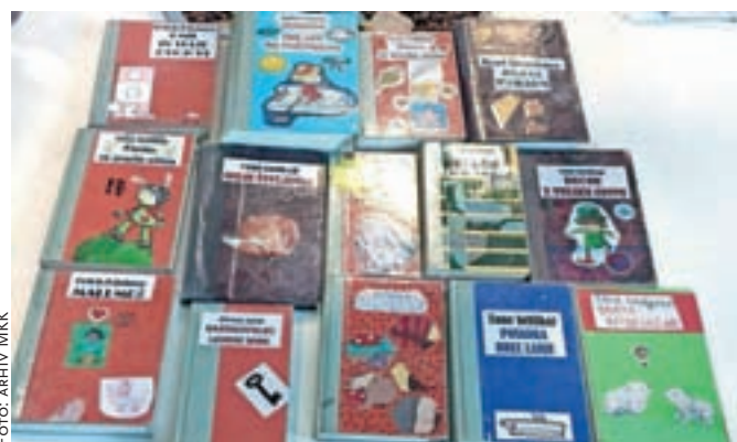
V »popravljalnici« so stare knjige spet usposobili za branje.