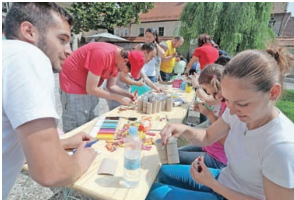
Srečanje ob ustvarjanju in gibanju