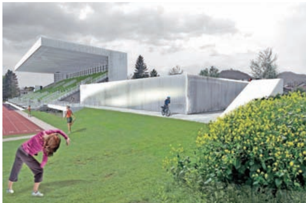
Gradnja novega Regijskega večnamenskega športno-vadbenega centra se bliža.

»Poleg tradicionalnih prireditev, kot je Kranfest, je veliko aktivnosti pripravljenih zlasti za otroke. Pripravljajo jih številna društva in klubi, poseben poletni program pa imajo otroško igrišče Gibi Gib, Medgeneracijski center, Mestna knjižnica Kranj, Otroški stolp Pungert in center Škrlovec. Tudi čez poletje bodo s privlačno ponudbo vabili torke s projektom S Krančkom v mestu in Četrčki ob vodnjaku. Ob sredah in tudi ostale dni pa vabljeni na kavo v stari Kranj. Natančen program prireditev pa si lahko ogledate na spletni strani Visit Kranj, aplikaciji iKRANJ in občinski strani na Facebooku.«