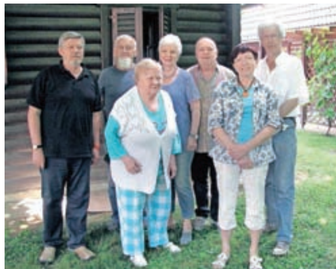
Udeleženci likovnega srečanja v Olimju