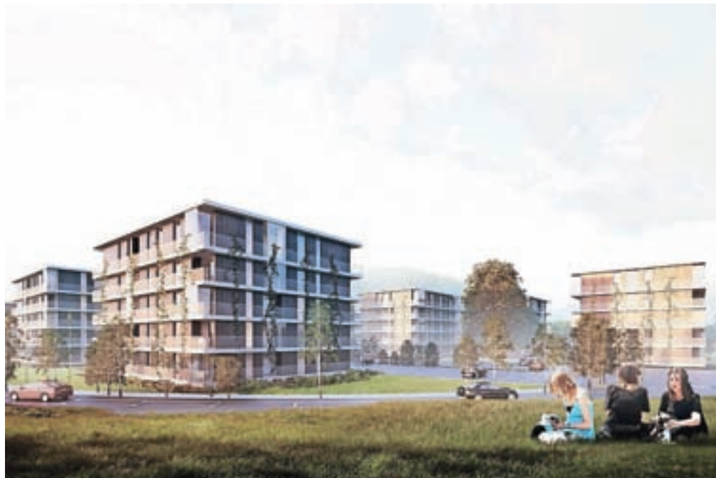
V soseski Ob Savi je načrtovanih dvesto petdeset stanovanj, od tega šestdeset oskrbovanih.