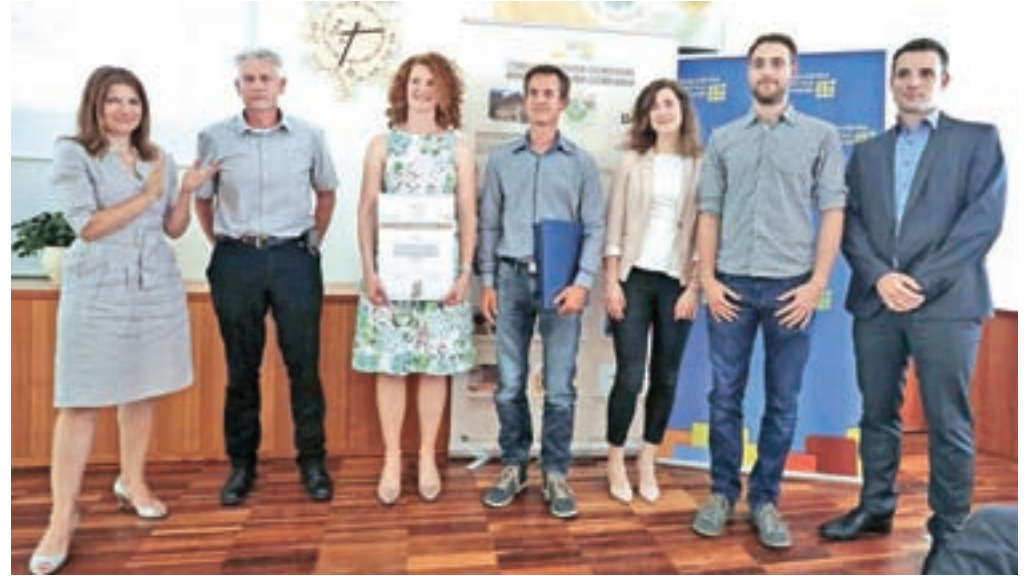
Skupina inovatorjev iz podjetja Iskraemeco je za inovacijo Pravični števec prejela zlato priznanje.