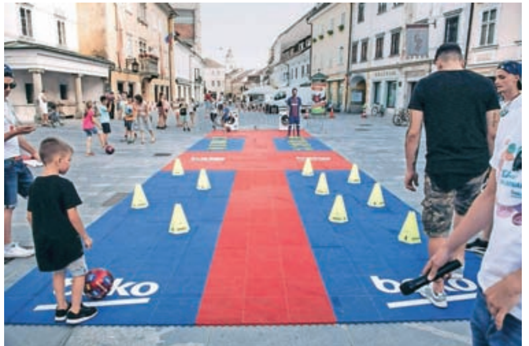
Prijetna torkova in četrtekova druženja v starem Kranju so ob lepem vremenu dobro obiskana, ob nogometnem stadionu pa prejšnji teden ni manjkala niti trampolin, zabavati pa se je moč tudi ob drugih dejavnostih in v ustvarjalnih delavnicah.