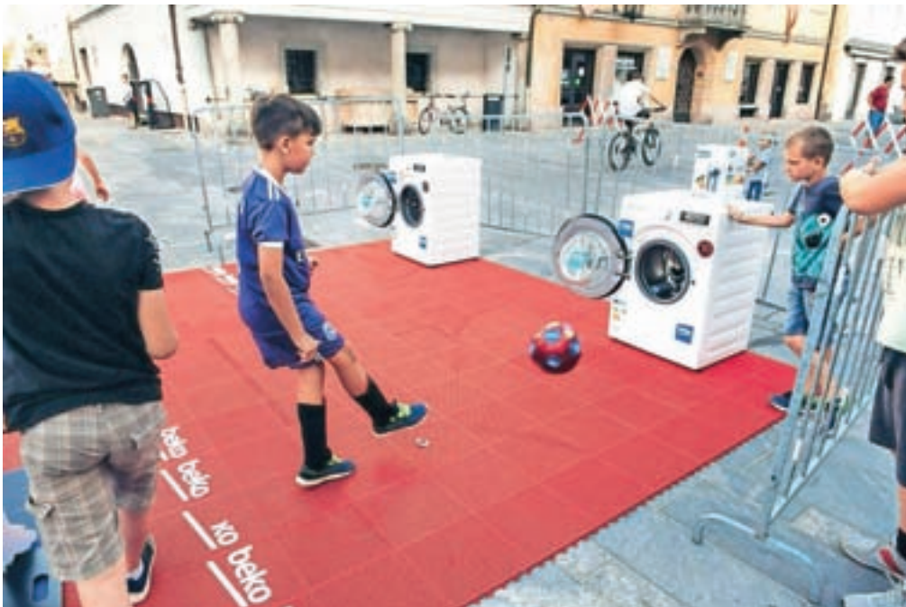
Nogometna mrzlica se je preselila tudi na kranjske ulice in trge, v okviru projekta S Krančkom v mestu pa so prejšnji tork športne navdušence povabili na tudi na nogometni poligon, kjer so lahko preizkusili svoje spretnosti.