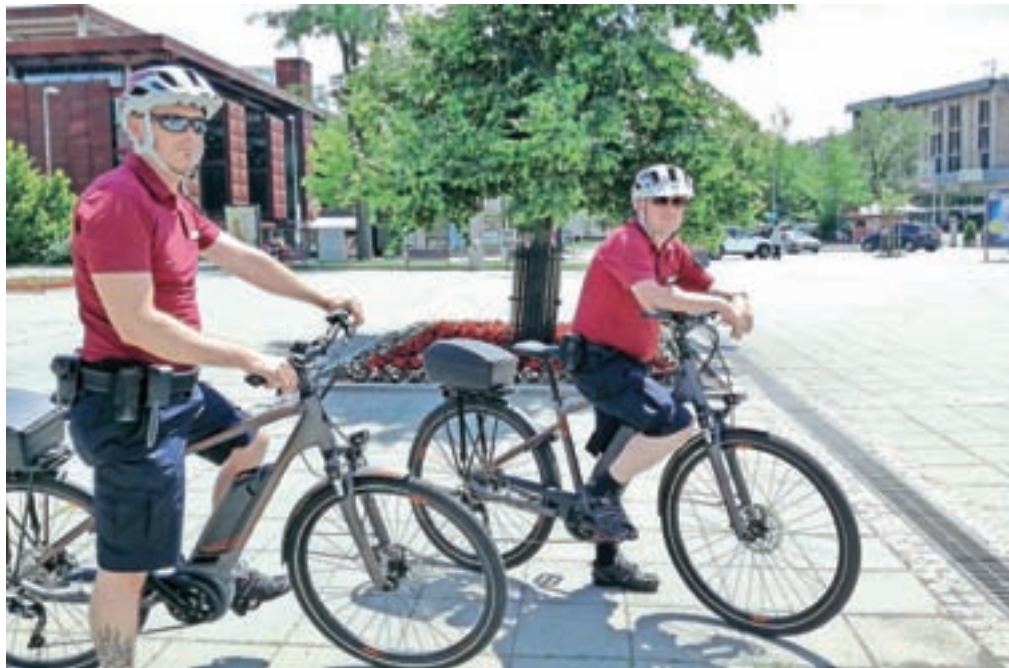
Medobčinski redarji svoje delo pogosto opravljajo na kolesih, skrbijo pa tudi za preventivne dejavnosti.

»Po navedbah Agencije RS za varnost prometa je prav kolesarski izpit prvi izpit, ki ga lahko opravi otrok. Je prvi pravi dokument, ki otroku daje določeno samostojnost, pravico, da gre sam na cesto, ter hkrati odgovornost za varno sodelovanje v prometu. Zato je za otroka na njegovi poti razvoja izredno pomemben. V MIK se na različne načine in tudi s tovrstnim sodelovanjem trudimo, da bi nas okolica, v kateri delujemo in vzdržuje-