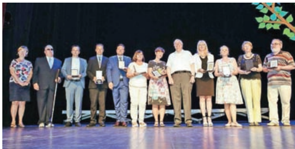
Med deseterico dobitnikov priznanj je tudi Mestna občina Kranj.