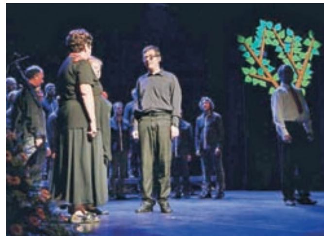
Člani društva so na odru uprizorili utrinke iz svojega življenja s slepoto in slabovidnostjo.