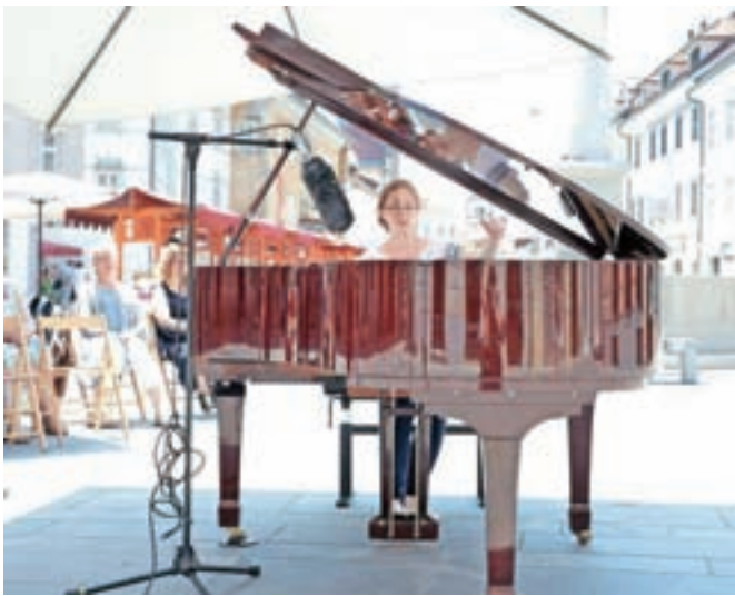
Klavirska glasba ob vodnjaku na Glavnem trgu – nevsakdanje in čudovito hkrati