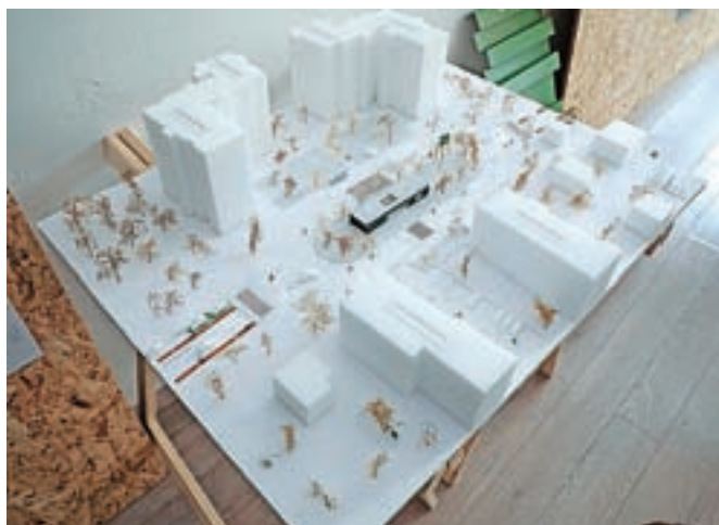
Kaj bo novega na Planini? Razvili so devet projektov na področju trajnostne mobilnosti in revitalizacije javnega prostora, s katerimi bo Mestna občina Kranj kandidirala za evropska sredstva.