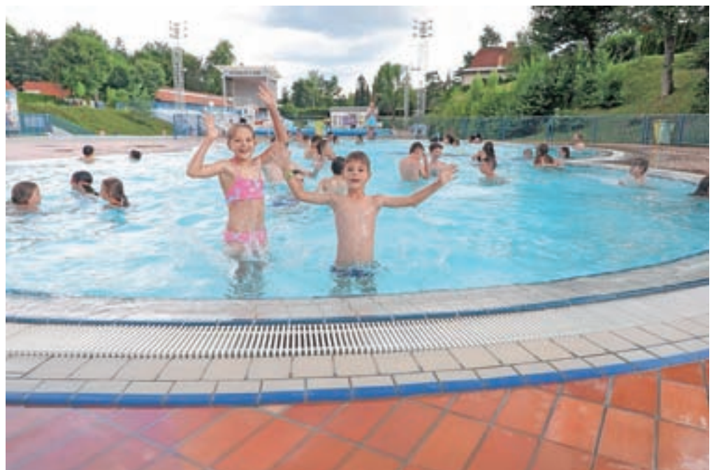
Bazen z vodo ima prijetnih 27 stopinj, veliko veselje pa mladi najdejo v otroških bazenih, kjer se je ob sončnem vremenu moč dobro ohladiti in preživeti zanimive počitniške dni s starši in vrstniki. / BESEDILO: VILMA STANOVNIK