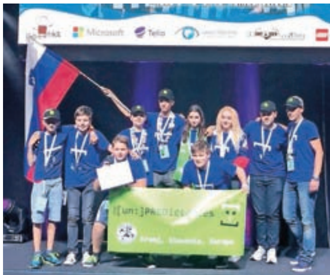
Ekipa [ne:]PREDvidljivi iz OŠ Predoslje Kranj