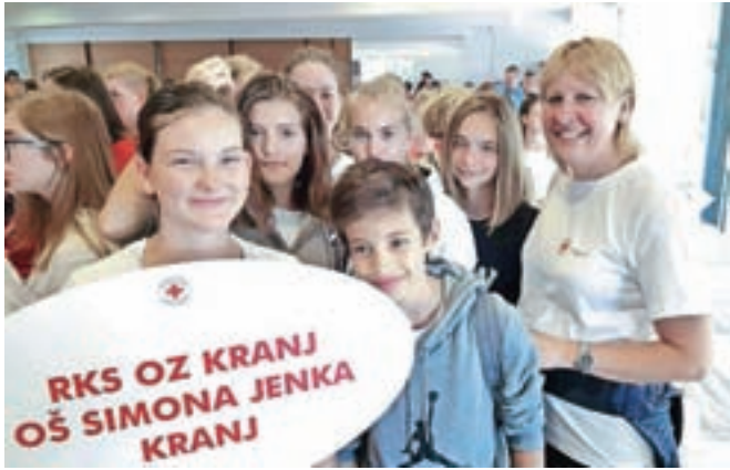
Srčni prostovoljci iz Osnovne šole Simona Jenka Kranj

Osnovna šola Simona Jenka Kranj je prejela zastavo Junaki našega časa, ki simbolizira številne aktivnosti in predanost prostovoljstvu.