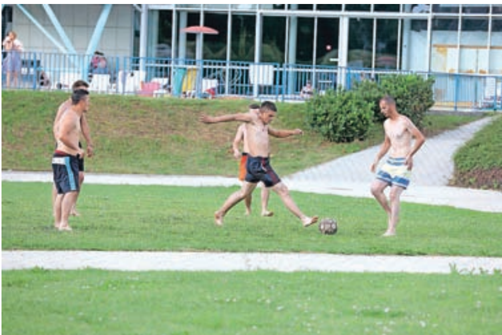
Letno kopališče v Kranju je namenjeno tako kopanju kot zabavi ob različnih vodenih animacijah. Udeležite se lahko zabavnih iger ali se igrate na velikih bazenskih igralih. Te dni pa seveda ne gre brez nogometa.