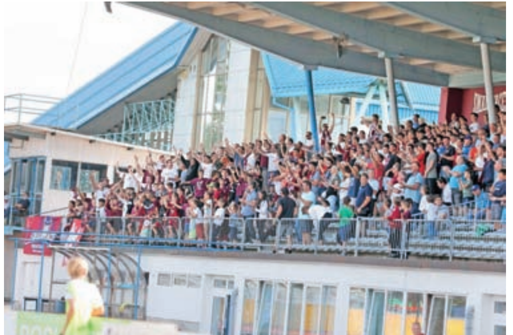
Najpomembnejše zmage v sezoni so se kranjski prvoligaši veselili skupaj s svojimi zvestimi navijači in navijačicami, ki so med tekmo napolnili tribune kranjskega stadiona ter z glasnim navijanjem podprli ekipo.