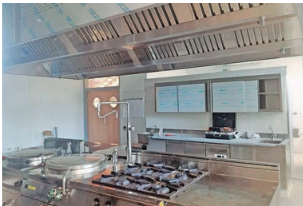
Na Osnovni šoli Jakoba Aljaža prenavljajo kuhinjo.