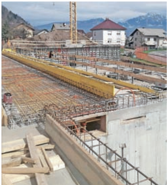
Gradnja telovadnice poteka po načrtih.

Stražišče – Gradbena dela pri izgradnji telovadnice Osnovne šole Stražišče potekajo po načrtovanem terminskem planu. Kot je že opaziti in kot poročajo tudi bližnji sosede, so na gradbišču dnevno vidne spremembe, še posebej, ker je tudi že v »naravi« opaziti zgrajen kletni del, v katerem so že zaključena vsa gradbena dela, armiranobetonska konstrukcija, izvedeni so vsi kanali za vodovod in telekomunikacije ter elektriko. V naslednji fazi pa bodo izvedena dela tudi na montažni konstrukciji v pritličju.