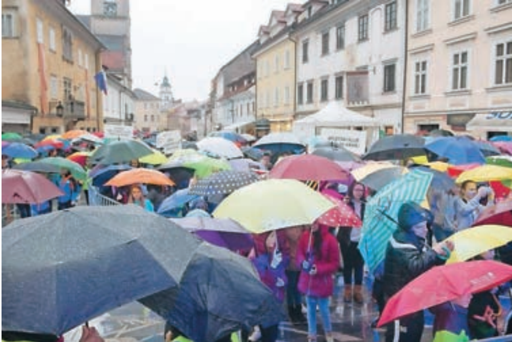
Pred Prešernovim gledališčem so se zbrali športnice, športniki, trenerji ter športni funkcionarji in se pod dežniki odpravili proti Glavnemu trgu, kjer so jih pričakali navijači.

Letošnje druženje ob sprejemu in podelitvi športnih nagrad in priznanj v središču Kranja je bilo sicer precej deževno in mokro, kljub temu pa se je zbralo tudi veliko navijačev, ki so glasno zaploskali dobitnikom športnih znakov ter velikih in malih plaket.