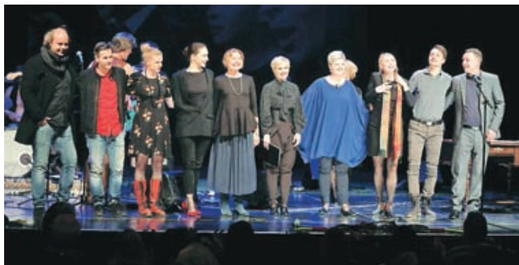
Ko oder zavzame ekipa Stenice, zmagovalne uprizoritve festivala...