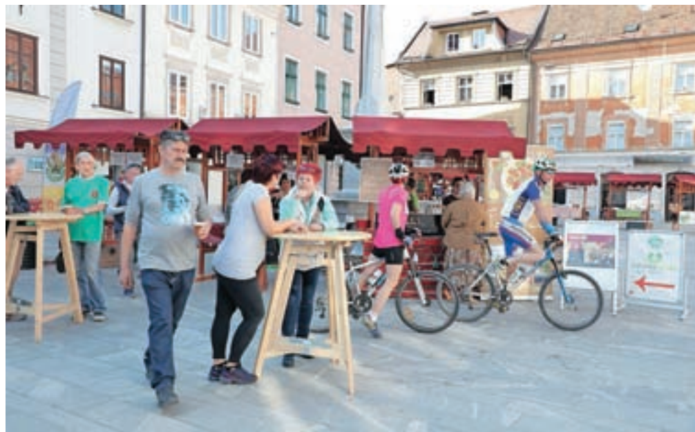
Staro mestno jedro Kranja je živahno tudi med tednom, tako domačini kot turisti pa radi izkoristijo četrtkova druženja ob vodnjaku in srečne petkove nakupe.

Obema dobro sprejetima projektoma so se pred kratkim odločili dodati tako imenovane Srede brez evra, ko ponujajo brezplačni napitek za obiskovalce v mestnih kavarnah, lokalih, barih in gostilnah. Brezplačni vrednostni kupon si namreč obiskovalci mestnega jedra