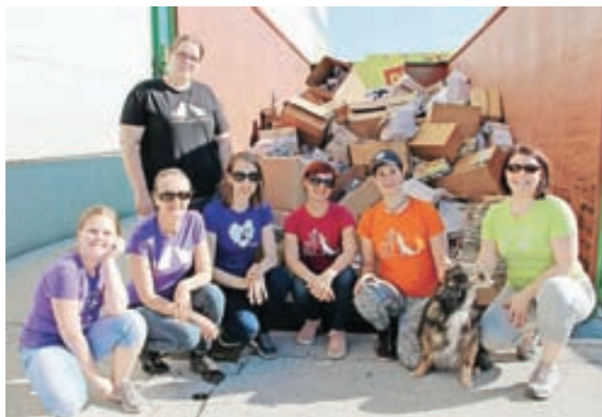
Del ekipe Društva za zaščito živali Kranj na sobotni akciji zbiranja starega papirja

magajo pri oddaji mačk in psov v nove odgovorne domove. Lani so nov dom pomagali poiskati 163 mačkam, v osmih letih svojega delovanja kar 996 mačkam in 68 psom. Trenutno imajo pod svojim okriljem v oskrbi nekaj jesenskih mladičev, bliža pa se tudi sezona spomladanskih (tudi sesnih) mladičev, zato jim bodo sredstva, zbrana z akcijo, prišla zelo prav. V soboto so predstavili tudi pomladno-poletne majice DZZŽ Kranj, zbirali plastične zamaške za Zavod Naš kuža ... Naslednja akcija zbiranja starega papirja bo oktobra, ta bo že 15. po vrsti.