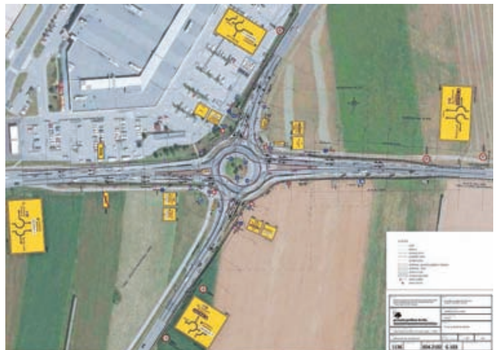
Krožišče Primskovo bo sodobno in za promet bolj pretočno.

"Vreme je res primerno in že prvega maja bo osrednja tradicionalna praznična prireditev na Sv. Joštu nad Kranjem. Začela se bo ob 10.30. Organizatorji pripravljajo pester kulturni program, za razvedrilo in dobro razpoloženje pa bo letos skrbel Rok 'n' band. Prav tako lepo vabljeni 26. maja na Brdo pri Kranju, kjer skupaj s Fundacijo Vincenca Drakslerja pripravljamo že 18. Županov tek, ki je humanitarna, športna, kulturna in družabna prireditev. Med 11. in 20. majem bo petič potekal Teden ljubiteljske kulture in tudi kranjske organizacije bodo ponudile zanimiv program. Letošnja posebnost je, da v Kranju 10. maja gostimo nacionalno uvodno slovesnost, ki jo bodo naznanili nastopi folklornih skupin pri vodnjaku v starem Kranju, osrednji program pa bo v Prešernovem gledališču. Zagotovo bo zanimivo tudi na Tednu mladih, ki bo potekal med 11. in 19. majem na različnih lokacijah v Kranju."