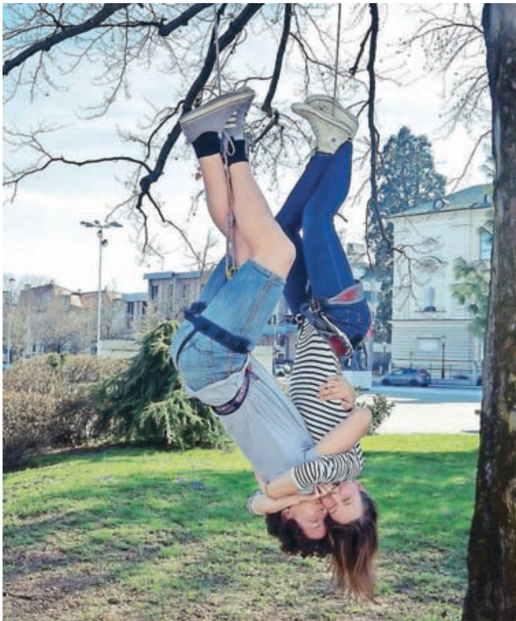
Hengalnica za Teden mladih 2018 na Slovenskem trgu

Ko nekomu rečemo, da je Adi Smolar v Klubarju, je vedno odgovor: "Seveda gre-