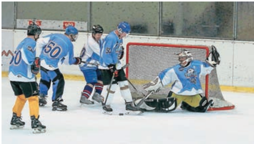
Praznovanje jubileja so začeli s tekmo nekdanjih triglavanov, vsi pa so nosili dres s številko 50.