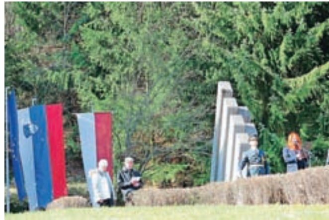
Slovesnost pri spomeniku padlim na Planici

V spomin na leta 1942 padle partizane so na Planici pripravili spominsko slovesnost. Prireditev je bila tudi pri spomeniku Staneta Žagarja v kranjski vojašnici.