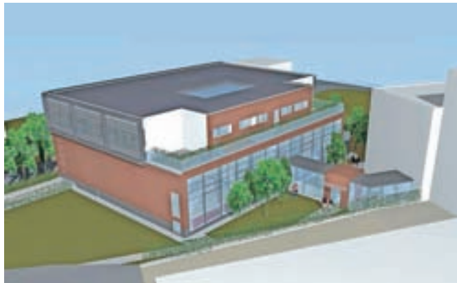
Nova telovadnica ob Osnovni šoli Staneta Žagarja

"Lahko rečem, da z državo odlično sodelujemo in to prinaša rezultate, ki bodo vidni že v kratkem. Tako je za letos poleti, ko je prometa najmanj, predvidena tudi preureditev obstoječega krožišča na Primskovem v krožno križišče s spiralnim potekom. To bo tako imenovano turbo dvokrakno krožno križišče, ki bo zgrajeno po vzoru velikih evropskih mest. Projektantska ocena investicije je 1,2 milijona evrov. Rekonstrukcija bo potekala ob prometu, brez popolnih zapor in naj bi bila zaključena v nekaj mesecih. Narejen je že tudi idejni projekt razširitve cestišča s Primskovega proti Šenčurju v štiripasovnico, ob njej pa bo kolesarska steza. Gradnja je predvidena za naslednje leto."