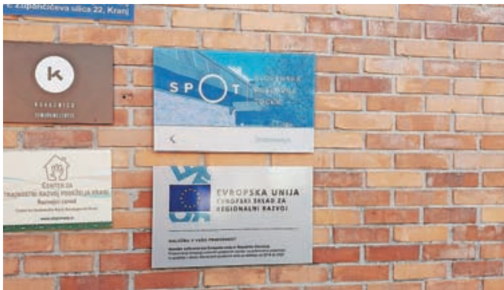
Točka SPOT Svetovanje v Kovačnici v Kranju

Krovno vlogo v sistemu SPOT bo pod imenom SPOT Global na četrtem nivoju prevzela javna agencija SPIRIT Slovenija, ki bo v pomoč večjim domačim in tujim investitorjem. Brezplačno svetovanje lahko potencialni in obstoječi podjetniki dobijo na točki SPOT Svetovanje v Kovačnici (Župančičeva ulica 22, prvo nadstropje) vsak delovnik od 9. do 15. ure, ob sredah do 18. ure. Zelo zaželeno je, da se na svetovanje naročite. Kontakti: Nastija Podobnik, nastija.podobnik@bsc-kranj.si , 04 77 77 252, in Sanja Šendula, sanja.sendula@bsc-kranj.si , 04 77 77 251.