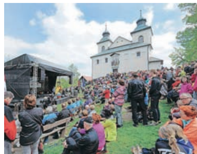
Tudi letos bo osrednja prvomajska prireditev na Svetem Joštu nad Kranjem.

razpoloženje obiskovalcev ob glasbi Rok'n'benda ter gostinsko ponudbo. Člani Sveta gorenjskih sindikatov lahko pri svojem sindikatu dobijo ugodne bone za hrano in pijačo. "Pridružite se nam na Joštu nad Kranjem in praznujte z nami," vabijo iz Sveta Gorenjskih sindikatov, Mestne občine Kranj in Zavoda za turizem in kulturo Kranj ter želijo vsem prijetno prvomajsko praznovanje.