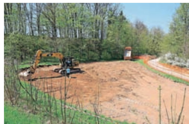
Gradnja v Britofu se je ta mesec začela.

Britof – V začetku meseca aprila so se začela dela za ureditev asfaltnega poligona, t. i. pumpracka, v športnem parku Britof. Zaključek izvedbe poligona je predviden sredi junija. Gradnja bo izvedena v eni fazi. Gre za prvi asfaltni pumprack v Kranju in okolici. Poligon bo primeren za različne starosti uporabnikov z vsemi vrstami koles, roln in skirojev. Vrednost investicije je 48.000 evrov.