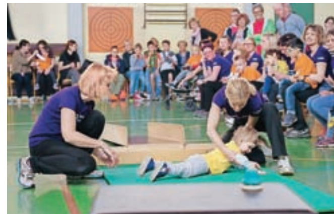
Vaja "palačinka", kot jo zabavno imenujejo.

z željo, da se tudi predšolskim otrokom s posebnimi potrebami zagotovi primerne oblike motoričnih aktivnosti, ki bodo ugodno vplivale na njihov razvoj. Poudarek je na učenju različnih motoričnih veščin z ustreznimi prilagoditvami ali enostavno uživanje pri izvajanju teh s pomočjo odraslega," je pojasnila Nada Jarič in dodala, da tudi na ta način želijo otroke motivirati za gibanje, da spoznavajo svoje telo ... Otroci spoznavajo različne športne pripo-