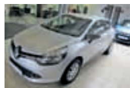
Clio Expression Tce 90 Stop & Start