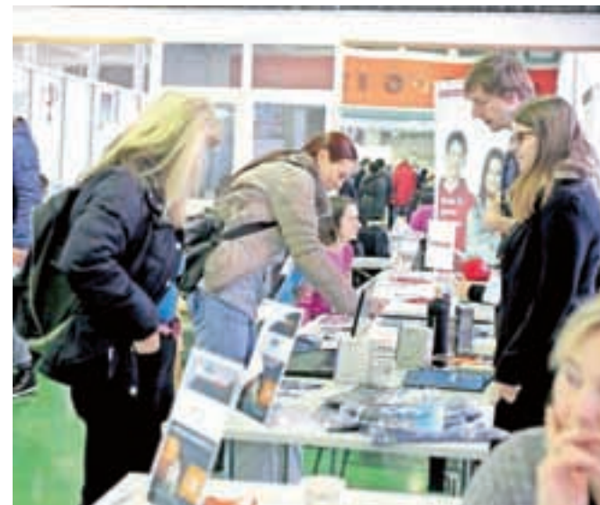
Zaposlitveni portal MojeDelo.com je v Kranju prvič pripravil karierni sejm.

odzivom tako delodajalcev kot delojemalcev so bili za prvič zadovoljni, v prihodnje pa se nameravajo bolj povezati z lokalno skupnostjo in privabiti tudi večja podjetja. Podobne sejme v Ljubljani pripravljajo že več kot desetletje in po njihovih izkušnjah je to zelo dobra priložnost tako za delodajalce kot delojemalce, da navežejo prvi stik. »Ugotavljamo, da tudi iskalci zaposlitve ne sejme prihajajo vedno bolj pripravljeni.« Za tiste, ki še bolj negotovo vstopajo na trg dela, pa pripravijo tudi različne delavnice, predavanja in osebna svetovanja, s katerimi jim pomagajo osvojiti večščinne, ki so pomembne pri razvoju kariere. Opravili so lahko tudi psihomotorično testiranje, na podlagi česar so jim pomagali spoznati njihova šibka in močna področja. Gorenjska regija, ugotavljajo pri MojeDelo.com, ponuja številne možnosti za zaposlitev ter rast in razvoj posameznikove kariere.