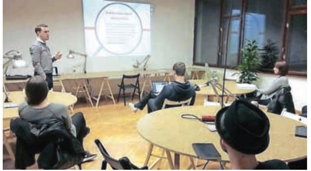
Kovačnica ponuja okolje, v katerem lahko mladi razvijajo svoje podjetniške ideje.