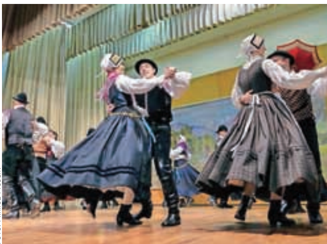
Teden kulture so sklenili nastopi folklornih skupin.

povezuje,« so dejali organizatorji, ki so v Šmartinskem domu pripravili resnično pester program: koncert Mešanega pevskega zbora Svoboda, slikarsko razstavo Božidarja Zebca iz Zgornjih Bitenj, večer mladih učencev glasbene šole, gledališki večer s komedijo Moj Vinko v izvedbi dramske skupine KUD Ivan Cankar iz Šmartna v Tuhinju, koncert Pri-farskih muzikantov, koncert skupine Mali oglasi s plesalkami skupine Cowboy ritem, Miklavžev večer s predstavami in darili za otroke ter veličasten folklorni večer, ki je sklenil celotensko kulturno dogajanje v Stražišču.