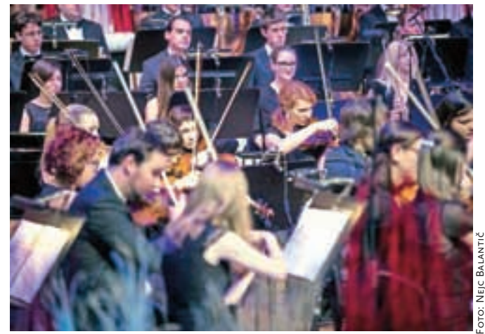
Vedno zanesljivi Veliki simfonični orkester Gimnazije Kranj se je tokrat še posebej izkazal s Smetanovo Vltavo.