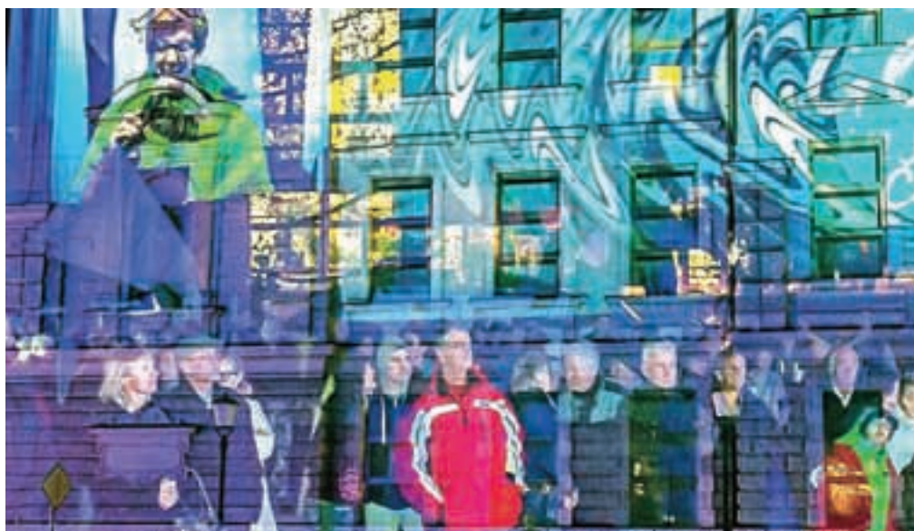
Z zaključnega dogodka na Slovenskem trgu s projekcijo poteka projektov na pročelje stavbe Gimnazije Kranj

Kranj – Ob zaključku leta se velja spomniti pomembnejših dogodkov, med katere lahko zagotovo uvrstimo tudi uspešno in pravočasno zaključen infrastrukturni projekt gradnje komunalne infrastrukture GORKI in zaključek projekta Oskrba s pitno vodo. Prvi prinaša preko 50 kilometrov nove in nadgrajene komunalne infrastrukture z nadgradnjo in rekonstrukcijo Centralne čistilne naprave Kranj, ki zdaj po velikosti in tehnologiji ustreza današnjim in prihodnjim potrebam ter standardom. Drugi projekt pa predstavlja 10 kilometrov dolg vodovod na trasi Bašelj-Kranj, ki zagotavlja večjo zanesljivost in varnost oskrbe s pitno vodo, hkrati pa je omogočil učinkovitejšo upravljanje vodovodnih sistemov. Skupna vrednost obeh investicij je znašala 70 milijonov evrov, pri čemer so občine prispevale slabo tretjino sredstev, ostalo pa so bila evropska in državna sredstva sofinanciranja. Dodana vrednost je še v plinski, električni in optični napeljavi,