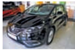
Espace ZEN dCi 130 Energy Start & Stop