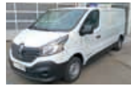
Trafic Furgon L2H1P2 dCi 115