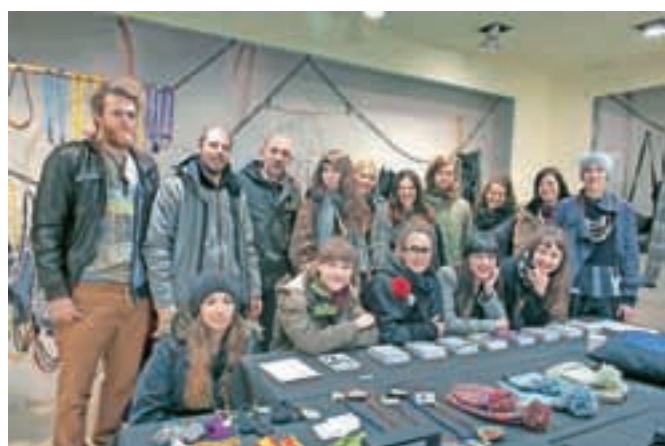
Ustvarjalci na drugem Pop-Up Shopu