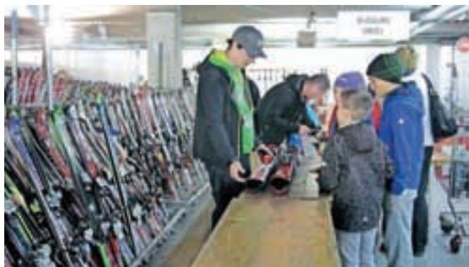
Na sejmu je delalo 130 članov ZUTS Kranj.

»Lastnike je zamenjalo kar 1460 smučin in desk, 480 tekaških smučin, 690 čelad in smučarskih oblačil, 370 drsalk in 950 smučarskih čevljev. »Neprodano opremo smo po pogojih komisije prodaje namenili humanitarnim organizacijam in osnovnim šolam za lažjo organizacijo šol v naravi,« je še dodal Miklavčič.