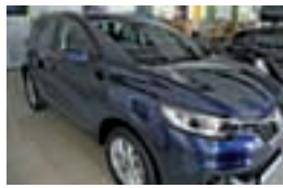
Kadjar Xmod dCi 110 Energy