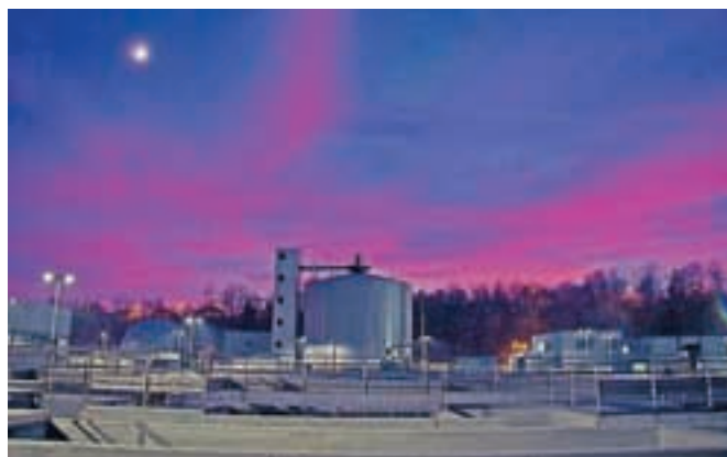
Nadgrajena Centralna čistilna naprava Kranj poskusno obratuje od sredine oktobra 2015.