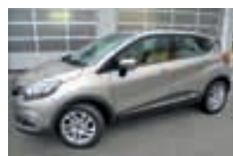
Captur Expression dCi 90 Stop & Start