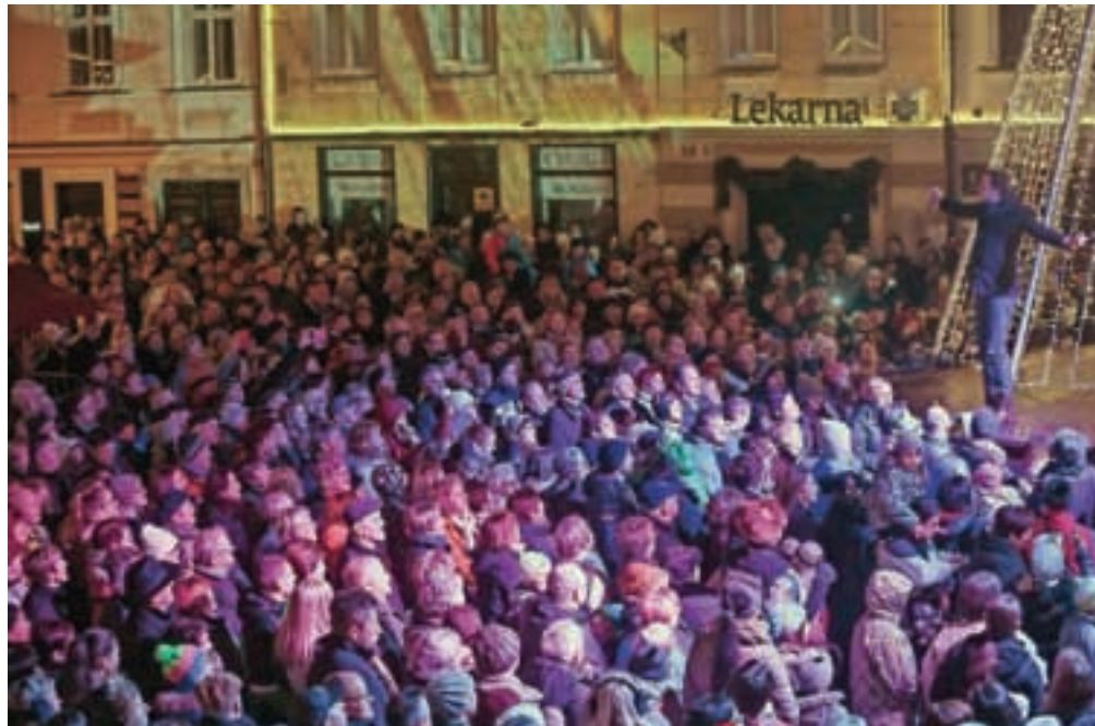
Na ponedeljkovem županovem božičnem koncertu so Modrijani v stari Kranj privabili toliko navdušenih poslušalcev, da so središče mesta napolnili do zadnjega kotička.

Kranj – Letošnji prešerni december se je v Kranju začel ob občinskem prazniku, ko so 3. decembra zasijale tudi luči in se je zasvetilo božično drevo. Ob množici navdušenih obiskovalcev so se istočasno začeli koncerti na prostem ter različne prireditve tako v središču mesta kot v kulturnih ustanovah in lokalih. Na svoj račun so že prišli tudi najmlajši obiskovalci, ki jih je ob številnih prireditvah kot prvi od decembrskih dobrih mož pozdravil Miklavž, v torek, 29. decembra, ob 17. uri pa jih bo na Glavnem trgu obiskal še Dedek Mraz. Pred Prešernovim gledališčem se otroci lahko zabavajo in se kaj koristnega naučijo v otroškem mestu, od te sobote naprej pa bo tam prav posebno Veselja mesto, ko bodo od 14. do 17. ure potekale otroške ustvarjalne ure. Zabave ne manjka niti za odrasle. Kljub temu da je za nami že veliko prireditev, med njimi tudi ponedeljkov županov božični koncert z Modrijani, pa vrhunec prihaja konec tega in naslednji teden. Tako bomo v nedeljo ob 19. uri na Glavnem trgu lahko prisluhnili Andreju Šifrer-