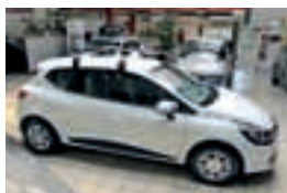
Clio Expression Tce 90 Stop & Start

Barva: kovinska oranžna s črno streho, paket LIMITED (usnjen volan in prestavna ročica, črna ALU platišča 16", naslon za roke, prostoročna kartica)