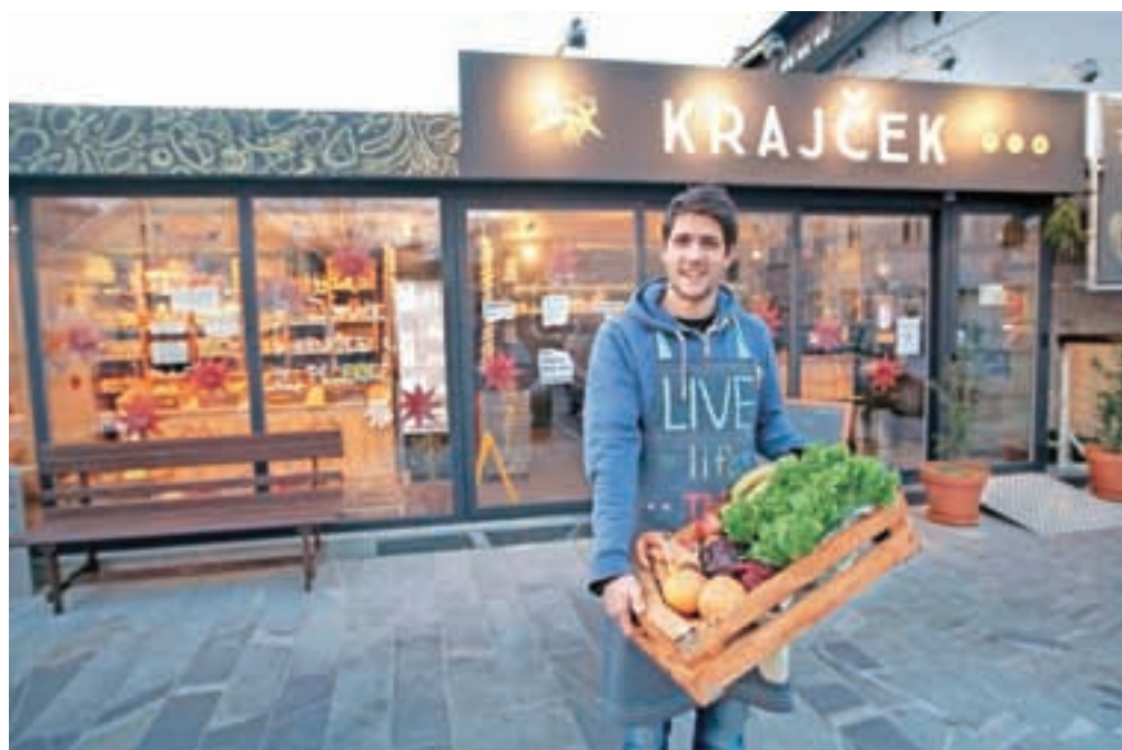
Stari Kranj je od oktobra bogatejši za trgovino z zdravo prehrano, kar so mnogi do sedaj pogrešali.

»V letu 2016 imamo namen, da izpeljemo vsaj deset dogodkov, ki jih želimo še popestriti in nadgraditi,« dodaja Kavčičeva in že sedaj vabi, da se jim pridružite.