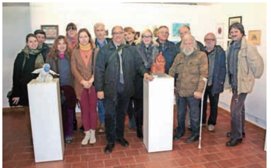
Večina avtorjev se je sredi decembra udeležila tudi odprtja razstave.