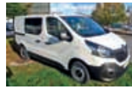
Trafic podaljšana kabina 112 Energy dCi 120 Twin Turbo