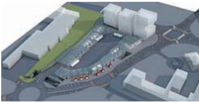
Pogled na območje avtobusnega terminala

kar in kmetijskega gospodarstva Krt in dopolnjen osnutek Odloka o občinskem podrobnem prostorskem načrtu za preselitev kmetijskega gospodarstva Knez in kmetijskega gospodarstva Nastran ter Okoljsko poročilo za potrebe celovite presoje vplivov na okolje za OPPN za gradnjo kmetijskih objektov Knez v Mestni občini Kranj. Pripombe in predlogi na javno razgrnjene dokumente se zbirajo do zaključka javne razgrnitve, to je do vključno 8. januarja 2016.