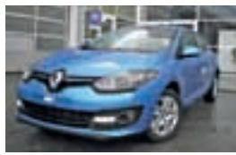
Megane Expression dCi 95