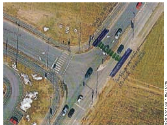
Skica ureditve prehoda za pešce

na levi strani v celoti in deloma na desni strani ceste, kakor tudi urejena ustrezna osvetlitev. Mestna občina Kranj je na Direkcijo Republike Slovenije za ceste že naslovila predlog ureditve, ki so ga na direkciji podprli in potrdili. Kmalu bo Kranj bogatejši za nov sodoben prehod za pešce, prebivalci pa bolj varni pri prečkanju.