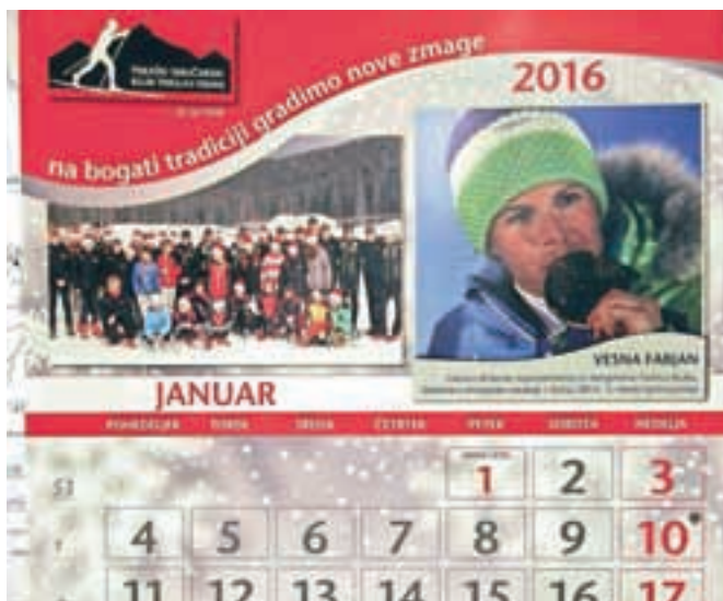
Koledar TSK Triglav za leto 2016: vsak mesec ima svoje junake in zanimivosti iz zgodovine.