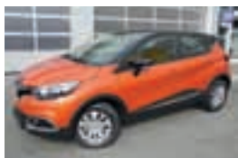
Captur Expression dCi 90 Stop & Start

Pokličite nas ZDAJ , rezervirajte svoje vozilo pravočasno, da vam ga ne odpeljejo pred nosom!