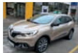
Kadjar Xmod dCi 110 Energy

Barva: kovinska siva, paket LIMITED (usnjen volan in prestavna ročica, črna ALU platišča 16", naslon za roke, prostoročna kartica)