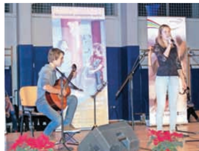
Prireditev Prešerno in dobrodelno je bila tudi letos priložnost, da dijaki pokažejo svoje talente.