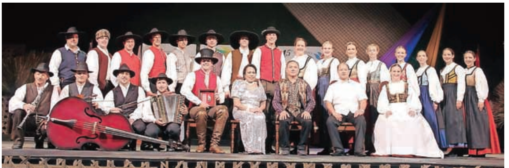
Foto utrinek z letošnjega gostovanja na Filipinih

letu 2016 se bomo udeleževali nastopov v okviru občinskih in krajevnih dogodkov, srečanj odraslih folklornih skupin ter srečanj ljudskih pevcev in godcev. V poletnem času planiramo zopet turnejo, kam, pa naj za zdaj ostane še skrivnost.« Ljubitelje ljudskega plesa, petja in glasbe pa že sedaj vabijo na zanimiv spomladanski letni koncert, ki bo v začetku aprila.