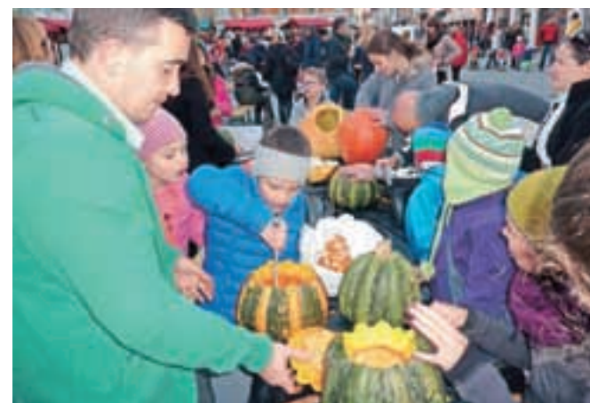
Na zadnjo oktobrsko soboto so na svoj račun prišli tudi otroci in starši, ki so prišli v delavnico izrezovanja buč.