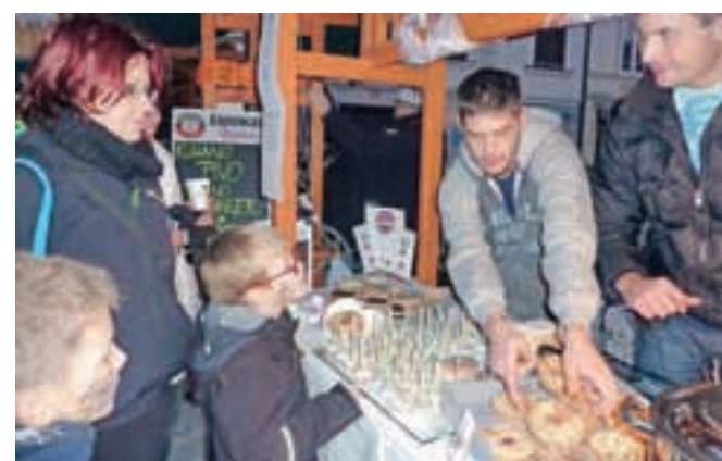
V Pravljicni hiši so poskrbeli, da so se obiskovalci Kr čarovniške kuhne tudi posladkali.