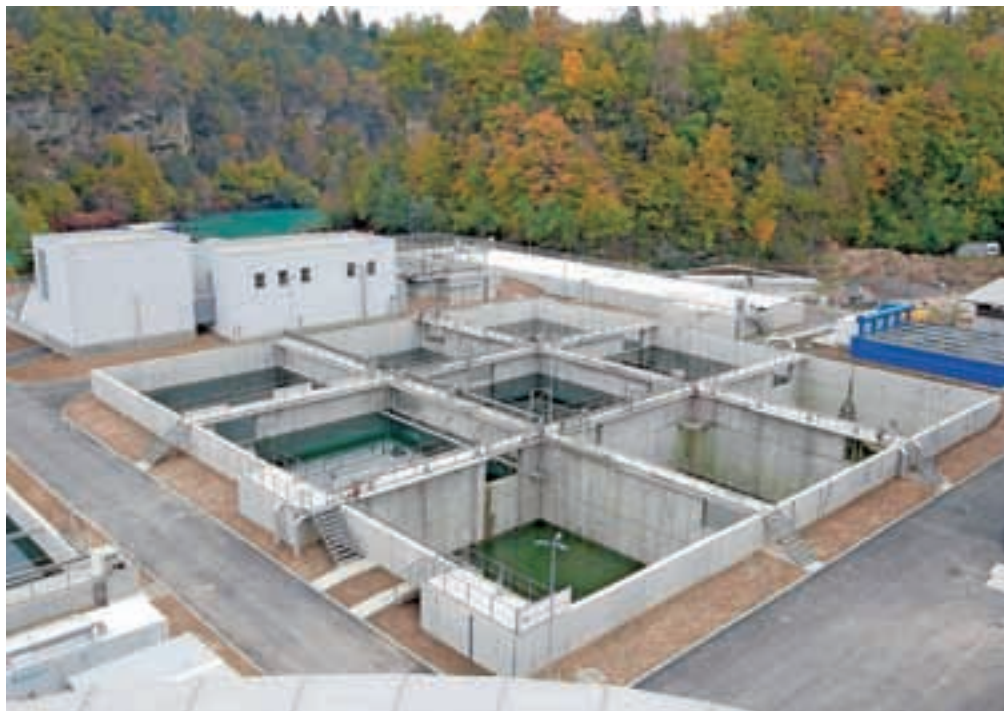
Največ skrbi je v zadnjem letu povzročala centralna čistilna naprava, ki pa sedaj že poskusno obratuje in bo dokončana v pogodbenem roku.

Drugi je tako imenovani projekt GORKI, znotraj katerega je bilo v občini zgrajenih slabih 35 kilometrov novega kanalizacijskega sistema v treh aglomeracijah, in sicer Kranj, Bitnje–Žabnica in Korkica. Dela na terenu so se na vseh treh območjih že zaključila. Tudi priklopi gospodinjstev na novo javno kanalizacijsko omrežje so večina opravljeni. Zaključuje se tudi nadgradnja in rekonstrukcija Centralne čistilne naprave Kranj. Dela na Centralni čistilni napravi Kranj bodo zaključena v pogodbenem