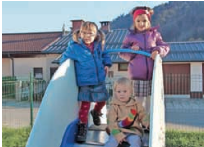
Torkovo sončno popoldne je bilo kot nalašč za otroško razposajenost na igrišču pri vrtcu.