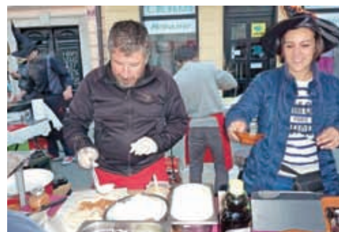
Ob stojnicah s čarovniško ponudbo je lepo dišalo, pa tudi smeja in zabave ni manjkalo.