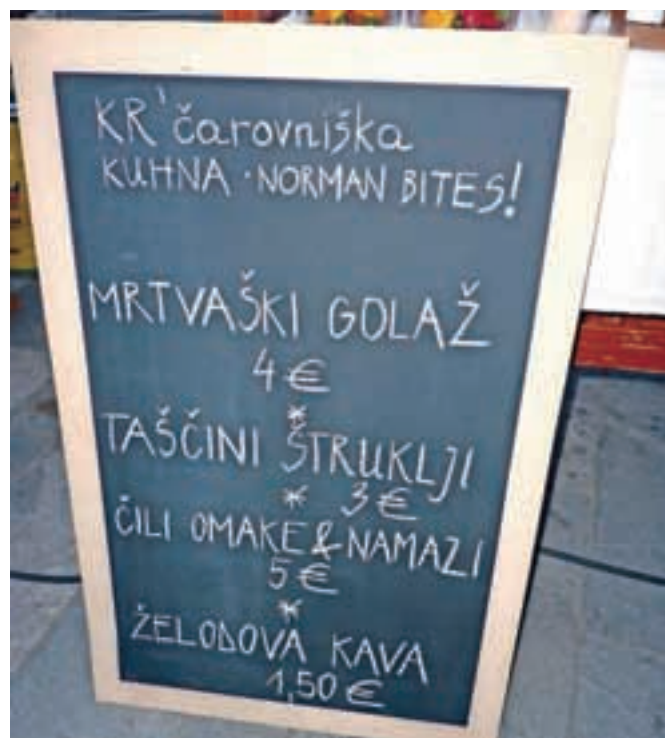
Ponudba hrane na Kr čarovniški kuhni je bila seveda nekaj posebnega.