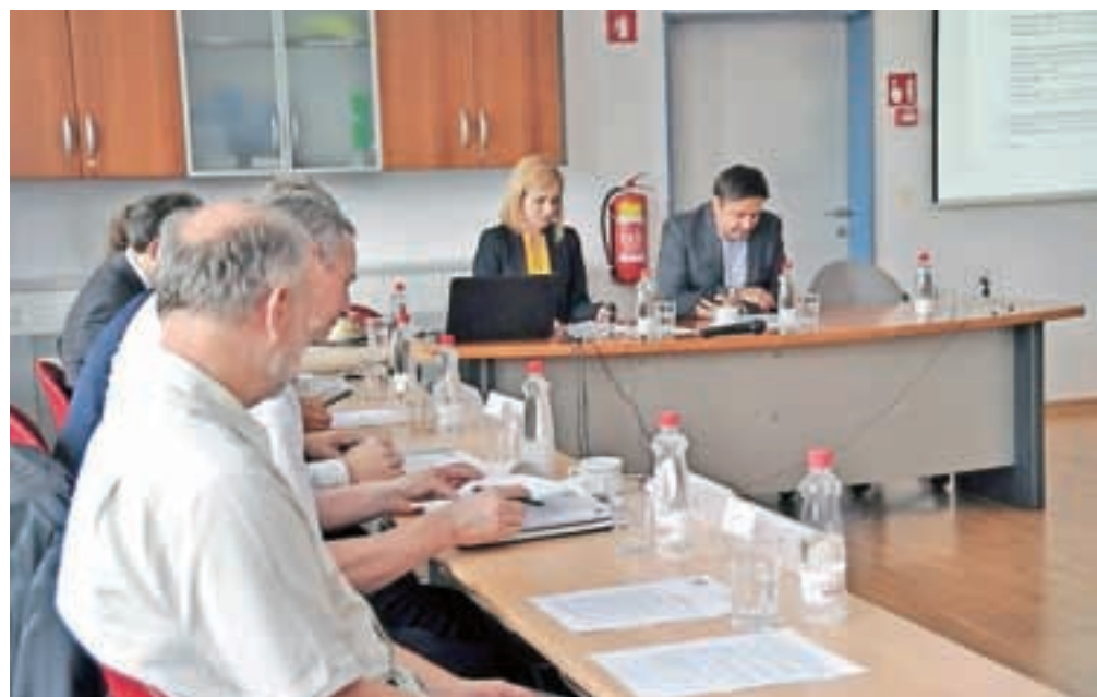
Ustanovna seja Sveta gorenjske regije