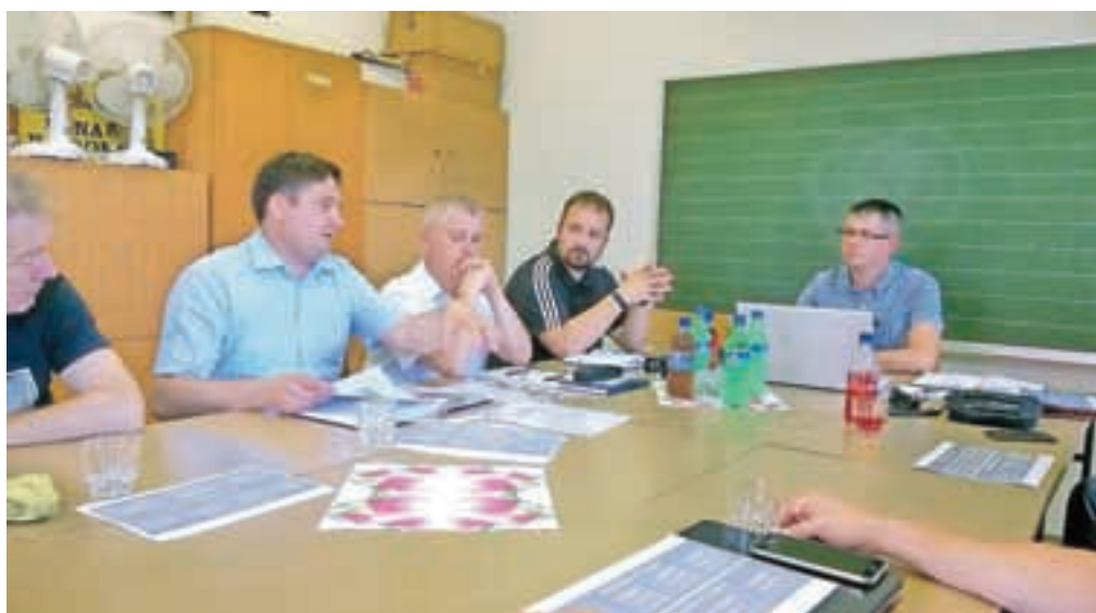
V krajevni skupnosti Stražišče

Pomembno je tudi sodelovanje in podpora predstavitev v OpenLabu, saj je treba po besedah župana Boštjana