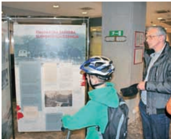
Tematika prve svetovne vojne in soške fronte zanima tudi mlade obiskovalce knjižnice.

ti končali. Razstava govori o vojni in njenih posledicah za prebivalstvo tako na vojnih območjih, še posebno pa v zaledju fronte. Ta je na različnih področjih bivanja globoko zarezala v življenje vsakdanjih ljudi tako v neposredni soseščini kot v zaledju. Pravzaprav nam je nadaljevanje lanskoletne razstave o začetku 1. svetovne vojne narekovalo kar naše arhivsko gradivo. Pri izboru materiala za razstavo smo pregledali kar dvajset različnih arhivskih fondov, šest od tega jih imamo v Kranju. Gre za več metrov gradiva od dokumentov uradnih organov do podatkov iz fondov društev, različnih organizacij, zasebnikov,“ je povedala Kosova in potrdila, da so se odločali za teme o vojni, ki so bile ljudem dolej manj znane. Tako ob podatkih o soški fronti spoznavamo tudi zanimive zgodbe iz zaledja o gradnji vojaških železnic, cest in tovornih žičnic, o gospodarstvu in industriji v službi države, beguncih in ujetnikih, zdravstveni oskrbi in