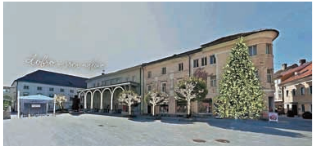
Skica idejne zasnove okrasitve prostora pred Prešernovim gledališčem Kranj

Kar je povsem novo, Prešernovi verzi nas bodo spremljali tudi v prazničnem decembru. Izbira verzov je takšna, da namiguje na novoletni čas: Kozarce zase