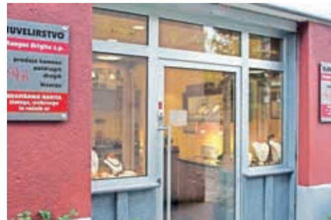
Najlepša je izložba Zlatarstva Rangus.

»To je lepo priznanje in pomeni, da se je v Kranju zadnja leta res veliko naredilo. Tega smo veseli tudi zato, ker Turistično društvo Kranj v letošnjem letu praznuje 140-letnico obstoja. Ustanovili so ga tedanji občinski svetniki, mi pa moramo še naprej skrbeti,