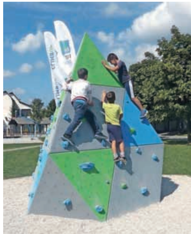
Plezalna piramida za otroke v novem fitnessu na prostem na Planini

Župan je s sodelavci obiskal 26 krajevnih skupnosti. Namen srečanj je bil, da se predstavijo glavne zadeve, ki so v ospredju aktivnosti po krajevnih skupnostih, povedo želje in načrti, pa tudi pojasnijo bolj zahtevne zadeve in pogledajo možne rešitve. Predstavljen je bil rebalans proračuna 2015 in rezultati dela fokusnih skupin, ki so osnova tako za načrtovanje proračunov v prihodnjih letih kot tudi razvojne strategije. Enotni pristop je, da se delovanje krajevnih skupnosti in še zlasti