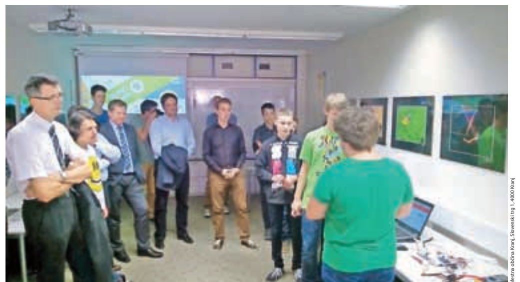
OpenWeek v OpenLabu