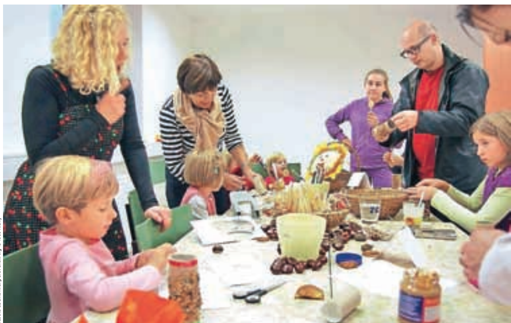
Dan odprtih vrat v medgeneracijskem centru v začetku oktobra