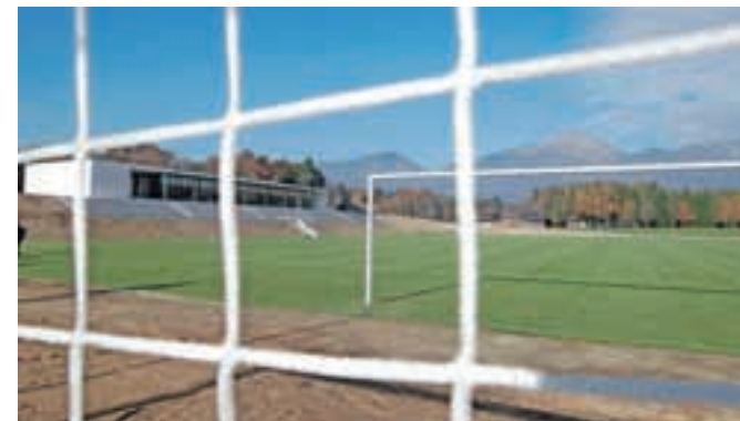
Na Brdu je nov nogometni center.