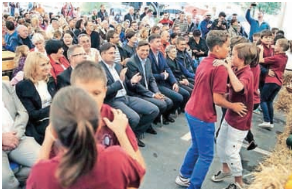
Na prireditvi Struževo jutri so gostili tudi predsednika Boruta Pahorja.

»Prizadevanja bomo usmerili v projekt športnega igrišča, sicer pa velja še naprej, optimistično in pogumno. Slaba volja in pesimizem naj gresta ven iz vasi, ker smo zmagovalci in bomo medse vedno vabili zmagovalce. Zavedati se moramo, da smo »Struževo jutri« mi, krajanke in krajanji.«