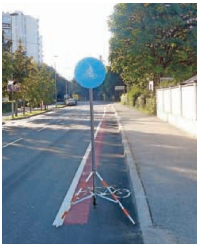
Kolesarska pot na Cesti 1. maja

prepoznal pomen povezovanja, zlasti pri pridobivanju evropskih sredstev, in kot regija za sofinanciranje predlagal naslednje projekte: trajnostna mobilnost in mreža kolesarskih poti, razvoj športnega in klimatsko-zdraviliškega turizma, povečanje lokalne prehranske samooskrbe Gorenjske, dodajanje vrednosti regionalnim lesnim izdelkom ter njihova uporaba na Gorenjskem, sanacija degradiranih območij na Gorenjskem, gradnja vodooskrbnega sistema Kravec (oskrba s pitno vodo na območju Zg. Save – 1. sklop).