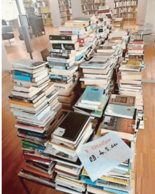
Vrnjeno gradivo mora v sedemdnevno karanteno.