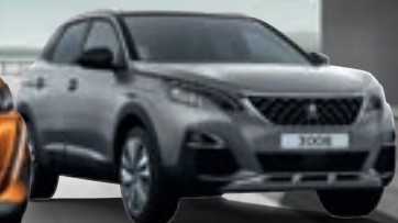
SUV PEUGEOT 3008