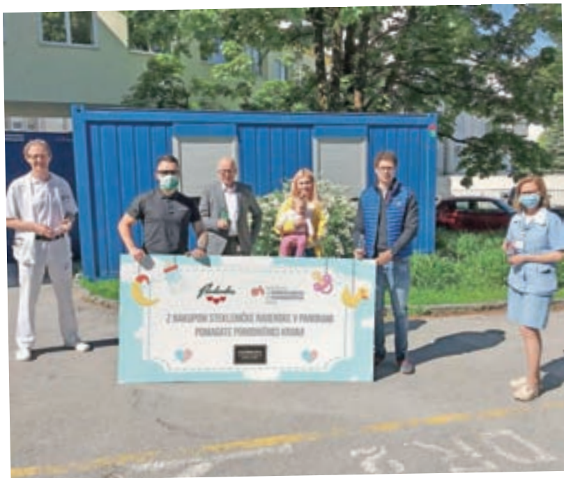
Panorama Stara pošta se počasi vrača nazaj v življenje. Ravno sredi aprila so načrtovali v preteklosti dobro sprejeti Dobrodelni dan, a so ga morali zaradi nastale situacije, ki jo je povzročil covid-19, prestaviti na oktober. So pa nedavno vseeno začeli akcijo, ki jo pripravljajo skupaj z Radensko: poimenovali so jo Srce za porodnišnico. Namreč z vsako prodano stekleničko Radenske donirajo del sredstev Porodnišnici Kranj za nakup medicinskih aparatov. Akcija bo potekala več mesecev. A. B.