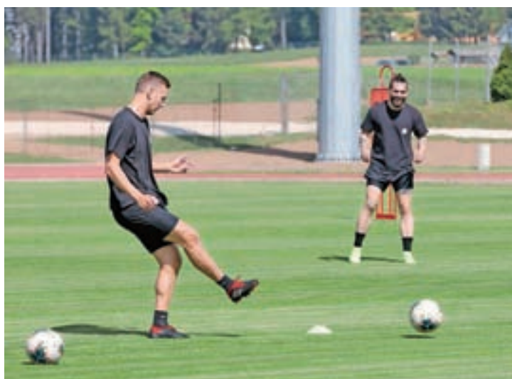
Nogometiški Triglav so prejšnji petek znova začeli skupaj trenirati.

Prejšnji teden je nato izvršni odbor Nogometne zveze Slovenije sprejel odločitev, da se do konca izpelje sezona v Prvi ligi Telekom Slovenije in Pokalu Slovenije, če bodo razmere v državi to dopuščale. Obenem so sprejeli sklep, da se zaključi tekmovanje v 2. SNL in 1. SŽNL.