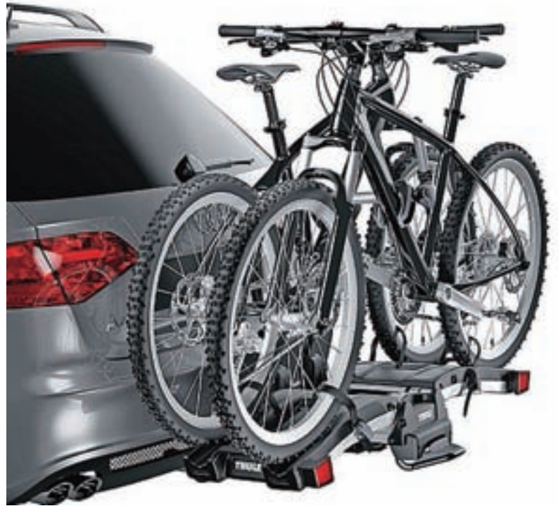
Vlečna kljuka mora ustrezati dovoljenim obremenitvam – teži prtljavnika in tovora.

Torej, ko se odločate za nakup vlečne kljuge, si najprej odgovorite na vprašanje, zakaj in kako pogosto boste vlečno kljuko uporabljali, ali bo ta nosila le kolesa in/ali pa bo vlekla tudi lahko oziroma težko prikolico. Pri nakupu vlečne kljuge je ne nazadnje pomemben tudi estetski vidik. Mnogo voznikov je sploh ne želi gledati na zadku avtomobila, kadar je ne uporabljajo. Sistem za snemanje vlečne kljuge je preprost in dodelan, pravzaprav si niti ne umažete rok z natikanjem ali snemanjem. Skoraj zagotovo boste takšen sistem dobili s serijsko vgrajeno kljuko, zanj se je mogoče odločiti tudi pri poznejši vgradnji. Kot nadgradnjo proizvajalci ponujajo možnost zlaganja vlečne kljuge, ki je lahko ročna ali samodejna. V tem primeru je ne snemamo, ampak zložimo (ali pa se po pritisku na stikalo zloži sama) na notranjo stran odbijača, da od zunaj ni vidna. Seveda pa montažo vlečne naprave vedno zaupajte preverjenim strokovnjakom. K