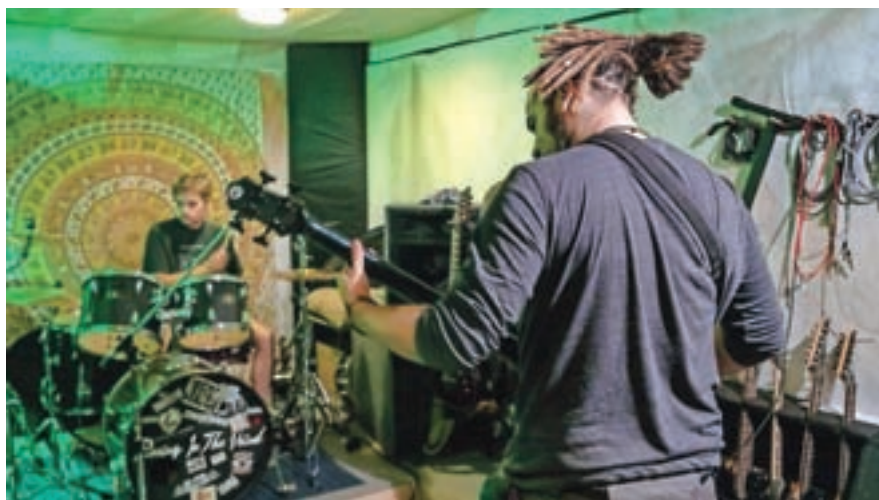
Plc na Planini je prostor ustvarjalnosti ter družabnosti – med številnimi skupinami tam domuje tudi skupina Amalgam.

tivni dokumentarec o Placu, ki ga je posnel Filip Košnik, nato pa so oder zasedle odlične, po vseh teh letih že vse bolj uve-