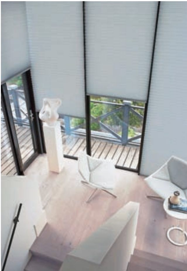
Med notranjimi senčili običajno plise zavese zadovoljijo še tako zahtevnega kupca.

kotna, trapez, polkrožna. »Narejena so iz poliestrne antistatične tkanine, kar preprečuje nabiranje prahu na zavesah. Tkanina je obarvana z barvili, obstojnimi proti UV-žarkom. Pri razrezu tkanine uporabljamo termo nože, ki rob tkanine termično zaključijo. Profili in ostali drobni sestavni deli so iz nerjavečih materialov. Vodilo je najlonska vrvica z ojačanim jedrom, kar senčilo podaljša življenjsko dobo. Plise zavese so odporne proti visokim temperaturam in vlagi ter so enostavne za vzdrževanje,« pravi Rozman.