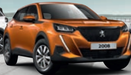
NOVI SUV PEUGEOT 2008