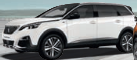
SUV PEUGEOT 5008