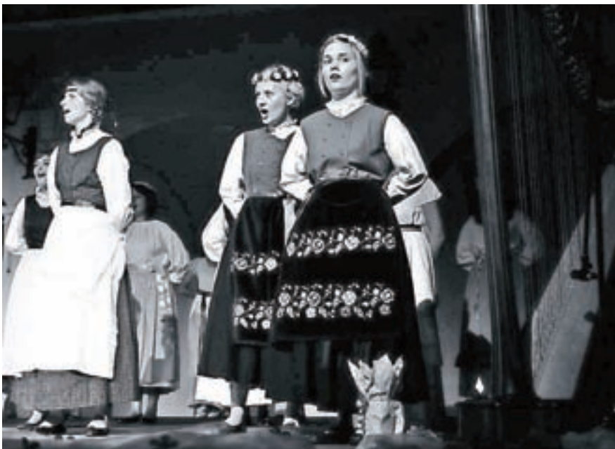
Ko je še živela v Kranju, je pela tudi pri zboru Carmen manet.

Včasih me zjezi, ko pred trgovino srečaš ljudi s polnimi vozički oz. polnimi plastičnimi vrečkami. Pa toliko »trobimo« o njih ... In pomisliš: 'Ojoj, kaj se mi sploh gremo, saj je vse po starem.' Vseeno se pa vidi, da ljudje postajajo bolj ozaveščeni. Spremembe navad terjajo svoj čas in potrebno je, da se res temu posvetimo. Vsakemu bi svetovala, naj poskusi. Sama imam vsakič zmagovalen občutek, ko pridem domov z manj embalaže, začela sem tudi beležiti, kolikokrat grem do zabojnika z različnimi vrstami odpadkov. Ker vsakič, ko jih je manj, je to zmaga. Vem, da sama sveta ne bom spremenila, če pa bodo takšne navade prevzeli tudi kolegi, prijatelji, družina, bomo pa že kaj premaknili. Predvsem se mi zdi pomembni, da smo dovzetni za informacije, da spremljamo, kaj se nam dogaja na področju okolja, saj brez tega ne veš, kakšni problemi obstajajo.