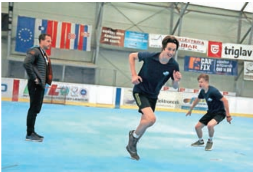
Hokejisti so prejšnji teden začeli redne suhe treninge v dvorani in okolici.