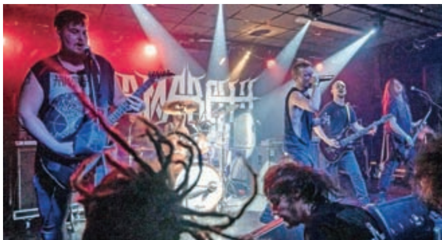
Glasbena energija ob jubileju se je sprostita na odru Trainstation Subarta: v akciji so Armaroth.

Ob deseti obletnici je bilo na prireditvi Plc fest ob koncu lanskega leta tako v Trainstation Subartu še posebej pestro: v uvodu je bil na ogled kratki informa-