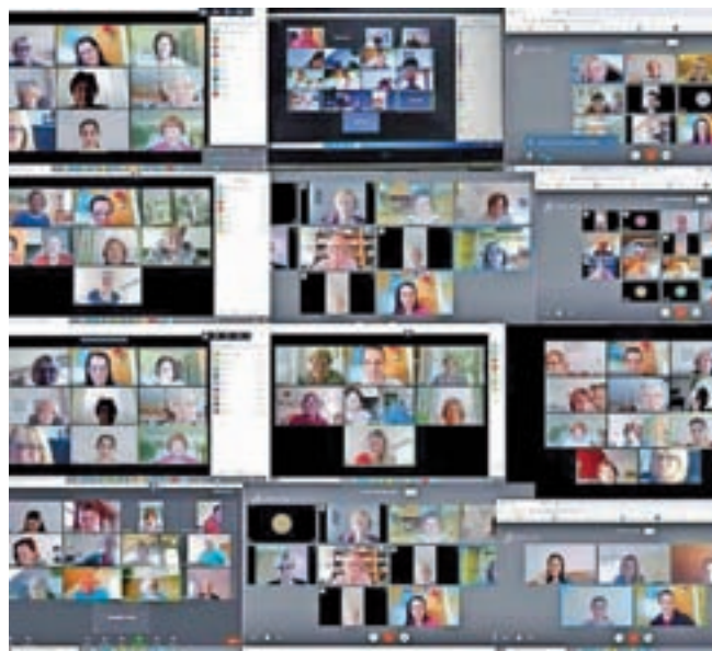
Udeleženci univerze za starejše, ki so se izobraževali na daljavo