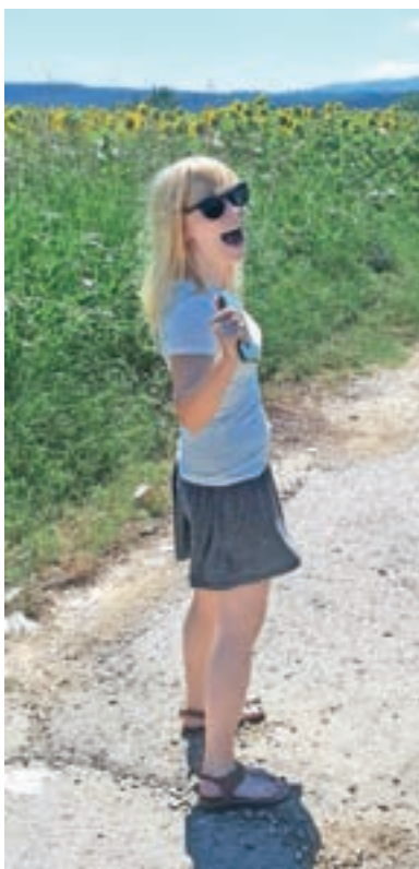
Katjina strast so potovanja. Na fotografiji utrinek iz Bolgarije.

Na Štajerskem živim skoraj sedem let, pet let sem bila v Sladkem Vrhu, te dni pa se selim nazaj v Maribor. Zdi se mi krasno mesto, je prava kombinacija neke majhne prisrčnosti, odprtega pogleda, veliko je možnosti za kulturno udejstvovanje, obiskovanje koncertov, scena je dobro razvita. Predvsem so pa ljudje res srčni in odprti, zato ni težko najti družbe. Najbrž je pomagalo tudi to, da ko sem si preko partnerja gradila družbo, sem vedno vsakemu dala za rundo, da smo razbili stereotipe o 'škrtih' Gorenjcih. (smeh) Sem pa vedno povedala tudi, da sta moja starša po rodu Prekmurca, doma tekoče govorimo prekmursko, verjetno sem tudi s prekmurščino lažje prišla skozi. Na Štajerskem so me že asimilirali. Zdaj se mi doma v Kranju smejiijo zaradi moje čudne mešanice vseh narečij. (smeh)