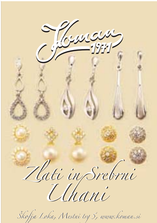
ZLATERSTVO KOMAN AND REJKOMAN S.P. - MESTNI TRG 5, ŠKOFJA LOKA

Ljubitelji lepote ob 20. uri vabljeni na modno revijo v Bar Špelca na Primskovo v Kranju. Če nimate ideje, kako se obleči in urediti pričesko za večerno prireditev, vam bo v navdih petnajst deklet, nekaj fantov in otrok, ki bodo sodelovali na modni reviji. Predstavili bodo kolekcijo večernih oblek in kostimov Modnega salona Špica in modne pričeske Frizerskega studia Skuštrana Urška. Med revijo se boste nasmejali skečem in čarovniku, prav tako ne bo manjkalo dobre glasbe in tolažilnih nagrad. Za zabavo bo poskrbljeno, vstopnine ni.