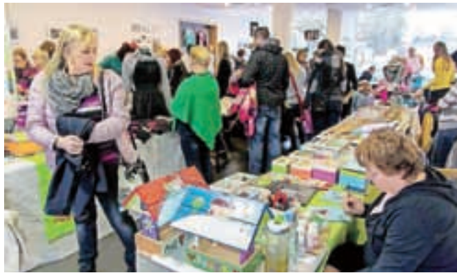
Prvi Sejem unikatnih izdelkov v Domu kulture Kamnik je privabil veliko obiskovalcev.