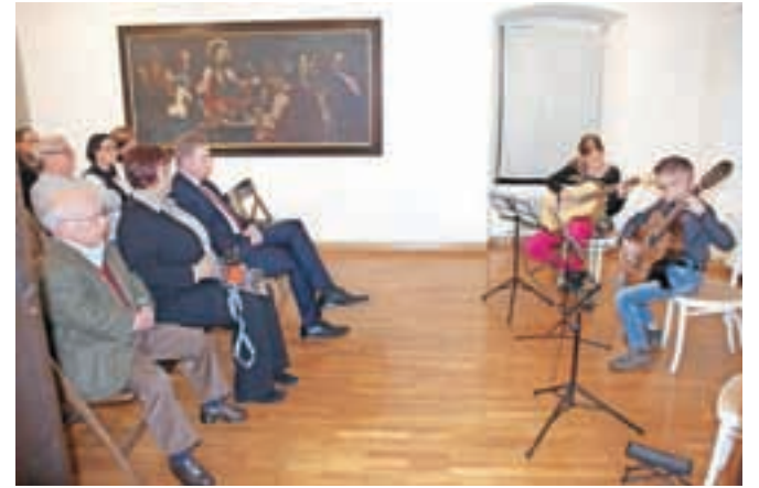
Odprtje razstave so tudi tokrat z glasbenimi točkami popestrili učenci Glasbene šole Kamnik.

mindvajset del, ki so nastala med 17. in 20. stoletjem. Največ slik je v muzejske depoje prišlo iz Sadnikarjeve zbirke, pred pol stoletja tudi z odkupom, nekaj del so pridobili iz zasebnih zbirk, večji del pa je fond nekdanjega Federalnega zbirnega centra, ki je po drugi svetovni vojni zbrane in zasežene umetnine razdelil po slovenskih muzejih. Najstarejši predstavljeni deli imata svoj izvor v samostanskem okolju, prva je slika Zadnja večerja iz prve polovice 17. stoletja, druga pa je slika z naslovom Jezusov pogovor s starši. Še posebej zanimiva je serija štirih plemiških portretov iz prve polovice 17. stoletja. Gre pa za dva portreta plemičev iz rodu Herbersteinov, grofa Thurna in barona generala