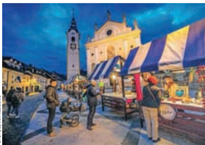
Odziv občanov na prvo Šoping Šutno je bil zelo dober.