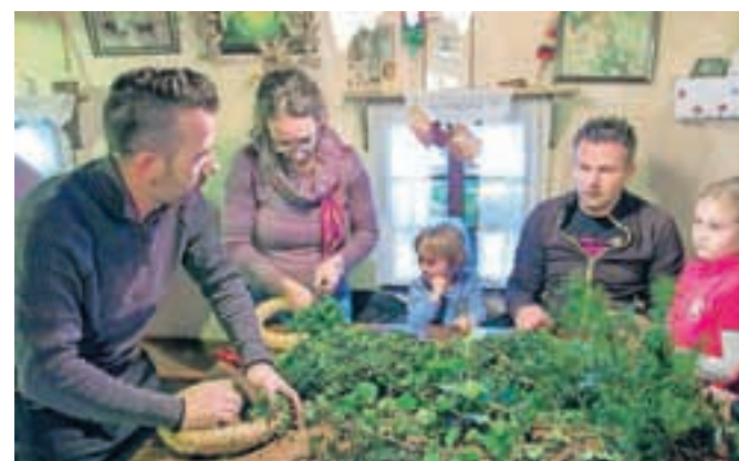
Tudi letos je delavnica adventnih venčkov privabila številne obiskovalce v Budnar co.