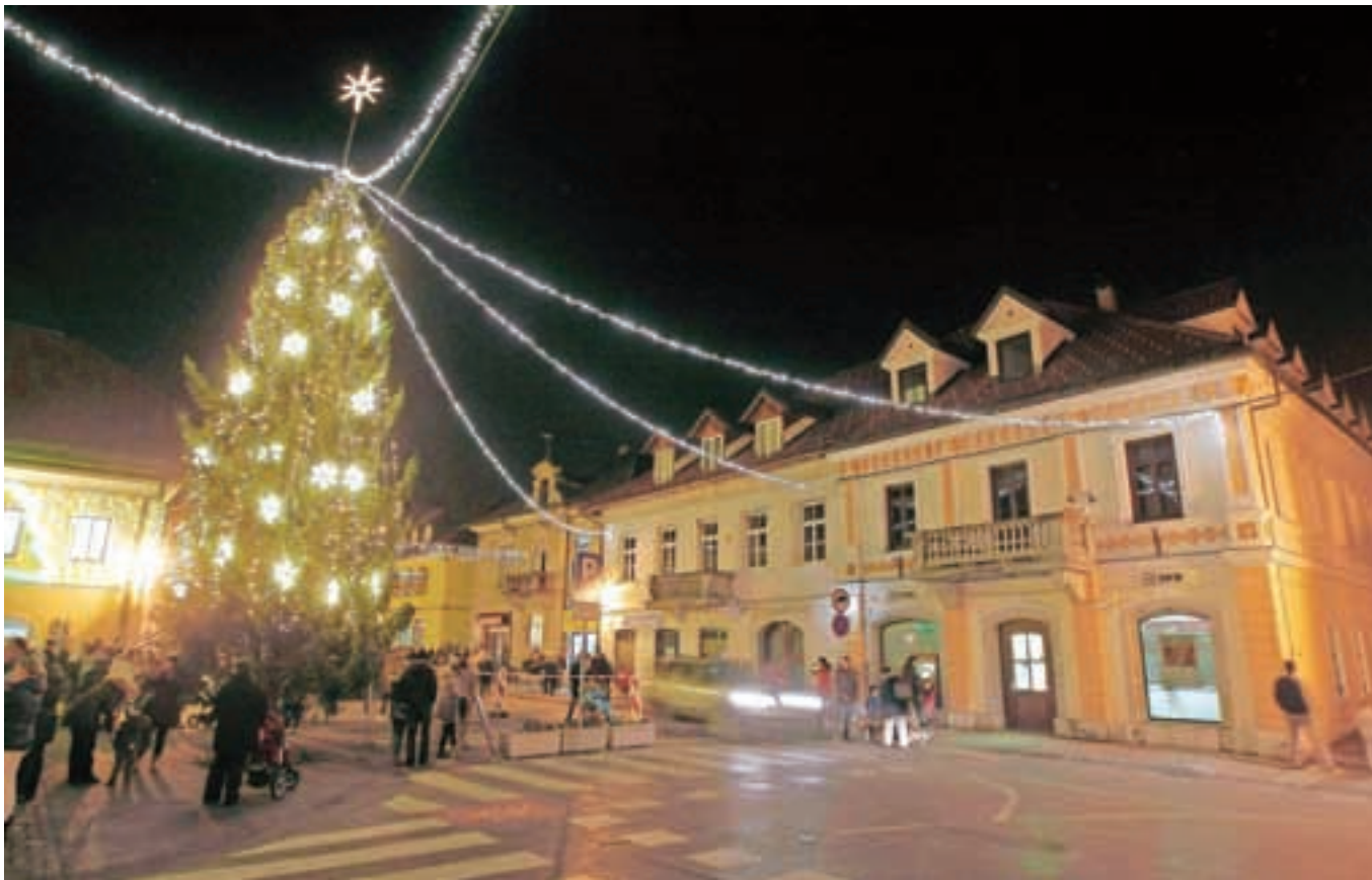
Prižig prazničnih luči je naznanil pestro decembrsko dogajanje pod krovnim naslovom Pravljični Kamnik.

S slavnostnim prižigom prazničnih luči se je v središču mesta minuli petek začelo pestro decembrsko dogajanje, ki bo trajalo vse do zadnjega letošnjega dne, letos pa bo namenjeno predvsem najmlajšim. Prav zato so ga na Zavodu za turizem in šport v občini Kamnik poimenovali Pravljični Kamnik.