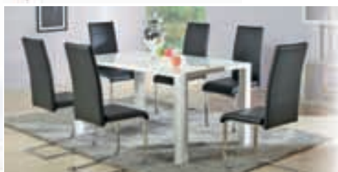
MIZA BOMBA OD