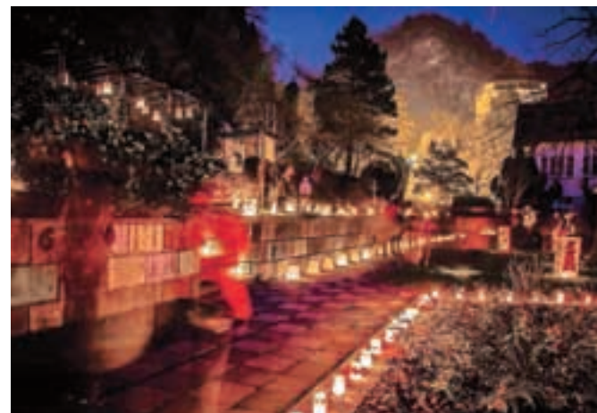
Žarki svetlobe so park spremenili v čarobno deželo.