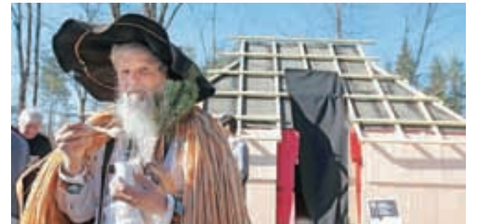
Dediščina Velike planine bo že spomladi turiste navduševala tudi v Godiču.