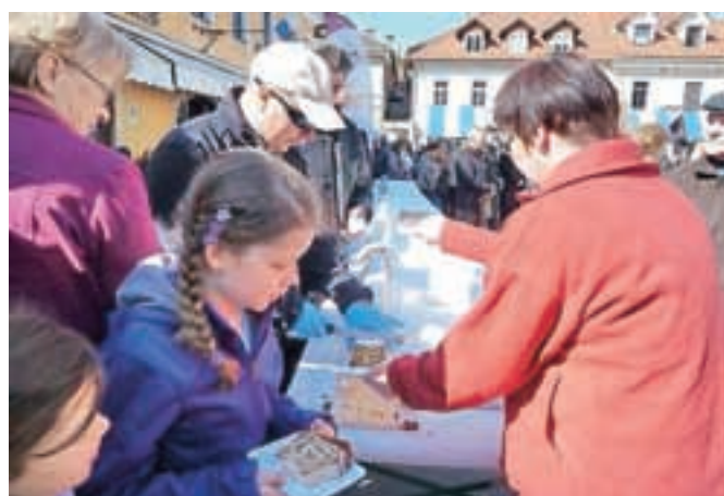
Razrez velikonočne potice velikanke