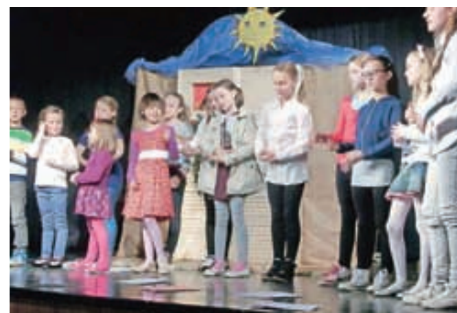
Učenci veroučne šole Zgornji Tuhinj

gem delu je vse razveselila igralska skupina iz Kureščka s poučno igrico Izgubljena ovčica in dobri pastir. Otroci od prvega do četrtega razreda so pred prireditvijo sodelovali tudi v delavnici, ki so jo vodili igralci v sodelovanju z mamicami in si sami izdelali ušeska in repke ovac. Preoblečeni v ovce so bili tako tudi vključeni v samo igrico in navdušeno sodelovali. Vse mame, stare mame in prababice so dobile tudi lepo izdelano voščilnico za materinski dan.