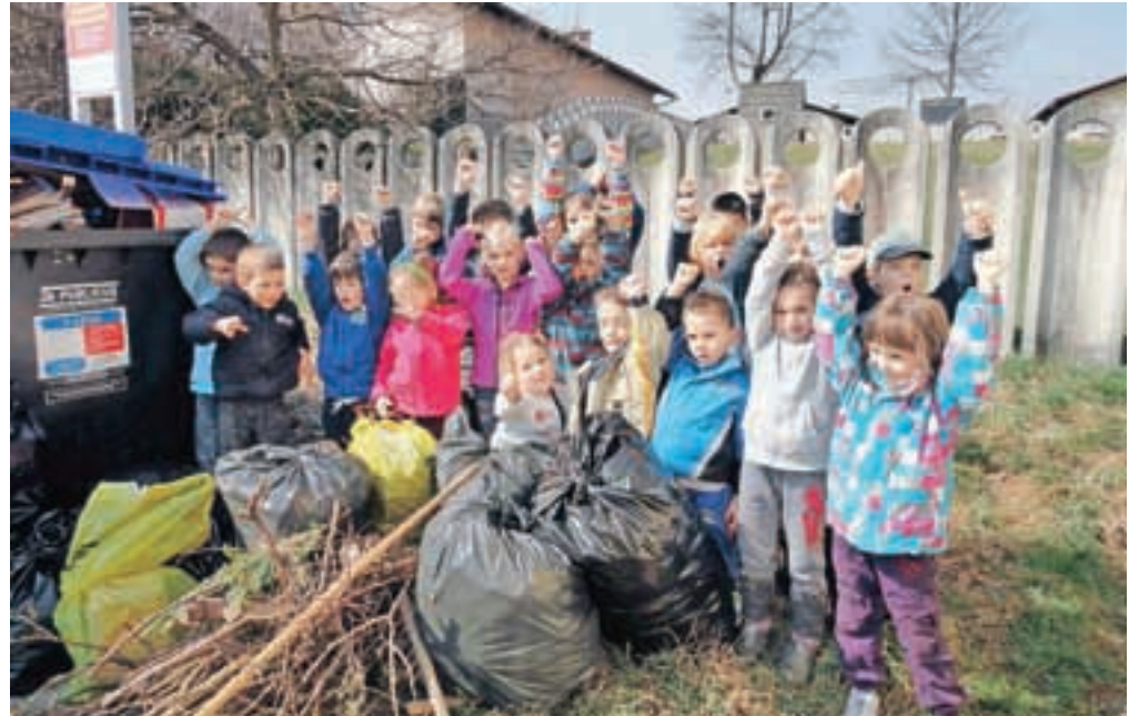
Čistilne akcije so se udeležili tudi najmlajši iz enote Tinkara, ki so očistili okolico svojega vrtca in ekološki otok na Klavčičevi ulici.

»Kljub ugotovitvi, da se število divjih odlagališč iz leta v leto nekoliko zmanjšuje, imajo udeleženci čistilnih akcij povsod po občini polne roke dela. Gozdne grape ter brežine potokov in rek so očitno zelo primerno odlagališče za odslužene avtomobile, gospodinjske aparate, gume, pa tudi najrazličnejšo kovinsko in plastično embalažo. Glede na to, da imamo dobro organiziran odvoz, saj lahko vsako gospodinjstvo dvakrat v letu naroči brezplačni odvoz kosovnih odpadkov, je zares nerazumljivo, zakaj se nekateri občani raje odločijo za odlaganje odpadkov v naravi,« ugotavljajo na Občini Kamnik, ki je občanom priskočila na pomoč z vrečami in rokavicami, skupaj z družbo Publicus pa so poskrbeli tudi za odvoz odpadkov. Teh se je nabralo za skoraj trinajst ton, in sicer je bilo iz