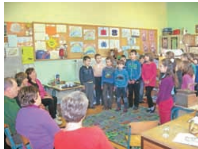
Sodelovanje med POŠ Motnik in Društvom upokojencev Motnik-Špitalič poteka že vrsto let.