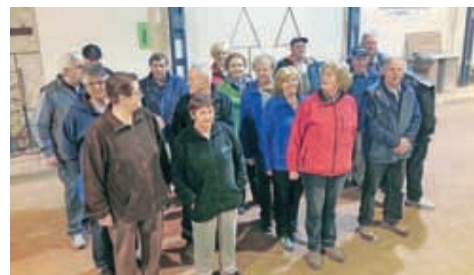
Najboljše veteranske ekipe zaključku zimske lige na dupliškem balinišču

in sicer so se veterani razvrstili takole: 1. mesto MDI Domžale, 2. mesto Društvo upokojencev Kamnik, 3. mesto BD Komenda ženske in 4. mesto BD Komenda moški. Med članskimi ekipami pa so najboljša mesta dosegli: 1. mesto BK Budničar Količevo, 2. mesto Montles Duplica, 3. mesto sekcija BK Duplica in 4. mesto BK Duplica. Vse najboljše uvrščene ekipe so prejele lične pokale, posamezniki pa medalje. Udeleženci zimske lige so bili z organizacijo tekmovanja v zimskem času zelo zadovoljni, saj jim je to tek-