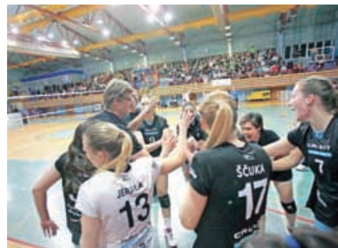
Kamniške odbojkarice so se za odlično navijaško vzdušje in polne tribune minulo soboto oddolžile na najboljši možni način – z zmago.