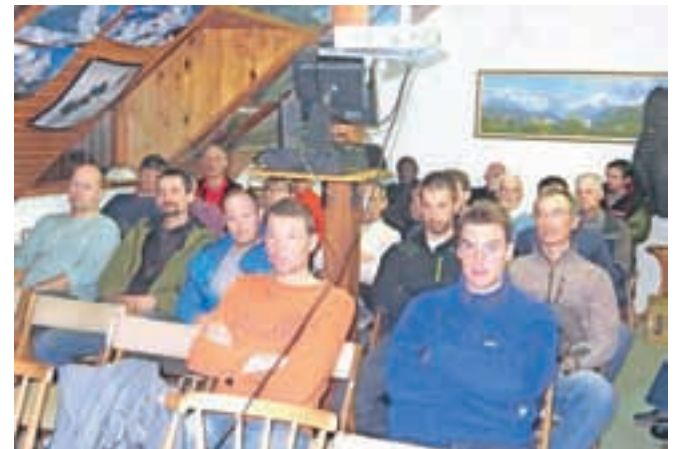
Na občnem zboru Alpinističnega odseka Kamnik