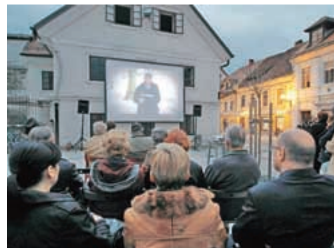
Projekcija kratkega filma na pročelju Maistrove rojstne hiše na Šutni