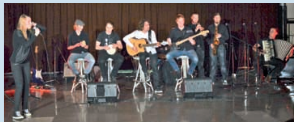
Koncert za dober namen na GSŠRM

Napovedujemo: Karierno tržnico in Prvi Maistrov pomladni ples v dobredelne namene.