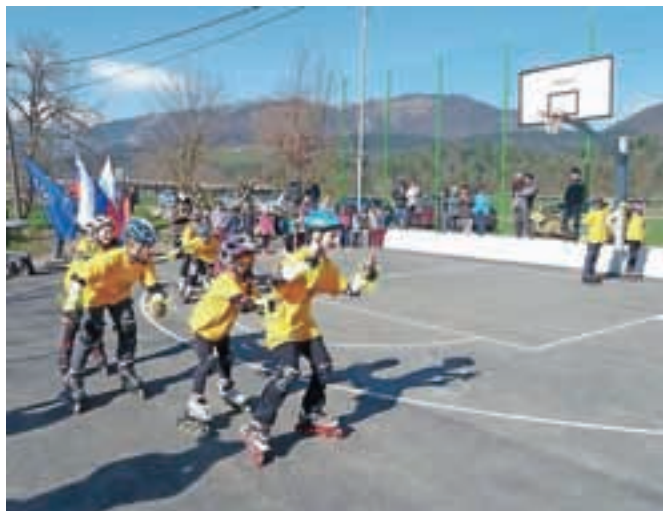
Za pravi krst nove večnamenske ploščadi so poskrbeli tudi učenci na rolerjih iz šolskega krožka Drug z drugim.