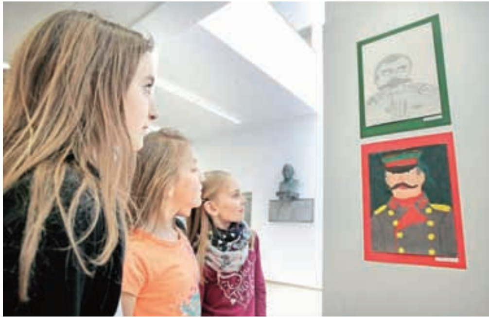
Tudi mladi se zavedajo pomena v Kamniku rojenega Rudolfa Maistra, ki pa ni bil le general in borec za severno mejo, ampak tudi pesnik.

Rudolfa Maistra so se letos spomnili celo v Termah Snovik, kjer so pred dnevi predstavili svoj zbornik Termalna voda – vir življenja in razvoja ter odprli priložnostno razstavo z naslovom Delo Rudolfa Maistra. Generalova dejanja so sicer precej neposrečeno primerjali s svojim delom v zadnjih