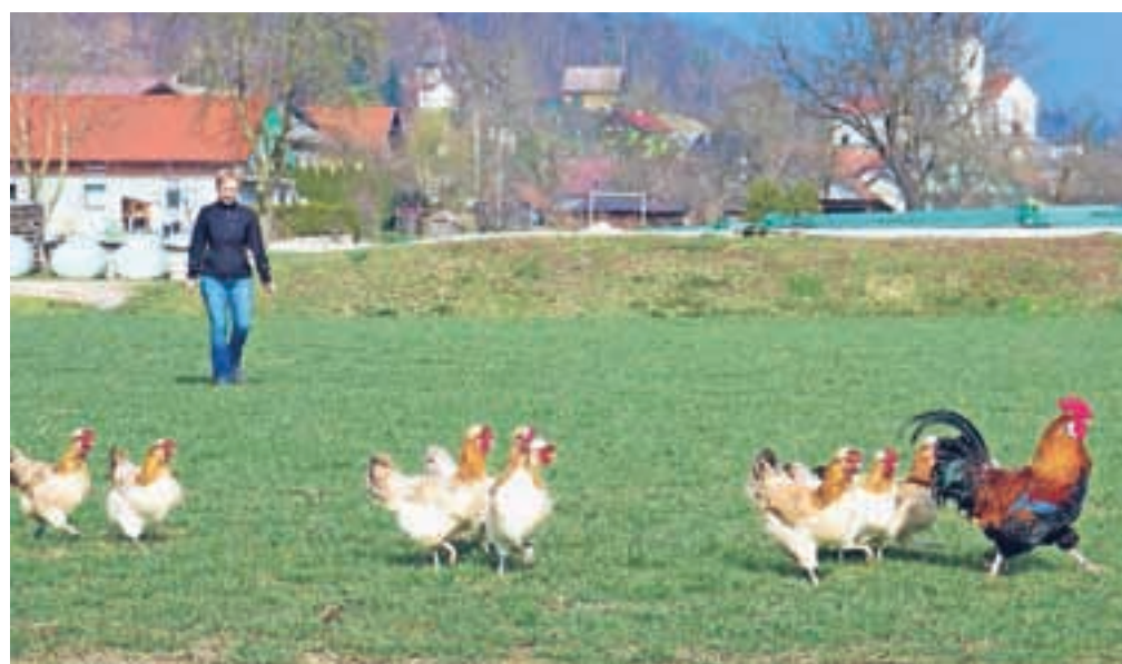
Štajerke slovijo po tem, da si veliko hrane najdejo same.

Kokoši so k hiši prišle zaradi jajc. Jajca štajerskih kokoši imajo svetlo in krhko lupino, zato so tudi zelo primerne za lepe pisane velikonočne pirhe. »Štajerke sicer ne