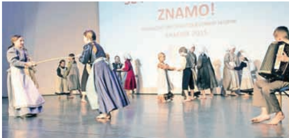
Otroška folklorna skupina Verine zvezdice iz OŠ Marije Vere s točko Ovčke so nam ušle

Nastopajoče skupine – Folklorna skupina Pestrna, Otroška sekcija folklornega kulturnega društva Lukovica,