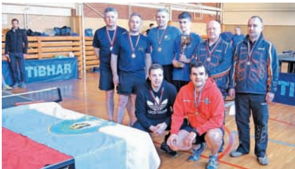
Predstavniki najboljših ekip občinske namiznoteniške lige 2015: Tuhinj, Kamnik, Šmarca (z leve proti desni) in Duplica (spodaj)