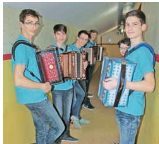
Manjši del Harmonikarskega orkestra CiS v zaodru