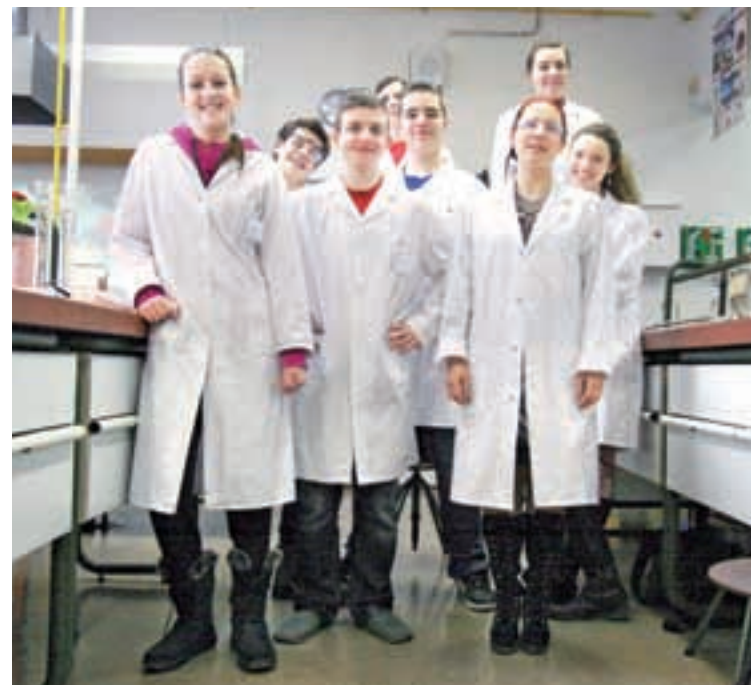
Bodoči dijaki lahko izbirajo med tremi različnimi usmeritvami: naravoslovno, jezikoslovno in družboslovno smerjo

Dijaki v svojem štiriletnem življenju pri nas izrazijo svoja močnejša področja, mi pa jim pri tem pomagamo, da jih še globlje razvijajo. Tri različne usmeritve – naravoslovna, jezikoslovna in družboslovna – pripomorejo, da dijaki pridobijo poglobljena znanja z določenih interesnih področij. Z medpredmetnimi povezavami, sodelovanjem v projektih in izmenjavah, raziskavah ter s taborom za nadarjene dijake pa nasitimo tudi tiste še bolj lačne znanja. Mimogrede, na naši šoli se tudi dobro je; saj poznate tisti pregovor, ki pravi, da prazen želodec ne študira rad.