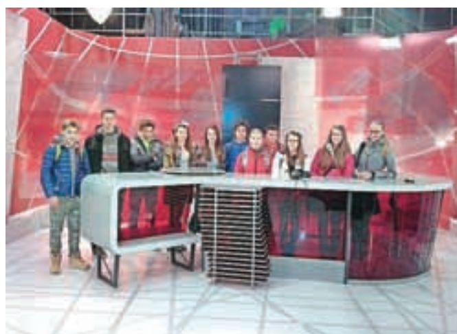
Učenci OŠ Frana Albrehta v studiu ene od slovenskih medijskih hiš

bo potrebujejo. Ugotovili smo, da je poklic novinarja zelo zanimiv, saj si lahko po izobrazbi tudi učitelj tujih jezikov, geograf, zgodovinar (narediš boljše prispevke, če je prispevek blizu tvojemu področju izobrazbe). Novinarstvo je tudi svojstven način življenja, saj so novinarji v službi kar po cele dneve in imajo tedensko kakšen dan ali dva počitka. Novinarjevo delo poteka v ekipi, ki jo sestavlja tudi sto ljudi in vključuje stiliste, snemalce, scenariste ... Delo za določeno oddajo poteka tudi po več mesecev, saj ima vsaka oddaja specifično sceno in scenarij ter režijo. Ko je vse nared, oddaje po navadi potekajo v studiih (ki so v živo veliko manjši, kot so videti na televiziji) in se snemajo v živo ali pa so posnete že vnaprej. Ker se voditelji ne morejo celega teksta naučiti na pamet (novice prihajajo tudi nekaj minut pred začetkom oddaje), se jim tekst odvija na bobnu. Po koncu obiska smo si bili vsi enotni, da je bilo res super in da smo izvedeli veliko novega, poklic pa se nam je še bolj prikupil.«