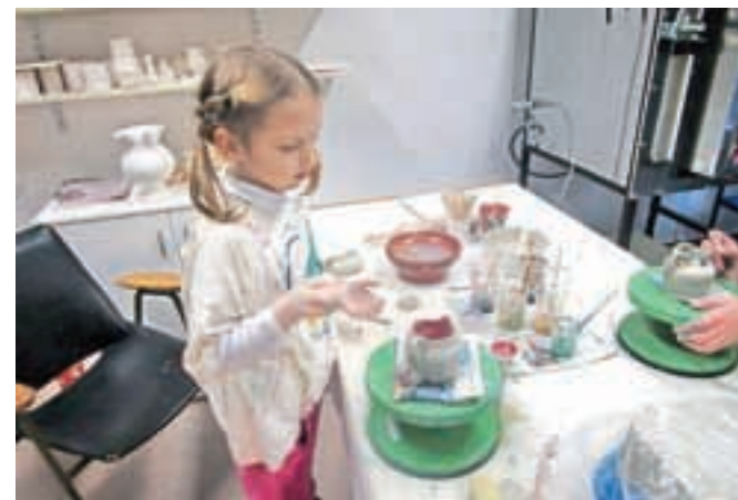
Delavnice oblikovanja glin so bile med počitnicami namenjene otrokom.

dotakne. Drugačno, a tudi zanimivo pa je izdelovanje v roki ali na mizi v drugih keramičnih tehnikah. Otroci so tudi pritrjevali ročaje, in če so jih dobro pritrjili, ne bodo odleteli ne pri sušenju in ne pri žganju. Bilo je prav zabavno, so rekli udeleženci in eden med njimi kar ni in ni odnehal. Vreteno ga je začaralo in »moral« je priti prav vsak dan. Seveda pa so otroci izvedeli tudi več o glini, postopkih, žganju pa tudi o kamniški keramiki in majoliki. Zelo zadovoljni so bili tudi dedki, babice in starši. Lahko rečemo, da ni moglo biti bolje. Pa drugič spet.