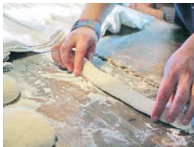
... nato pa zamesil testo za bageto in polnozrnat kruh.