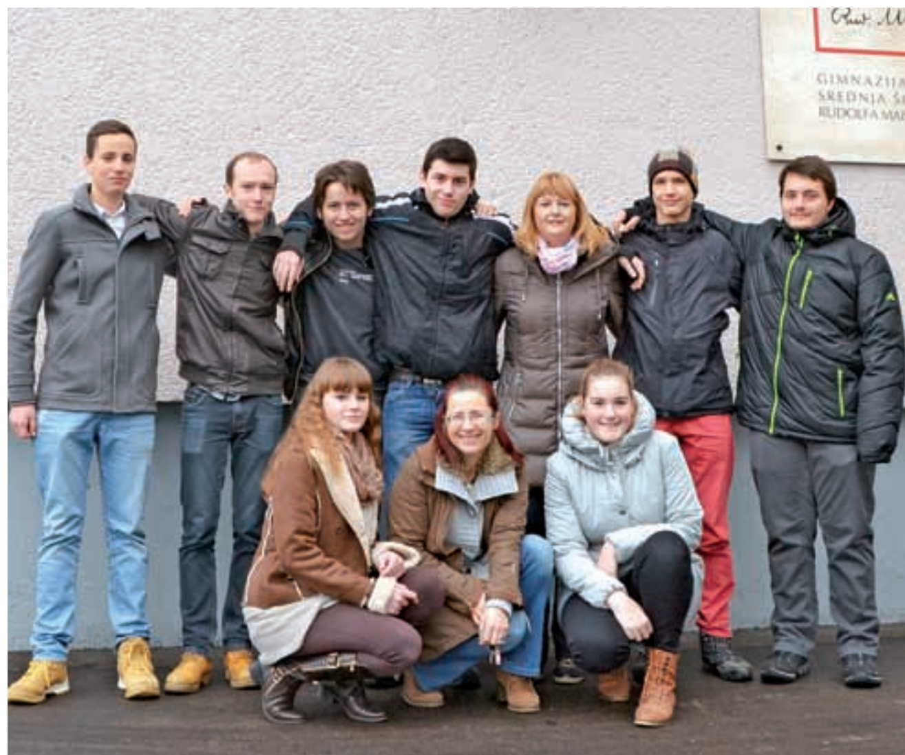
Letošnja YPAC ekipa GSŠRM na srečanju, ki bo potekalo med 16. in 20. marcem. Tema so ekosistemske storitve v času podnebnih sprememb.

Vsakoletno vprašanje YPAC-a je, kako in na kakšen način sprejete postulate predstaviti vplivnim politikom in navsezadnje – doseči resnične in opazne spremembe. Da bi bili pri tem uspešnejši, so v času sestajanja organizirana predavanja strokovnjakov za omenjena področja kot tudi pogovori s pravimi predstavniki lokalnih in državnih politik, ki dijake usmerjajo in jim pomagajo pri razumevanju globljih političnih premikov. Pogosto se namreč pripeti, da so predlagani ukrepi mladih preveč idealistični in jih je nemogoče uresničiti ali pa v resnici sploh niso dovolj inovativni – prav zato je vsak pogovor s strokovnjakom in/ali politikom dobrodošel in še kako dragocen. Seveda ne gre pozabiti, da je vsak poskus mladih obenem tudi pomembna odskočna deska ambicioznejšim učencem v smeri uresničevanja lastnih zamisli.