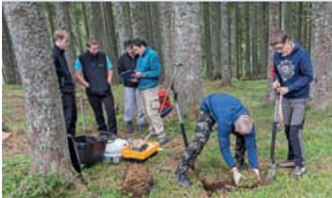
Poletna šola - Recharge.green

Organizacijo letošnjega jubilejnega 10. srečanja YPAC-a je prevzela Gimnazija in srednja šola Rudolfa Maistra Kamnik v sodelovanju z Občino Kamnik, Ministrstvom za okolje in prostor, ki koordinira izvajanje Alpske konvencije v Sloveniji, in Stalnim sekretariatom Alpske konvencije Innsbruck, organizacijo CIPRA in projektom recharge.green. Vsem iskrena hvala v imenu šole in vseh mladih Evrope.