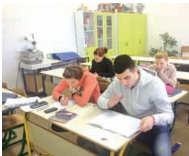
Pouk se izvaja v majhnih skupinah, dostopni učitelji prilagajajo pouk in termine izpitov potrebam posameznikov in skupin, na voljo je literatura v klasični in elektronski obliki

naši udeleženci dobro opremljeni za samostojno delo, z našimi spričevali pa imajo konkurenčno prednost tudi pri iskanju zaposlitve. Če v vas že dolgo biva želja po izobraževanju, novem poklicu ali znanju tujega jezika, ne omahujte. Pokličite nas in pogovorili se bomo o možnostih za uredništev vaših sanj!