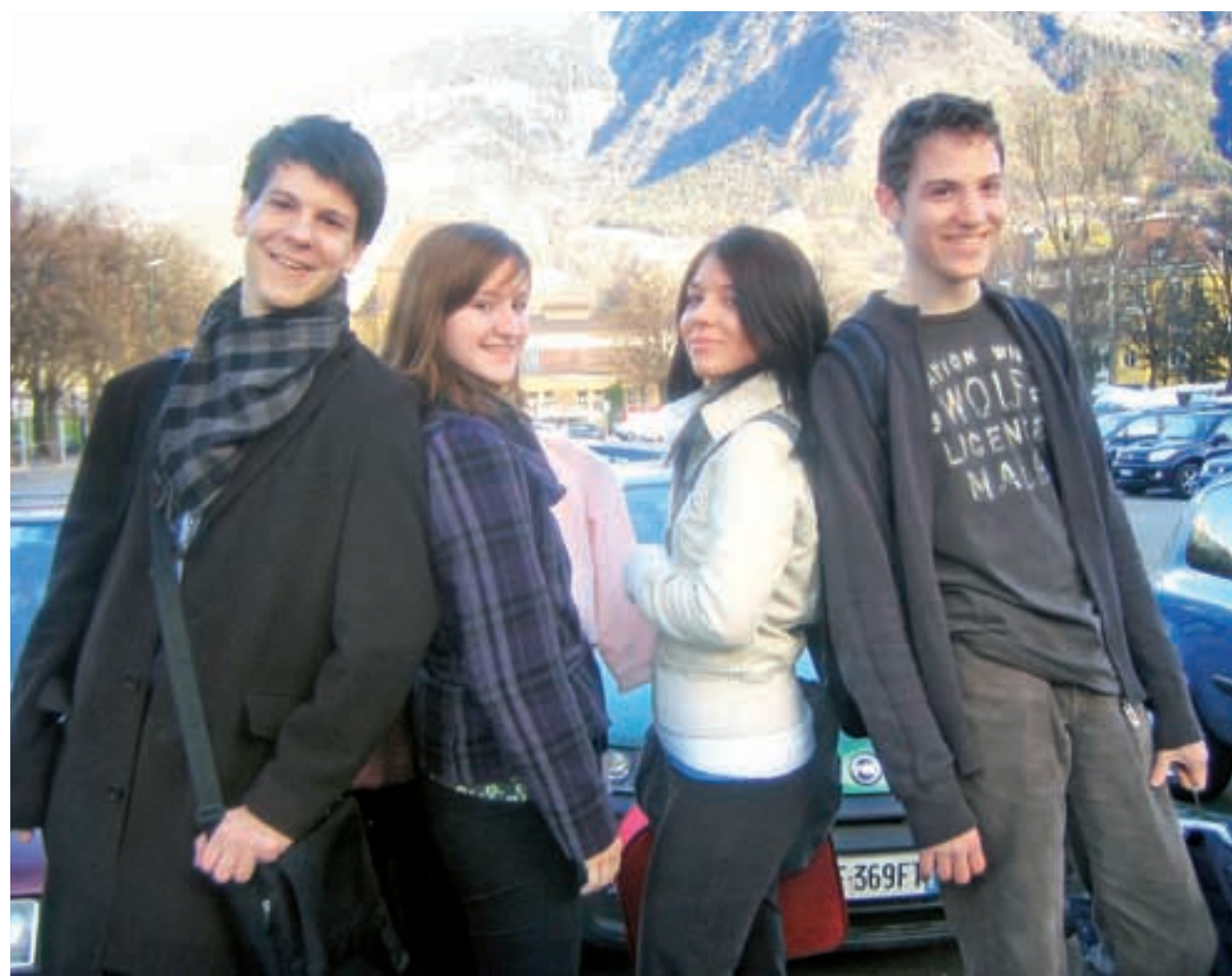
Kamnik's first delegation, Merano 2009

A week-long youth parliament event occurs annually, each year hosted by a different school. It involves all seven Alpine countries (Slovenia, Austria, Switzerland, Germany, France, Italy and Liechtenstein), represented by ten schools, of which Slovenia is represented by two: II. Gimnazija Maribor and Gimnazija in srednja šola Rudolfa Maistra Kamnik, an elite choice that brings great honour to our town.