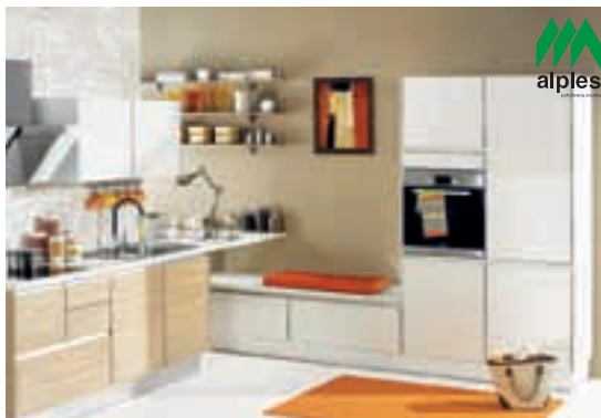
Akcija velja do konca marca.

Kranjska cesta 3a, Kamnik T: 01 831 04 81 | 051 399 577 www.pohistvo-dabor.si