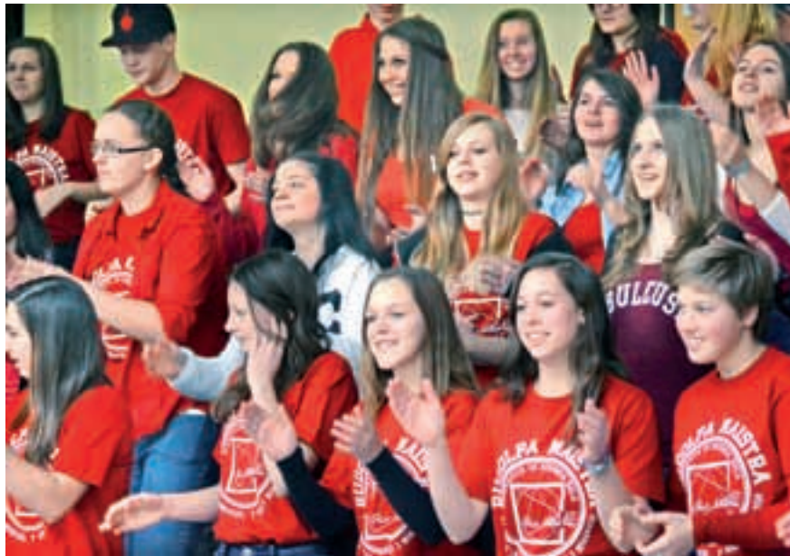
Letos bo že tretja generacija svoje izkušnje pridobivala z delom v angleškem Leedsu ter avstrijskem Celovcu

Program predšolska vzgoja je dinamično potovanje skozi pesem, igro, barvo in besedo. Združuje veselje do učenja, ustvarjanja in vzgajanja. V šoli pridobljeno teoretično znanje dijakinje, pa tudi vedno več dijakov, praktično povezujejo z delom z najmlajšimi. Poleg obveznega usposabljanja v vrtcih pogosto gostujemo pri hvaležni otroški publikli z uprizorjanjem avtorskih igrin in s prirejanjem tematskih delavnic. Posebnost dijakov naše šole je, da malčke na svojih nastopih v vrtcih učijo tudi znakovnega sporazumevanja. Pri tem je največja zvezda navihan pomočnik – Mihec.