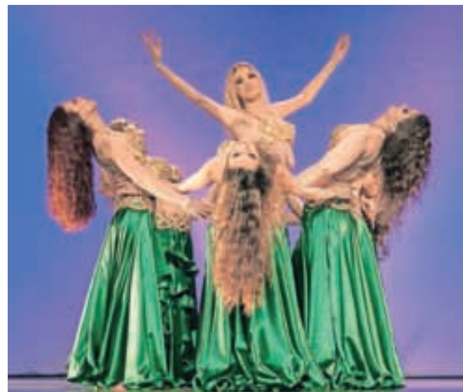
Obiskovalce večernega šova so navdušili različni plesni stili orientalskega plesa, tribal in bollywood.