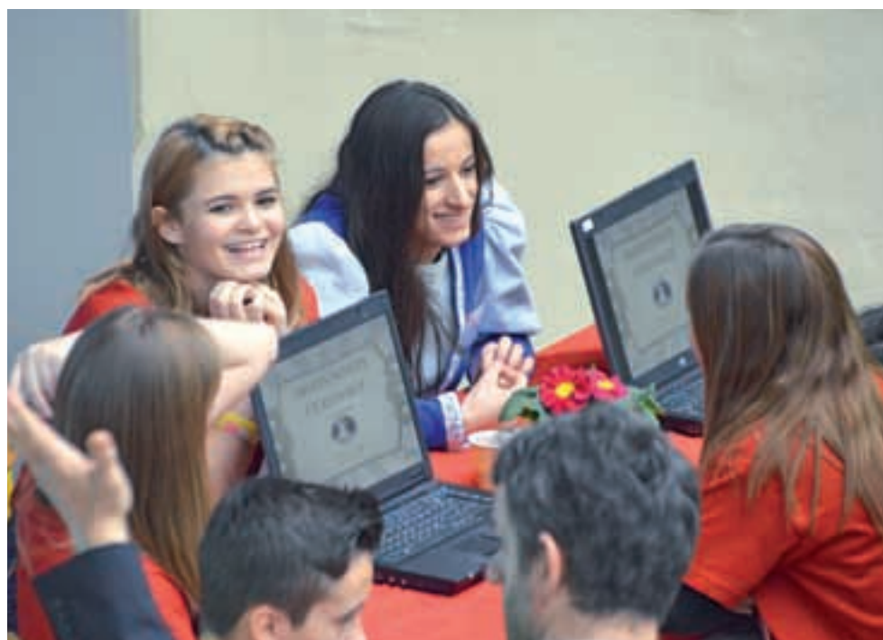
Na voljo je več izbirnih modulov: podjetništvo – turizem in bančništvo; novost, ki jo pripravljamo za jesen 2015, pa je modul menedžment v športu

Nudimo več izbirnih modulov: podjetništvo – turizem in bančništvo, novost, ki jo pripravljamo za jesen 2015, pa je modul menedžment v športu. S širjenjem športa in z razvojem športne dejavnosti se vse bolj pojavlja potreba po njegovi urejenosti in strokovnem vodenju. Šport ni več samo zabava in užitek, je tudi velik posel, ki zahteva kadre, ki združujejo športna in tudi poslovna znanja. Menedžer mora biti dober vodja z organizacijskimi in komunikacijskimi sposobnostmi, za svoje delo mora imeti znanja s področja ekonomije in poslovanja, prava in menedžmenta. Ker ugotovljamo, da je področje menedžmenta v športu v Sloveniji kadrovsko podhranjeno, ga vključujemo v program ekonomski tehnik v okviru t. i. odprtega kurikula. Strokovno vodenje športa je zagotovo področje, ki daje možnosti za zaposlovanje.