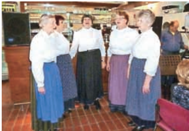
Kulturni dogodki pri kamniških upokojencih ne minejo brez Ljudskih pevkv Predic.