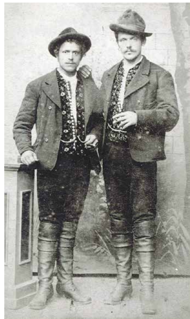
Moška iz Doline nad Trzičem, konec 19. stoletja

Ženski na desni imata pečo prekrizano na zatilju in na vrhu glave zavezano v pentljo. Tak način zavezovanja peč je bil pogost v prvi polovici in sredi 19. stoletja, na njeni podlagi pa se je v zadnji tretjini 19. stoletja s pečami, ki so jim dodajali široke čipke, razvila petelinčkova vezava.