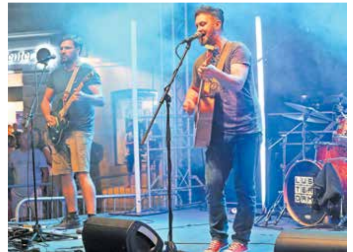
Po žilah Lusterdama se pretaka post-rok in kitarski pop s primesmi grandža in kantrija. Prisluhnil ste jim lahko na Mestnem odru.