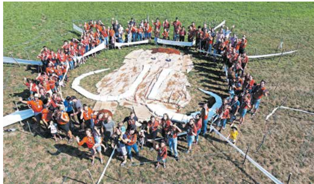
Kamniški skavti ob veliki sestavljanji s podobo mamuta

Sobotno jutro je bilo povsem običajno: budnica, jutranja telovadba, zajtrk in kvadrat. Kvadrat pomeni, da se vsi skavti postavimo v vrsto v obliki pravokotnika. Za sklic kvadrata je potreben pose-