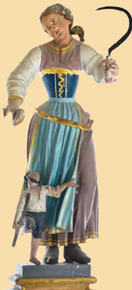
Kip svete Notburge v podružnični cerkvi sv. Lenarta v Zakalu se povezuje s podobo praznjega oblačenja žensk kamniške okolice.

Posebna pričevanja o oblačenju v lokalnem okolju prinašajo nekatere upodobitve v cerkvah, večinoma v prizorih, ki upodabljajo ljudi v stiski. Poleg fresk v cerkvi sv. Primoža in Felicijana z začetka 16. stoletja so zanimive baročne upodobitve svete Notburge in svetega Izidorja – kmeta v cerkvah na Selih in v Tunjicah, posebno vrednost pa imata doslej neopažena kipa teh dveh svetnikov v podružnični cerkvi sv. Lenarta v Zakalu. Sveto ob straneh glavnega oltarja, so odseva tudi pesemsko izročilo. s kmečkim delom, zato njune iz okolja, kjer so nastale. S tem so se namreč ljudje s svetnikoma še lažje poistovetili.