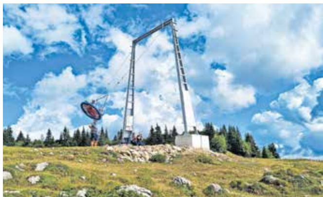
Tri gugalnice velikanke so nameščene na stebre nekdanje žičnice.