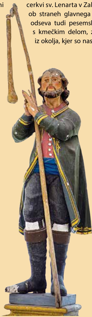
Podoba svetega Izidorja, zavetnika kmetov, v oltarju cerkve v Zakalu upodablja praznje oblačenje moških v kmečkem okolju, zlata obroba suknje pa poudarja plemenitost svetnika.