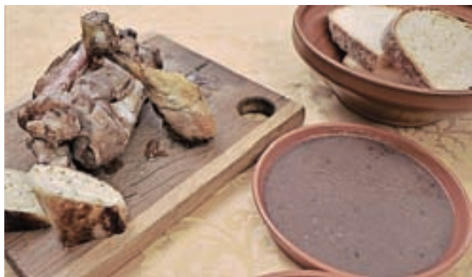
Kuhana krača s pehtranovimi štruklji, omaka iz jabolk in hrušk ter piščančje kračke