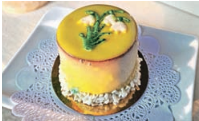
Monoporcijska tortica kronica

nudbo sladice v arboretumski kavarni. Privoščite si lahko »cakepops«, kolaček ali tortico kronica. Po slednjih je kar precej povpraševanja, okusa pa sta sadni, kjer vaniljev biskvit lepo dopolnijo okusi maline, pasijonke in mousse temne čokolade, ter čokoladni – čokoladno tortico sestavlja čokoladni biskvit z dodatnim čokoladnim ganšem in ravno tako moussom temne čokolade.