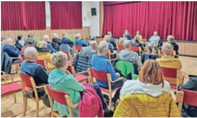
Občni zbor Kulturnega društva Tuhinj

Večkrat v goste povabijo tudi druga amaterska in tudi profesionalna gledališča. Pa tudi druge nastopajoče – in tako je bilo tudi v torek, 8. marca, ko so v dvorani na Lazah pripravili koncert dalmatinskih in slovenskih napevov ob dnevu žena z nastopom Klape