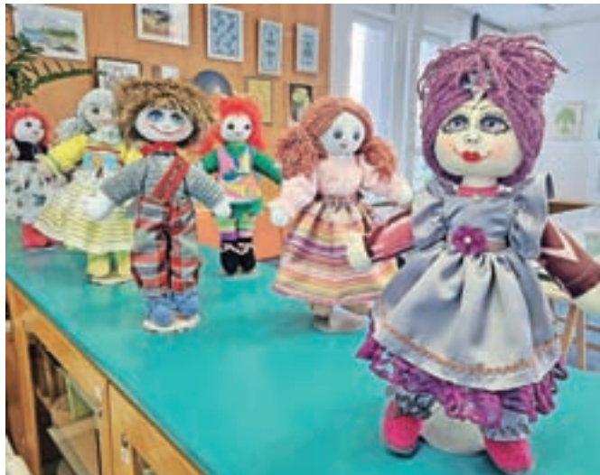
Unicefove punčke

na razstavi zasedajo Unicefove punčke, ki jih izdelujejo v društvu in jih za dvajset evrov lahko posvojite in tako prispevate v Unicefov program za cepljenje otrok.