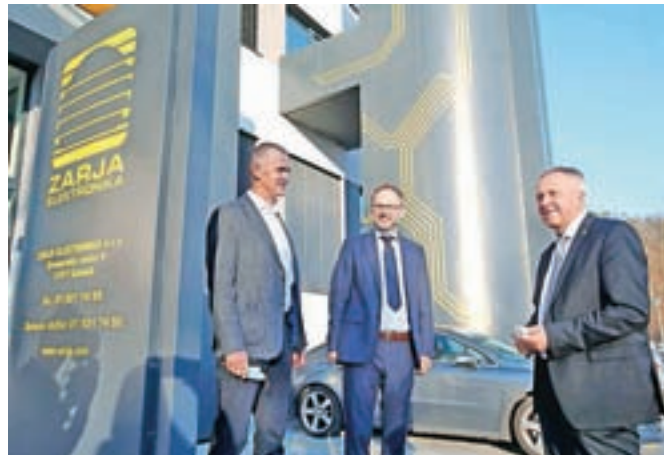
Kamniško podjetje Zarja Elektronika so si ločeno ogledali kar trije ministri: mag. Matej Tonin, Zdravko Počivalšek (na sliki) in dr. Simona Kustec.

»Oskrba starejših je področje, ki ga je država v preteklih desetih letih močno zanemarila, zato se je na razpis za denar iz sklada React-EU prijavilo zelo veliko projektov in predvidenih 91 milijonov evrov ni zadostovalo za vse. Takrat je izpadel tudi DSO Kamnik, a na vladi nam je uspelo zagotoviti dodatnih sto milijonov evrov iz državnega proračuna, zato bomo zdaj prizidek lahko zgradili tudi v Kamniku,« je v okviru vladnega obiska v DSO povedal minister.