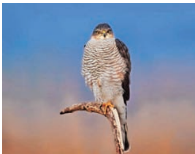
Fotografija skobca je ena izmed sedemnajstih, ki jih najdemo na razstavi.

Človek je bil nekdanj z naravo precej bolj povezan, kot je danes. Glavač je tako poudaril zanimiv primer Barutane, kjer je bilo kljub industrijskemu območju dovolj zelenih površin, na katerih so svoj prostor našle tudi številne prostoživeče vrste, zaposleni pa so denimo ptice krmili v krmilnicah. Danes je zaradi posegov ljudi ogrožena marsikatera živalska vrsta. A upanje, da se bomo v prihodnje vendarle bolj zavedali pomena naravnega okolja, še obstaja. Kot je povedal avtor, se v končni izbor in vrstni red fotografij, ki sta delo članov Foto kluba Kamnik, ni vpletal. »Opazil pa sem, da je prva fotografija, ki jo obiskovalec razstave vidi, fotografija dveh čebelarjev, ki si izkazujeta ljubezen, zadnja pa fotografija sove, ki posebej modrost in znanje,« je dejal in svoj nagovor zaključil z besedami: »Prepričan sem, da bomo nekoč našli modrost in bomo za naravo poskrbeli boljše, kot skrbimo sedaj. Moramo varovati življenje, ki je tako dolgo obstajalo z nami in lahko obstaja tudi v prihodnje.«