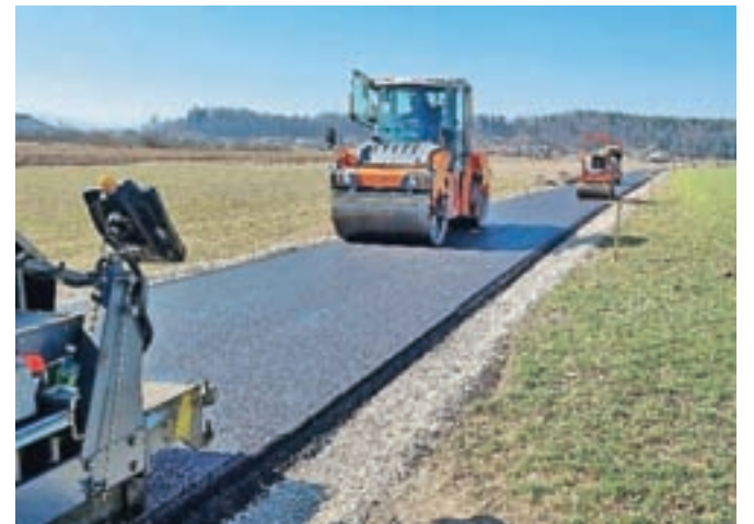
Odsek kolesarske povezave od Podgorja do Korenove ceste je že asfaltiran.

V preteklem tednu je že potekalo asfaltiranje kolesarske poti v delu trase od Podgorja do Korenove ceste in urejanje križanja kolesarske poti s Podgorsko cesto. Prav tako se nadaljujejo izkopni terena proti Mengšu.