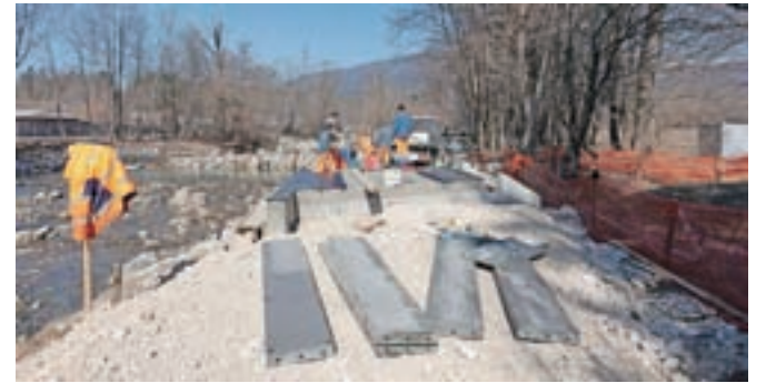
Gradnja drugega prepusta ob kolesarski povezavi od Mekinj proti Godiču

južne strani (z območja Mekinj). V Mekinjah so delavci že začeli polagati robnike, izvedena pa sta bila tudi že dva od predvidenih petih prepustov oz. premostitvenih objektov čez Mlinščico in manjše pritoke Kamniške Bistrice.