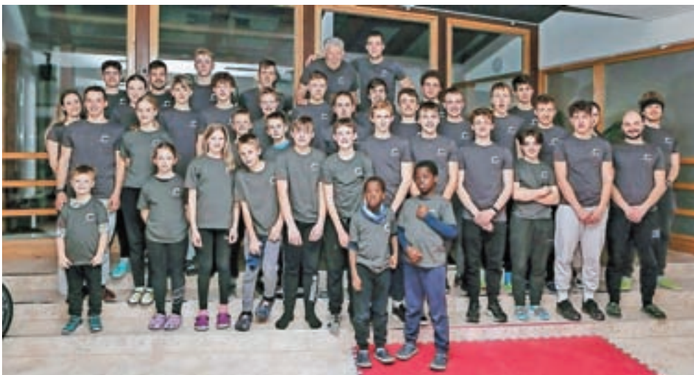
Mladi kolesarji so na pripravah pridno trenirali in se vmes tudi zabavali.