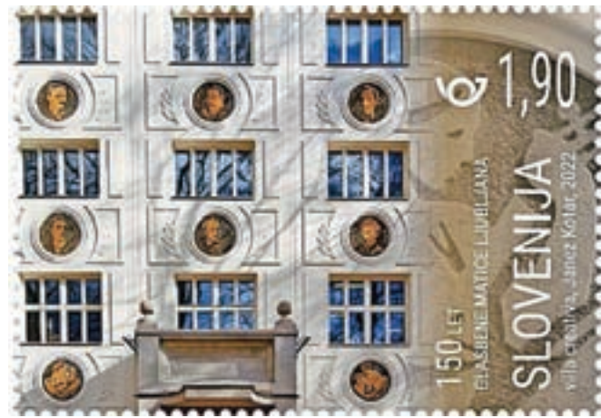
Znamka ob 150-letnici Glasbene matice Ljubljana