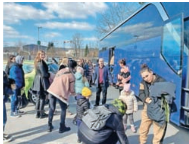
Avtobus ukrajinskih beguncev, ki se je ustavil pred Gimnazijo in srednjo šolo Rudolfa Maistra Kamnik.

Prispevek lahko tudi nakažete na: Slovenska karitas, Kristanova ulica 1, 1000 Ljubljana, TRR: SI56 0214 0001 5556 761, sklic: SI00 870, namen: Pomoč Ukrajini, ali pa na Rdeči križ Slovenije, Mirje 19, 1000 Ljubljana TRR: SI56 0310 0111 1122 296, sklic: SI00 9688, koda namena: Char. Uporabniki mobilnih storitev A1, Telekom, Telemach in T-2 lahko prispevate s poslanim SMS-om na 1919 z besedo BEGUNCEM (prispevate 1 evro) ali BEGUNCEM5 (prispevate 5 evrov). Prispevek 5 evrov je mogoče posredovati s SMS-sporočilom KARITAS5 na 1919. Posebno akcijo zbiranja pomoči so te dni organizirali tudi na Gimnaziji in srednji šoli Rudolfa Maistra Kamnik, kjer so pred dnevi pomagali avtobusu beguncev