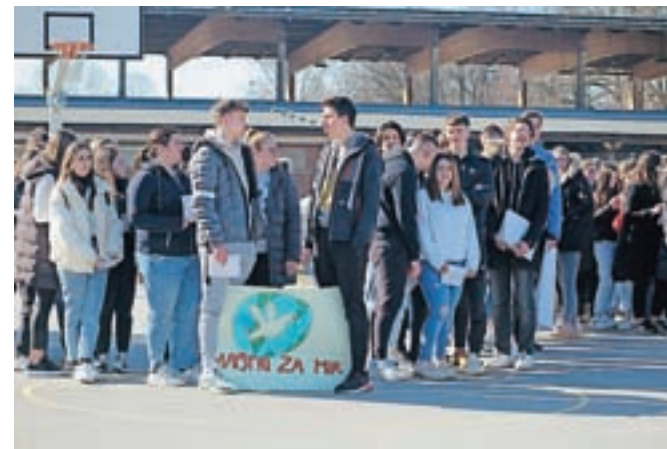
Dijaki Gimnazije in srednje šole Rudolfa Maistra Kamnik so pripravili tudi nekaj transparentov.