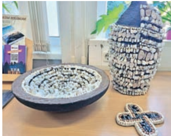
Izdelki študijske skupine Mozaik