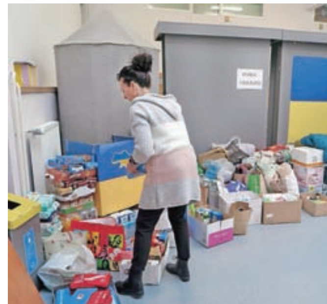
Veliko humanitarne pomoči za Ukrajince so te dni zbrali na Gimnaziji in srednji šoli Rudolfa Maistra Kamnik, zbirajo pa jo tudi Župnijska karitas Kamnik, Rdeči križ Kamnik in druge organizacije.