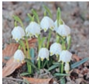
Pomladanski veliki zvonček poznamo tudi pod imenom kronica ali norica.