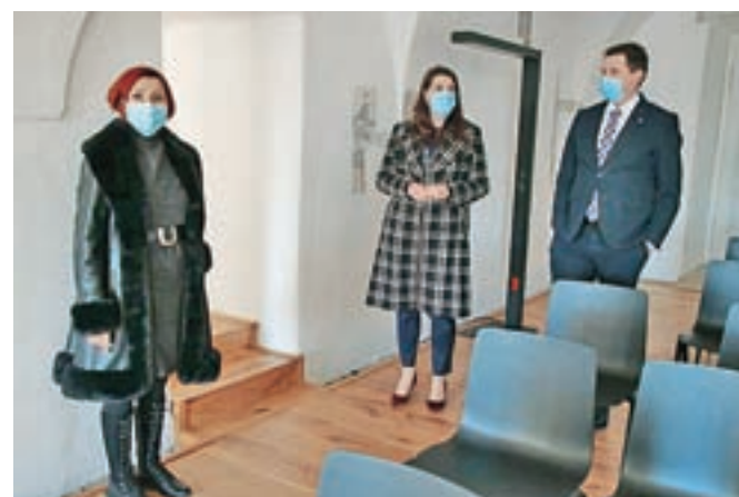
Ministrica dr. Simona Kustec si je v družbi župana in direktorice Zavoda za kulturo Kamnik ogledala prostore Mekinjskega samostana.

Prizidek bo kot ustanoviteljica DSO Kamnik skoraj v celoti plačala država. Naložba je ocenjena na tri milijone evrov, lastni vložek DSO Kamnik pa bo 67 tisoč evrov. Dokončan bo konec letošnjega oziroma v prihodnjem letu.