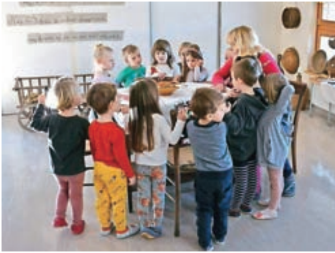
Otrokom smo želeli približati življenje naših prednikov in spoštljiv odnos do hrane.

V našem vrtcu se zavedamo, kako pomembno je, da otrokom privzgojimo spoštljiv odnos do žive in nežive narave, posebno še do hrane, ki je naša dragocena dobrina. Ob tem se sprašujemo, ali je res dobrina, glede na to, kakšen odnos imamo do nje. Otroke smo vzgojiteljice popeljale skozi zgodovino, kakšen odnos so imeli naše babice in dedki do hrane. V telovadnici smo postavile razstavo z naslovom Bilo je nekoč na deželi – Hrana ni za tjavendan . Zbirale smo stare predmete in z njimi otrokom približale življenje naših prednikov v črni kuhinji. Otroke smo seznanile, kakšno vrednost imajo ti predmeti, da jih je nekdo uporabljal in spoštoval več kot sto let, da si jih še zdaj lahko ogledamo in da imajo še danes tako funkcijo kot nekoč. S tem smo otrokom prikazale spoštovanje do kulturne dediščine; če nečesa ne potrebujemo več, ne vržemo kar v smeti. Pred ogledom razstave smo otrokom posredovale jasna