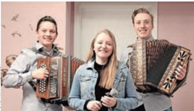
Ob dnevu žena so nastopili tudi člani Ansambla Štos

Program ob jubileju združuje najrazličnejše prireditve, ki se bodo zvrstile vse do konca septembra. Že to nedeljo, 20. marca, pripravljajo Večer poezije in vina, 26. marca prireditve ob materskem dnevu, tradicionalni pohod in piknik bosta 18. junija, še posebno pestro pa bo poleti in jeseni, ko bodo na tridnevni prireditvi izdali in predstavili zbornik ob 70-letnici društva, pripravili premiero komedije Dohodnina v izvedbi mladinske sekcije KD Tuhinj, popoldne za najmlajše s pravljicami na skednju in koncert Andreja Šifrerja s skupino. Prireditve bodo potekale v dvorani na Lazah in na igrišču pred podružnično šolo v Zgornjem Tuhinju.