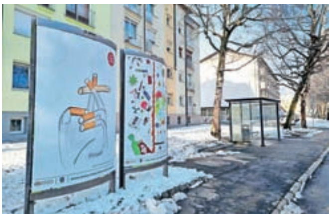
Izbrana dela so objavljena na plakatnih mestih po mestu.