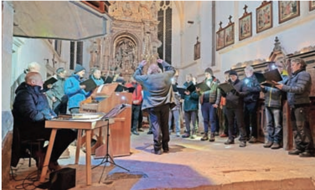
Liraši v cerkvi na Sv. Primožu

Sv. Primož – Letos bi morale biti že 19. po vrsti, pa smo bili lani zaradi ukrepov primorani nastop opustiti. Tokrat smo se potrudili in ob pomoči zvestih poslušalcev in obiskovalcev cerkve sv. Primoža, ki so razumeli, da so ukrepi, ki smo jih izvajali po priporočilih NIJZ ob vstopu in med samim koncertom v cerkvi, potrebni in niso motili prireditve. Pot k sv. Primožu iz Stahovice je bila vse popoldne polna pohodnikov, eni so se odpravljali, drugi pa že vračali s te priljubljene točke Kamničanov in okoličanov. Na tem kratkem vzponu je