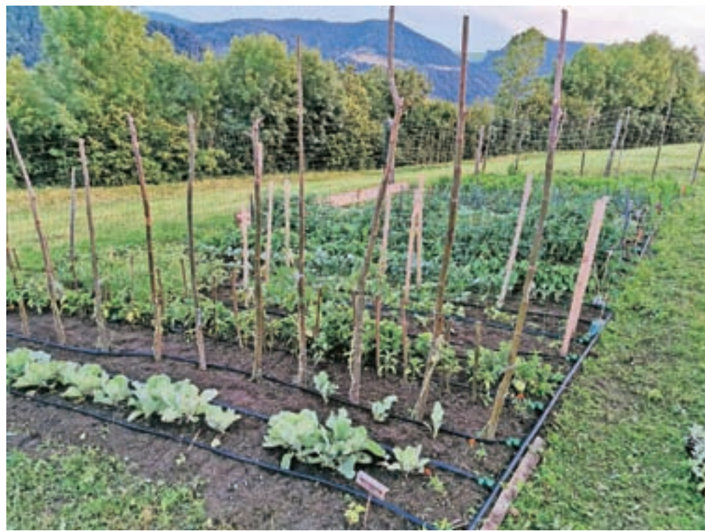
Življenje na kmetiji je težko, a tudi lepo.

In res je tako. Kmetje smo in so pripravljeni prisluhniti in sobivati človeku prijazno, ekološko in zdravo. Če le imajo kupca, pomoč in razumejo potrebo mestnega človeka. In obratno, seveda. Zato le vkup, dragi meščani, postanimo samooskrbni, poskrbimo za svoje zdravje! Poiščite svojega kmeta in mu zaupajte svoje želje in potrebe. Čas se spreminja. Spremenimo ga skupaj na bolje in bolj samooskrbno.