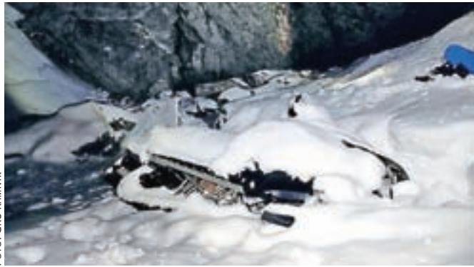
Polomljene motorne sani v jami Vetrnica na Veliki planini

hiš, ne za prevoz ...). Že tako je območje problematično, kar se tiče vode in komunalnih odplak. Sedaj pa še v znameniti vrtači motorne sani, polomljene, polne goriva in olja, kisline iz akumulatorja ... Ne kaže dobro s pitno vodo za Kamnik iz izvira Iverje ... Morda se bo pa kdo od pristojnih le zganil in poiskal lastnika ter ga ustrezno sankcioniral. Ker mislim, da prav nihče v Vetrnico ne more zapeljati po nesreči,« je eden od gorskih reševalcev zapisal na družbenem omrežju.