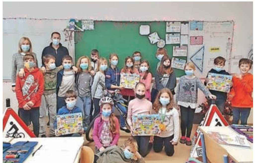
Uporabnih daril se so takole razveselili tudi na Osnovni šoli Toma Brejca.