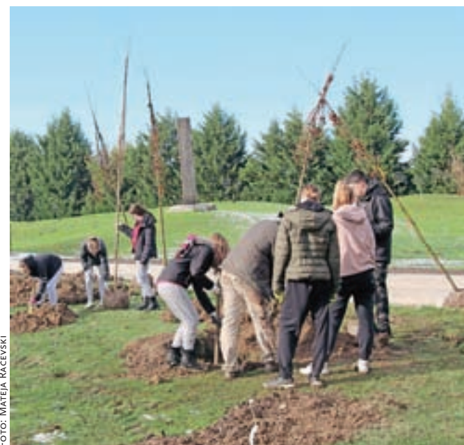
Pri sajenju dreves so v Arboretumu sodelovali tudi dijaki, poskusni nasad pa bo drevesničarjem v pomoč pri načrtovanju sajenja odpornejših drevesnih sort.