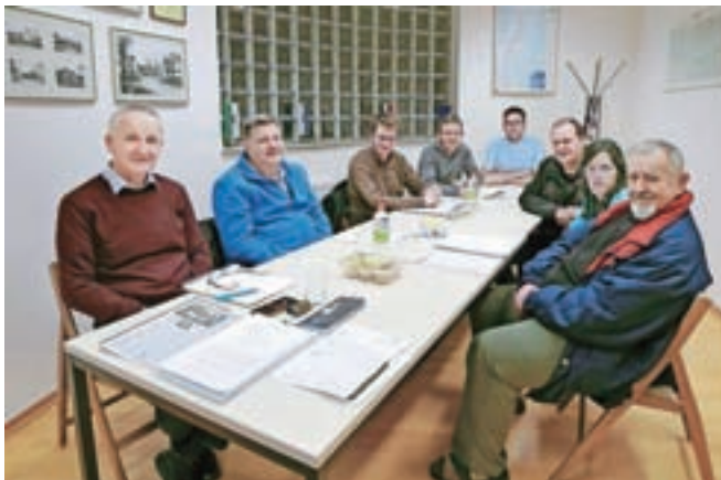
Uredniški odbor v prostorih Krajevne skupnosti Šmarca avgusta 2019