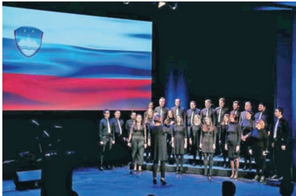
Slovensko himno so zapeli pevci MePZ Odmev Kamnik.

spomeniku tudi položil venec. »Odločitev, da za domovino tvegaš svoje življenje, je žrtev, ki jo vzamejo nase samo največji domoljubi. Zato je moj odnos do tega spominskega kraja prežet z velikim spoštovanjem. Zaradi spoštovanja do naše zgodovine in vseh, ki so trpeli ter izgubili življenje za svobodo in samostojnost, je danes naša naloga, da presežemo delitve in se usmerimo v prihodnost. Bodimo tudi danes tako enotni in hrabri kot takrat. Bodimo odgovorni drug do drugega, ustvarjajmo medsebojno zaupanje ter utrjujmo ljubezen do bližnjega, do doma in do domovine ter s tem krepimo svoje domoljubje,« je dejal minister.