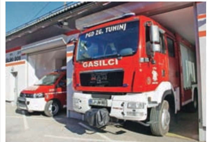
Vozni park PGD Zgornji Tuhinj

Ustanovni občni zbor je vodil Srečko Malenšek, ki je poudaril pomen ustanovitve gasilskega društva za občino. Pojasnil je naloge članov. Opisal je gasilsko območje. Opozoril je, da je bila večina poslopij lesena in s slamo krita. Območje je obsegalo devet vasi, kjer je živelo 932 ljudi v 155 hišah. Vasi so imele 153 hlevov, 136 podov, 144 svinjakov in 75 kašč. Kozolci in manjše lope niso bile vštete.