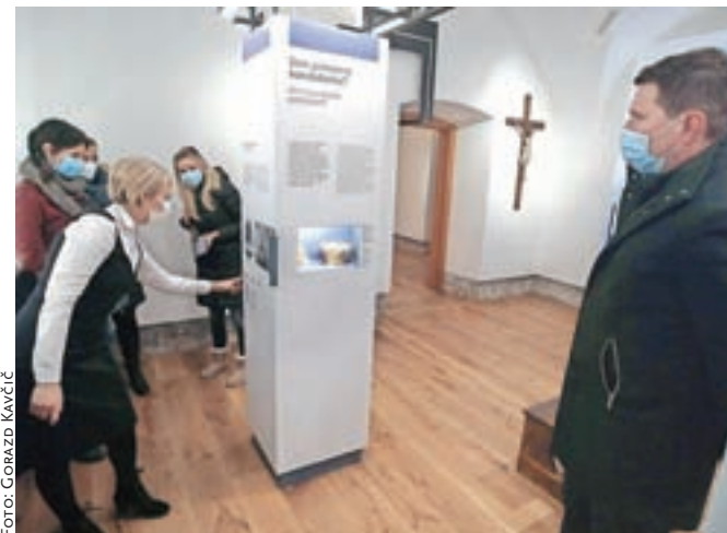
Razstava je interaktivna in zato še bolj poučna.