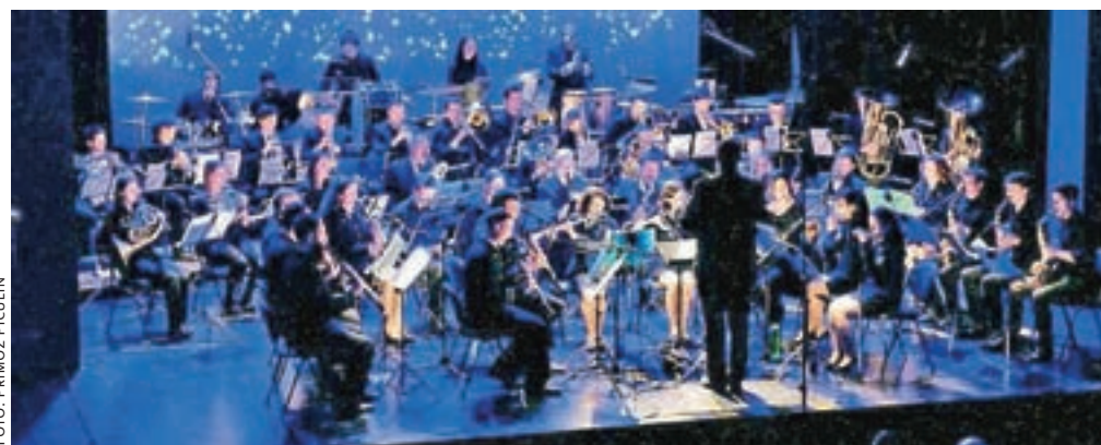
Tradicionalni praznični koncert Mestne godbe Kamnik Na robu (ne)znanega

dnik Mestne godbe Kamnik. Program je med drugim vključeval skladbe iz risank