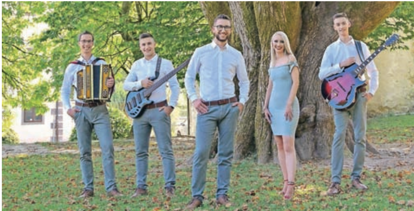
Ansambel Šus

Letos si želimo predvsem nastopov. Pa da izdamo eno ali dve skladbi ter se udeležimo kakšnega festivala.