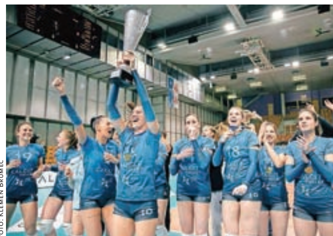
Kamniški odbojkarji pokalne lovorike niso ubranili, so bile pa uspeha zato toliko bolj vesele odbojkarice.