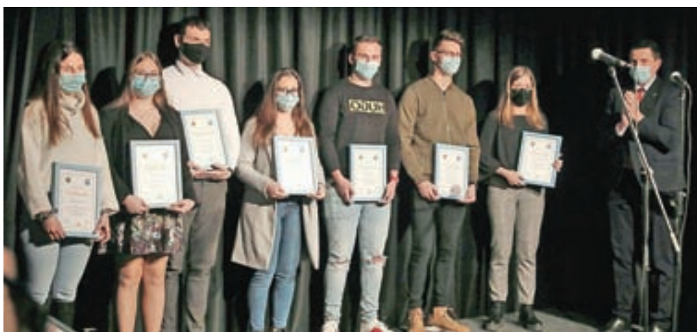
Med prvimi, ki so ob začetku epidemije ponudili svojo pomoč, so bili mladi iz Študentskega kluba Kamnik.

»Hvala vsem vam, ki delate v zdravstvu, šolstvu, policiji, civilni zaščiti, gasilstvu ter v vseh službah zaščite in reševanja; sektorju energetike, prometa, prehrane, preskrbe s pitno vodo, financ, varovanja okolja ter informacijsko-komunikacijskih