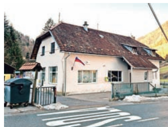
Podružnična šola Gozd v vasi Krivčevo / FOTO: JASNA PALADIN