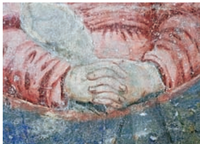
Del novoodkrite stenske poslikave v Mekinjskem samostanu