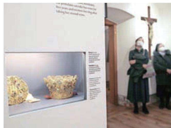
Odprtje muzeja, v katerem je na ogled tudi nekaj res izjemnih predmetov, si je ogledalo tudi nekaj sester uršulink.