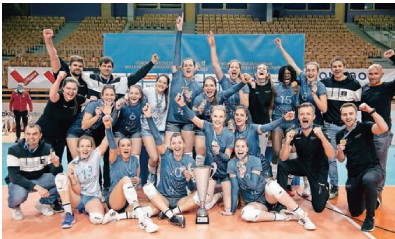
Odbojkarice Calcita Volleyja so osvojile že četrty pokalni naslov.