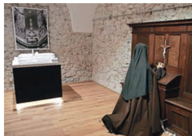
Obiskovalce prevzame podoba klečeče nune iz strogega reda klaris.