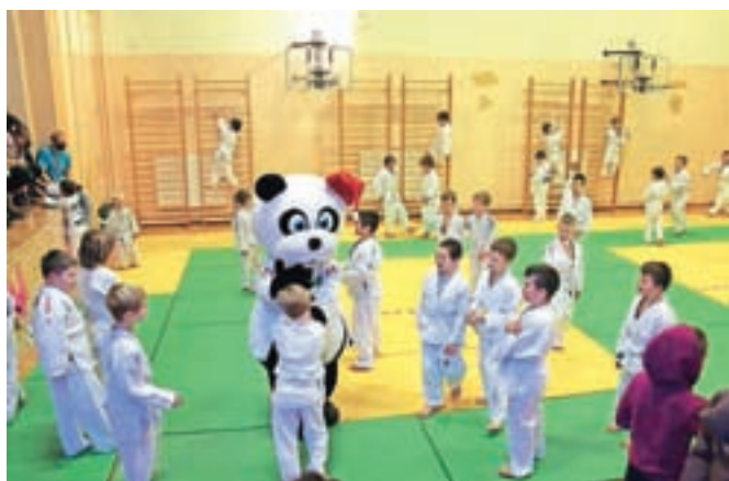
Najmlajši so judo spoznavali predvsem skozi igro.

Med sabo so se borili otroci iz Komende, Kamnika, Trzin, Mengša, Stranj, Šmartnega v Tuhinju, Litije, Ljubljane in celotne Primorske ter navezali tudi nova prijateljstva. Poleg kolajn smo podelili tudi pokale in sklenili sezono 2021 za mlajše sekcije.