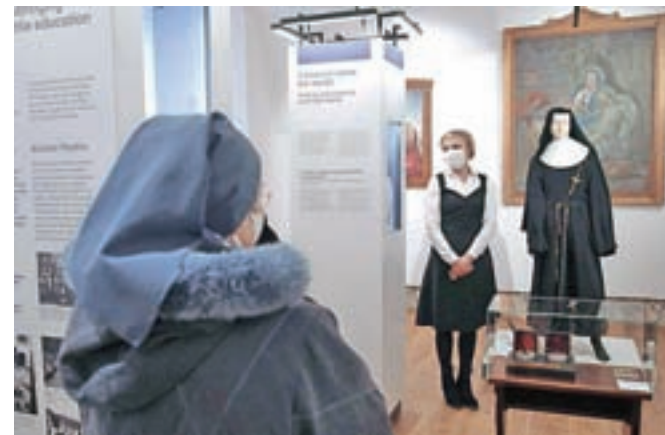
Za zanimivo predstavitev življenja klaris in uršulink je zaslužna avtorica razstave Katarina Mihelič.

Razstavo si je mogoče ogledati po predhodni najavi.