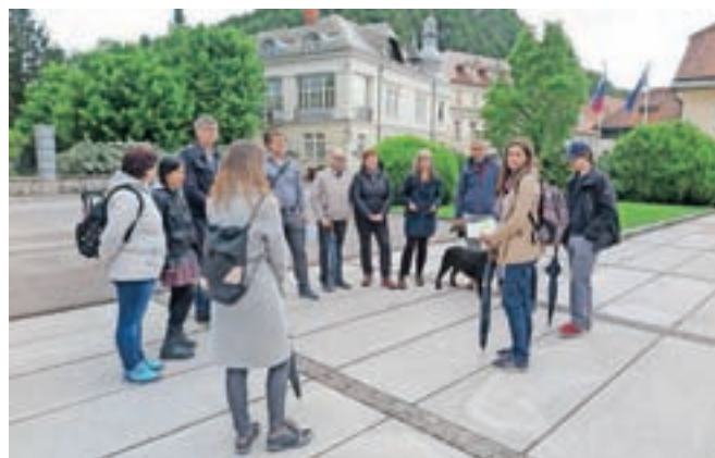
Udeleženci urbanega sprehoda so se ustavili tudi na Trgu talcev in se strinjali, da bi se to površino dalo narediti pešcem in krajanom veliko prijaznejšo.

V nadaljevanju so se podali do Glavnega trga na Šutno in po Šolski ulici do Novega trga, kjer se je druženje zaključilo.