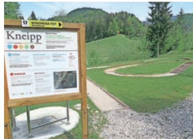
Krajša bosonoga pot je sestavljena iz desetih različnih naravnih podlag.