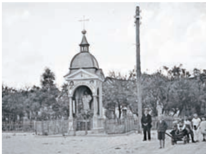
Kapelica Srca Jezusovega leta 1930

kapelic je običajno oltarček, ki vsebuje križ, kip ali sliko, poslikave pa so lahko tudi na zunanji strani fasade. Zaprta kapelica ima v primerjavi z odprto polne tri strani. Medtem ko imajo odprte kapelice polno le zadnjo stran, ostale tri podpirajo polkrožni loki, naslonjeni na prosto stoječa stebriča na prednjih dveh oglih. Zaprta kapelica ima torej odprt le sprednji del, vhod, pa še ta del je navadno zamrežen s kovano ogrado. Vsaka kapelica je posvečena nekemu svetniku, ob zgraditvi ali obnovitvi pa je vedno blagoslovljena, odvisno od navad vaščanov pa se ob posebnih priložnostih ob kapelici odvijte tudi sveta maša.