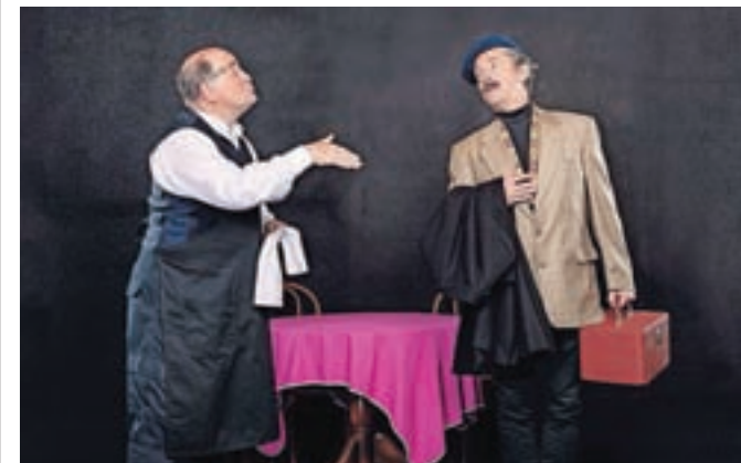
V predstavi Lepo je biti muzikant II nas bo navduševala znana igralska ekipa.