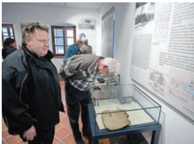
Na razstavi je na ogled nekaj zanimivih osebnih predmetov Maistrovih borcev.

gaju in drugih generalih, a ti moške so zase vedno uporabljali izraz Maistrovi borci. Seznam borcev za severno mejo iz nekdanjih občin Kamnik in Domžale je bil prvič podrobneje sestavljen leta 1979, ko je imena zbral Jan-ko Kuster. Na njem je bilo nekaj manj kot sto imen, še nekaj so jih dodali v sklopu tokratne razstave. »Gotovo