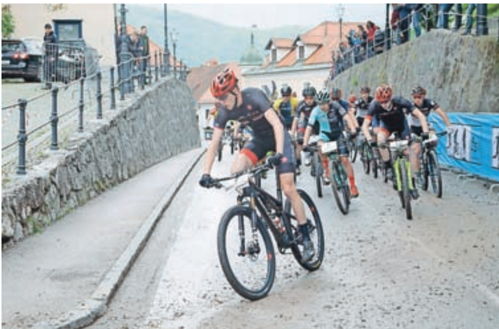
Start in cilj krosa je bil kot po navadi v središču Kamnika.