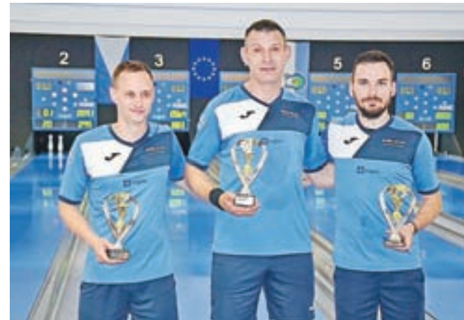
Najboljši trije v moški ...

V četrtek so bile na sporedu še borbene igre med ekipami, ki so nastopale v občinski ligi. Tekmovalstvo poteka tako, da vsaka ekipa nastopa s šestimi igralci plus rezerva. Igra se samo na čiščenje. Vsak igralec ima na voljo tri lučaje v enem setu, skupaj torej osemnajst lučaje za ekipo. Na vsaki stezi se odigra dva seta, sku-