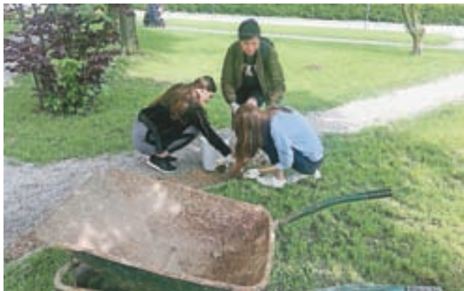
Dijaki so med drugim čistili in urejali okolico šole, odstranjevali plevel in sadili rože.

Kamnik – Na Gimnaziji in srednji šoli Rudolfa Maistra Kamnik smo v soboto, 11. maja, kot že vrsto let poprej priredili eko dan. Letošnji je potekal v doslej najširšem obsegu, aktivnosti pa so se odvijale v šoli, njeni ožji in širši okolici, v Arboretumu Volčji Potok ter v Ljubljani. Dijaki vseh letnikov so se z okoljsko problematiko spopadali na več načinov: z ogledom zgovornega filma Zelena laž in pripravo refleksije le-tega, pri kateri so poskušali odgovoriti na vprašanje – ali obstaja upanje za nas, z različnimi predavanji in številnimi delavnicami na temo prenaseljivosti, plastike, prehrane ali vnovične uporabe. Dijaki so sodelovali tudi na predavanjih in delavnicah v izvedbi Instituta Jožef Stefan, društva Humanitas in Zavo-