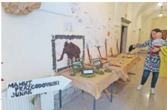
Otroci so ustvarjali tudi na temo neveljskega mamuta ...