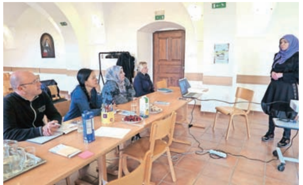
Kulturni mediatorji bodo tudi v občini Kamnik pripomogli k lažjemu in učinkovitejšemu vključevanju priseljencev v lokalno okolje.

Številne aktivnosti, ki bodo pripomogle k temu, so zbrane v okviru projekta PlurAlps. Gre za mednarodni projekt v okviru programa Območje Alp, ki se približno leto dni izvaja tudi v občini Kamnik. Slovenski partner pri tem projektu je Urbanistični inštitut RS, njegovo izvajanje sofinancirata Evropski sklad za regionalni razvoj prek Interregovega programa za območje Alp in nemško Zvezno ministrstvo za okolje, varstvo narave, gradnjo in varnost reaktorjev. Namen projekta PlurAlps je razvijati in spodbujati kulturo, ki je naklonjena sprejemu priseljencev, ter izboljšati znanje in ozaveščenost o vključevanju vseh priseljencev v alpskih območjih ter izboljšati ozaveščenost javnosti o pozitivnih učinkih pluralizma.