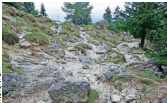
Stara gonska pot na Malo planino pred popravilom