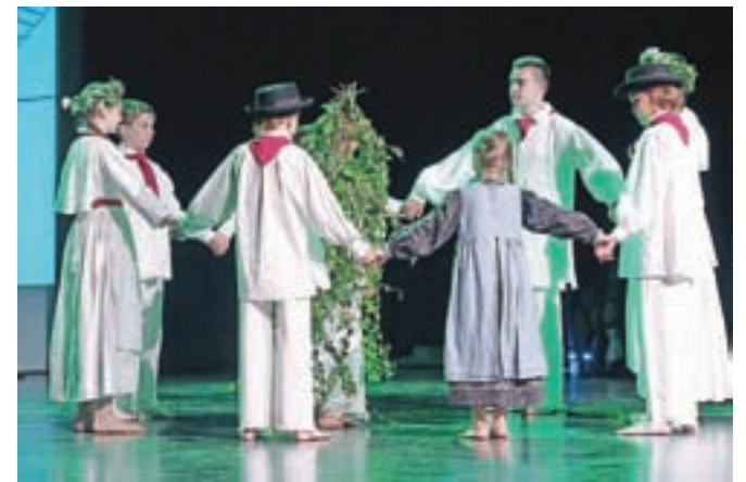
Ena od plesnih točk v predstavi je prikazala tudi belokranjski ljudski običaj Zeleni Jurij.