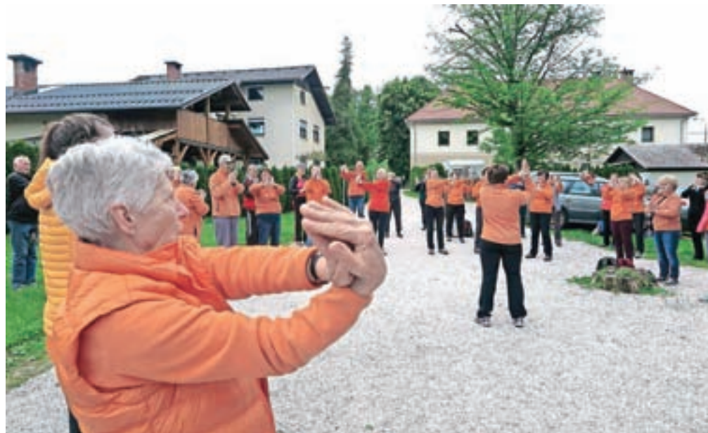
Člani Šole zdravja telovadijo vsako jutro ne glede na vreme.