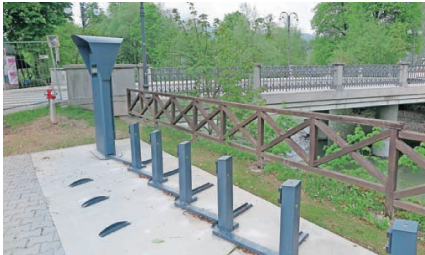
Ena od postaj sistema Kamkolo je tudi na glavni avtobusni postaji.

V Kamniku bo junija zaživel sistem izposoje električnih koles, ki se je v številnih mestih izkazal kot koristno alternativno prevozno sredstvo. Uporaba koles bo za občane brezplačna, potrebna pa bo registracija. Projekt je podprt z evropskim denarjem, občina pa ga v prihodnje namerava še nadgraditi in povezati s sosednjimi občinami.