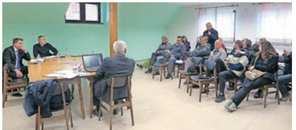
Krajani Godiča so nezadovoljni s prometno ureditvijo na cestah, ki vodita do Slovenia Eco resorta.