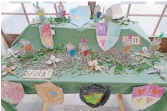
... in srednjega veka, ki so ga spoznavali na kamniških gradovih.

nem muzeju Slovenije) in življenje naših prednikov v pradavnini. Najmlajši so ob sprehoju skozi mesto tudi