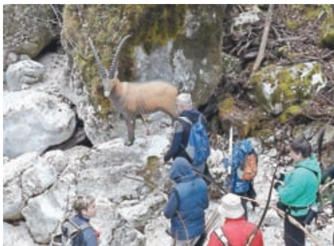
Nekatere tarče so bile postavljene v sami strugi hudournika, druge je bilo treba zadeti skozi luknjo med dvema balvanoma.

plini. Prijavljenih je bilo 160 lokostrelcev iz Slovenije, Italije, Avstrije, Hrvaške in Srbije. To število zgovorno pove, da je to ena najlepših tekem v pokalu tradicionalnih lokov. Vsaj tako so komentirali tekmovalci po končani tekmi. Med njimi je bil tudi par najstarejših legend lokostrelstva Dora in Aci Oblak. Aci je tudi svetovno priznani izdelovalec instinktivnih lokov. Oba pa se lahko pohvalita z odličnimi uspehi z evropskih tekmovalcev v disciplini 3D.