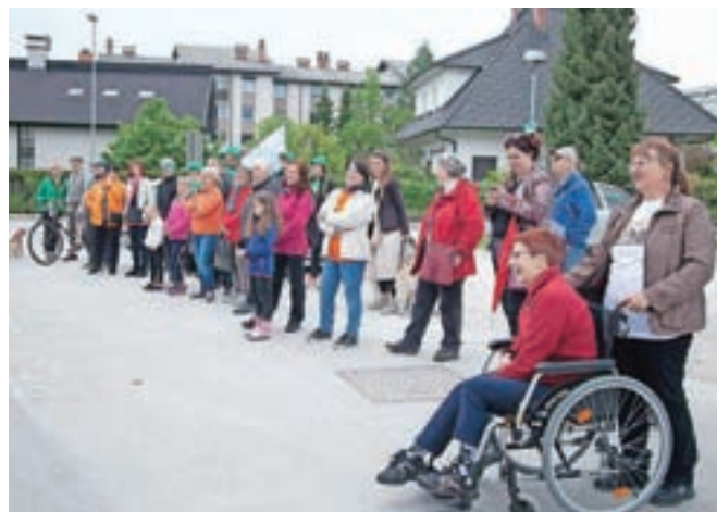
Udeleženci Pešbusa med ogledom plesne točke plesalk Šinšina

Perovo – Perovanje, prireditev, namenjena druženju krajanov lokalne skupnosti Perovo, je letos potekalo že osmič. Obiskovalci so na igrišču med bloki na Zikovi ulici lahko šahirali z Inti Maček, se preizkusili v gibalnih in družabnih igrah, sodelovali na turnirju v namiznem tenisu in brali pod krošnjami. Del obiskovalcev pa se je pod vodstvom Majde iz Mengša in Žabcev iz Tunjic s Pešbusom odpravil na ogled Perovskih znamenitosti, dokler jih ni dež pregnal v zavetje gasilskega doma, kjer so jim svoje delo predstavili prostovoljni gasilci. Tudi letos so Perovanje