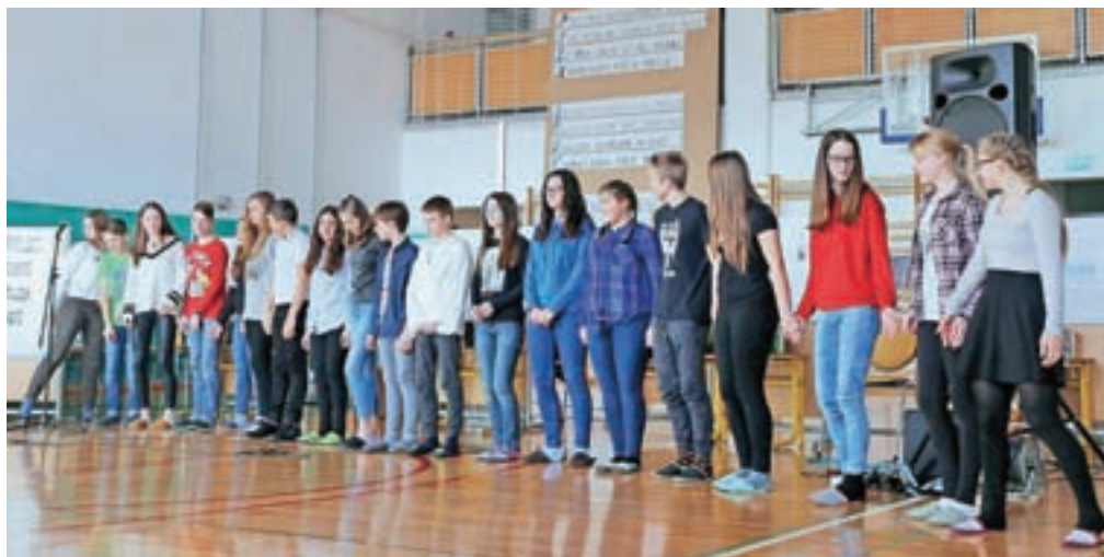
Sodelujoči na šolski prireditvi ob kulturnem prazniku

Z medpredmetnim povezovanjem slovenščine, zgodovine, etike in državljanske vzgoje ter likovnega pouka so osmošolci Osnovne šole Stranje v počastitev kulturnega praznika izdelali odlične plakate.