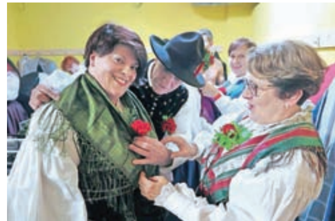
Ob poskočnih vižah so zaplesali člani Folklorne skupine Kamnik, ki smo jih takole ujeli pri zadnjih pripravah na nastop.