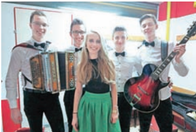
Vabilu organizatorjev za nastop na koncertu so se odzvali tudi mladi iz Ansambla Šus, ki povečini prihajajo iz Tuhinjske doline.

Koncertu, ki ga je povezovala Maja Oderlap, pa je sledila zabava s plesom do poznih nočnih ur.