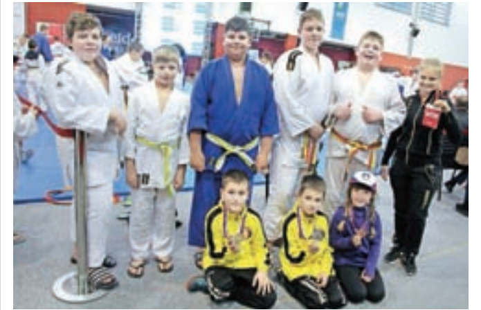
Komendski judoisti z medaljami