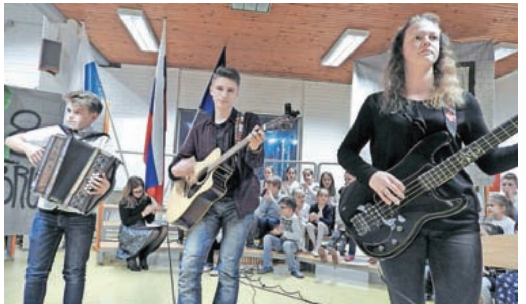
Z deklamacijami Prešernovih pesmi, plesom in glasbenimi točkami so se predstavili učenci razredne in predmetne stopnje.

Kamnik – Za mnoge je branje samoumevno in ti ne potrebujejo prav nobene spodbude. Med raznolikimi, zelo privlačnimi možnostmi za preživljanje prostih uric izberejo tudi obisk knjižnice in branje. Po dolgem dnevu, natrpanem s šolskimi in obšolskimi dejavnostmi, pa je velikokrat lažje kot po knjigi poseči po kateri od elektronskih naprav, ki od nas zahtevajo manj pozornosti in aktivnosti. Drsanje s prstom po ekranu pa je vendarle precej samotno početje. Če ga starši zamenjamo za listanje po knjigi, bomo veliko dobrega naredili zase, za svoje možgane in duha, predvsem pa za svoje otroke, ki po nas povzemajo navade in se od nas učijo. Izkaznica, ki jo družina prejme ob vključitvi v projekt, skozi vse šolsko leto otroke in starše povezuje tudi kot bralce. Družinski člani v razpredelnico vpisujejo naslove prebranih knjig, otrok pa izkaznico prinese v šolsko ali splošno knjižnico, kjer knjižničarke prebrano potrdimo z žigom. In veste, kako so otroci ponosni na starše! Branje pa je samo ena od »nalog«, ki jo morajo opraviti družine, ki želijo ob koncu šolskega leta prejeti priznanje. Podati se morajo na