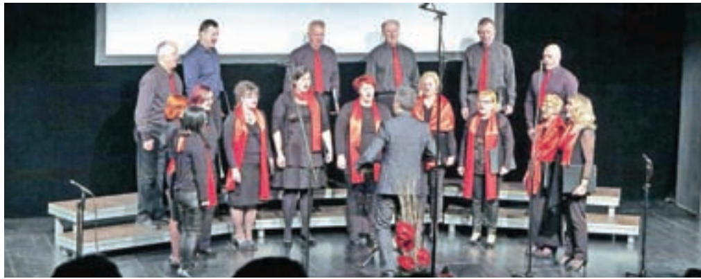
Mešani pevski zbor Mavrica Srednja vas