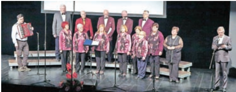
Čeprav jih je zdesetkala bolezen, so se predstavili tudi pevci Mešanega pevskega zbora DU Kamnik.

Kamnik – Zamisel za pevsko revijo odraslih zborov se je v Kamniku porodila leta 1979 ob praznovanju 750-letnice mesta in že naslednje leto so pobudo uresničili. »Sistematično ukvarjanje z zborovsko glasbo kot najbolj razširjeno obliko ljubiteljske kulturne dejavnosti v Sloveniji, v katero je vključenih več kot 60 tisoč pevcev, izhaja iz dolgoletne tradicije in tudi v našem prostoru več kot odstotek prebivalstva v obeh občinah aktivno deluje v pevskih zborih. Na javnem skladu RS za kulturne dejavnosti območno revijo organiziramo že od leta 1998 in vseskozi spodbujamo zборе, vrednotimo njihove dosežke in pripravljamo kakovostne izobraževalne programe,« je zbrane v Domu kulture Ka-