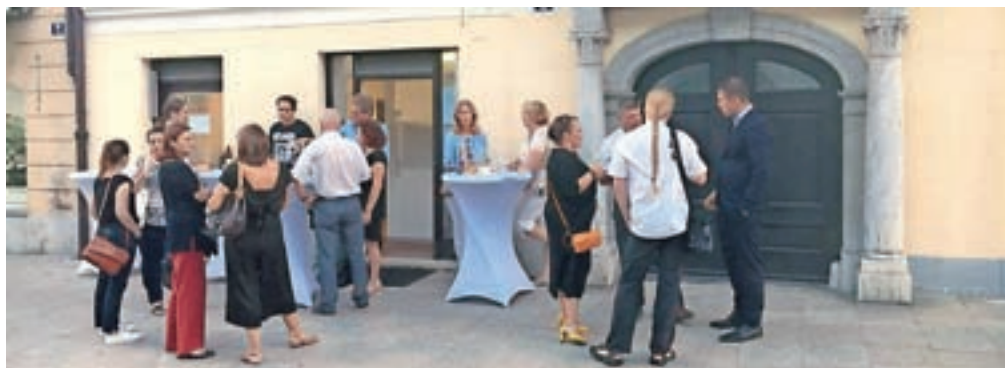
Arkada psihoterapija ima svoje prostore na Šutni.