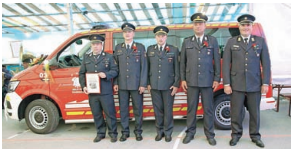
V Selah pri Kamniku so slovesno prevzeli novo gasilsko vozilo.