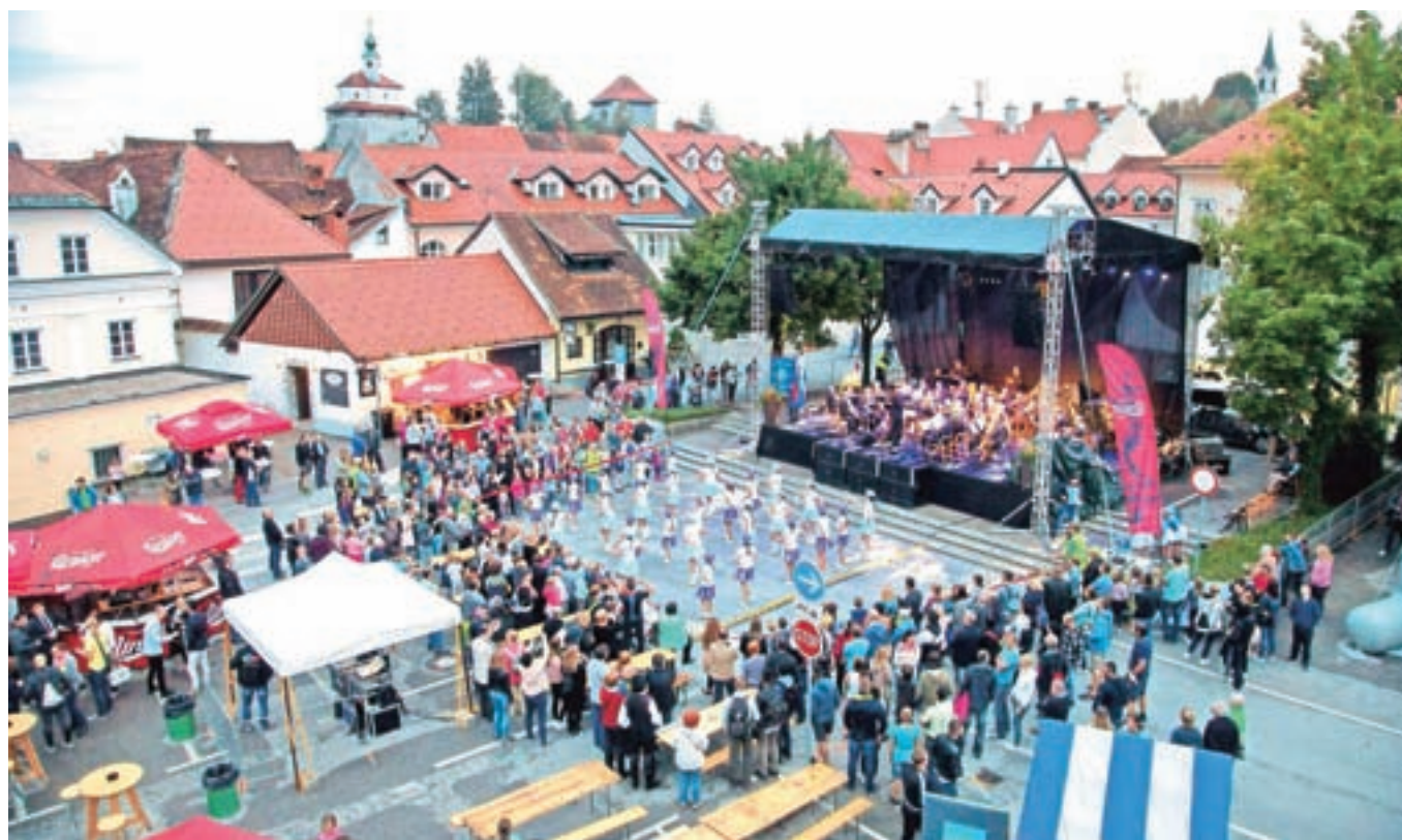
Glavni oder je bil letos na Trgu prijateljstva.

Dneve narodnih noš in oblačilne dediščine so letos zaznamovale štiri strokovne razstave ter pestro spremljevalno dogajanje, vrhunec pa je predstavljala povorka s skoraj dva tisoč udeleženci v narodnih nošah.