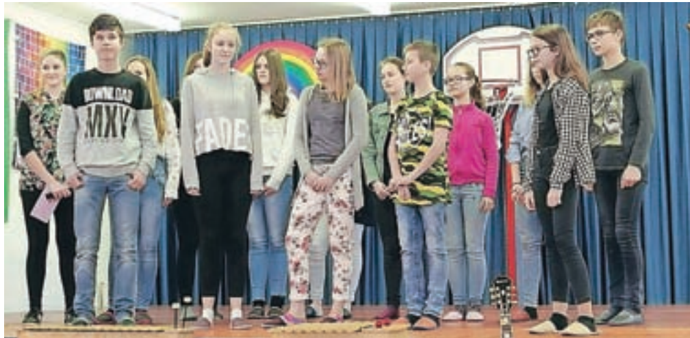
Mladinski pevski zbor

Vsak izmed petih tekmovalcev je namreč vsaj v enem od štirih skokov prejel zelo visoko sodniško oceno 9,7 ali celo 9,8. To pomeni, da je izvedel skok, ki je bil visok, tehnično in estetsko dovršen ter ga je skakalec tudi zaključil z zanesljivim doskokom.