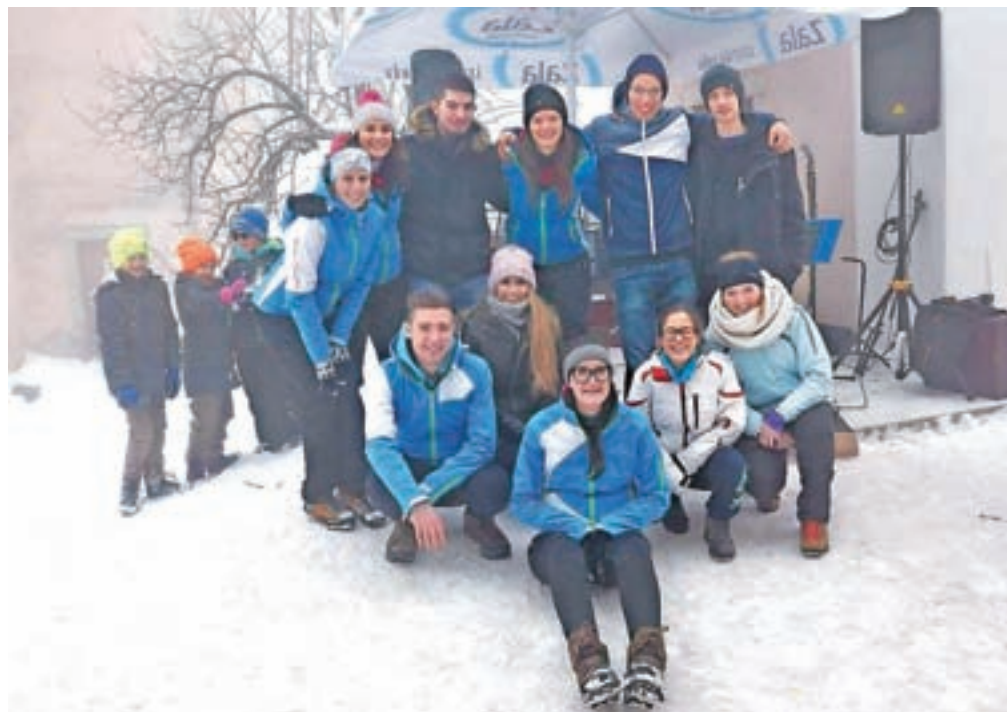
Člani Študentskega kluba Kamnik so samo s Pohodi na Sv. Primoža zbrali več kot 1700 evrov.