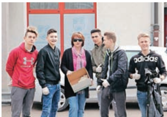
Dijaki prvih in drugih letnikov so čistili okolico šole.

vali pri zbiranju odpadnega papirja, odnašali odsluženo šolsko opremo iz šol-