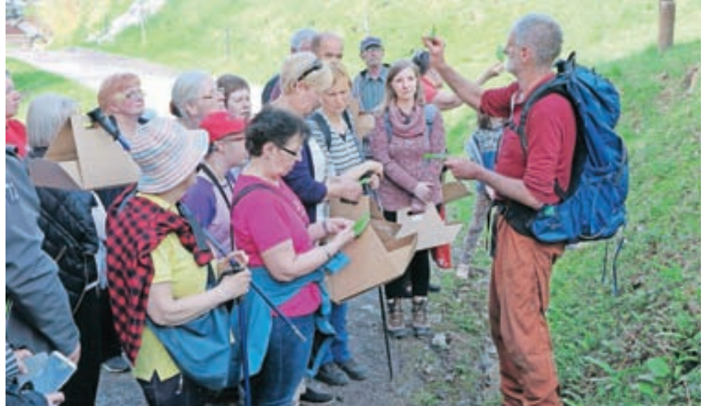
Spoznavanje samoniknih rastlin in nabiranje čemaža v okolici term

»Z izvedbo prvega Festivala čemaža smo lahko več kot zadovoljni, zagotovo pa bo več ljudi prihodnje leto, ko bo dogodek še bolj prepoznan. Za nas je najpomembnejše, da čemaž – darilo narave, ki raste v okolici naših term – predstavimo in vključimo v naše dogajanje in ga poneseemo v širšo uporabo,« je bil v soboto zadovoljen