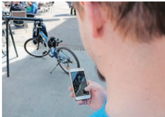
Udeleženci dogodka so lepote Kamnika odkrivali preko pametnih telefonov.

Kamnik je nedavno gostil več kot 150 ljubiteljev igre Ingress iz dvanajstih držav, ki so kamniške znamenitosti spoznavali skozi misije v mobilni aplikaciji.