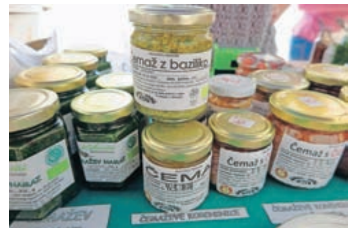
Čemaž postaja vse bolj priljubljen v kulinariki, a previdnost pri nabiranju ne bo odveč!