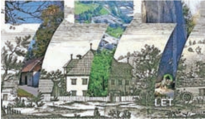
Ilustracija Dušana Sterleta ob 777. obletnici prve omembe Perovega

Tradicionalno Perovanje bo 5. maja od 15. do 19. ure na Perovem.