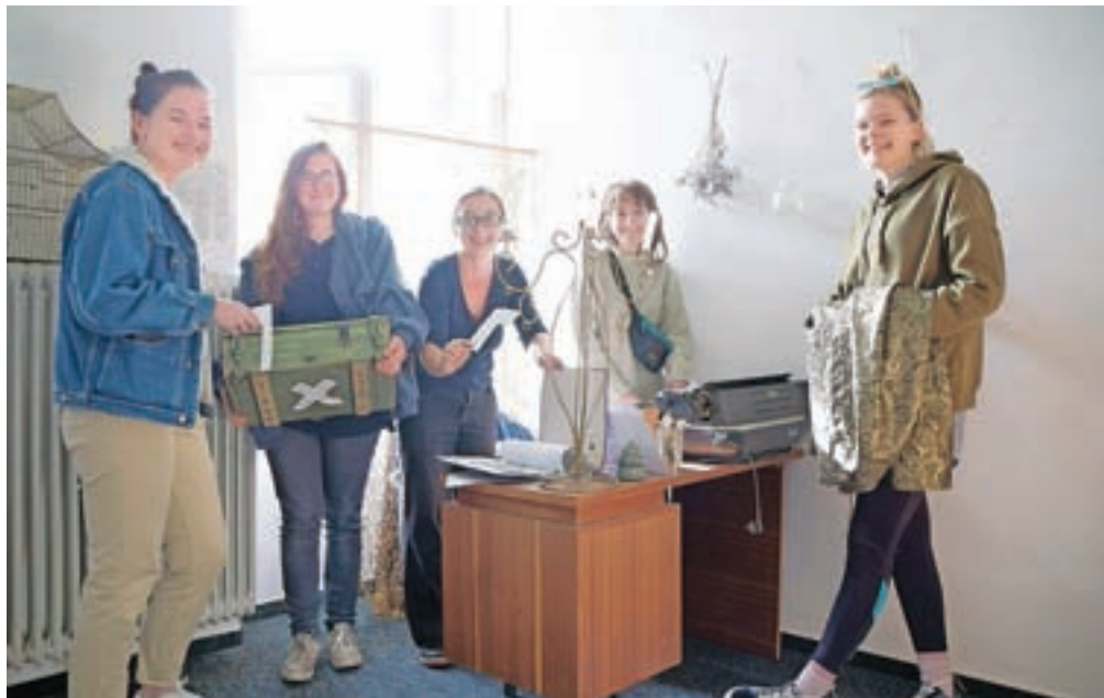
Ustvarjalke sobe pobega v Katzenbergu