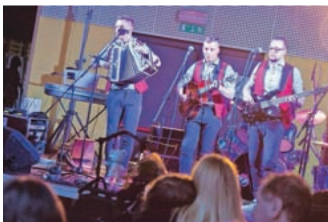
Izkupiček koncerta je ob dobri udeležbi obiskovalcev znašal slabih osemsto evrov.