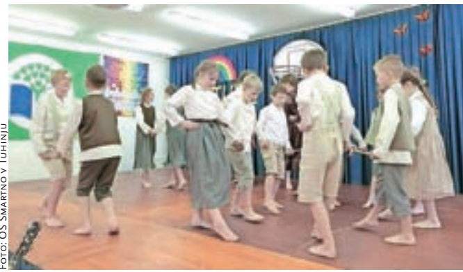
Učenci interesne dejavnosti Ljudski plesi in igre

Šola Šmartno učencem ponuja pester izbor obšolskih dejavnosti in jim s tem nudi možnost ustvarjanja na različnih kulturnih področjih (glasbenem, gledališkem, lutkovnem, folklornem, plesnem, likovnem, literarnem ...), na šoli redno prirejamo kulturne dogodke za učence, starše in širšo javnost. Leta 2011 se je šola prijavila na javni poziv za pridobitev naziva kulturna šola, kjer je bila uspešna in prejela naziv za pet let. Leta 2015 je uspešno prestala postopek obnovitve naziva, ki