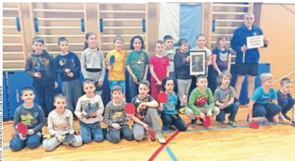
Najboljši mladi igralci Kamnika do enajst let na turnirju v OŠ Marije Vere

Naslednje tekmovanje v organizaciji in izvedbi Namiznoteniškega kluba Kamnik bo občinsko prvenstvo v treh starostnih kategorijah. Igralci do 40 let, od 40 do 60 in nad 60 let se bodo pomerili v OŠ Marije Vere v nedeljo, 22. aprila, z začetkom ob 9. uri.