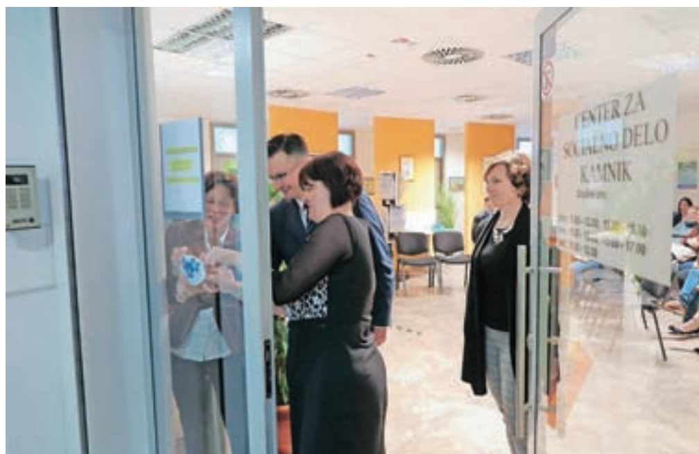
Demenci prijazno točko označuje znak s tremi spominčicami, ki je zdaj nameščen tudi na vratih Centra za socialno delo Kamnik.

»Vsi vemo, kaj je demenca. To je, preprosto povedano, ko ne veš, kdo si in kam si namenjen. Vsi vemo, da demenca lahko zagriže v življenje vsakogar izmed nas – če ne neposredno, pa posredno, ko zagriže v življenje koga naših bližnjih. Svojci so ob večletni skrbi za bolnika izpostavljeni velikim psihičnim, fizičnim in čustvenim obremenitvam in izgorevanju, zato potrebujejo ustrezne informacije, znanje in podporo. Osebe z demenco so pogosto v stiski, se izgubijo, ne znajo priti domov, ne prepoznajo okolice, v kateri živijo. Prav temu so namenjene demenci prijazne točke, ki v lokalnem okolju pripomorejo k razumevanju oseb z demenco in njihovih svojcev in jim tudi nudijo pomoč.