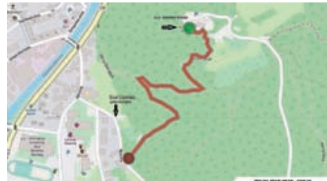
Trasa teka za osnovnošolce