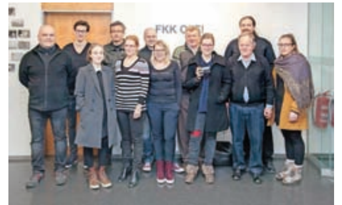
Sodelujoči člani na razstavi FKK OFF!

V kamniškem fotografskem društvu sicer aktivno deluje od 15 do dvajset članov, ki jim je poleg temnice na voljo tudi dobro opremljen studio, v povezavi s Knjižnico Franceta Balantiča Kamnik pa nekaj sto enot knjižnega gradiva s področja fotografije. Vsako leto pripravijo več delavnic, predavanj in organizirajo ekskurzije po Sloveniji in tudi v tujino. Tudi letos bodo sledili začrtanim smernicam in ponovno sodelovali na bienalu sodobne fotografije Fotonični trenutki, ki ga organizira Center za sodobno fotografijo Photon v Ljubljani.