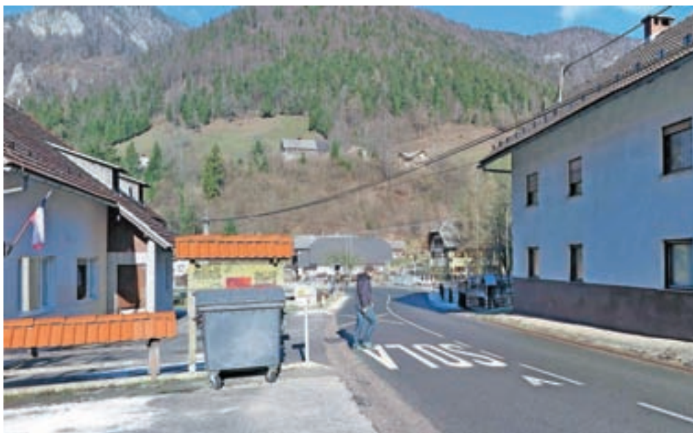
Cesta pri Podružnični šoli Gozd nima prehoda za pešce, zato je prečkanje na tem delu za pešce zelo nevarno.

Ali gre zares za zapostavljanje krajanov doline Črne, smo povprašali tudi predsednika Krajevne skupnosti