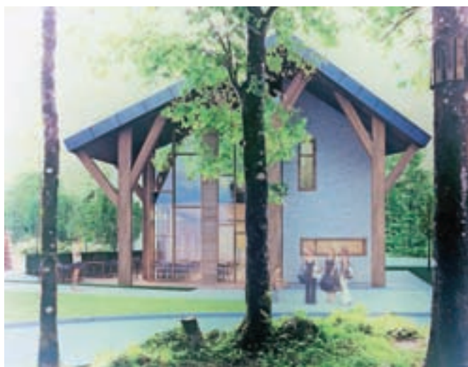
Kdaj naj bi se gradnja začela, še ni znano, saj mora družba Velika planina najprej dobiti gradbeno dovoljenje.