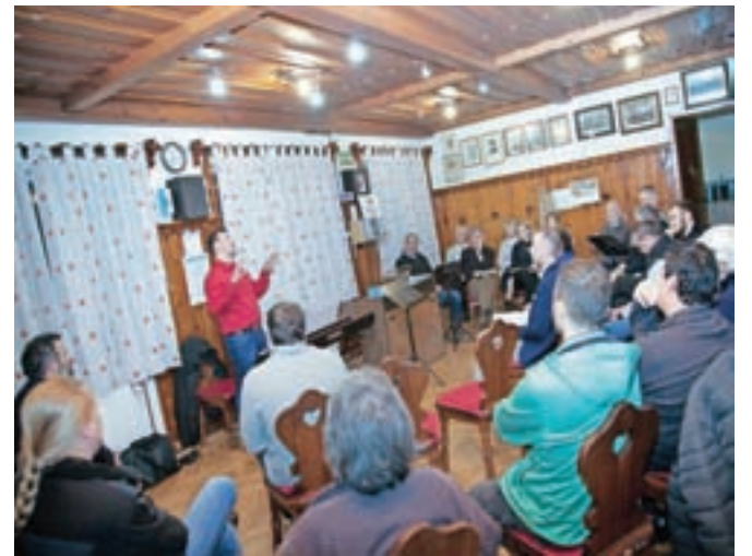
Na konferenci se je zbralo kakšnih dvajset predstavnikov kamniških kulturnih društev.