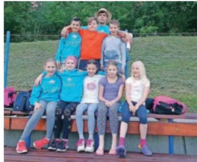
Najmlajši kamniški plavalci na tekmah v Radovljici