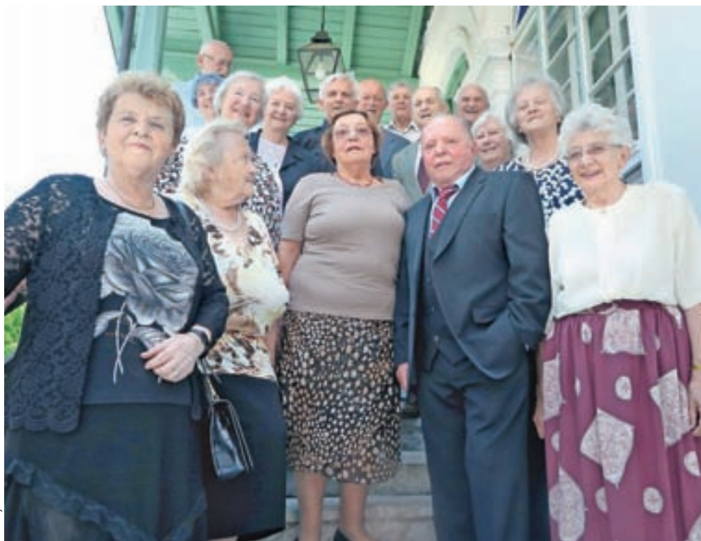
Nekdanji sošolci, ki so maturirali leta 1957, so se zbrali v Prašnikarjevem dvorcu.