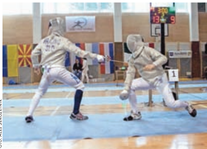
Sabljanje pridobiva priljubljenost tudi v Kamniku.