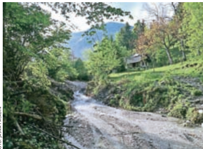
Hudournik Bistričica so visoke vode že večkrat močno poškodovale, utrjena struga bo poplavno varnost izboljšala.