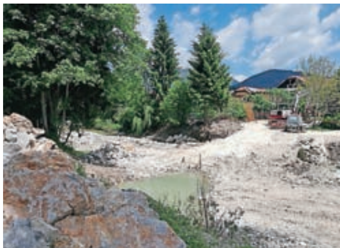
Sanacija v lanskoletnih poplavih poškodovanega pragu v strugi Kamniške Bistrice / FOTO: JASNA PALADIN

Direkcija RS za vode pa se je lotila tudi sanacije hudournika Rožiček v Selah pri Kamniku, ki bo prav tako končana že junija. Delavci Hidrotehnika bodo strugo očistili, odstranili sipine, utrdili brežine in podporne zidove ter namestili pragove.