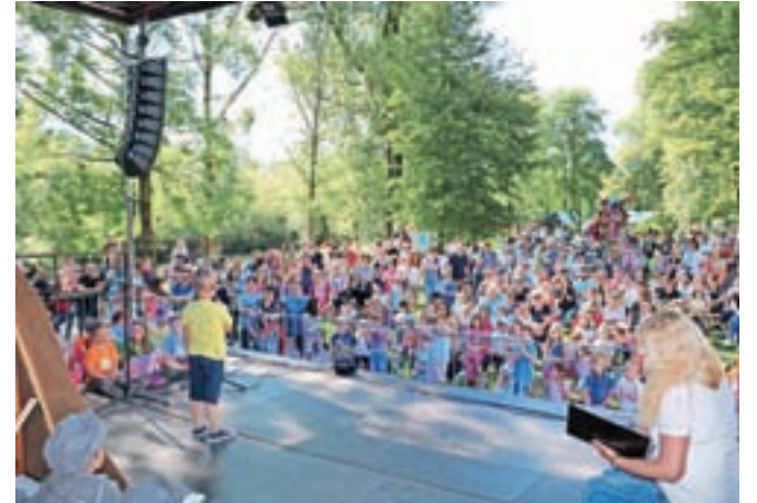
Veronikin festival je v dveh dneh privabil približno 2500 otrok in njihovih staršev.

Zavod za turizem, šport in kulturo Kamnik in Vrtec Antona Medveda Kamnik sta konec maja organizirala zdaj že tradicionalni Veronikin festival, ki je prvič potekal dva dni in na novi lokaciji v Keršmančevem parku.