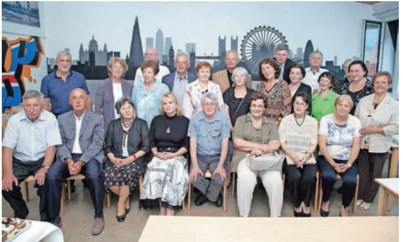
Generacija maturantov iz leta 1967 z učiteljicami / FOTO: ALEŠ SENOŽETNIK

In o čem teče beseda na takšnih obletnicah? »Na prvih obletnicah smo se pogovarjali o prvih zaposlitvah, stanovanjih oziroma hišah, pohištvu in denimo tem, koliko kvadratnih metrov tapisona ima kdo, nato so bili v ospredju naši otroci, ko smo bili malo starejši, smo že več potovali in si pripovedovali o dogodivščinah z različnih