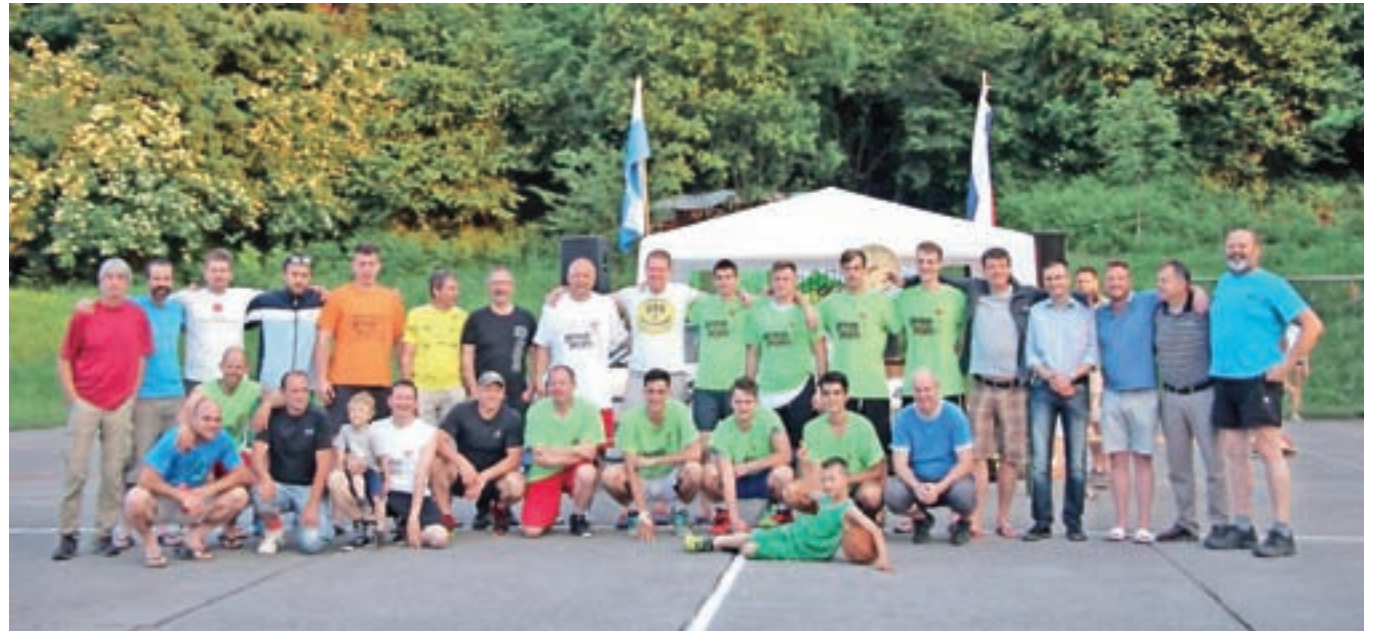
Igralci obeh ekip po koncu tekme

V soboto, 3. junija, se je na športnem igrišču na Vrhpoljah odvijala tradicionalna 12-urna košarkarska tekma med ekipama Vrhpolj in Stranj. Letošnja tekma je bila jubilejna, saj mineva trideset let od prve odigrane tekme.