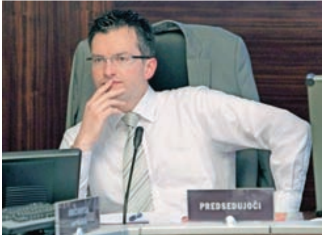
Marjan Šarec

Šarec, ki bo konec leta dopolnil štirideset let, nam je nato potrdil, da njegova odločitev ni od včeraj, o menjavi generacij na najvišjih funkcijah pa: »Oni so svoje pokazali, zdaj smo na vrsti mi.« Kandidiral bo ob podpori Liste Marjana Šarca, kaj pa njegova odločitev po-