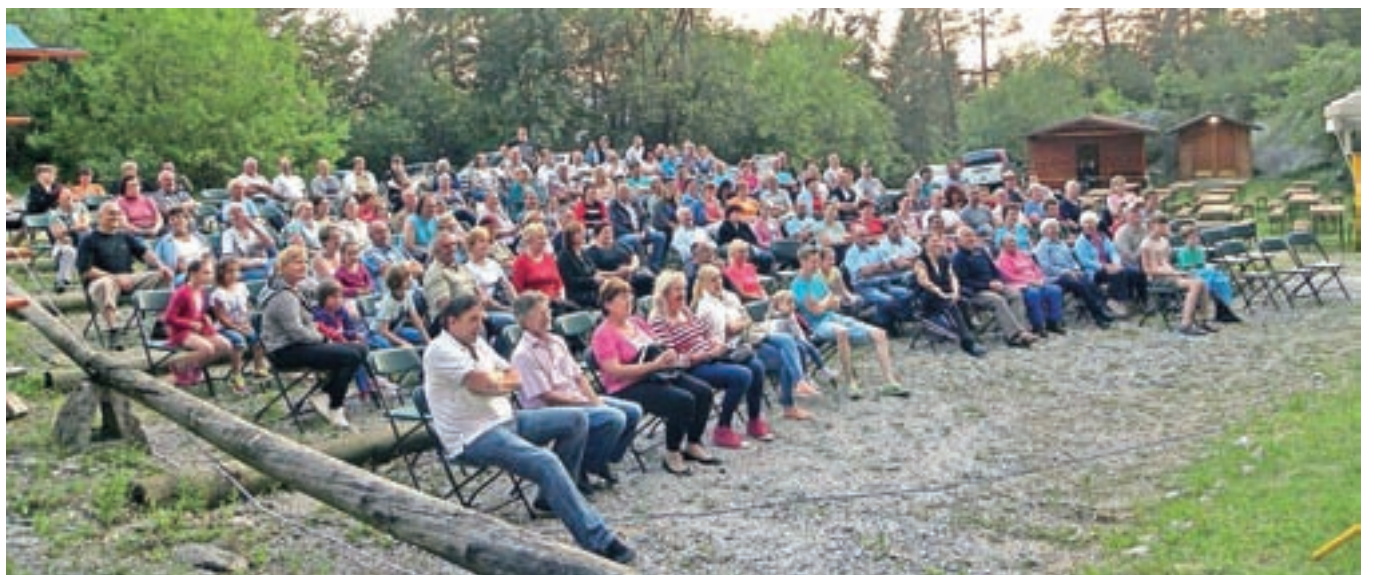
Letno gledališče Gradišče v Tuhinju bo v začetku julija znova polno.

Premierno si boste predstavo lahko ogledali v začetku julija (7. in 8. julija ob 20. uri ter 9. julija ob 18. uri), in sicer v letnem gledališču Gradišče v Tuhinju. Za pijačo in jedačo bo poskrbljeno. Vsekakor pa bodo od septembra dalje potekale tudi ponovitve, zagotovo bo kakšna v bližnji okolici. Pristrčno vabljeni v domače okolje, da se skupaj poveselimo in se za trenutek odmaknemo od težav vsakdana. Iskren nasmeh in aplavz sta največja nagrada za nastopajoče.