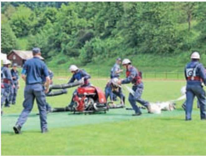
Mekinjski stadion je bil minuli konec tedna v znamenju gasilcev.

jana Šarca prejele pokale, rezultati za prostovoljna gasilska društva iz GZ Kamnik pa so naslednji: pionirji: 1. Srednja vas, 2. Špitalič in 3. Šmartno v Tuhinju 1; pionirke: 1. Špitalič, 2. Srednja vas in 3. Šmarca; mladinci: 1. Sela, 2. Kamnik in 3.