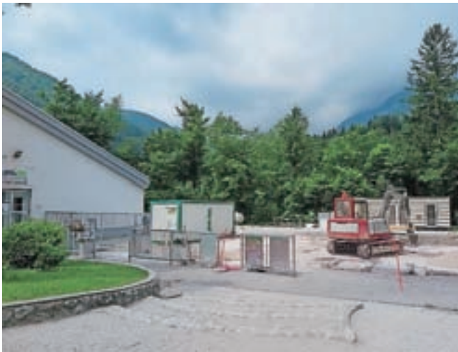
V požaru močno poškodovani objekt so delavci že porušili, na njegovem mestu bodo postavili novega.

Takoj po požaru, ki je objekt skoraj v celoti uničil, prav tako sistem za prodajo vozovnic, so v družbi nabavili nov zabojnik, v katerem so si uredili začasne pisarne za upravo družbe, ter uredili zabojnik za prodajo vozovnic, tako da dostop na planino ni bil moten. Družba je pred dnevi, 19. maja, prejela gradbeno dovoljenje za rušitev, ki so jo delavci izbranega izvajalca v teh dneh že opravili. »Objekt je bil zgrajen leta 1963 in skupaj z lastni-