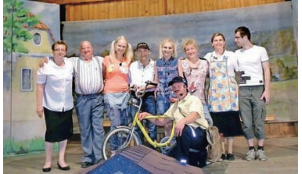
Igralska ekipa komedije Poštar Jakec

V letu 2016 so tradicionalno v juliju uprizorili komedijo Poštar Jakec, nato pa z omejeno predstavo nadaljevali tudi z gostovanji (Gornji Grad, Peče pri Moravčah, Dnevi narodnih noš in oblčilne dediščine v Kamniku ...). Pri Termah Snovik so se v okviru etnoloških dnevo predstavili z dobrodelno noto in izkupiček prostovoljnih prispevkov predali družini z invalidnim otrokom v občini Kamnik. V letošnjem maju pa so po nekajmesečnem premoru ponovno uprizorili lanskoletno pred-