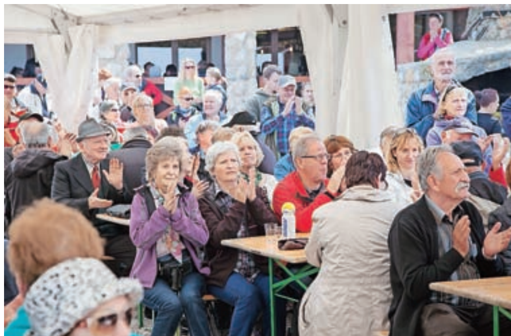
Praznovanje na Starem gradu je pospremlilo več sto obiskovalcev.