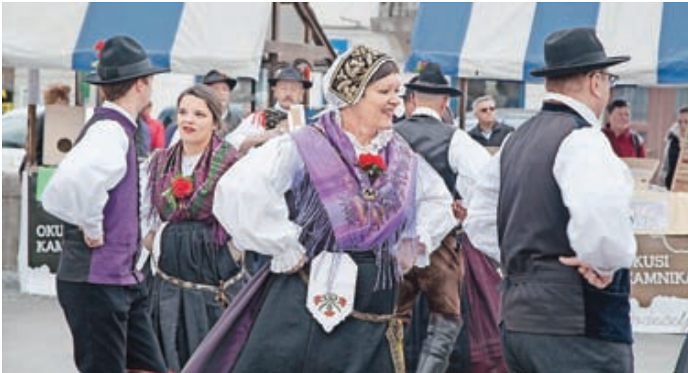
Člani Folklorne skupine Kamnik bodo nastopili tudi na regijskem srečanju folkloristov.

Najnovejši splet se imenuje Kdo je boljši, saj ples prikazuje tekmovanje dveh skupin v plesu. Odplesali ga