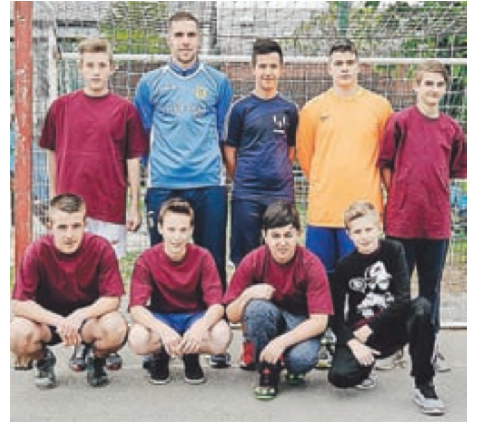
Učenci OŠ 27. julij Kamnik so na področnem tekmovanju osvojili tretje mesto.

Učenci Osnovne šole 27. julij Kamnik so se v aprilu v Domžalah udeležili zanimive prijateljske tekme z učenci Osnovne šole Roje.