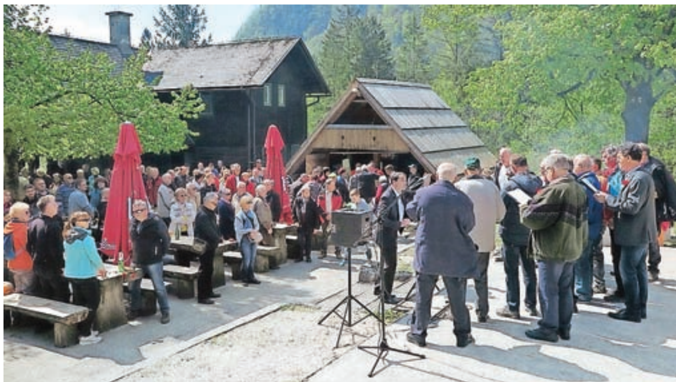
Prvomajsko proslava je v Kamniško Bistrico privabila okoli tristo ljudi, ki so v uvodu lahko prisluhnili delavski himni Internazionali v izvedbi pevcev DKD Solidarnost.

dobrih proizvodov in storitev. Dobri proizvodi in storitve se dobro prodajajo, kar omogoča dobre plače in sredstva za nadaljnji razvoj podjetja. Žal smo v preteklih dvajsetih letih videli tri faze 'prihvatizacije', ko so ljudje, ki jih je vodil pohlep, postali lastniki podjetij. Zanimal jih je samo dobiček, ne pa tudi pogoji dela zaposlenih. To niso odgovorni lastniki podjetij. Današnja sporočilnost 1. maja je prav zaradi njih še toliko večja. Politika, sindikati in delodajalci smo dolžni storiti več za izboljšanje delovnih pogojev in plač delavcev v prihodnje,« je med drugim dejal Matej Tonin. Ne glede na to, da so bili tudi v Kamniški Bistrici le redki obiskovalci prepričani, da prvomajsko srečanje še imajo takšno moč kot nekdanj in da se bodo pravice delavcev zaradi tovrstnih shodov kaj izboljšale, pa je bilo čutiti jasno sporočilo – prvomajsko praznovanje bo v Kamniški Bistrici tudi prihodnje leto, in to že 95. leto zapored.