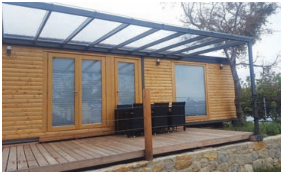
Mobilna hiška Snežka

Malo pred Bledom se nahaja tematski park z dinozavri. Tam so postavili mobilno hišo s teraso, ki služi kot okrepevalnica (mobilna hiša-bar), in trgovino s spominki in igračami (mobilna hiša-trgovinica). V okolici Jesenic so na vrtu postavili hiško, v kateri je savna in pergola z vrtnim kaminom (mobilna hiša-savna). Mobilna hiša je lahko urejena tudi kot vrtna uta, pripravljajo pa tudi večje projekte za večje hiše do tlorisa 130 m 2 .