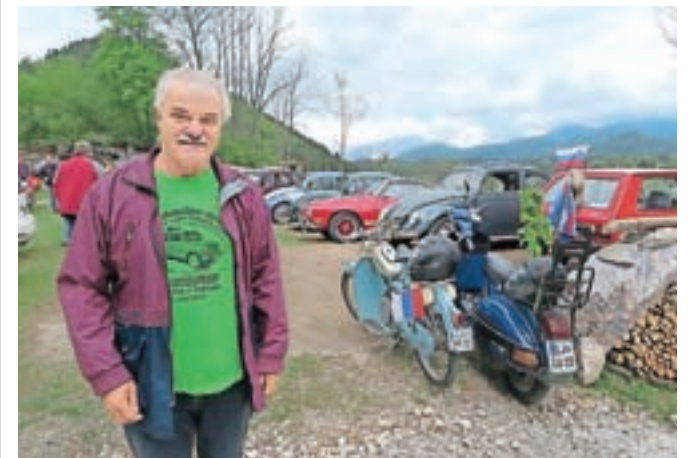
Pri Tonetu Rajsarju Na hribčku se je tudi letos zbralo več kot trideset starodobnikov.

trideset voznikov starodobnih avtomobilov in motorjev. Udeleženci so se najprej podali na 25 kilometrov dolgo pot mimo Laz, Zgornjega Tuhinja, Buča, Hruševke, Raven, Potoka, Srednje vasi in Sidola, nato pa so se znova zbrali Na hribčku, kjer je sledilo družabno popoldne.