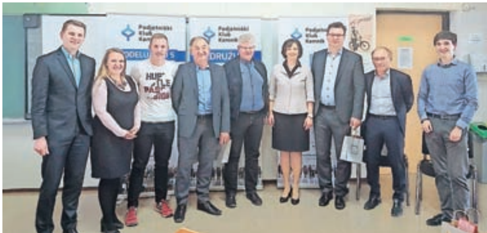
Udeleženci okrogle mize o podjetništvu na Gimnaziji in srednji šoli Rudolfa Maistra Kamnik