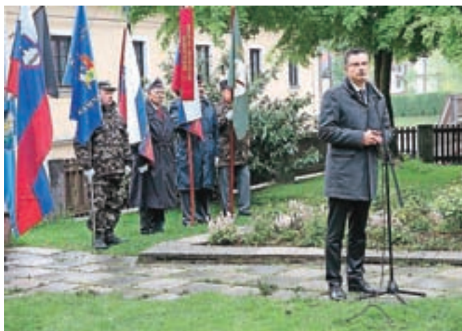
Župan Marjan Šarec in zastavonoše, ki so poskrbeli za slovesno vzdušje.

K slovesnemu vzdušju so pripomogli člani Mestne godbe Kamnik, številni zastavonoše in Združeni kamniški pevci in recitatorji.