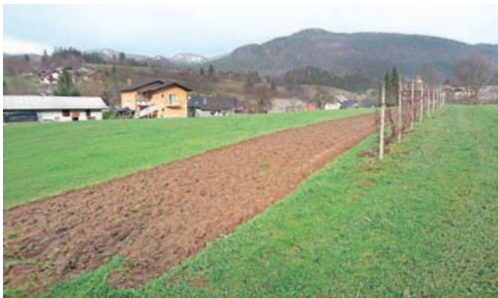
Pogled na Rosovo groblje z zahoda

Mozaik (ti so ena ključnih značilnosti rimskega obdobja) so domačini leta 1880 našli na njivi na nekoliko dvignjenem platoju južno od vasi Šmartno v Tuhinju med vznožjem Ivanjka, Nevljico in današnje potjo za Sidol. Ker je bil mozaik, velik približno meter krat pol metra, že precej razrahljan, ga niso mogli dvigniti v enem kosu, zato so ga prerišali. Takrat naj bi župnik tudi omenil, da naj bi domačini izkopali in shranili tudi nekaj kamnitih sarkofagov. Izročilo v Tuhinjski dolini še