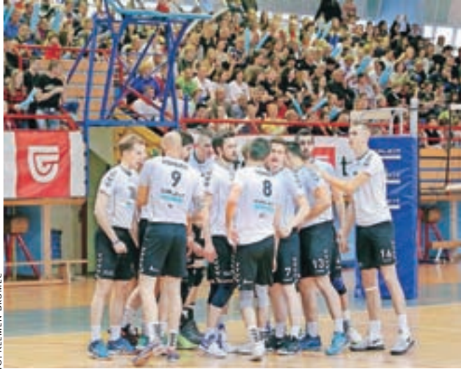
Kamniški odbojkarji se borijo za nov, že četrti naslov državnih prvakov. Potrebujemo še dve zmagi.

»Kozamernik je zelo pomemben igralec za ACH Volley, vendar smo na tej tekmi verjeli vase in v zmagi. Naredili smo tudi manj napak in bili bolj zbrani v ključnih trenutkih tekme. Vendar finalna serija še zdaleč ni odločena, kajti ljubljanci imajo v svoji ekipi veliko reprezentantov, ki imajo več izkušenj od nas, v letošnji sezoni so igrali tudi več mednarodnih tekem. Za naslov državnih prvakov potrebujemo še dve zmagi, do njih pa pridemo lahko le z moštveno igro in ekipnim duhom,« je po slavu v Tivoliju dejal 28-letni Brazilec.