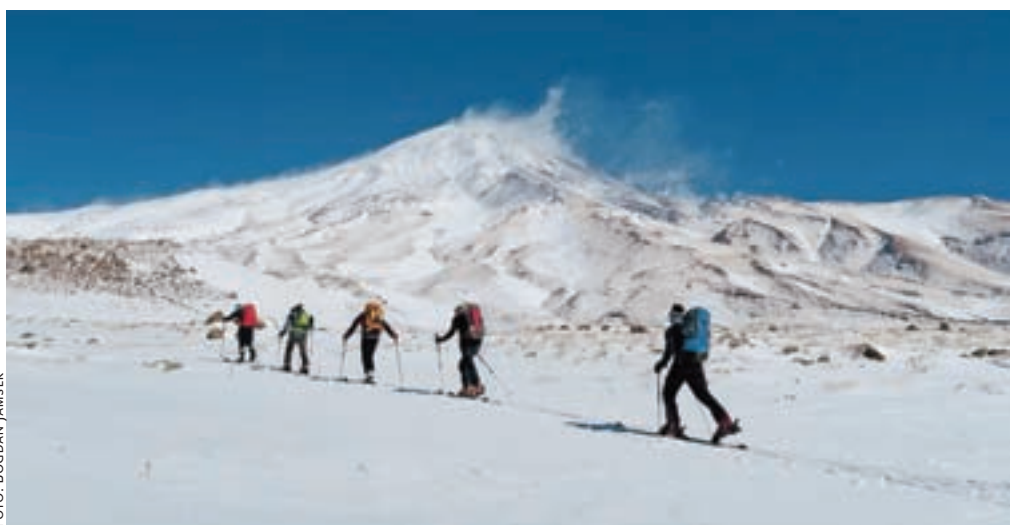
Krenili smo v čudovit, a mrzel dan z nekaj centimetri na novo zapadlega snega.

od Arabcev, govorijo svoj jezik, njihova veja islamizma, to je šiitizem, pa kljub demonizaciji, ki jo nad njim izvaja zahodna propaganda, navzven deluje kar všečno. Ves čas smo se počutili zelo varne, najbolj pa nam je bilo všeč, da je vse, kar smo se dogovorili, tudi zares veljalo, čeprav je bilo marsikaj le ustni dogovor. Ljudje se povsod zelo zanimajo za tujce in so zelo vedoželjni. Težava pa je, da jih malo – in še ti bolj slabo – zna angleški jezik. Promet je povsod zelo gost, v večjih mestih pa je skoraj nepopisna gneča. Kako tudi ne, saj se za en evro dobi kar okoli 13 litrov dizelskega goriva.