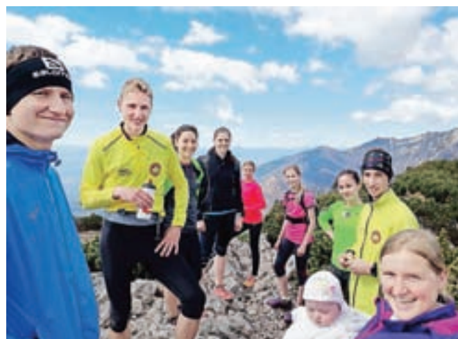
Gorski tekači na Gradišču