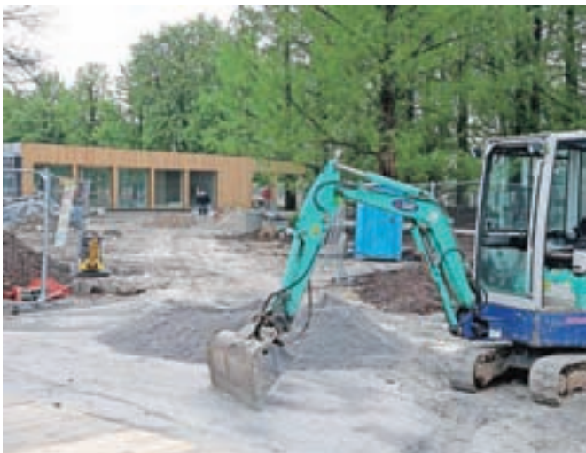
Nov vstopni objekt je zgrajen, delavci te dni urejajo še okolico.

V Arboretumu se pospešeno pripravljajo tudi na regionalni kongres Svetovne zveze društev ljubiteljev vrtnic, ki ga bo Slovenija gostila med 11. in 14. junijem, dva dni se bodo »vrtničarji« zadrževali v Arboretumu, kjer si bodo lahko ogledali že skoraj tisoč različnih sort vrtnic.