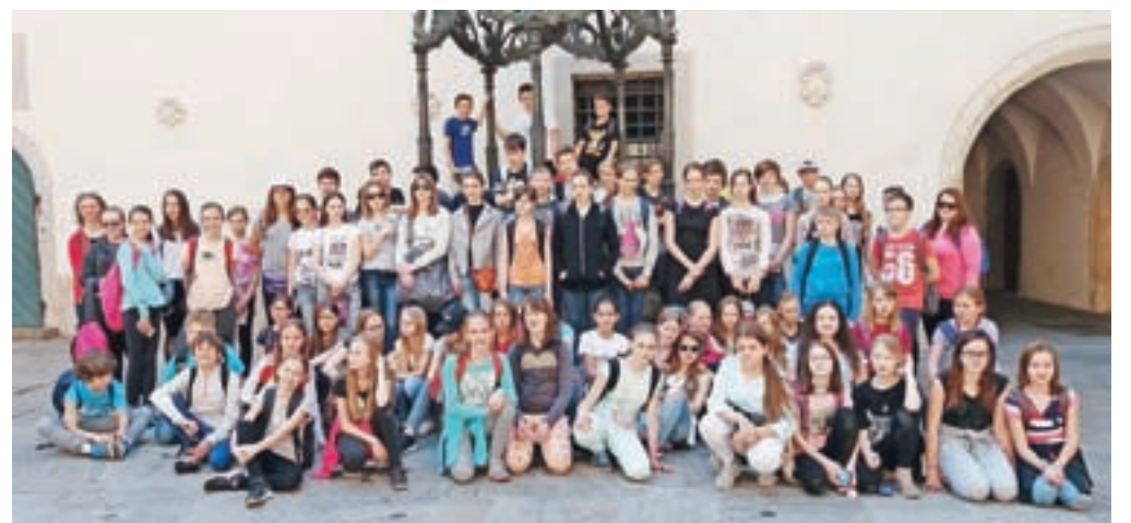
Šestošolci kamniških osnovnih šol so svoje znanje nemščine preizkušali na ekskurziji po Avstriji.

odšli po 250 stopnicah nazaj v mesto in nato proti avtobusu. Na poti domov smo poslušali glasbo in peli. Ob 19.30 smo prispeli domov. Bili smo veseli in utrujeni. Ta dan smo doživeli veliko novega in se imeli zelo lepo.