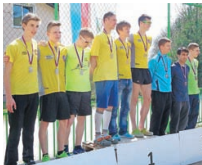
Štafete KGT Papež na stopničkah

Zbrali so se v Eko resortu pod Veliko planino, kjer bo start proge članov (12 km, 1295 m višinske razlike), nato pa so tekli po cesti do Vegrada in naprej, kjer so si pri Bodlajevi domačiji (8,5 km, 1035 m v. r.) ogledali start mladincev in članic. Pri Mickini koči pred Pasjimi pečinami so se že spogledovali z Gradiščem, kjer bo cilj. S starta mladink na Kisovcu (4,5 km, 430 m v. r.) so se tekačem pridružile še mladinke. Mala planina jih je pričakala vsa v vijoličnem razkošju žafrana, nato so tekli mimo Jarškega doma do pastirskega naselja na Veliki planini in cilja na Gradišču (1660 m visoko). Zadovoljni z ogledom in treningom so se z žičnico vrnili v dolino, kjer jih je s svojim gostoljubjem spet sprejela gostilna Pri planinskem orlu.