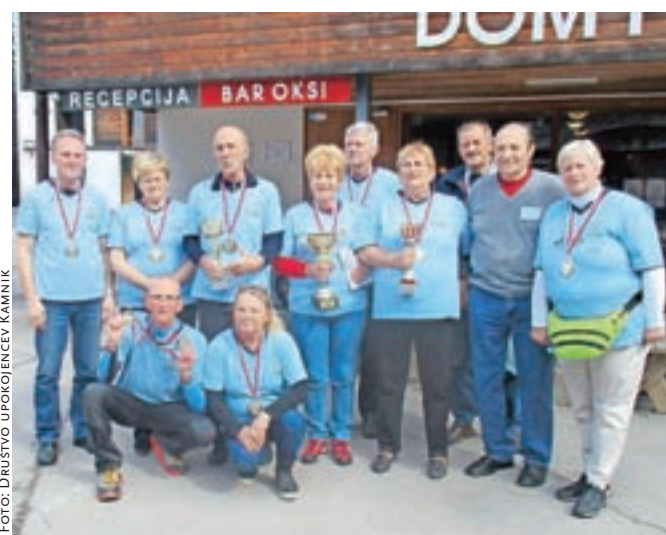
Ženska in moška ekipa Društva upokojencev Kamnik na letošnjih pokrajinskih športnih igrah v Planici

Vedno in povsod poudarjamo, kako zaželena je primerna telesna aktivnost celo življenje. S tem izboljšujemo kakovost življenja in se-