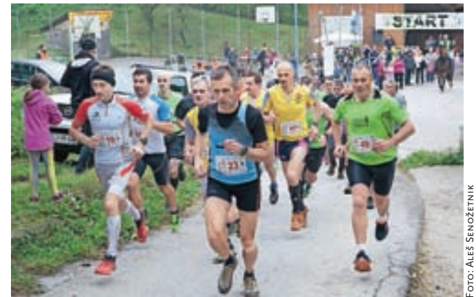
Češnjiški tek je letos potekal po nekoliko krajši trasi.