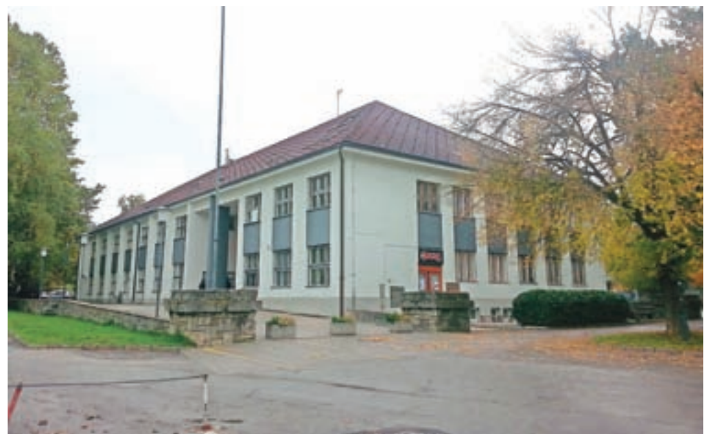
Upravljanje Doma kulture Kamnik se bo preneslo pod javni zavod Zavod za turizem in šport v občini Kamnik.

V prvi obravnavi so sprejeli predlog strategije razvoja in trženja turizma v občini za