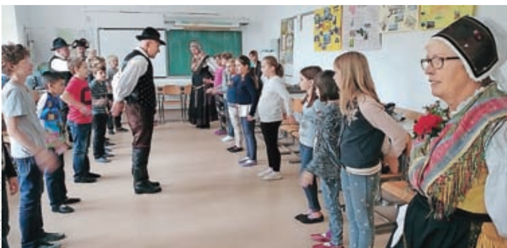
Na Osnovni šoli Toma Brejca so se predstavili tudi člani Folklorne skupine Kamnik.

Na OŠ Toma Brejca so se predstavili: Društvo botrov otrok TWIMC, Sadjarsko-vrtnarsko društvo Tunjice, PGD Kamnik, PD Bajtar Velika Planina, TD Kamniška Bistrica, Čebelarstvo društvo Kamnik, Zavod Oreli, Zavod za trajnostne rešitve Tunjice, Strelnska družina Kamnik, Folklorna skupina Kamnik, Društvo Ključ življenja, Društvo staršev otrok s posebnimi potrebami in OZRK Kamnik.