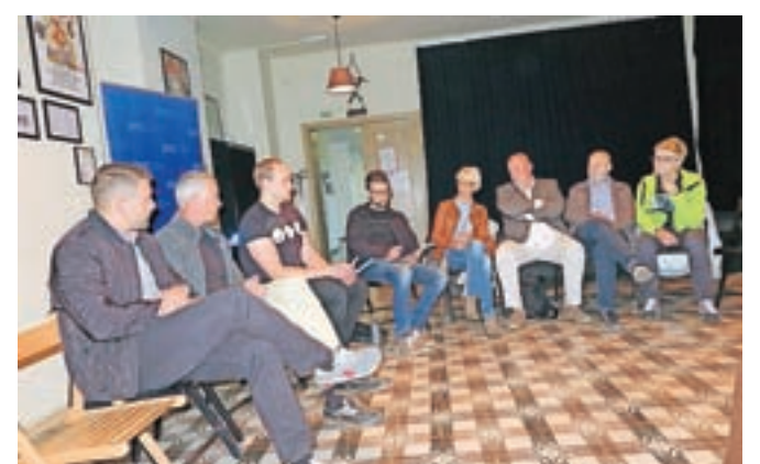
SMC mladi opozarjajo na pomen dobre vidljivosti pešcev in tekačev v prometu.