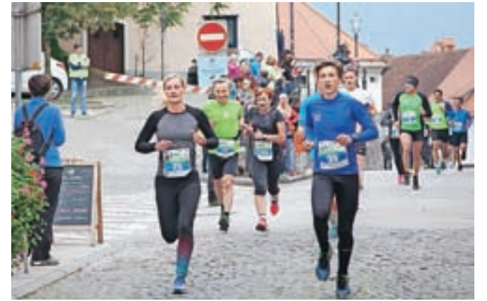
Veronikin tek je bil letos rekorden tako po številu udeležencev kot po času zmagovalca.

Tako Veronikin kot Češnjiški tek pa skrbita za to, da se tekaški duh krepiti tudi med najmlajšimi, ki so se na obeh tekih pomerili na nekaj desetmetrskih razdaljah. Tudi s tem organizatorji skrbijo, da se za prihodnost tekaških prireditev ni bati.