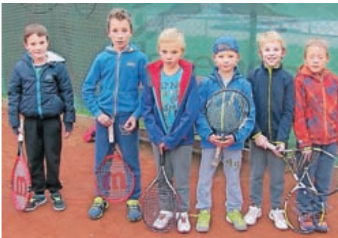
Najmlajši v Tenis klubu Kamnik