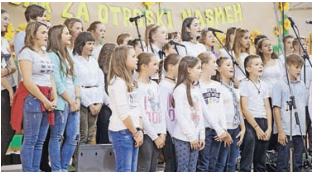
Zapeli so tudi učenci OŠ Stranje.