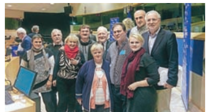
Kamničani v Evropskem parlamentu s poslancem Ivom Vajglom