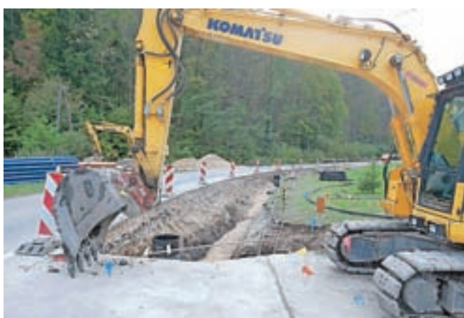
Za voznike skozi Tuhinjsko dolino je najhujše mimo. Kmalu bo ostal le še semafor pod Kavranom, pa še ta bo deloval na senzor.

gradil tudi nov vodohran Šmartno s kapaciteto vode 100 kubičnih metrov, letos pa je v načrtu tudi izgradnja vodohrana Soteska s