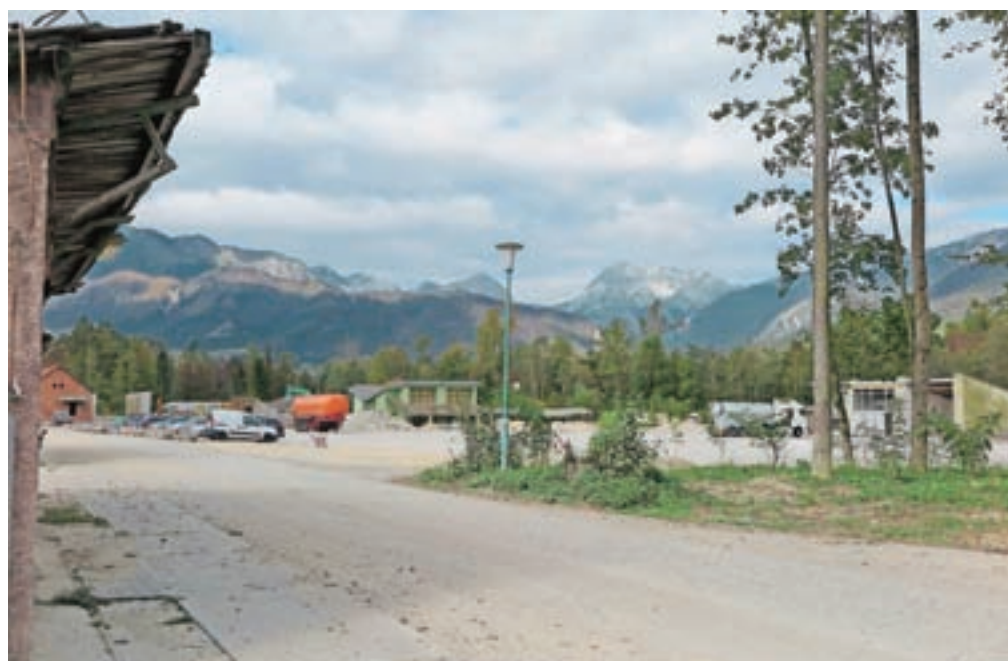
Posek dreves in gradbena dela so pogled na območje nekdanje smodnišnice v zadnjih mesecih močno spremenila.

A vse od sprejetja OPN se stvari odvijajo v drugo smer, kot je večina občanov pričakovala. Obstoječa industrijska zemljišča (ta so povsem v zasebni lasti) so na prostem trgu dobila več deset novih lastnikov, ti pa naj bi se že pripravljali na gradnjo novih objektov. Posekanih je bilo tudi veliko starih dreves, koliko hektarov natančno, ni znano, saj nadzora nad tem ne izvaja nihče. Na kranjskem Zavodu za varstvo naravne dediščine so