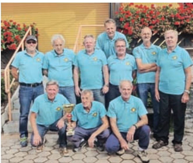
Veteranska ekipa Teniškega kluba Duplica