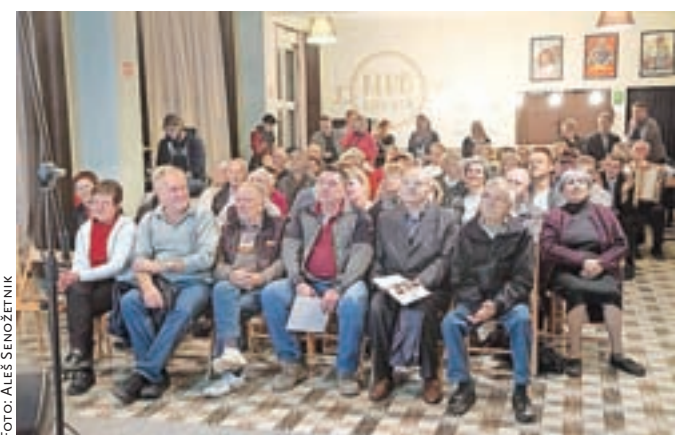
Srečanja se je udeležilo veliko število krajanov.

Kljub težavam in (še) neuresničeni željam, pa je središče Kamnika eno najlepših v Sloveniji, za kar je občina pred kratkim prejela tudi nagrado. Pomemben del k urejenosti mesta nosijo prav njegovi prebivalci. Številnim krajanom so za urejene zunanje podobe svojih vrtov, balkonov in okenskih polic podelili pohvale.