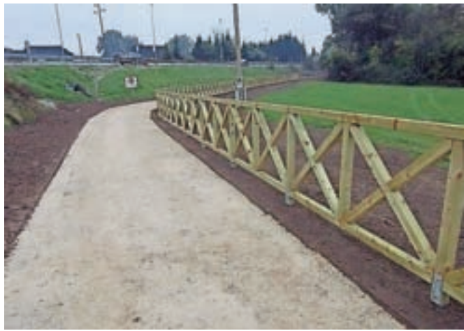
Nov odsek poti je dolg 280 metrov.

tra in se prilagaja obstoječemu terenu. Izveden je bil prehod pod mostom čez Kamniško Bistrico in saniran obstoječi meteorni jarek ob vznožju nasipa regionalne ceste. Meteorni jarek smo nadomestili z ureditvijo betonskih koritnic in z ustreznimi prepusti. Na začetnem delu pešpoti je postavljena