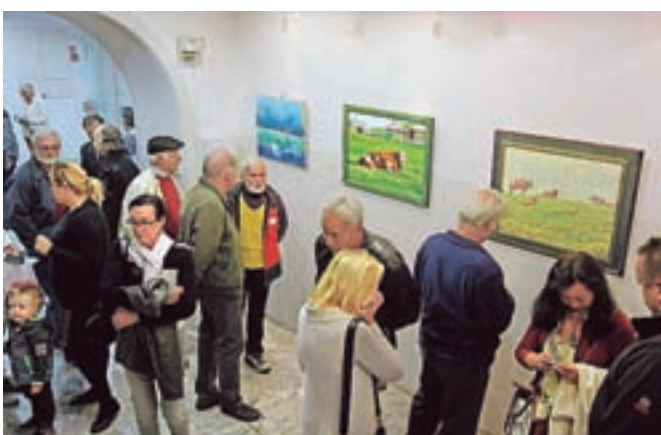
Svoja dela razstavlja sedemindvajset udeležencev letošnjega likovnega bienala.

Člani Likovnega društva Tone Kranjc Kamnik so z mislimi že pri jubilejnem, 10. mednarodnem bienalu, ki ga bodo organizirali čez dve leti. Želijo si več poslušanja, da bo dogodek na nivoju, kakršnega si zasluži, za razstavo pa si takrat želijo kakšno novo likovno galerijo v Kamniku, ki si jo umetniki vsekakor zaslužijo.