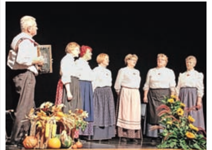
Že 13. prireditev Nocoj je ena luštna noč so znova pripravile Ljudske pevke Predice.

Ob zaključku prireditve je Angelca povabila vse zbrane na jubilejni koncert prihodnje leto, ko bodo Predice praznovala petnajstletnico svojega uradnega obstoja, čeprav so v kamniško kulturno dogajanje vpete že več kot dve desetletji. Pravijo, da se dobro razpoloženo