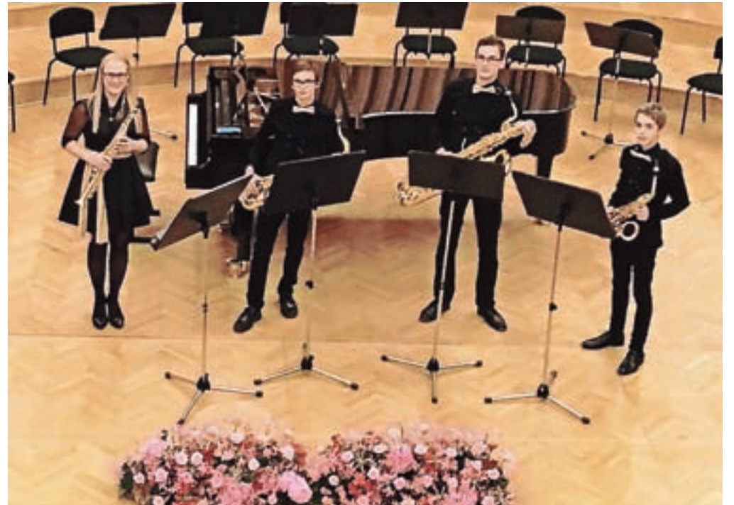
Kvartet saksofonov Glasbene šole Kamnik

Glasbena šola Kamnik se je s kvartetom saksofonov pridružila koncertu trinajstih glasbenih šol osrednjeslovenske regije, s katerim so v Slovenski filharmoniji obeležili dvestoletnico nastanka prve javne glasbene šole pri nas.