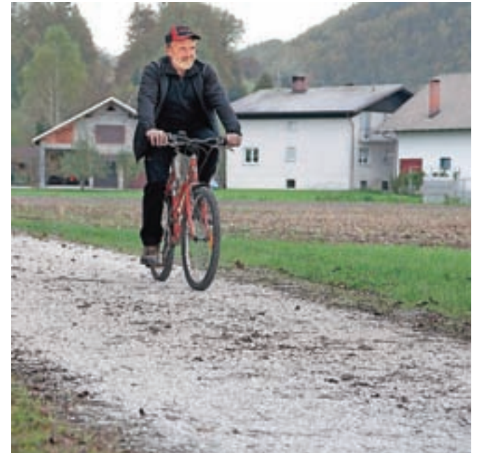
Tuhinjska kolesarska pot je zdaj resda dolga le 530 metrov, a prvi korak je narejen in pot domačini že s pridom uporabljajo.

Za strokovno izvedbo ureditve kolesarske poti, ki jo domačini že uporabljajo, je skrbela Alenka Babnik iz