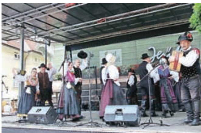
Plesalci Folklorne skupine Kamnik na odru festivala v Trofaiachu

Domov smo se vrnili z lepimi vtisi na festival, na prijazne prebivalce Trofaiacha, na njihov odprti način življenja, na njihovo povezanost in pripadnost in zato smo te vtise želeli deliti tudi z vami, prebivalci Kamnika.