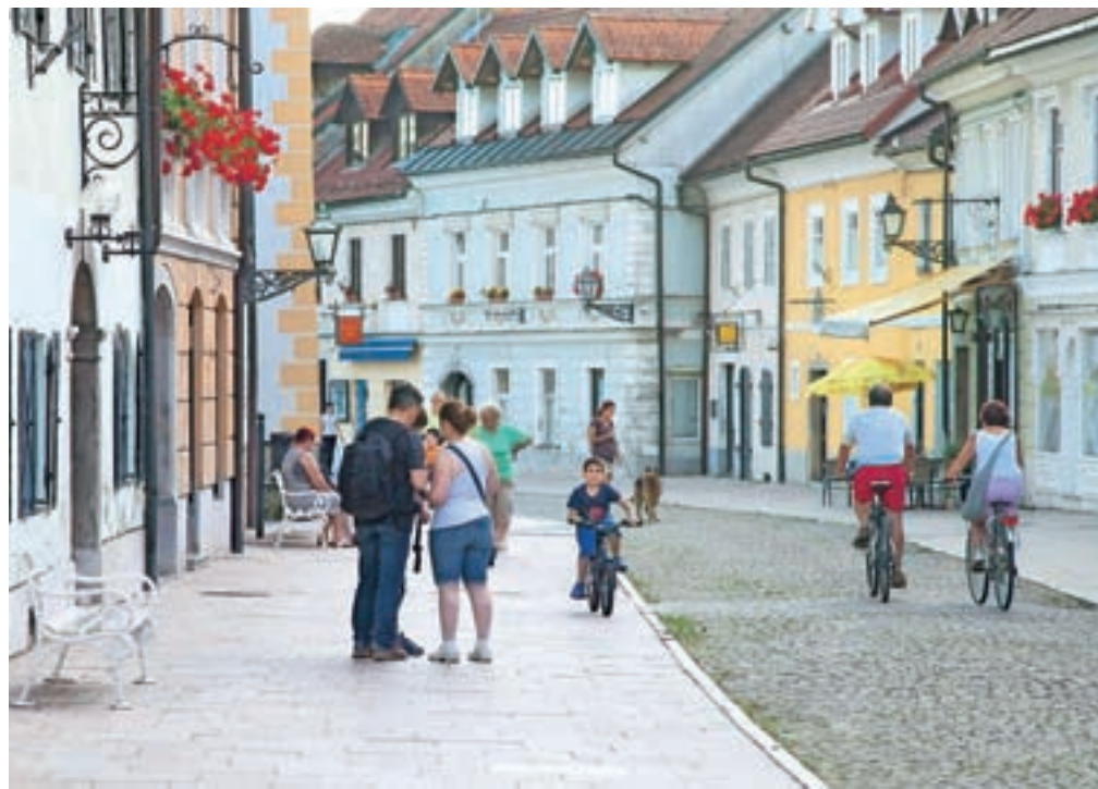
Ena od kamniških znamenitosti, ki navdušuje tuje turiste, je tudi Šutna.

Z obiski turistov in zasedenostjo kapacitet so kamniški turistični delavci za zdaj zadovoljni. »Glavna sezona se za nas šele dobro začne, saj izkušnje minulih let kažejo, da največjo zasedenost lahko pričakujemo avgusta. Vsaj lanskega avgusta smo imeli polno, dobro kaže tudi letos. Vse pa se seveda odvisno od vremena. Naši gostje so v glavnem prehodni in se pri nas zadržijo dva do tri dni, prihajajo pa iz vse Evrope, tudi Slovenije. Letos je sploh veliko Poljakov in Čehov. Zanimivo je, da Kamnik številni vzamejo kot predmestje