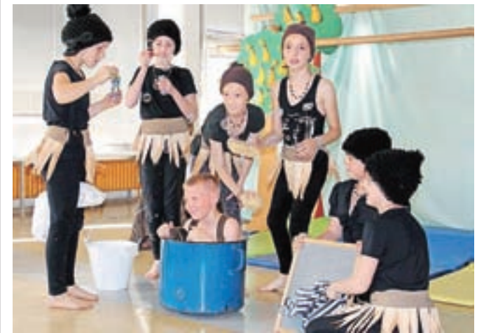
Mladi umetniki Osnovne šole Frana Albrehta v predstavi Juri Muri v Afriki