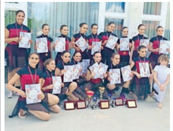
Plesalke in plesalec Plesnega kluba Šinšin z medaljami z državnega prvenstva

Na državnem prvenstvu modernih tekmovalnih plesov so se za odličja potegovali tudi plesalci Plesnega kluba Šinšin.