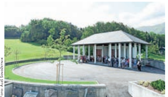
V Stranjah so uredili okolico vežice in cesto do cerkve.