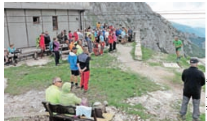
Dan kamniških planin je letos potekal že štiriinšestdesetimi leti.