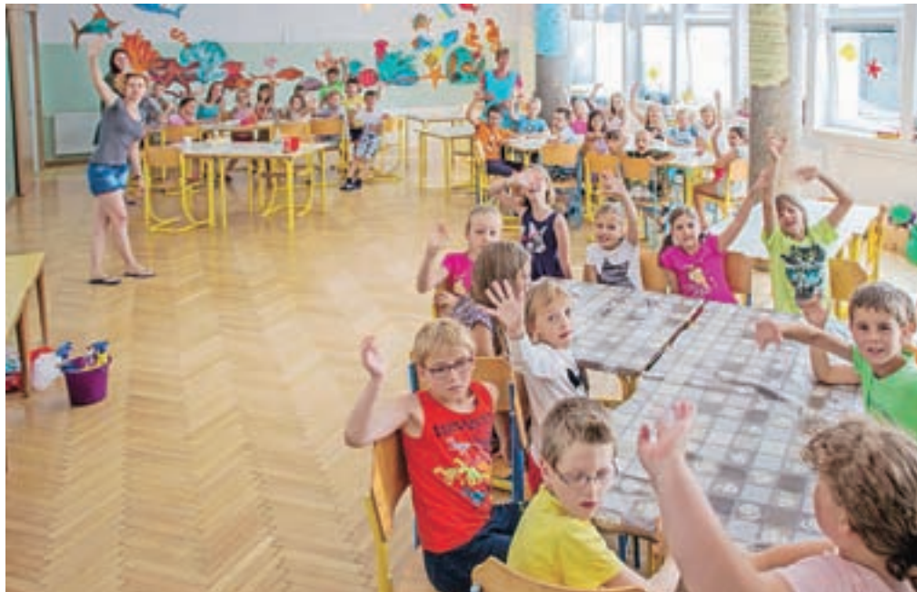
Počitniško varstvo tudi letos poteka v prostorih Osnovne šole 27. julij Kamnik.

Seveda si večina počitnikarjev želi preživeti počitnice na prostem, stran od knjig, morda tudi računalnika in televizije. Kamniški športni klubi in društva celo poletje ponujajo različne športne taborje, na katerih lahko otroci spoznajo novo športno aktivnost oz. poglobijo svoje znanje, ki so ga že pridobili na treningih preko šolskega leta. Nogometni klub Virtus je v prvem tednu počitnic za dečke in deklice organiziral počitniški nogometni tabor Camp Virtus, na katerem so mladi nogometaši pilili nogometne veščine in tekanje za nogometno žogo. Na odbojarskem taboru so igralke in igralci spoznavali trike od-