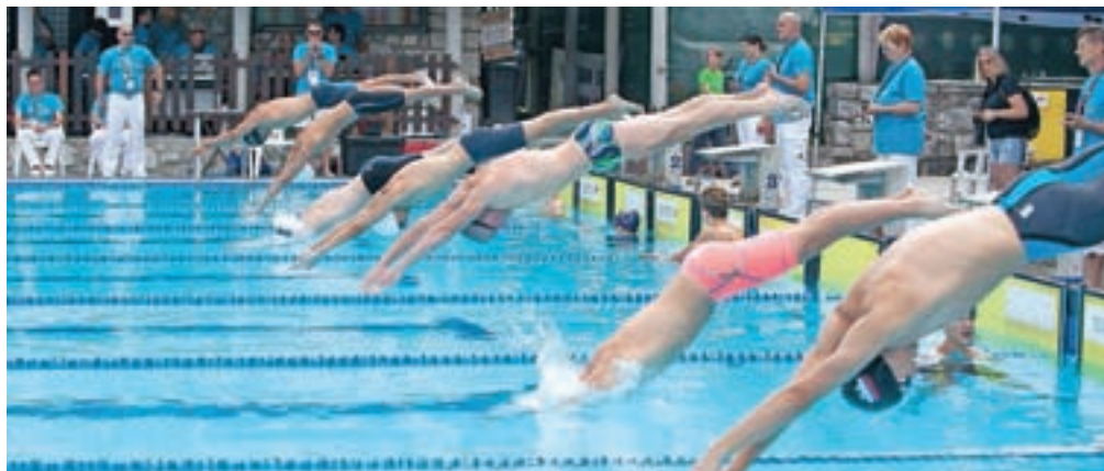
Tudi letos je miting obiskalo več sto plavalcev.