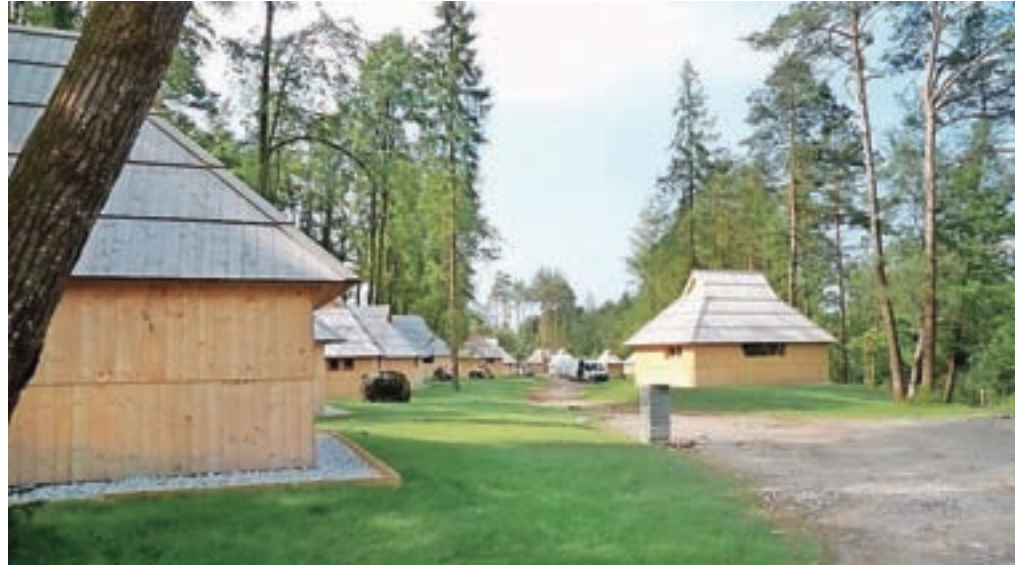
Devetnajst tipskih hišk je že postavljenih, a potrebnih dovoljenj še nimajo.

Kot smo preverili na Upravni enoti Kamnik, je investitor pri njih zaprosil za dve gradbeni dovoljenji. Septembra lani za postavitev 24 gostinskih objektov za kratkotrajno bivanje, mesec dni kasneje pa še za nezahtevni objekt. Gradbeno dovoljenje za slednjega, torej nezahtevni leseni in pritlični objekt tlorisnih dimenzij 4 x 6 metrov, namenjen za funkcionalne