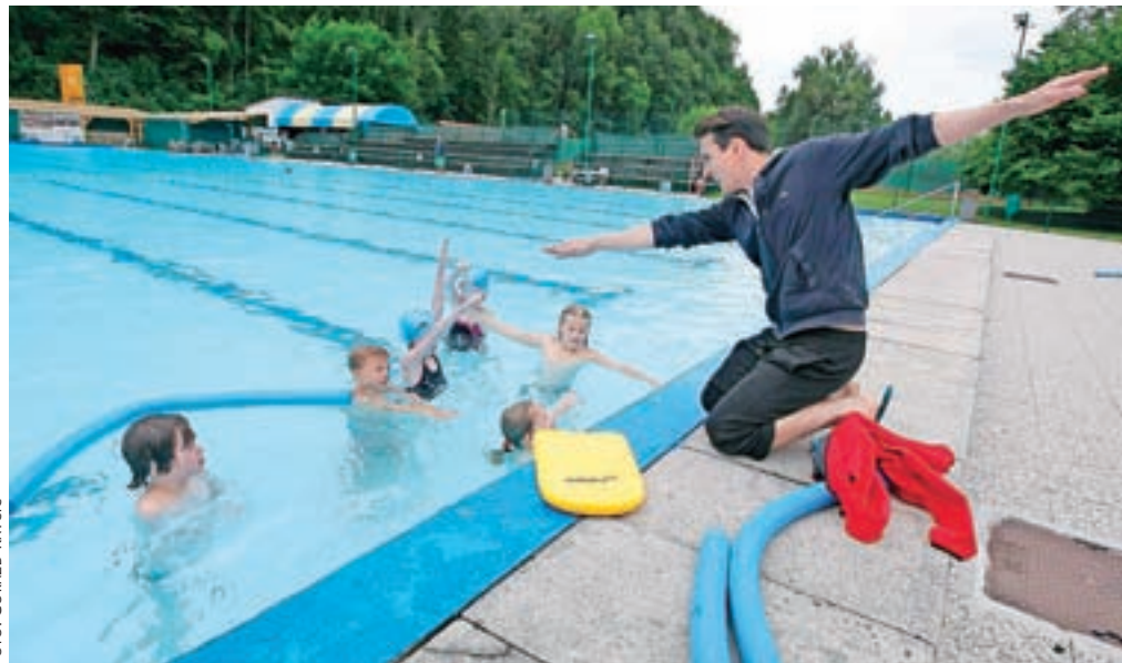
Brez bazena – tudi v hladnejšem vremenu – med poletnimi počitnicami preprosto ne gre.

bojke na mivki na igriščih Pod Skalco, zaradi velikega zanimanja pa so otroci igrali tudi na igrišču v Stranjah. Na kamniškem bazenu tudi letos vlada veliko zanimanje za plavalne programe Plavalnega kluba Kamnik, zato so ponovno razpisani trije 10-dnevni termini že zapolnjeni. Plavalni vrtec je namenjen najmlajšim, plavalni tečaj pa otrokom do 14. leta, pod budnim nadzorom plavalnih učiteljev pa otroci dobera spoznajo plavalne tehnike. Triatlon klub Trisport Kamnik že četrtič organizira Poletno šolo triatlona, kjer otroci spoznavajo triatlon, poleg tega pa še lahko jahajo konje, streljajo z lokom in plezajo. Različne športne aktivnosti pa trenirajo otroci