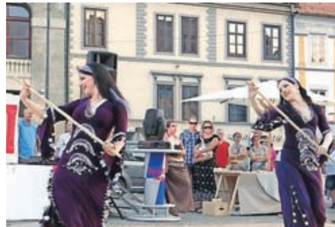
Plesalke KUOD Bayani na Festivalu Lent