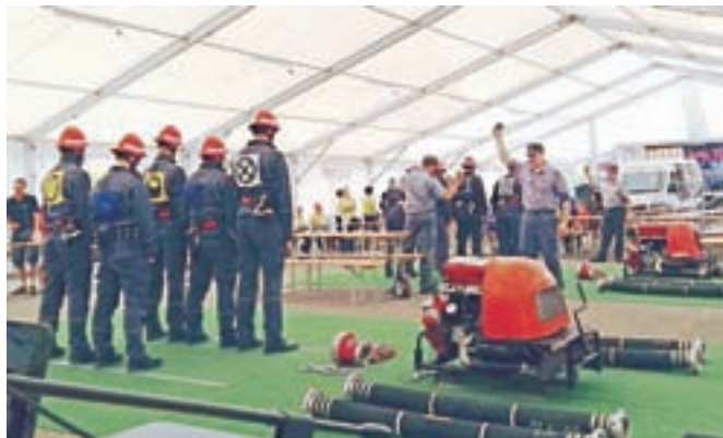
Tekmovanja se je udeležilo sedem ekip članov in štiri ekipe članic.

gale pa so članice A1 iz Zgornjega Tuhinja. Zanimivo gasilsko dogajanje si je z zanimanjem ogledalo precej gledalcev, ki so navijali za tekmovalce. K uspešnemu nastopu ekip je pripomoglo znanje in hitrost, prav tako pa tudi kanček navijaških spodbud. PGD Zgornji Tuhinj se lepo zahvaljuje vsem tekmovalcem in tekmovalkam za nastop, prav tako pa tudi sodnikom za uspešno sojenje. Po končanem tekmovanju je sledila gasilska veselica s Skupino Calypso.