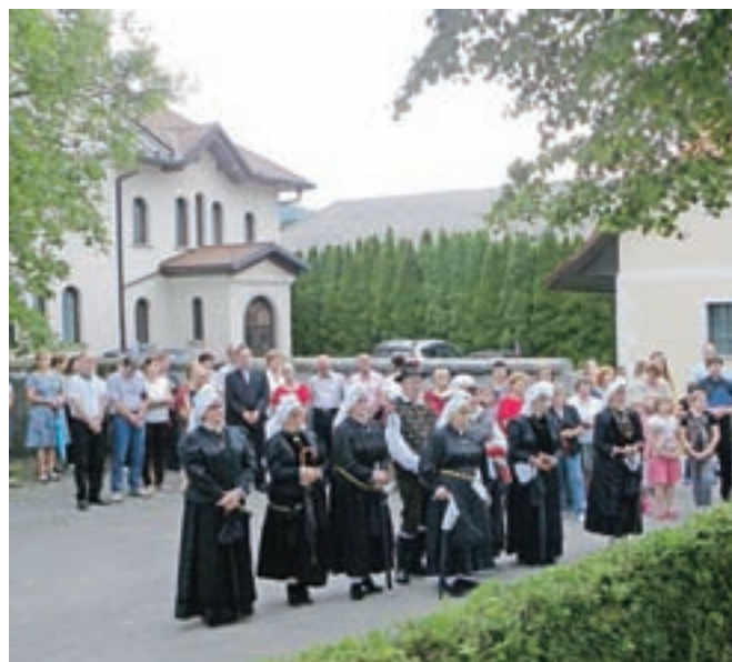
Slovesnost so polepsale gorenjske in meščanske narodne noše ter domači gasilci.