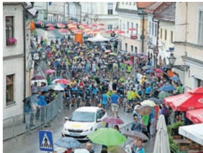
Kljub slabemu vremenu se je maratona udeležilo blizu tristo tekmovalcev.