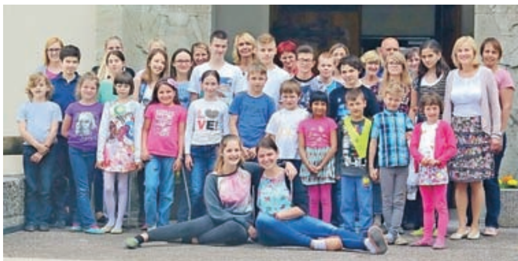
Prejemnikov zlatih priznanj z različnih državnih tekmovanj iz znanja je bilo letos kar enainštirideset.