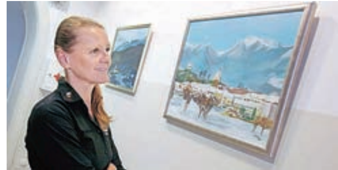
Dela Irene Redja so na ogled v času uradnih ur Občine Kamnik.

Razstava kamniške slikarke je v prostorih Občine Kamnik na ogled še vse do 5. avgusta.