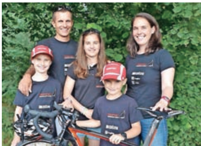
Športna družina Šporn

Ste športna družina. S katerimi športi se ukvarjate? Aleš in Teja: »Otroci se s športom ukvarjajo že, odkar