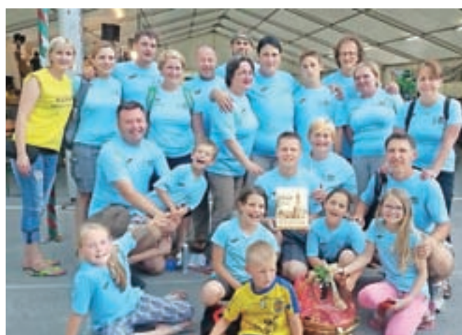
Vseslovenskega srečanja Selanov so se udeležili tudi krajani Sel pri Kamniku.

Sela pri Kamniku – V okviru društva ŠKD Sela smo se ga udeležili tudi Selani s Sel pri Kamniku in okoliških vasi. Srečanje je bilo sedaj že 20. po vrsti. Udeležilo se ga je kar trideset vasi iz cele Slovenije, skupaj je prišlo na dogodek okoli 700 ljudi. Z organiziranim prevozom v organizaciji ŠKD Sela se nas je na srečanje odpravilo 22. Tam smo se predstavili na uvodnem delu, povedali, od kod prihajamo in opisali svoj kraj in občino, iz katere prihajamo. Predstavili smo