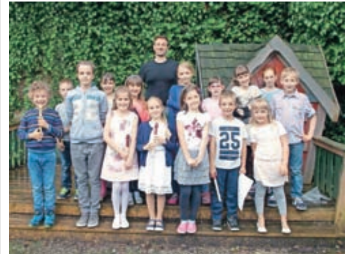
Nastopajoči učenci Glasbene šole Skalar

Učenci Glasbene šole Skalar so osvojeno znanje predstavili zbranim na zaključnem nastopu.