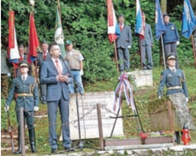
Spomenik v Češnjicah stoji v spomin na padle borce, tudi ameriške in britanske vojake, ki so se borili na območju Menine planine.

Prav zato se slovesnosti vsako leto udeležijo tudi predstavniki ameriškega veleposlaništva. Letos se je domačinom in vsem Slo-