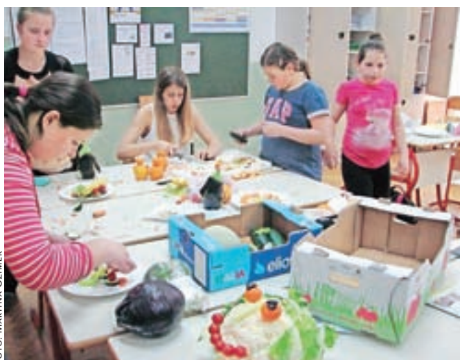
MLADE PROSTOVOLJKE OŠ STRANJE SO NA TEMO SADJA IN ZELENJAVE V LETOŠNJEM ŠOLSKEM LETU PRAVILILE TUDI RAZSTAVO.