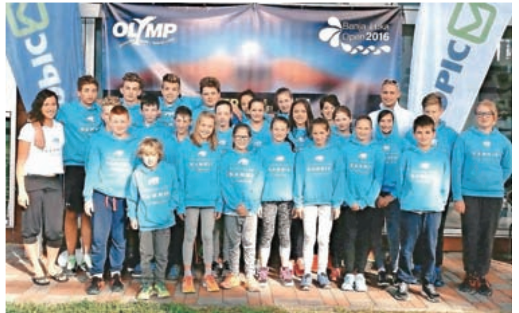
Kamniški plavalci na tekmi v Banjaluki