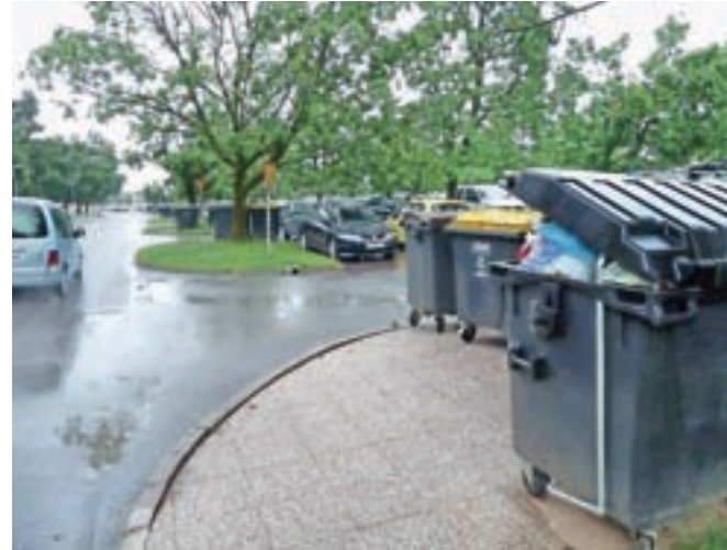
Zabojniki za smeti ob Steletovi ulici so namenjeni zgolj stanovalcem blokov na Zikovi, in ne vsem občanom, kot denimo bližnji ekološki otok.

»Več kot sedemsto evrov smo stanovalci namenili ureditvi tega zbirnega mesta za odvoz odpadkov, ki pa pripada zgolj našemu bloku, čeprav se redno dogaja, da vanj odpadke mečejo kar vsi. Nekateri se pripeljejo z avtom in vanje odvržejo svoje odpadke, drugi jih prinesejo iz okoliških hiš ... Ne ločujejo, kartonastih škatel ne razdrejo, zato so zabojniki hitro polni in neurejeni, veter pa smeti nosi po okolici. Stanovalci smo nad tem ogorčeni, saj za odvoz mesečno plačamo skoraj štiristo evrov, kar je zelo veliko, zato je nepošteno, da se s tem okoriščajo tudi drugi, vse skupaj pa je toliko bolj