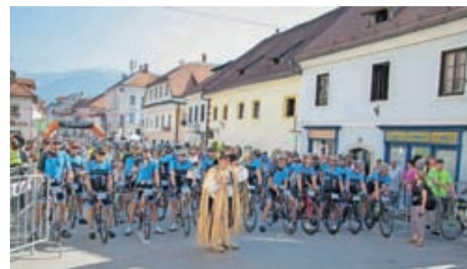
Na jubilejnem, desetem Maratonu Alpe Scott pričakujejo okoli sedemsto kolesarjev, številne tudi iz tujine.

Predvidena časovnica Maratona Alpe Scott je: Komenda – 9.10, Cerklje – 9.20, Preddvor – 9.35, Zgornje Jezerko – 10.00, Jezerski Vrh – 10.30, Pavličovo sedlo – 10.50, Logarska dolina – 11.00, Solčava – 11.10, Luče – 11.20, Ljubno – 11.35, Radmirje – 11.40, Gornji Grad – 11.50, Črnivec – 12.20.