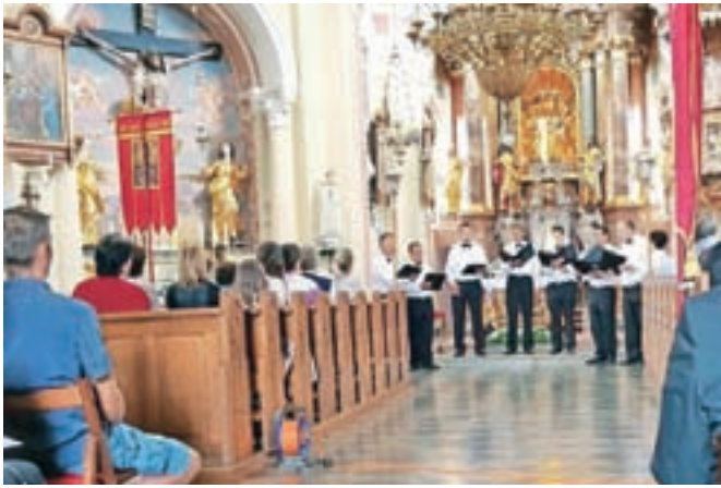
Tunjiški oktet med nastopom