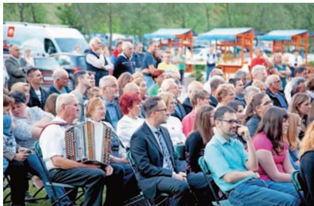
Dogajanje na travniku pred termami, ki mu je prisostvovalo okoli dvesto obiskovalcev, je minilo v znamenju glasbe.