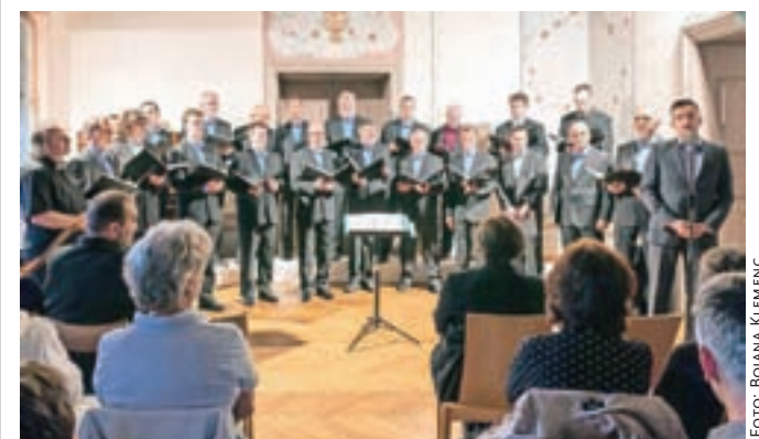
Pevci PSPD Lira so z lepo pesmijo in rujno kapljico na gradu Zaprice predstavili letošnjo pevsko sezono.

Že tradicionalno pripravljajo pevci PSPD Lira letni koncert na gradu Zaprice. Letos so zaradi slabega vremena ubrali glasovi lirašev namesto pod lipo zadoneli v grajski dvorani.