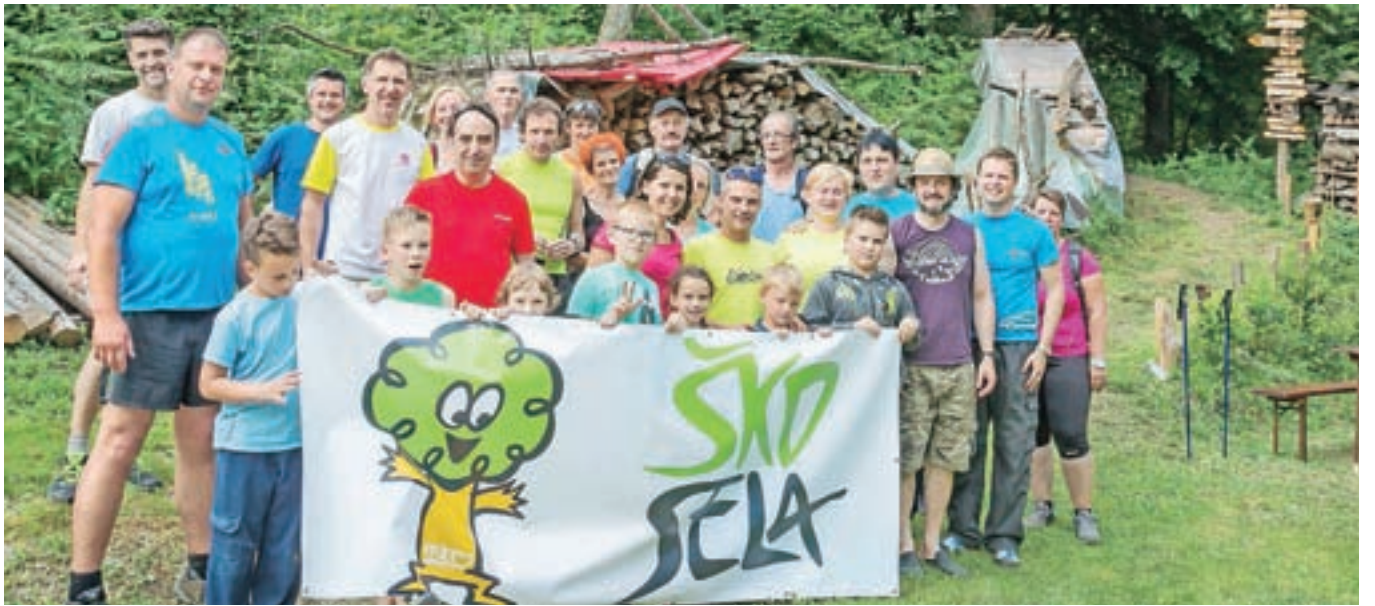
Selani so navdušeni nad svojo rekreativno točko, ki pa je med občani slabo poznana.