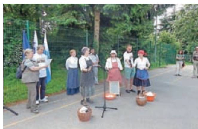
Dupličane je ob prazniku obiskala tudi skupina iz krajevne skupnosti Perovo.