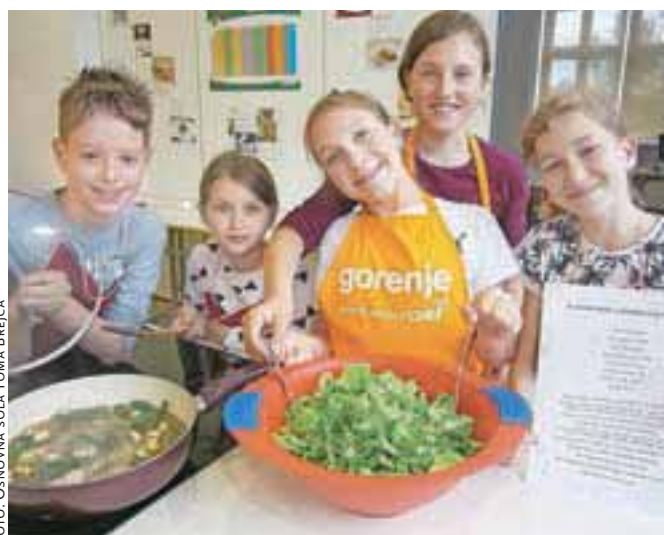
Na šoli so v okviru projekta izvedli tudi kuharske delavnice z naslovom Kar skuham sam, rad v trebušček dam.

Da bi učence še bolj spodbudili k uživanju sadja in zelenjave, je šola izvedla nagradni natečaj, ki je učence pozval k razmišljanju in ustvarjanju plakata s kratkimi sporočili, zakaj je za naše telo tako pomembno dnevno uživanje tovrstnih živil. Izdelke so razstavili v šolski jedilnici, učence pa nagradili z dnevno vstopnico za kamniški bazen. Šola stremi k odgovornemu ravnanju s hrano, kar pomeni, da učence ozavešča na tem področju. Pri šolskih obrokih jih spodbuja k poskušanju neznanih jedi, uči jih spoštljivega odnosa do pripravljene jedi in do kuharskega osebja, predvsem pa si želi, da bi mladi razvili kritično mišljenje in sprejeli nove vedenjske vzorce na področju prehrane.