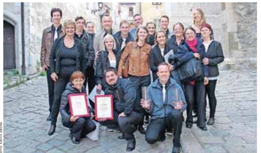
Pevci MePZ Odmev z enim od številnih priznanj, ki so ga osvojili v minulih 35 letih.

Ljubljanska 61, Domžale t. 722 50 50 www.kd-domzale.si