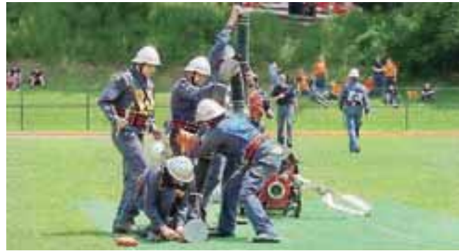
Na tekmovanju so gasilci pokazali obilo spretnosti in hitrosti, kar je ob dobri opremi in usposobljenosti tudi ključno pri delu, ki ga opravljajo.