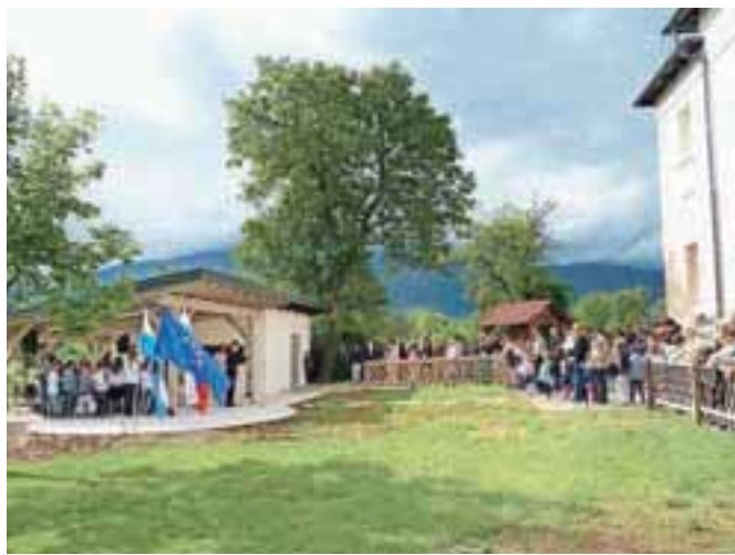
Podružnična šola Mekinje je bogatejša za učilnico na prostem.

prostem pridobitev za ves kraj, saj je šola z Mekinjami tesno povezana. »Želim si, da bi z učilnico na prostem današnje trende, zaradi katerih vse več sedimo in se zadržujemo v zaprtih prostorih, obrnila in da se bodo mekinjski učenci pri pouku na prostem počutili še bolj sproščeno.« Celotna investicija znaša okoli 33 tisoč evrov, dve tretjini je prispevala občina, preostalo pa šola sama.