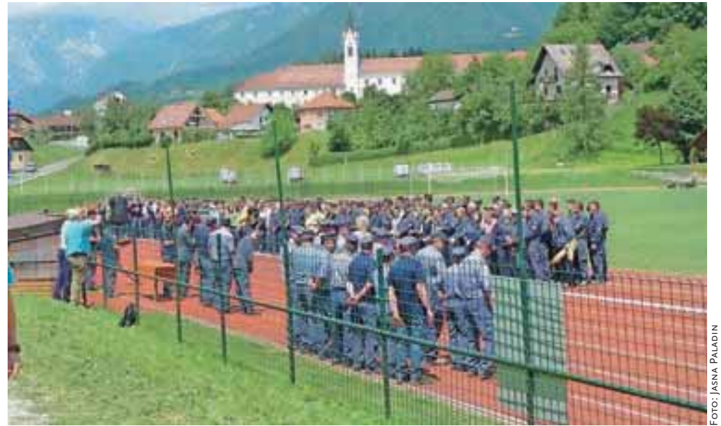
Atletski stadion v Mekinjah je bil minulo soboto in nedeljo v znamenju gasilcev.

Mekinje – V razvrščanju, štafeti, vaji z motorno brizgalno in drugih spretnostih je tekmovalo skoraj devetsto gasilcev, kar je bil za organizatorje precejšen zalogaj. V soboto so stadion v Mekinjah napolnili najmlajši in najstarejši – tekmovalo je 21 enot pionirjev, osem enot pionirk, 14 enot mladincev, šest enot mladink, devet enot starejših gasilcev ter ena enota starejših gasilk, nedelja pa je bila v znamenju članov in članic – pomerilo se je 36 enot članov A, dvanajst enot članic A, osemnajst enot članov B in 11 enot članic B.