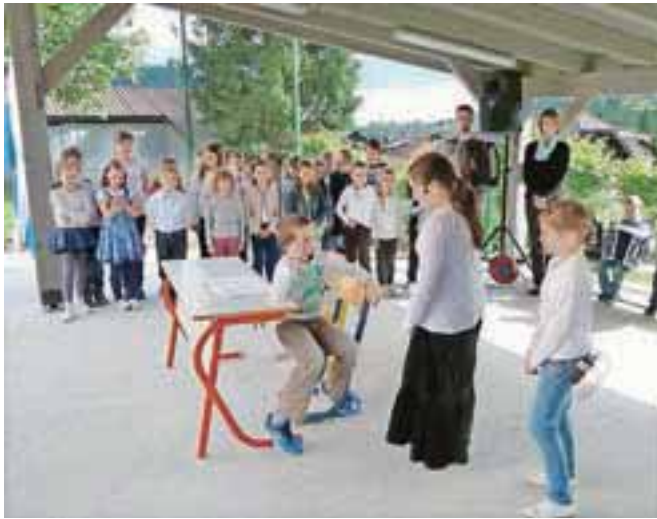
Novo pridobitev so učenci pospremili s pestrim in tudi zabavnim kulturnim programom.

kulturnih dejavnosti in igro. Z občasnim izvajanjem pouka na prostem, ki omogoča izkustveno učenje, in alternativnimi metodami poučevanja bomo učencem popestrili pouk, našo šolo pa naredili še prijaznejšo. Skrb za okolje, uporabna znanja in naravoslovne kompetence, ki od posameznika zahtevajo odgovoren odnos do narave, moramo začeti gojiti že pri najmlajših. Učilnico na prostem smo začeli načrto-