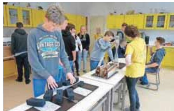
V dveh učilnicah je bilo na voljo več kot petdeset eksperimentov.