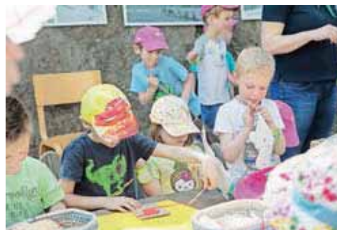
Festival je letos potekal pod sloganom "Naučil sem se ...". Za to, da so se otroci res česa naučili, so z različnimi delavnicami poskrbeli organizatorji.

samo otrok,« je med drugim v svojem pozdravnem govoru povedala vršilka dolžnosti ravnateljice vrtca Antona