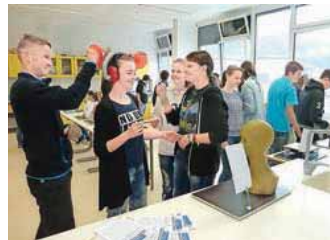
Učenci so ugotavljali, da so znanstvene vragolije nadvse zabavne.

Na Osnovni šoli Toma Brejca so gostili Hiško eksperimentov, v kateri so se ob več kot petdesetih eksperimentih učenci lahko prelevili v prave mlade znanstvenike.