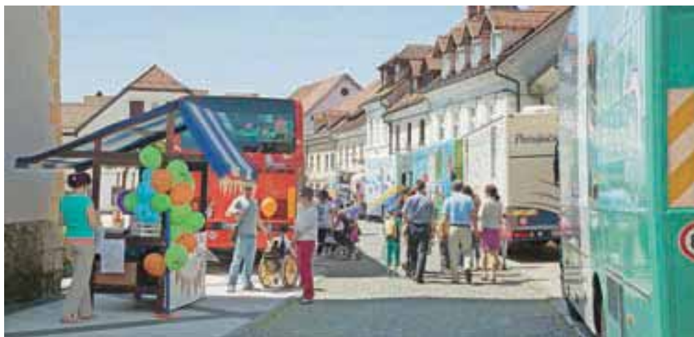
Po Sloveniji se vozi 12 potujočih knjižnic, ki branje približajo tistim, ki se sami težje odpravijo v knjižnice.

V okviru Festivala potujočih knjižnic, ki je letos prvič potekal v Kamniku, se je odvijalo tudi strokovno posvetovanje potujočih knjižnic Slovenije ter pester kulturni program. Konvoj bibliobusov je že v petek zjutraj iz Arboretuma krenil na Šutno, kjer so bile potujoče knjižnice na ogled mimoidočim, nato pa so se potujočniki odpravili v Snovik. Festivalno dogajanje so v soboto sklenili v Arboretumu.