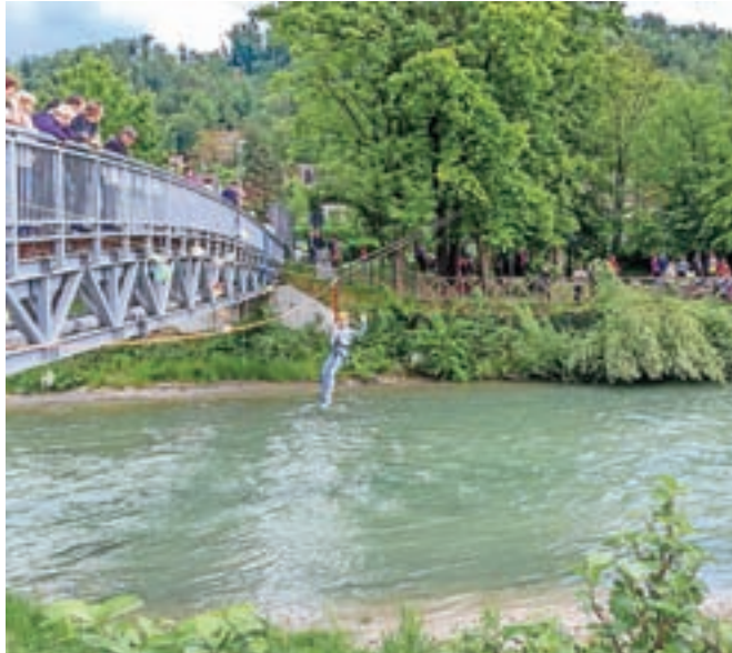
Na letošnjem Perovanju je najbolj navdušila perovsko-tirolska žičnica, ki je tudi simbolno povezala oba perovska bregova.

Sobotno sončno popoldne se je začelo obetavno in dalo organizatorjem dovolj časa, da pripravijo vse potrebno za pripravo prizorišča – levi in desni breg Kamniške Bistrice. Ob povezovalnem mostu je bilo nad vse živahno. Ulični telovadci so se potili na svojem poligonu, številni so poskušali perovske dobrote, drugi meditirali ob ustvarjanju mandal na delavnici dijakinj GSŠRM, a daleč največ navdušenja je zagotovo požela perovsko-tirolska žični-