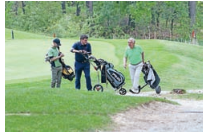
Golf Arboretum je simpatično in razgibano igrišče, ki se včasih spremeni tudi v igrišče za sladokusce.