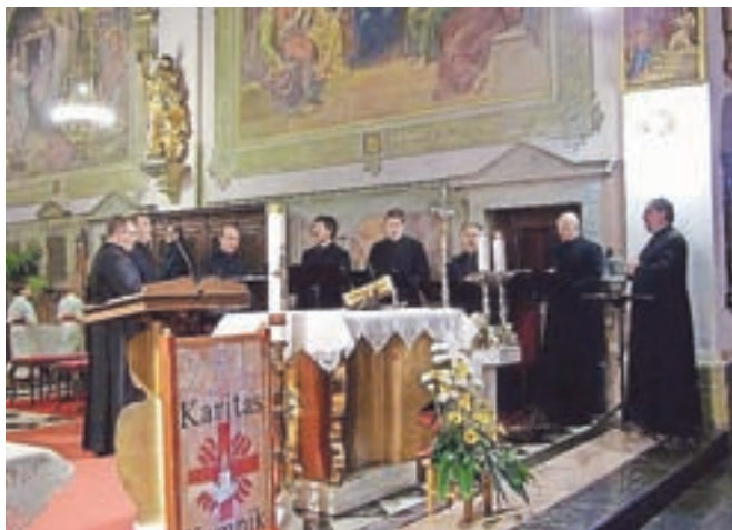
Obletnico smo praznovali z mašo, pri kateri je pel oktet Oremus, ki ga sestavljajo duhovniki.