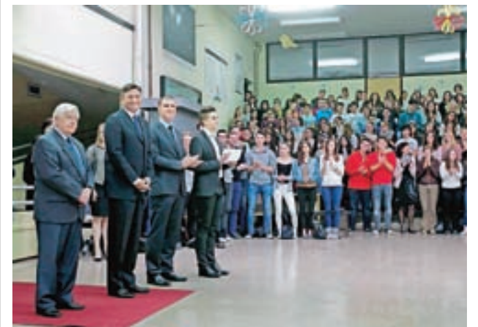
Milan Kučan in Borut Pahor sta svoja spoznanja in poglede delila z dijaki Gimnazije in srednje šole Rudolfa Maistra Kamnik.