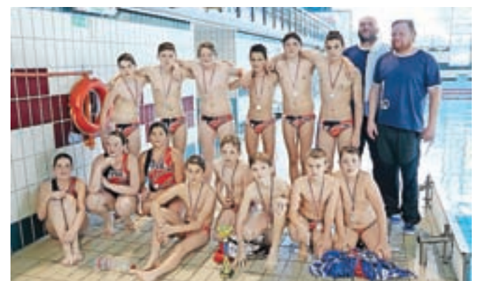
Mladi kamniški vaterpolisti so bili drugi na državnem prvenstvu.

V Kranju je bil v nedeljo, 22. maja, zaključek državnega prvenstva do 15 let. Ekipa Vaterpolskega društva Kamnik je v polfinalu visoko premagala Branik iz Maribora, v finalu pa so fantje in dekleta izgubili z AVK Triglav iz Kranja in osvojili končno drugo mesto v državi.