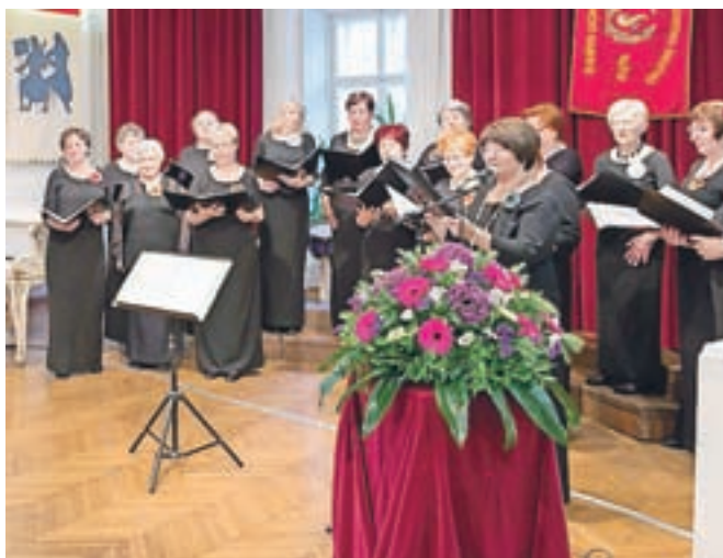
Ženski zbor DKD Solidarnost s pesmijo vstopa v peto desetletje.

Kamnik – V petek, 30. maja, so v dvorani nad kavarno Veronika kamniške »Solidarke« zapele številni zvesti publikli in s slavnostnim koncertom zaključile 40-letni jubilej skupnega druženja ob pesmi. Ženski del DKD Solidarnost Kamnik že od nekdaj zatrjuje, da je z veselo pesmijo družba prijetejša in življenje lahkotnejše. Pod vodstvom zborovodje Marka Tirana je osemnajst pevka predstavilo trinajst skladb, večinoma slovenskih ljudskih pesmi, ki jih najraje prepevajo in uvrščajo v svoj program.