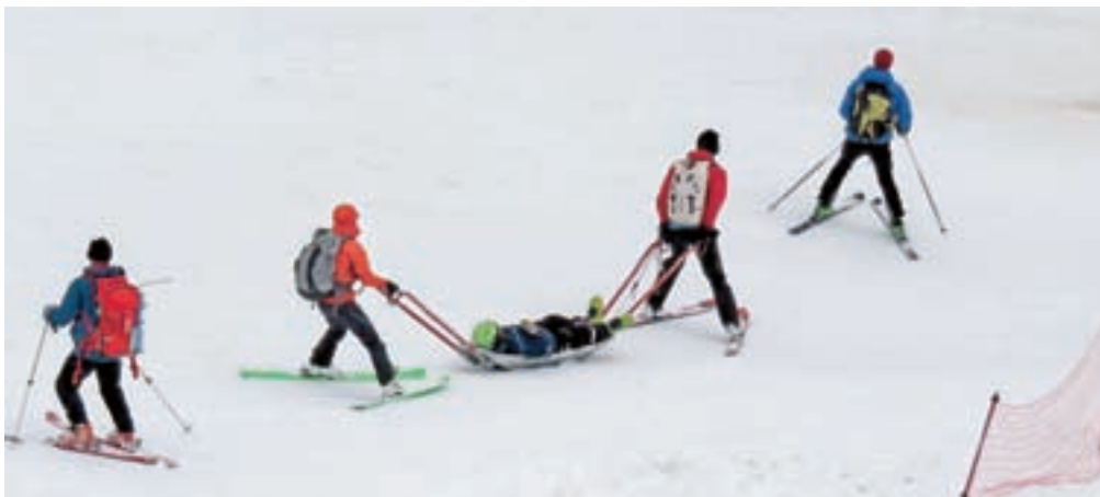
Na usposabljanje v zimskih razmerah so se predvsem pripravniki spoznali tudi z uporabo reševalnih sani.