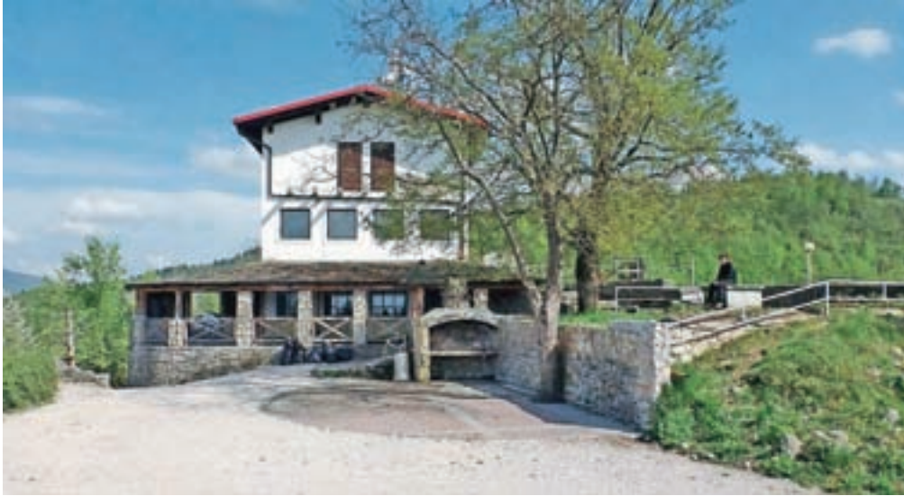
Stari grad bo 30. aprila in 1. maja znova oživel.

Prvomajska pravljica na Starem gradu je dvodnevni dogodek, ki že v svojem imenu nosi tudi nekaj simbolike. »Solidarnost in vrednote dela dandanes lahko opišemo kot pravljico. Vedno bolj postajata ti dve vrednoti nekaj izmišljenega, nerealnega. Ker si vsi skupaj želimo, da bi bilo drugače, ker se vsi na svojem področju trudimo, da bi duh solidarnosti, ki je veljal za simbol delavstva, še živel ali pa zaživel, smo letošnje prireditve ob mednarodnem prazniku dela poimenovali prvomaj-