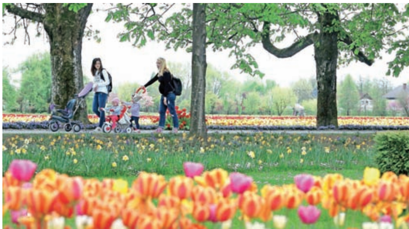
V Arboretumu v teh dneh cveti na tisoče spomladanskih cvetov.

V Arboretumu bodo jutri odprli tradicionalno razstavo spomladanskega cvetja, že 25. po vrsti. Na ogled bo do 2. maja, tudi po tem pa v parku zanimivih stvari ne bo manjkalo.