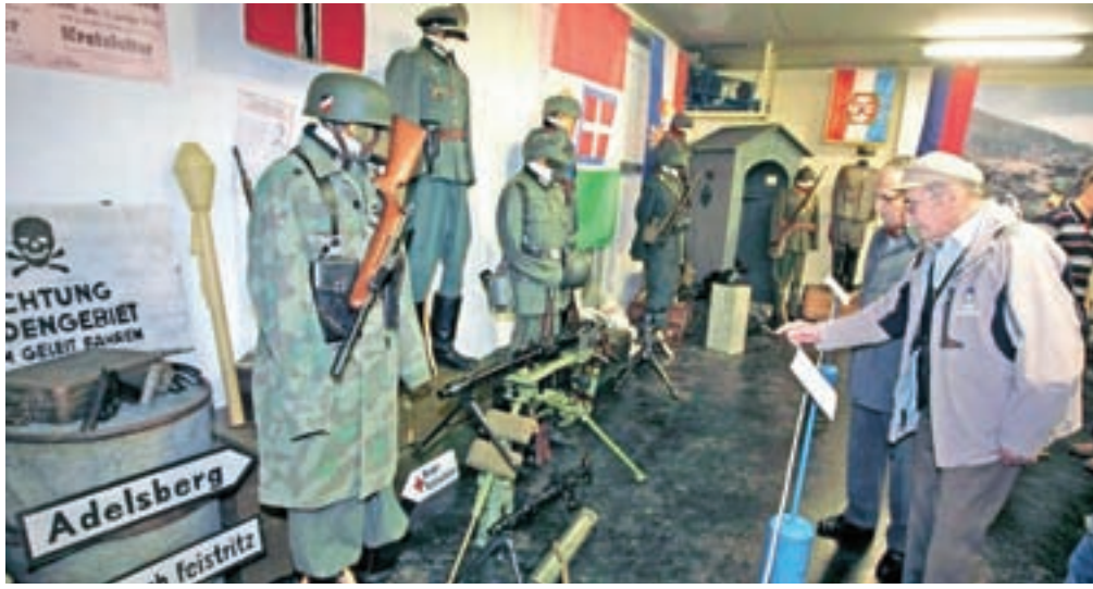
Vojni muzej Triglav je že ob odprtju privabil številne obiskovalce, v prihodnje pa ga bodo odprli po predhodnem dogovoru.