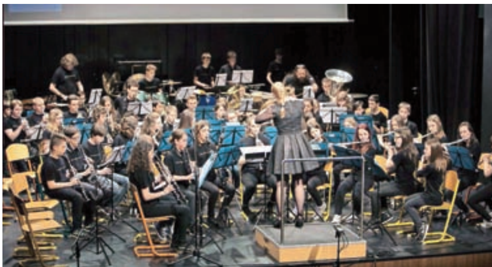
Mladinski pihalni orkester Glasbene šole Kamnik

muzikalno zelo razgibano ter se lahko ponosno predstavi tudi ob orkestrih večjih glasbenih šol.