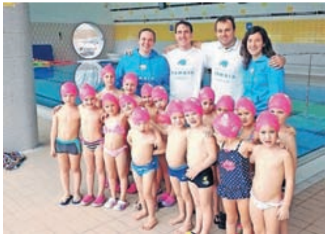
Otroci iz Zasebnega vrtca Zarja skupaj z učitelji iz Plavalnega kluba Kamnik