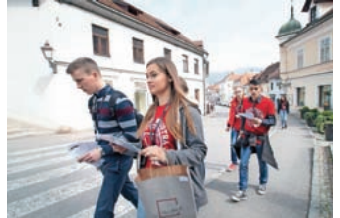
Na ekonomijadi se je pomerilo 24 ekip mladih ekonomistov iz vse Slovenije.