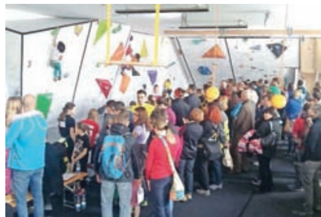
Plezalni center v starem Alpremu je bil poln nadebudnih plezalcev.

To je letos izkoristilo 284 tekmovalcev v desetih kategorijah ter njihovih spremljevalcev in staršev iz več kot dvajsetih plezalnih klubov od Sežane do Jesenic. Plezalni center v starem Alpremu je bil poln nadebudnih plezalcev od jutranjih ur do poznega večera. Med klubi iz zahodne Slovenije je bil