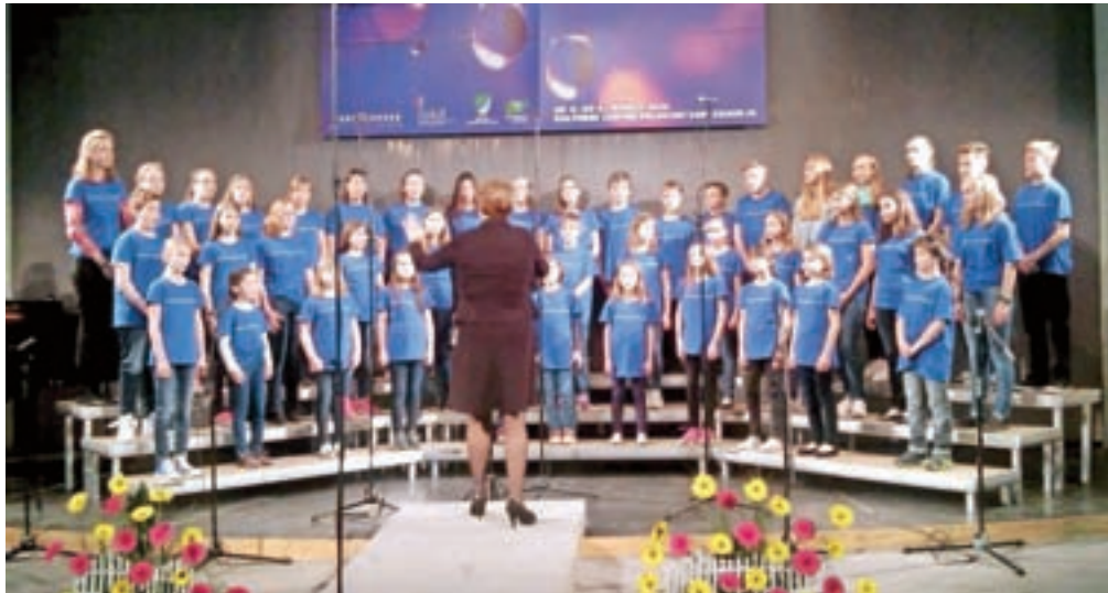
Mladinski pevski zbor Glasbene šole Kamnik