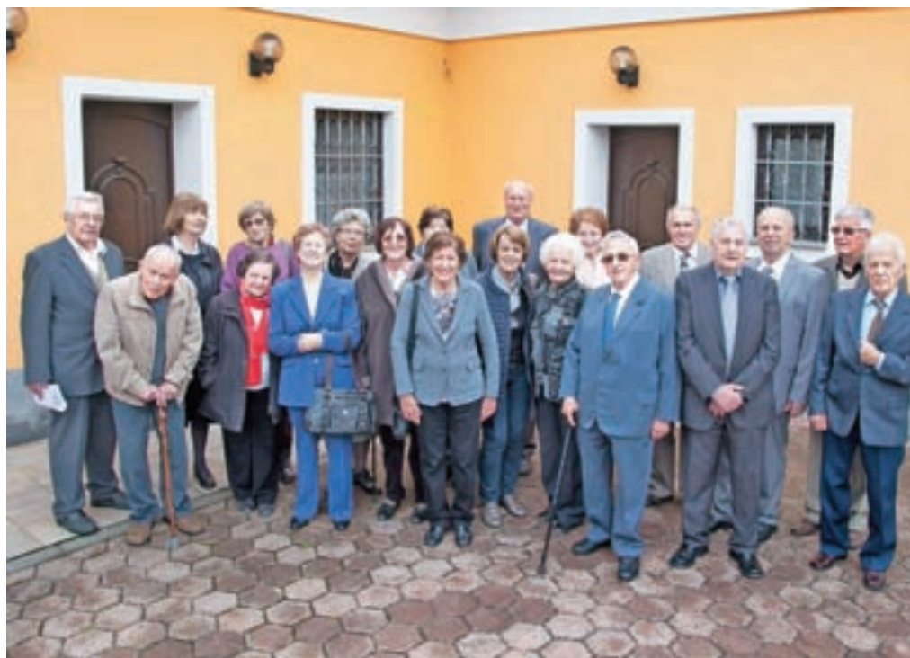
Nekdanji sošolci se dobivajo redno, še posebej ponosni pa so bili na svoji šestdeseti obletnici mature.

starih fotografij, nato pa kaj dobrega pojedli in predvsem pokramljali. Mnogi spomini so namreč še močno živi,« so mi zaupali ob obisku. »Zelo dobro smo se razumeli, to so bili povsem drugi časi kot danes, telefonov ni bilo, hodili smo peš ali se vozili z vlakom, ki je imel redne zamude, tudi po eno uro, profesorji so bili v glavnem v redu. Bili smo tudi prvi maturantje, ki smo se ob maturi ob-