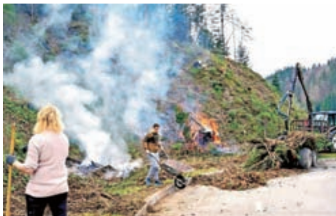
Na čistilni akciji v Snoviku so čistili tudi strugo potoka in brežino nad parkiriščem.

Srečanje s predavanjem in podelitvijo priznanj pa je bilo tudi uvod v čistilno akcijo naslednjega dne, ki je bila 2. aprila v Snoviku, Šmartnem v Tuhinju, Srednji vasi in okoliških krajih. Zbralo se je 44 čistilcev, deset jih je bilo iz Osnovne šole Šmartno v Tuhinju, devetnajst članov turističnega društva, petnajst pa zaposlenih in gostov iz Term Snovik. Čistili so potok, brežine nad parkiriščem, strugo potoka in ribico iz šibja – simbol term pri parkirišču; obnovili so ji »kožo in plavuti« z novim šibjem.