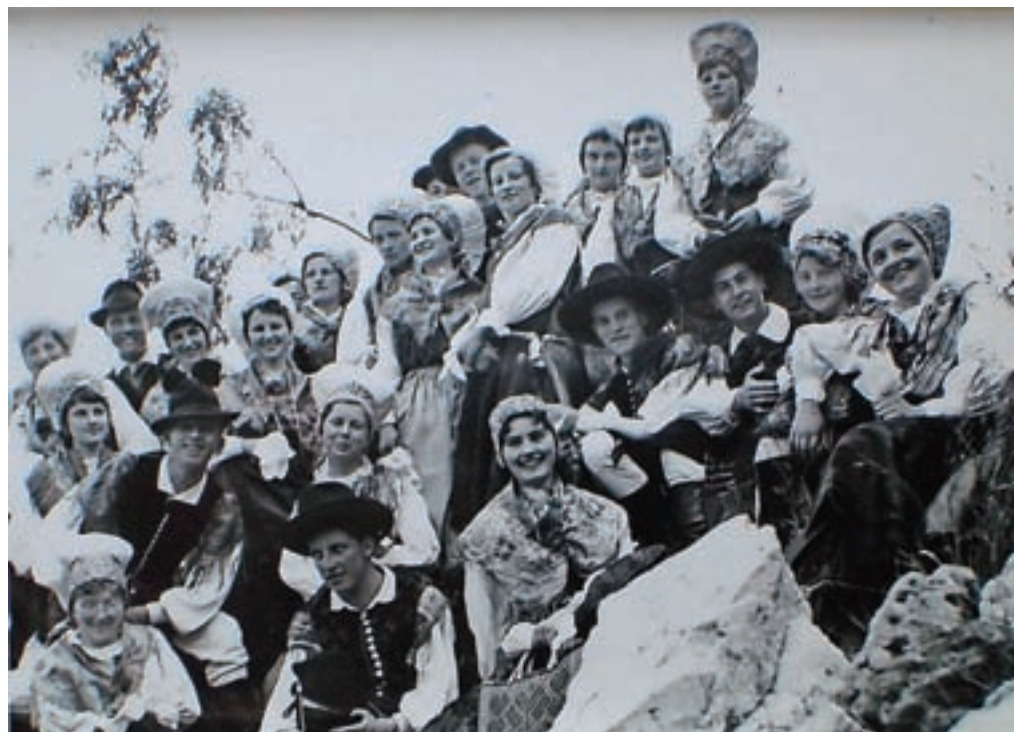
Četrta generacija kamniških maturantov pred šestdesetimi leti, ko so se ob maturi oblekli v narodne noše.

Medtem ko se sedanji dijaki pospešeno pripravljajo na letošnjo maturo, so se pred dnevi na Duplici zbrali nekdanji sošolci kamniške gimnazije, ki so praznovali že šestdeseto obletnico mature.