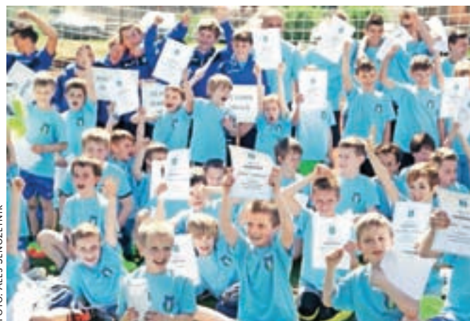
Navdušeni otroci ob zaključku Otroške nogometne šole

Otroško nogometno šolo v okviru obšolskih dejavnosti trenerji NK Kamnik že tretje leto izvajajo v osnovnih šolah Frana Albrehta, Toma Brejca, Šmartno, Stranje ter podružničnih šolah Nevlje in Mekinje. Na ta način se otroci vseh starosti enkrat tedensko srečujejo z nogometom, najbolj navdušeni