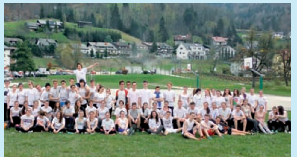
"Maistri" tekači na Eko dnevu

Avtorica: Manca Kepic, GSŠRM Press