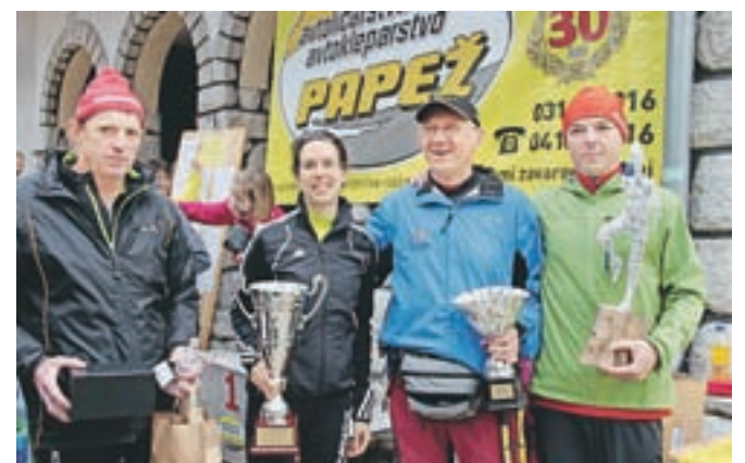
Podelili so tudi pokale za zimsko ligo.