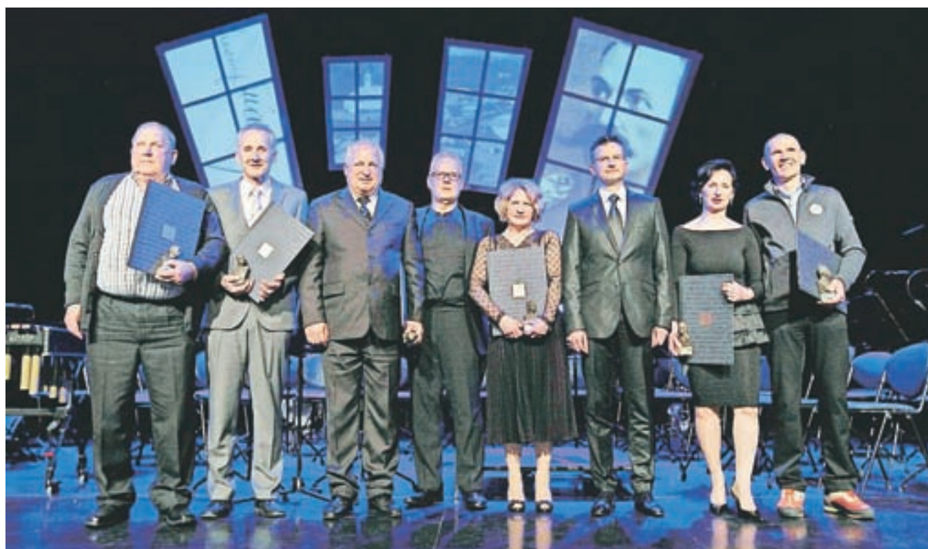
Letošnji občinski nagrajenci skupaj z županom Marjanom Šarcem