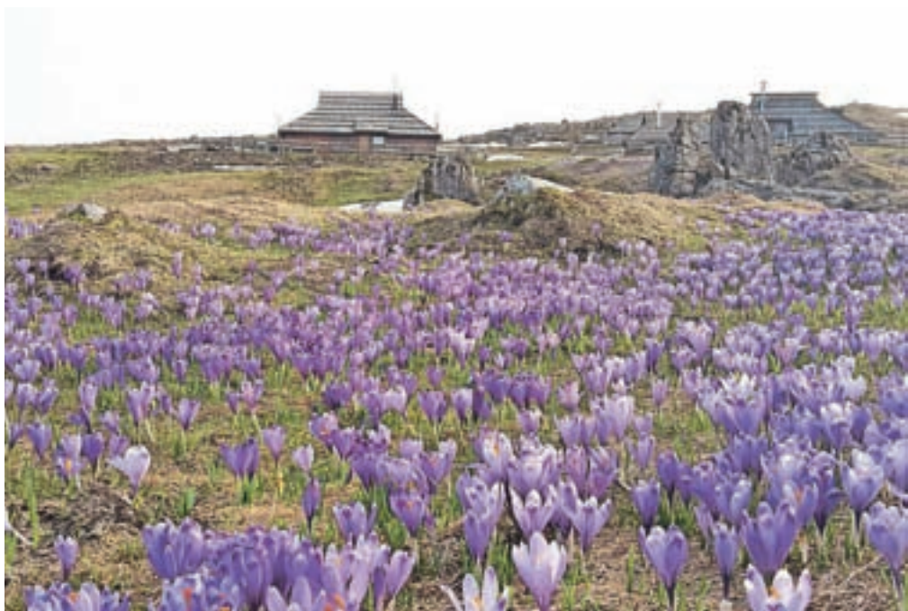
Velika planina je te dni že odeta v vijoličasto barvo žafranov.

»V povprečju nas je obiskalo med petdeset in sto petdeset smučarjev na dan. Ob lepem vremenu pa več kot petsto.«