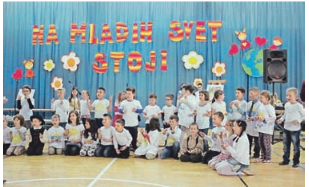
Učenci 1., 2. in 3. razreda so pripravili čudovite skupinske točke, v katerih sta se prepletala petje in ples.

Duplica – Prireditev se je začela z zabavno in nagajivo pesmijo, ki jo je zapel otroški pevski zbor, nato pa je obiskovalce nagovorila ravnateljica Violeta Vodlan, ki je dejala: »Marec ni lep mesec zgolj zato, ker je pust odpravil zimo, temveč ker imamo kar tri pomembne praznike – dan žena, dan mučenikov oziroma dan moških ter dan mamic. Žalostna sem, ko vidim, da mnogi danes teh dni ne praznujejo več tako kot včasih, češ da je to slaba socialistična nostalgija. Moji govori nikoli niso politično obarvani, vendar pa ne razumem, zakaj ne bi obdržali nečesa lepega samo zato, ker izvira iz napačnega obdobja. Zdi se mi prav, da se spomnimo na svoje drage in si podarimo majhno pozornost, pa naj bo to lepa rožica ali dobra čokolada. Tudi na naši šoli učimo otroke, da je prav, da spoštujejo razlike, ki obstajajo med njimi, in da se lepo razumejo med seboj. Toda marec je v Kamniku še več kot to, kar sem že omenila. Marec za Kamničane pomeni tudi občinsko praznovanje. To je mesec v letu, ko