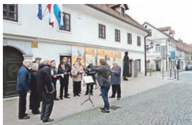
Pevci DKD Solidarnost so pripravili že trinajsto Maistrovo podoknico.

Kakšni so načrti v zvezi s širitvijo, smo vprašali tudi na občini. »Gre za prostor v Maistrovi hiši, ki je trenutno še v lasti Župnije Kamnik, kar pomeni, da bo najprej treba urediti lastništvo. Vse zadeve z ureditvijo lastništva in kasnejšim urejanjem prostora bo vodila občinska uprava. Prostor je velik približno 30 kvadratnih metrov, za ureditev pa imamo v proračunu že zagotovljenih 15 tisoč evrov. Program bo v celoti pripravil upravljavec hiše, torej Medobčinski muzej Kamnik, in sicer naj bi bila soba namenjena občasnim razstavam, različnim gostovanjem ter muzejskim večerom. Glede na to, da se obisk v Maistrovi hiši vsako leto povečuje, bi bila ureditev tega prostora velika pridobitev za muzej,« nam je sporočila Janja Zorman Macura iz županovega kabineta.