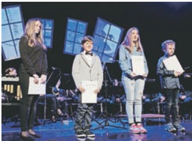
Nagrajenci likovnega in literarnega natečaja

»Kljub vsem težavam se Kamniku ni treba bati za prihodnost. Imamo mnoge danosti, ki jih bomo izkoristili v teku na dolge proge. Težki