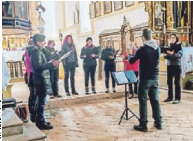
Pevke zbora Vox Annae v cerkvi sv. Primoža in Felicijana

Na tiho nedeljo, 13. marca, smo pevci KPZ Mysterium Kranj in ŽKZ Vox Annae iz Tunjic pripravili skupni koncert sakralnih skladb v cerkvi sv. Primoža in Felicijana nad Kamnikom.