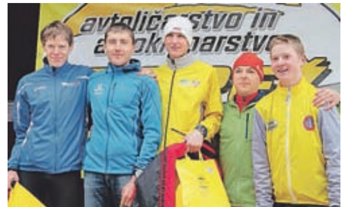
Najhitrejši tekači v absolutni kategoriji