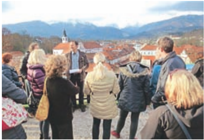
Kulturne spomenike v mestu so si kandidati ogledali tudi v živo.

Kamnik – Ravno na letošnji občinski praznik se je začel tečaj za lokalne turistične vodnike občine Kamnik, ki ga organizira Zavod za turizem in šport v občini Kamnik. Na tečaj se je prijavilo 22 kandidatov, ki so do sedaj poslušali predavanja iz zgodovine, umetnostne zgodovine, geografije in etnologije. To znanje bodo nadgradili s praktičnimi nastopi, po opravljenem izpitu pa bodo skrivnosti in lepote naše občine lahko predstavili turistom. N. K.