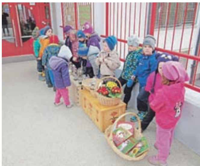
V Vrtcu Antona Medveda Kamnik so že četrto leto pripravili štafeto semen. / MATEJA LAKNAR

V našem vrtcu otroke preko različnih projektov in osebnih prepričanj pedagogov skušamo pripeljati do znanj in izkušenj, s katerimi urijo lastno razmišljanje in samostojnost. Zelene gredice, spiralne grede in čutni vrtički so le delček izkušenj, ki so jih malčki deležni prav zaradi našega prepričanja, da učimo z zgledom in tako ustvarjamo dobre navade, preko njih pa kakovostno tradicijo za boljši jutri.