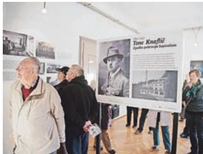
Razstavo so si že na odprtju ogledali številni obiskovalci.