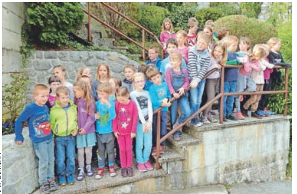
Za kulturni program na uradnem odprtju so poskrbeli učenci pevskega zbora POŠ Tunjice.

Naložba pri sanaciji plazu je zajela ureditev odvodnjavanja, gradnjo 18-metrskega kamnitega zidu v višini 4,8 metra, postavitve ograje in asfaltiranje platoja, pri sanaciji dovozne ceste pa so uredili odvodnjavanje, zamenjali cestni nasip, zgradili petdesetmetrski zid v brežini pod cesto, postavili ograjo in položili asfalt. Vrednost obeh investicij je znašala 49 tisoč evrov.