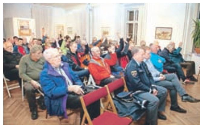
Društvo GRS Kamnik šteje 55 članov, od tega trideset aktivnih reševalcev.

Čeprav se obisk gora pri nas povečuje, pa je nesreč v gorah manj, kar gre pripisati predvsem preventivnim