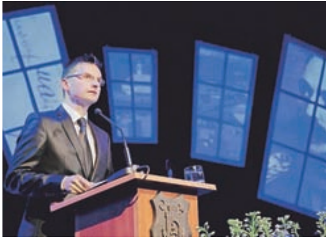
Župan Marjan Šarec

»Imenovati se Maistrovo mesto je velika čast in privilegij, hkrati pa nalaga nam, ki odločamo o dogajanju v občini, veliko odgovornost, ki se je zavedamo vsak dan znova. Praznovanje je čas, ko pogledamo uspehe, če smo količkaj kritični in realni, pa tudi neuspehe v življenju naše občine. Preteklo obdobje so v veliki meri zaznamovali težavni odnosi z državo, pri tem naša občina ni izjema. Precej naporov smo skupaj z Zdravstvenim domom dr. Julija Polca Kamnik namenili ohranitvi Nujne medicinske pomoči v obstoječi obliki, saj nas novo oblikovani državni pravilnik ni prepričal. V zadnjem času se soočamo z znižano povprečnino, ki ne omogoča normalnega delovanja Občine. Denar, ki bi ga namenili investicijam, moramo zdaj preusmerjati v izvrševanje zakonsko določenih obveznosti, predpisanih s strani države. Ta seznam je skoraj neskončno dolg. Smo na prvem mestu v Sloveniji po deležu proračuna, ki ga namenimo za delovanje vrtcev, in sicer četrtno proračuna ali 5,2 milijona evrov. Letno 520 tisoč evrov namenimo za šolske prevoze, socialni transferji se povečujejo iz leta v leto. Kje so še šolstvo, zdravstvo in druge obveze. Država nam predpisuje naloge, denar za nje pa nam odteguje iz leta v