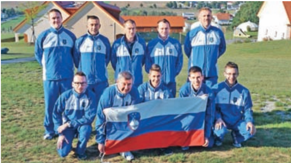
Ekipo državnih podprvakov sezone 2015/2016