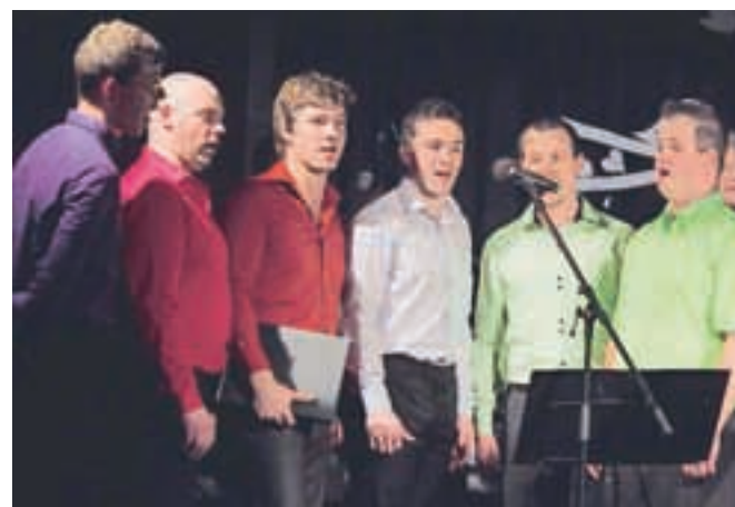
Ob dnevu žena in na gregorjevo so v Lazah nastopili Šmartinci.

Večer je vsekakor poskrbel za posebno energijo, ki jo lahko pričara le kombinacija mladosti, ubranega petja ter poleta ljubezni in topline, česar ni manjkalo niti na odru niti v dvorani. Občinstvo je bilo enotnega mnenja: »Hochemo še in še velikokrat!«