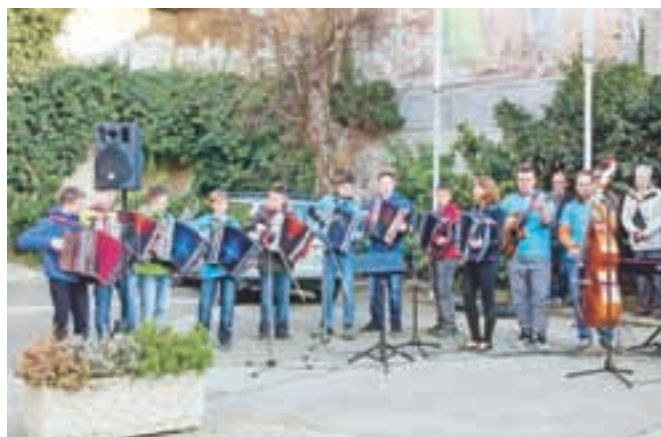
Meh so na široko raztegnili učenci Šole harmonike Martina Vodlana.