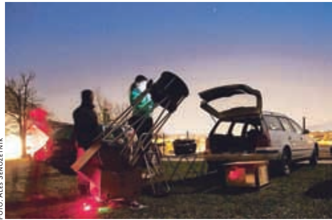
Tradicionalno spomladansko javno opazovanje nočnega neba na Zapricah je tudi letos privabilo veliko obiskovalcev.

Člani Astronomskega društva Komet in Raziskovalno-astronomskega krožka GSŠRM Kamnik so pred dnevi pripravili tradicionalno spomladansko javno opazovanje nočnega neba na Zapricah, ki ga pripravljajo že petnajst let.