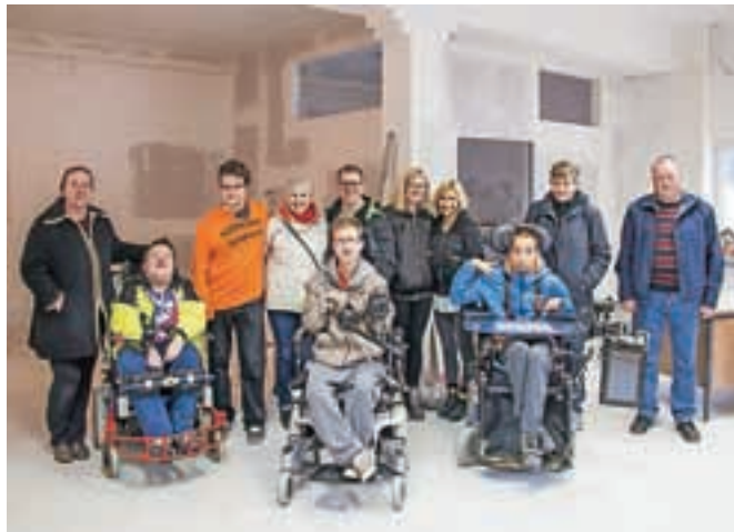
Mladi gibalno ovirani in njihovi svojci komaj čakajo, da bo njihov dnevni center nared za uporabo.