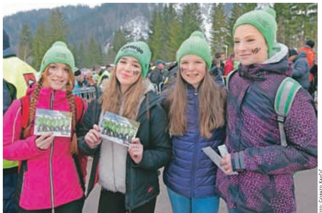
V Planici so navijali tudi učenci iz kamniških osnovnih šol. Na sliki učenke iz OŠ Stranje.

Pretekli konec tedna je bil v znamenju planiškega skakalnega praznika, ki si ga je v štirih dneh ogledalo več kot 110 tisoč obiskovalcev iz cele Slovenije pa tudi iz tujine. Četrtek je bil v znamenju otrok. Največ jih je tradicionalno pripeljala Zavarovalnica Triglav. Med njimi so bili tudi iz šol v občini Kamnik. V dolini pod Poncami je bil na prvi posamični tekmi v konkurenci tudi Matjaž Pungertar iz Vrhpolj, ki pa mu ni uspelo osvojiti točk svetovnega pokala.