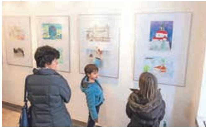
Razstava likovnih in literarnih del bo na občini na ogled še do sredine aprila.

Natečaja so se udeležili učenci 2. in 3. triade iz OŠ Frana Albrehta Kamnik, OŠ Toma Brejca, OŠ Marije Vere, OŠ Stranje, OŠ Šmartno v Tuhinju in OŠ Komenda Moste. Z likovnimi deli je sodelovalo 25 učencev, 26 pa jih je prispevalo dvajset literarnih del – vsi