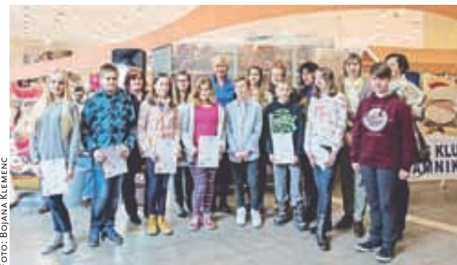
Vsi sodelujoči kamniški učenci so na odprtju razstave Plakat miru – Mir povezuje prejeli priznanja.

V organizaciji Lions kluba Kamnik je v Qlandiji Kamnik potekalo odprtje razstave Plakat miru.