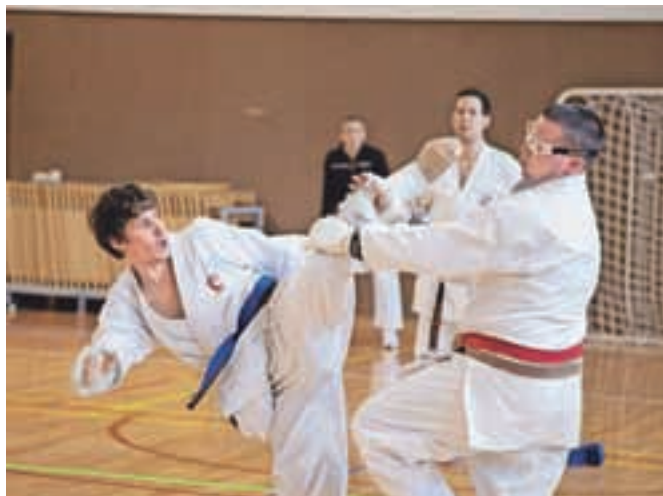
Na državnem prvenstvu v Kamniku so gledalci lahko uživali v atraktivnih borbah.