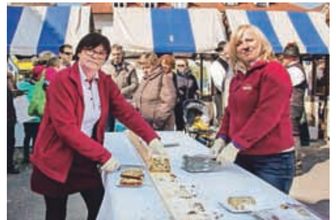
Obiskovalci velikonočne tržnice so pokusili tudi orehovo potico velikanko, dolgo šest metrov in težko sedemnajst kilogramov.