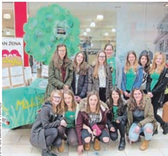
Učence OŠ Šmartno v Tuhinju s svojim vozilom MaliSafari

Komisija je naše delo nagradila z zlatim priznanjem. Dobili pa smo še dodatno zlato priznanje za najboljšo turistično tržnico po mnenju komisije mladih. Učenci OŠ Šmartno v Tuhinju bodo svojo nalogo predstavili še na zaključni prireditvi festivala Turizmu pomaga lastna glava, ki bo 19. aprila potekala v Ljubljani.