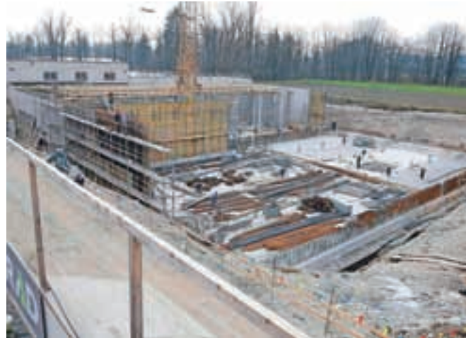
Nadgradnja CČN Domžale-Kamnik bo zaključena do avgusta letos.

Domžale – Aktivnosti za začetek nadgradnje CČN Domžale-Kamnik so se začele že leta 2007, pogodba županov občin investitoric (Domžale, Kamnik, Mengeš, Trzin in Cerklje) z izbranim izvajalcem je bila podpisana junija 2014, dela na terenu pa so se začela nekaj mesecev kasneje. Projekt je vreden 15,5 milijona evrov in bo v višini 85 odstotkov sofinanciran z evropskim in državnim denarjem, za ta znesek pa bodo zgradili nov vstopni