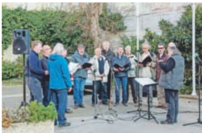
Liraši že vrsto let na Glavnem trgu organizirajo prireditev Pozdrav pomladi.