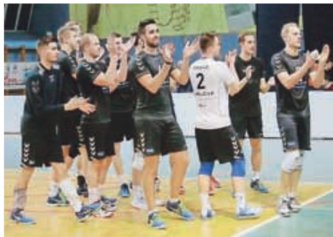
Kamniški odbojkarji danes in jutri igrajo na zaključnem turnirju srednjeevropske lige.

Prava poslastica se obeta tudi v mariborski dvorani Lukna, saj se bosta, prav tako danes, že ob 17. uri še šteti v letošnji sezoni pomerili Nova KBM Branik in odbojkarice Calcita Volleyballa. Calcitovke so zadnji medsebojni dvoboj dobile, in to v gosteh, na boleč poraz v finalu pokala Slovenije pa bodo še bolj pozabile, če bodo danes premagale bankirke, ki so jih lani premagale v finalu srednjeevropske lige. Zmagovalke tega dvoboja bodo v soboto igrale v finalu proti boljši ekipi iz madžarskega obračuna med ekipama Linmar Bekescsaba in Vasas Budimpešta.