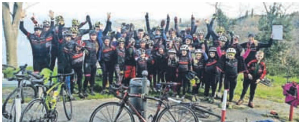
Udeležba na letošnjih pripravah calcitovcev je bila rekordna.

Kamnik – Med 15. in 21. februarjem je bil Debeli rtič dom gorskih kolesarjev Calcit Bike Teama. Nekateri cel teden, drugi manj, so tam opravili priprave in postavili temelje za sezono 2016, ki se bo začela kmalu. Priprav so se udeležili člani A-ekipe kot tudi mlajši tekmovalci, ki so tako zimske počitnice preživeli na slovenski obali. Večino časa so bili na kolesu, niso pa manjkali niti treningi na nogah, v telovadnici, druženja ter pogovori, skozi katere so tkali prijateljske vezi. Letos je bila udeležba rekordna. Ne glede na to, da so bile priprave v času zimskih počitnic in je veliko družin šlo na smučanje, je bilo na Debelem rtiču 46 calcitovcev. V primerjavi s prejšnjimi leti so bili na pripravah le