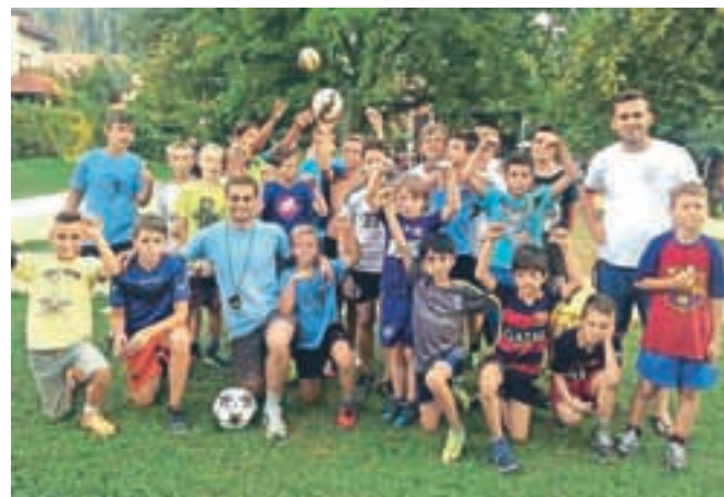
V NK Kamnik vzgajajo mlade generacije nogometašev.

Nogometaši NK Kamnik skupaj z društvom Makadam sodelujejo v programu (P)ostani dober športnik, pomagaj prijatelju, v katerem si pomagajo pri učenju. »Stremimo k temu, da so otroci uspešni tudi v šoli. Izobrazba je zelo pomembna,« se pomena znanja za-