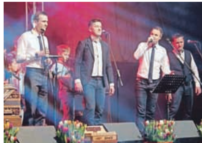
Skupina Špica