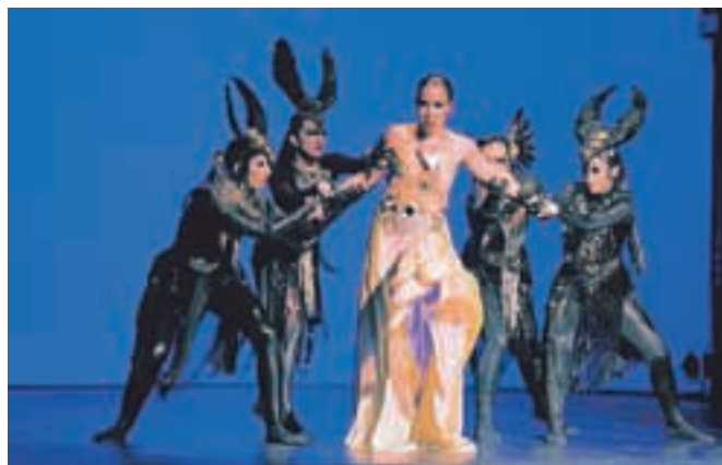
Vrhunec Nawarja je bil tudi letos sobotni gala večer.