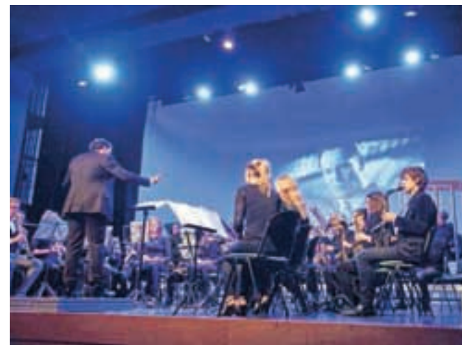
Člani Pihalnega orkestra DKD Solidarnost so navdušili na koncertu v Domu kulture Kamnik.