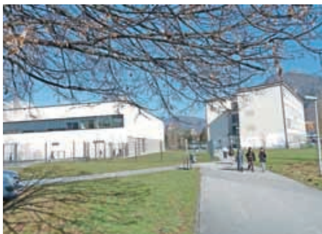
Občina na območju obeh mestnih osnovnih šol namerava urediti manjši stadion, več športnih igrišč in površine za učilnice na prostem.

Na občini priznavajo, da je zaradi gradnje nove šole leta res izgubila zunanje športne površine, ki so jih v preteklosti uporabljali učenci šole, v popoldanskem in večernem času pa so bile priljubljeno zbirališče mladih, a se je to zgodilo z zave-