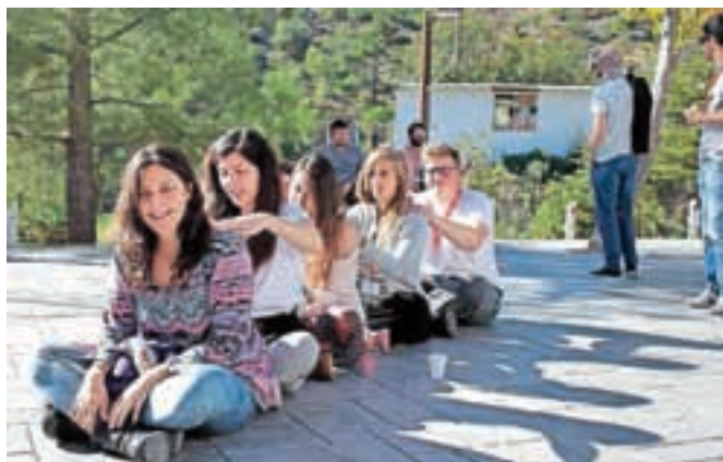
Člani Mladinskega centra Kotlovnica so lani sodelovali v več mednarodnih projektih.

Veseli smo, da se bo število izmenjav in usposabljanj v tem letu še okrepilo, k njim pa vabimo vse mlade, ki jih zanima potovanje ter pridobivanje izkušenj na najrazličnejših področjih. Kontaktirajte nas na info@kotlovnica.si ali international@kotlovnica.si.