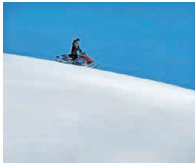
Na Veliki planini se ponavlja stara zgodba: kljub prepovedi motorne sani divjajo po vsej planoti.