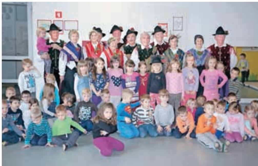
Otroci enot Sneguljčica in Marjetica so tokrat v goste povabili člane folklorne skupine Društva upokojencev Komenda.

Kamnik – Vrtec Antona Medveda Kamnik se je v šolskem letu 2013/14 vključil v projekt Etika in vrednote v vzgoji in izobraževanju, v katerem sodeluje z Inštitutom za etiko in vrednote Jože Trontelj. Program želi podpreti vrtec in šole pri uresničevanju njihovega vzgojnega poslanstva in temelji na spoznavanju, da imajo vrtec in osnovne šole zelo pomembno vlogo pri razvoju