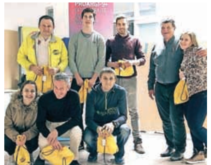
Klub ne bi deloval tako uspešno brez dobre trenerske ekipe.