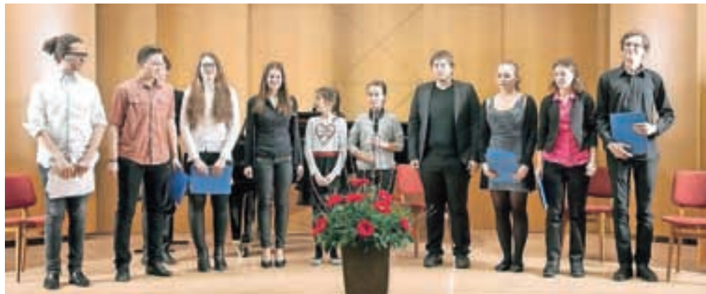
Nastopajoči pesniki in glasbeniki

Ceni največjega slovenskega pesnika Franceta Prešerna. »Mislim, da Prešeren ne more zastarati. Je vedno aktualen, mojstrski,« pove o pesniku, ki ga mnogi njegovi vrstniki ne marajo preveč. »Veliko mladih zamahne