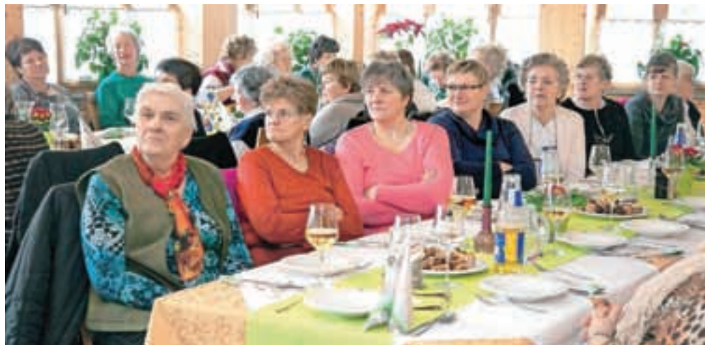
Društvo šteje okoli 70 članic z območja Komende in Kamnika.

pogostitev ob občinskem prazniku Občine Kamnik, nastopile so v oddaji Dobro jutro, kjer so predstavile, kako so nekoč jedli Kamničani. Pripravile so tradicionalne jedi, kot je denimo velikoplaninski trnič, ter druge dobrote iz lokalnega okolja. Društvo tako skrbi za promocijo kamniške in komendske regije na državni ravni. Društvo podeželskih žena Kamnik - Komenda šteje okoli sedemdeset članic. Tako kot nekatera druga društva si želijo več mladih deklet, na katere bi lahko prenašale svoje znanje in izkušnje. Poleg vseh opravil in aktivnosti v društvu pa jim včasih godi zgolj dober klepet v družbi prijateljev. Tudi za to najdejo čas, če ne drugače, pa na vsakoletnem oddihu v Termah Topolšica.