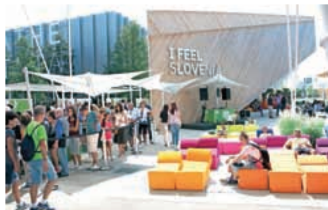
Njihovi živobarvni modularni pohištveni sedeži so navdušili že na razstavi EXPO v Milanu.

V zgolj dveh letih so s svojimi sedeži uspeli priti na zahtevne trge evropskih držav, predvsem Francije, Italije, Švice in Skandinavije, na trge Bližnjega in Daljnega vzhoda, pa tudi v ZDA, Kanado, Mehiko, Kolumbijo, Peru, Rusijo in Tajvan. Njihovi kupci so zahtevnejše stranke, in sicer dizajnerske trgovine in opremljevalci objektov v višjem cenovnem razredu. »V tujini postajamo močno prepoznavni, a vsi naši izdelki so plod slovenskega znanja in dela. Sodelujemo namreč izključno s slovenskimi kooperanti. V Kamniku in bližnji okolici so to bolj posamezni mojstri, s katerimi sodelujemo pri prototipih in manjših serijah, ostali kooperanti za šivanje, les in peno ter naša skladišča pa so po vseh koncih Slovenije. Naša ključna skrb v tem trenutku je proizvodnjo organizirati na način, da bomo lahko zadostili vsem potre-