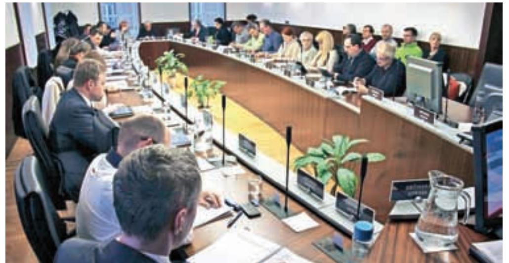
Občinski svetniki na februarski seji