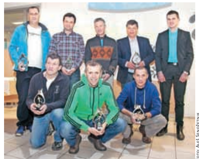
Priznanja so prejeli tudi predani organizatorji.

Tekaški pokal občine Kamnik bo potekal tudi letos, so pa organizatorji pripravili nekaj novosti. Med drugim so med člani in veterani dodali dve novi kategoriji.