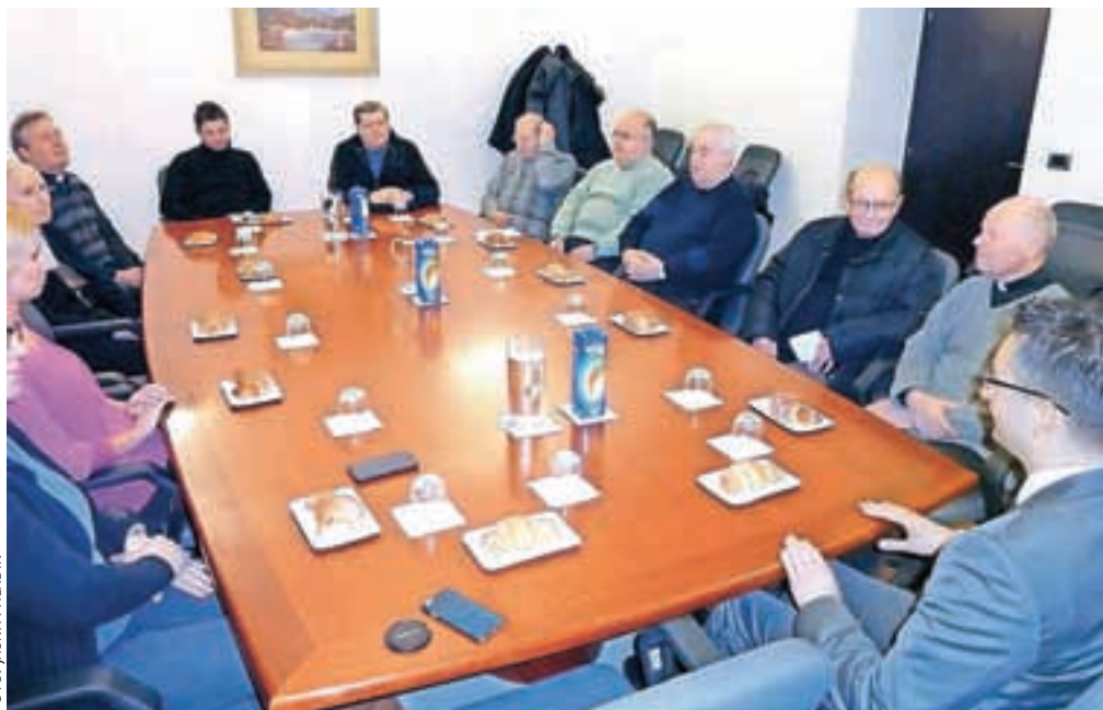
Srečanje z županom so župniki izkoristili za vrsto vprašanj pa tudi sproščeno druženje.