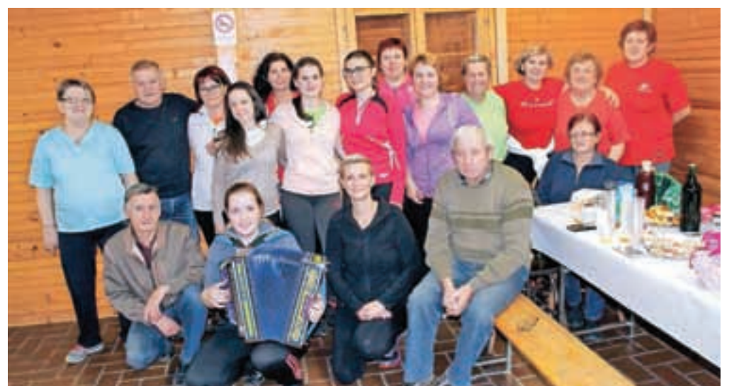
Udeleženci telovadbe so si vadbeno uro v prednovoletnem času popestrili še s plesom, dobro hrano in srečelovom.

Volčji Potok, zato v svoje vrste vabijo tudi ostale krajanke in krajanke pa tudi občane od drugod.