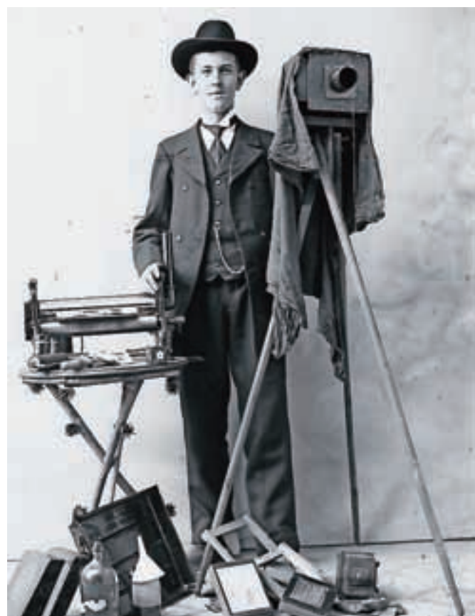
Avtoportret Petra Nagliča okoli leta 1903