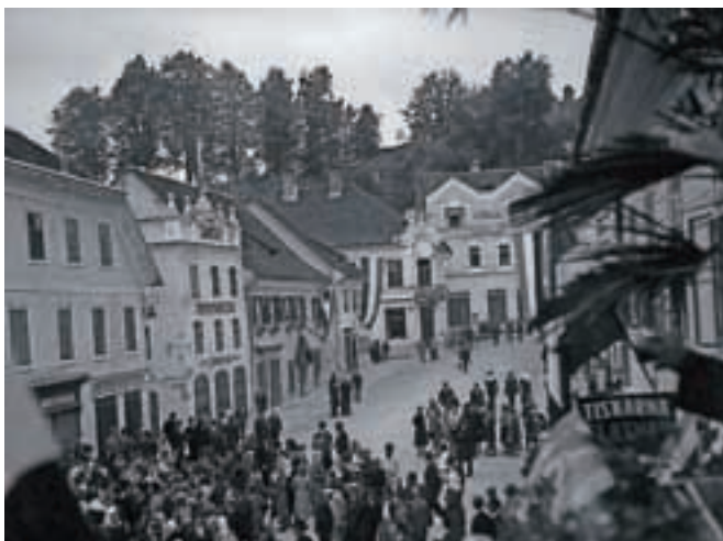
Ljudje na Kamniških ulicah