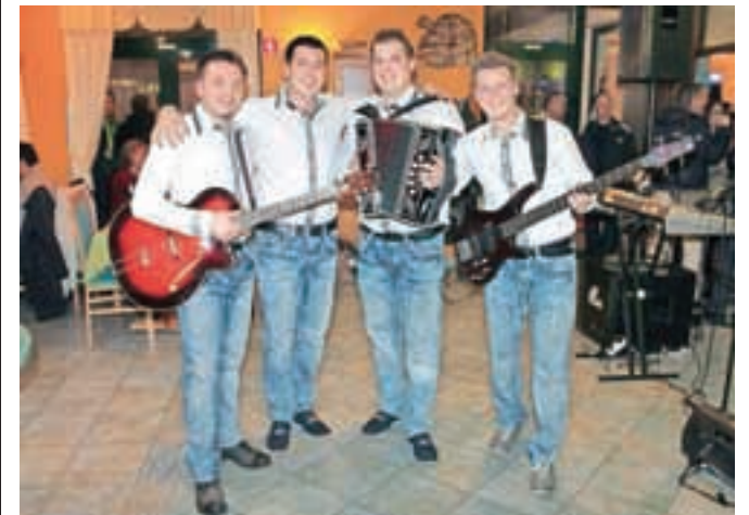
Ansambel Poljanšek je izdajo prve zgoščenke praznoval na Črnicu.