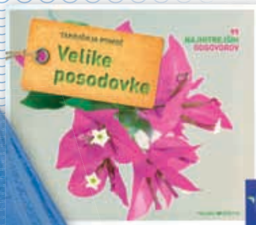
priročnik Velike posodovke

Popust in darilo veljata le za fizične osebe.