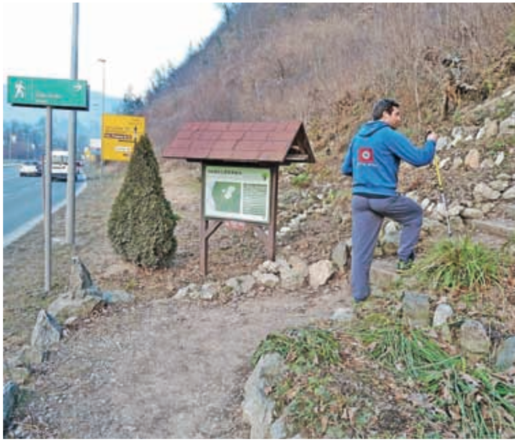
Sanacija žledoloma na območju pohodne poti na Stari grad (iz smeri obvoznice) se bo predvidoma začela v ponedeljek.

Dostopna pot je v zemljiškem katastru zavedena kot javno dobro v upravljanju Občine Kamnik, hkrati pa pot opravlja tudi začasno funkcijo gozdne vlake za spravilo lesa iz zasebnih gozdov v okolici. Spodnji del pohodne poti (do »mličkov«) se nahaja tudi v območju razglašanih varovalnih gozdov, pravijo na Zavodu za gozdove.