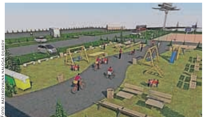
ParkIraj, kot so si ga zamislili kamniški dijaki.

ParkIraj bi se po njihovi zamisli nahajal na zemljišču nekdanje smodnišnice, s tem pa bi oživili zapuščen degradirano območje, odprli nova delovna mesta, zaščitili mestno jedro pred smogom, povežali kulturno in gostinsko ponudbo, turistom pa omogočili, da doživijo Kamnik in okolico na nekoliko drugačen način. Na način, ki je bolj prijazen do narave in do človeka, so prepričani. Parkirišče bi bilo zeleno, družabno, okolju prijazno in multifunkcijsko. Njegovo inovativnost bi predstavljala zelena travnata površina, natančneje votli tlakovci naravnih materi-