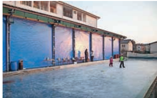
Ledena ploskev prekriva zunanji stezi balinarskega igrišča.