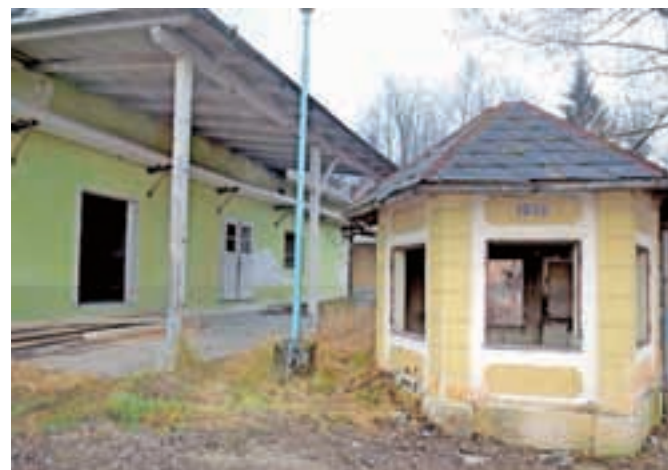
Nekdanja smodnišnica je na videz zapuščena, a hrani nešteto zgodb.

niško žebljarno preuredili v tovarno smodnika. Za lažje delo so iz Kamniške Bistrice speljali vodo in jo usmerili na območje tovarne, moč vode je poganjala stroje. Prvo letošnje samoizobraževanje kamniških turističnih