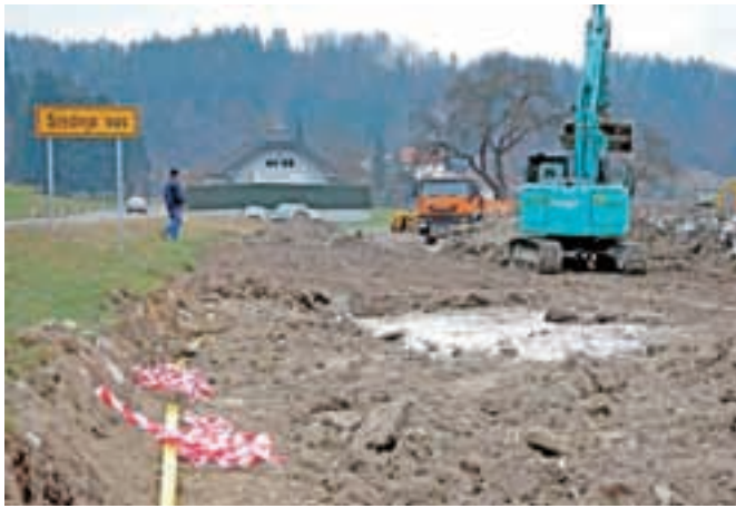
Gradbišče v Srednji vasi, kjer delavci polagajo cevi za kanalizacijo in vodovod.

Srednja vas – Tuhinjska dolina je posejana z gradbišči, saj občina Kamnik skupaj s svojimi izvajalci pospešeno gradi povezovalni kanal od Kamnika do Šmartnega v Tuhinju za kanalizacijo, ponekod pa tudi vodovod. Kot poročajo z občinske uprave, je bilo v minulem tednu položenih že skoraj kilometer cevi na območju Nevelj, približno 740 metrov na Podhruški, 200 metrov v Srednji vasi proti Lokam, 540 metrov na Vasenem in 250 metrov v Buču. J. P.