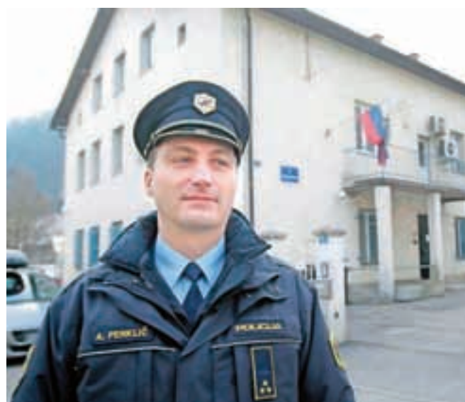
Stavba policijske postaje je nujno potrebna vzdrževalnih del.

»V lanskem letu je bilo kaznivih dejanj v obeh občinah celo malenkost manj kot leta poprej. Sama varnost v Kamniku in Komendi je na obvladljivem nivoju, negativni pojavi in operativni dogodki so v vsakoletnem povprečju in policisti smo jim kos.«