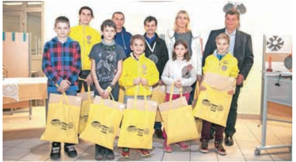
Udeleženci vseh šestih tekov tekaškega pokala občine Kamnik