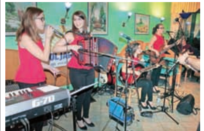
Nastopila so tudi dekleta iz ansambla Skrivnost.