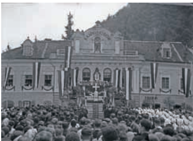
Praznovanje dvajsete obletnice Kraljevine SHS leta 1938 pred Kamniškim domom / FOTO: PETER NAGLIČ