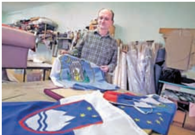
Pri Šuštarjevih sešijejo največ slovenskih in občinskih zastav.

Šuštarjevi v Srednji vasi imajo uspešno tapetniško obrt, manj občanov pa ve, da šivajo tudi zastave.