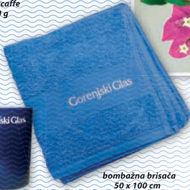
bombažna brisača 50 x 100 cm