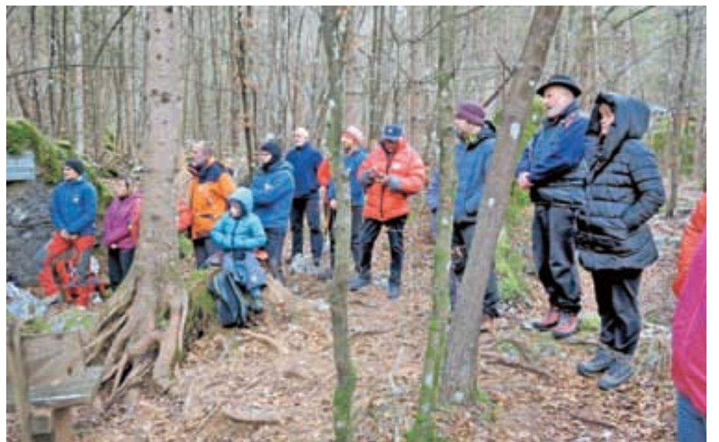
V spominskem parku v Kamniški Bistrici / FOTO: BOJAN POLLAK

V nedeljo pa je bila v spominskem parku v Kamniški Bistrici še krajša spominska