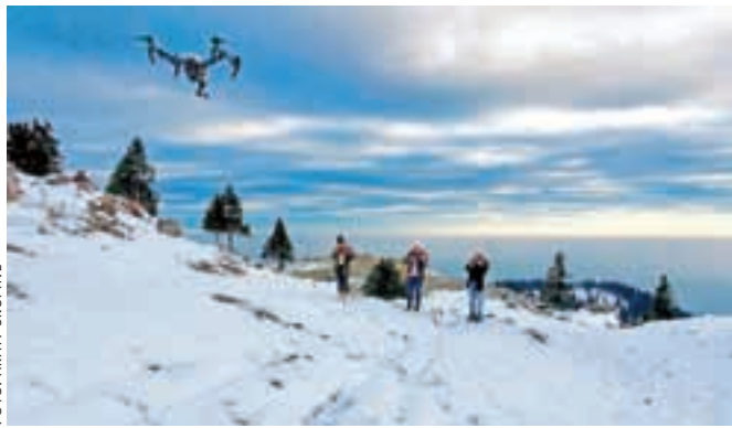
Velika planina se je znova izkazala za slikovito kuliso.