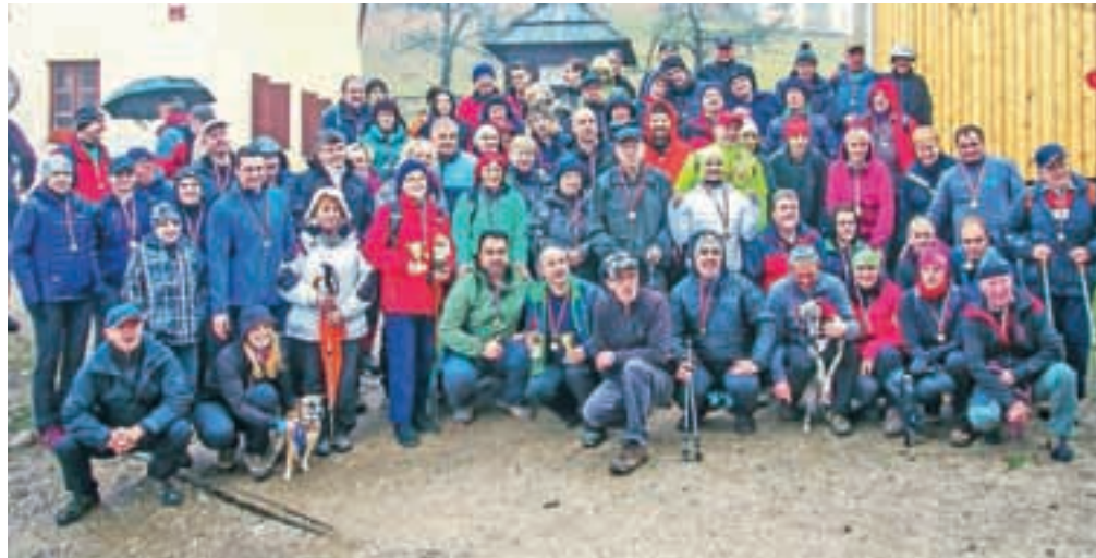
Navkljub slabemu vremenu se je na tradicionalni podelitvi priznanj zbralo veliko število pohodnikov na Sv. Primoža.