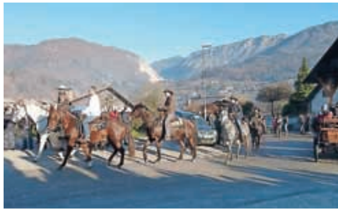
Člani Veronikine konjenice s svojimi konji v Zgornjih Stranjah

Konje so blagoslovili tudi v Godiču, Križu pri Komendi in nekaterih drugih krajih.