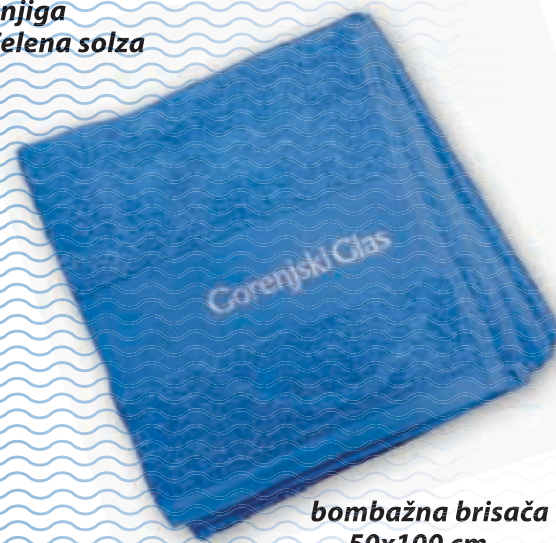
bombažna brisača 50x100 cm

Popust in darilo veljata le za fizične osebe. Daril ne pošiljamo po pošti. Količina daril je omejena.