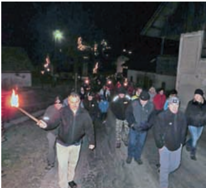
Štefanovega pohoda z baklami se vsako leto udeleži več pohodnikov.

majhno pozornost. Nasmejanji otroški obrazi nam bodo še dolgo ostali v spominu in zagotovo nas bo Dedek Mraz še obiskal. Že prvi dan novega leta smo bili aktivni in tako smo se z najbolj pridnimi pohodniki odpravili na peti Prvojanuarski pohod na Jasovnik. Letos smo z udeležbo še posebno zadovoljni, saj so se pohoda udeležili tudi pohodniki iz Kamnika, Zagorja in Ljubljane. Pohodniški zvezek na vrhu Jasovnika je dobil nove podpise, udeleženci pa so pot do cilja preživeli v prijatni družbi. Člani turističnega društva se zahvaljujemo vsem, ki ste bili v naši družbi, in upamo, da se zopet vidimo naslednje leto.