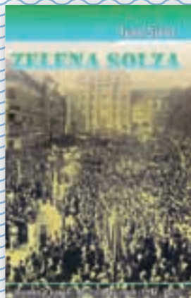
knjiga Zelena solza