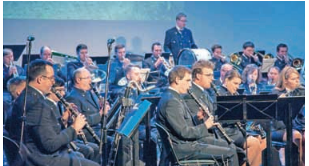
Člani Mestne godbe Kamnik na svojem tradicionalnem Prazničnem koncertu v Domu kulture Kamnik