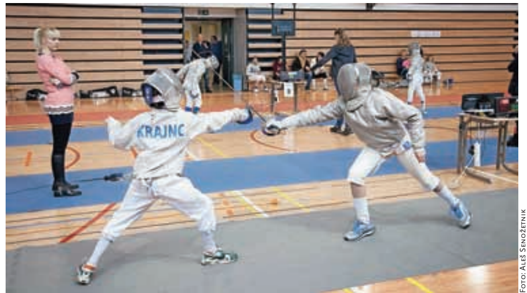
Za razliko od floreta in meča pri sabljanju s sabljo štejejo le dotiki nad pasom.

detki v torzo. Pri tekmovalcu s sabljo pa so veljavni vsi zadetki nad pasom.« Čeprav gre za starodavno disciplino, sabljanje s pridom izkorišča sodobne tehnologije. Tekmovalci so ožičeni, tako da vsak dotik nasprotnika beležijo merilne naprave. Zmaga tisti, ki prvi zbere pet dotikov. Kljub temu da je sabljanje izredno eleganten šport, je pri nas slabo razvit. »V Sloveniji obstajajo zgolj trije klubi, kjer učijo sabljanje s sabljo. Med njimi je tudi naš, ki deluje v prostorih nekdanje tovarne Stol na Duplici,« je dejala Prislanova. Kamniškimi sabljačem je