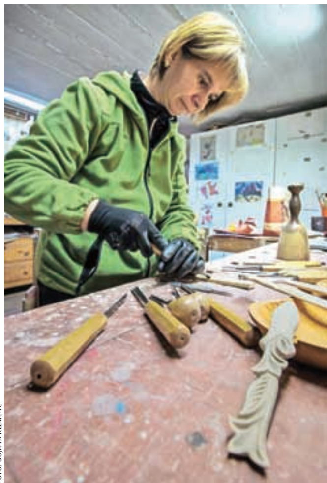
Rezbarske izdelke izdeluje predvsem iz lipovega lesa.

Kamnik – Mladinski center Kotlovnica bo konec januarja organiziral že tretji Festival svobodne video produkcije. »Namen festivala je dati priložnost neodvisnim produkcijskim skupinam in posameznikom, da pokažejo svoja dela in izmenjajo izkušnje s področja video produkcije. Festival ni žanrsko opredeljen, organizatorje pa poleg vsebine zanima predvsem presežki v uporabi produkcijskih tehnik in načinov izdelave del,« pravijo mladi iz Kotlovnice, ki so v lanskoletni izvedbi predvajali 28 izbranih video del v kategorijah dokumentarni, tabu, art, promo spot in igrani. Tudi letos k sodelovanju vabijo avtorje svobodnih video del, ne glede na način produkcije, ki so nastala v letih 2014 in 2015. Prijave (prek spletnega obrazca) zbirajo do nedelje, 17. januarja. Prispela dela bo pregledalo vodstvo festivala, najboljši filmi pa bodo nagradjeni z nagrado zlata ribica. J. P.