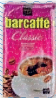
kava Barcaffé 250 g