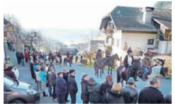
V občini je že vrsto let najbolj obiskan blagoslov konj v Zgornjem Tuhinju.