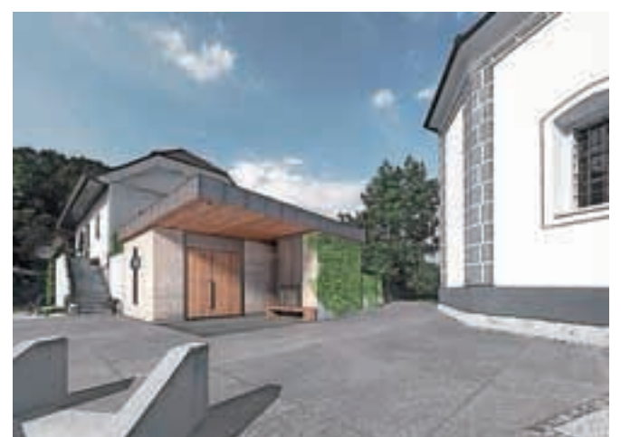
Takole bo videti mrliška vežica v Podgorju, na katero krajanji čakajo že štiri desetletja.