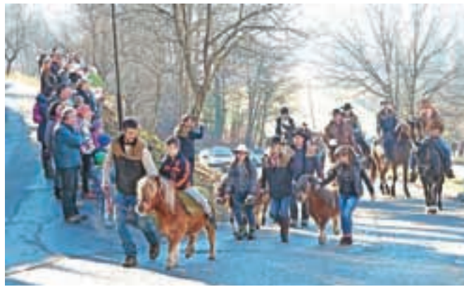
Člani Konjerejskega društva Tuhinj so blagoslov organizirali že dvajseto leto zapored.