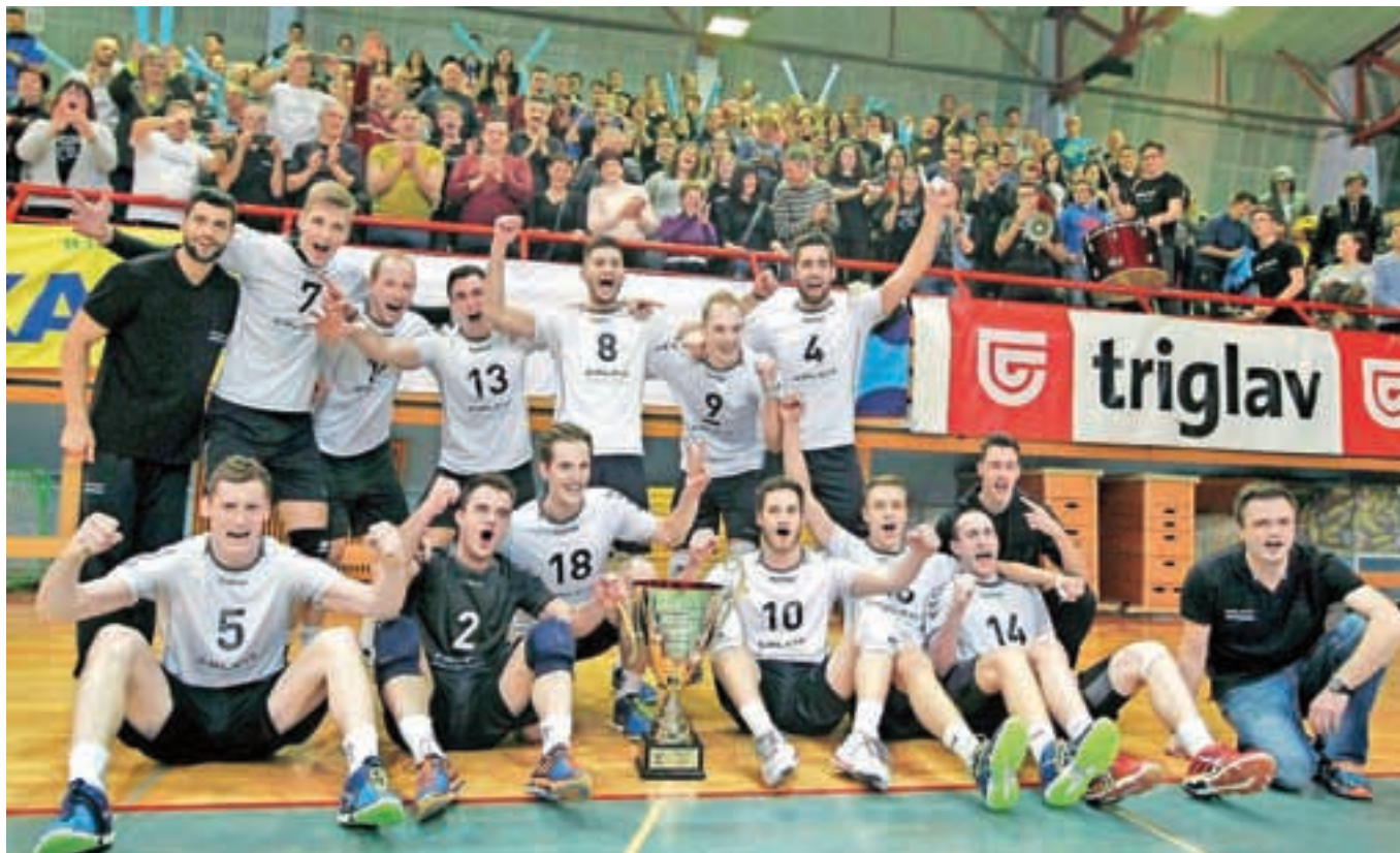
Odbojkarji Calcita Volleyballa s pokalno lovoriko

Odbojkarji moštva Calcit Volleyball so v nedeljo na finalu zaključnega turnirja Pokala Slovenije v odbojki, ki so ga gostili prav v Kamniku, premagali odbojkarje ACH Volley in si po petnajstih letih znova priborili naslov pokalnih prvakov.