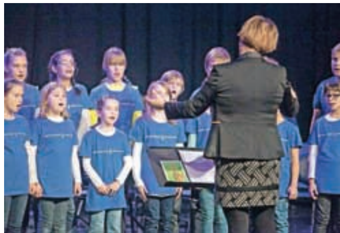
V letošnjem šolskem letu so na GŠ Kamnik okrepili pevski zbor in orkestrske zasedbe.

nekaterih sprememb prišlo tudi zaradi njenega uvajanja na novo delovno mesto, čemur so se morali prilagoditi tudi njeni kolegi. Kljub temu uspehi mladih glasbenikov niso izostali. Že v začetku leta so učenci violončela, saksofona, citer in baleta dosegali visoke uvrstitve na regijskem in državnem tekmovanju.