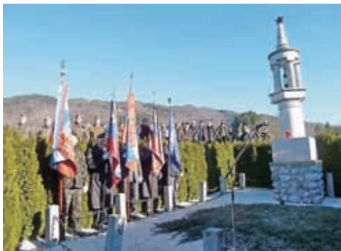
Slovesnosti ob spomeniku so se udeležili tudi praporščaki in člani Kulturno-zgodovinskega društva Triglav, za pesem pa so poskrbeli pevci DKD Solidarnost.

šnja družba: »Ni dovolj ponavljati in poudarjati pomena ekonomije in materialnega blagostanja, kar je po mnenju nekaterih edino, kar prinaša srečo ljudem. Brez zavedanja o koreninah lastnega naroda, o njegovi zgodovini in vrednotah, na katerih je temeljila, ne bomo uspešni, ne bo blagostanja in kar je najhuje – tudi miru ne bo! Zato je sekanje teh korenin naroda bolešno početje, ki nam ne bo prineslo ničesar, razen hlapčevstva,« je med drugim poudaril. K temu, da moramo za enotnost in medsebojno spoštovanje največ narediti najprej pri sebi, od tu pa se bodo vrednote razširile na vso družbo, je zbrane pozvala tudi povezovalka programa Barbara Božič.