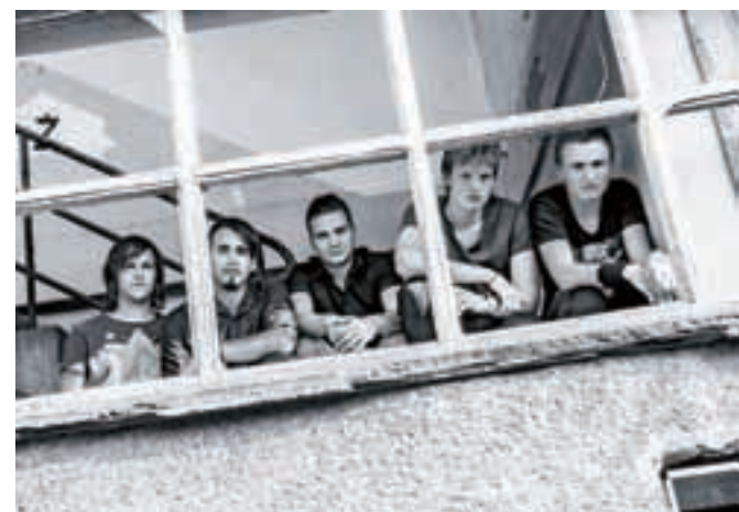
Fantje iz kamniškega rokovega benda Kalaie

Kalaio, kamniški rokovski bend, pozna prenekateri obiskovalec koncertov v mestu in okolici. Fantje so po šestih letih zorenja ustvarili svoj prvi album Psiholom, s katerim si bodo gotovo razširili krog poslušalcev.