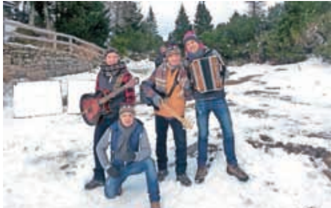
Fantje Skupine Špica pri snemanju novega videospota na Veliki planini

Fantje Skupine Špica so decembra na Veliki planini posneli videospot za svojo novo pesem.