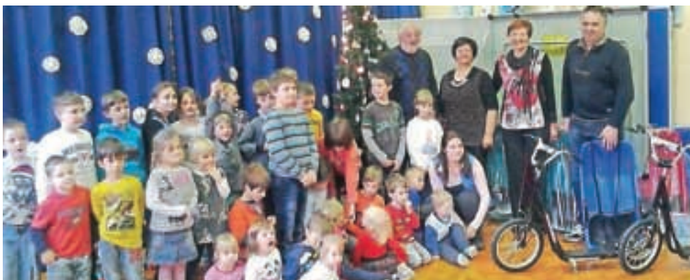
Motniški Polžki z učiteljicami in predstavniki Liste LTS – Za Kamnik