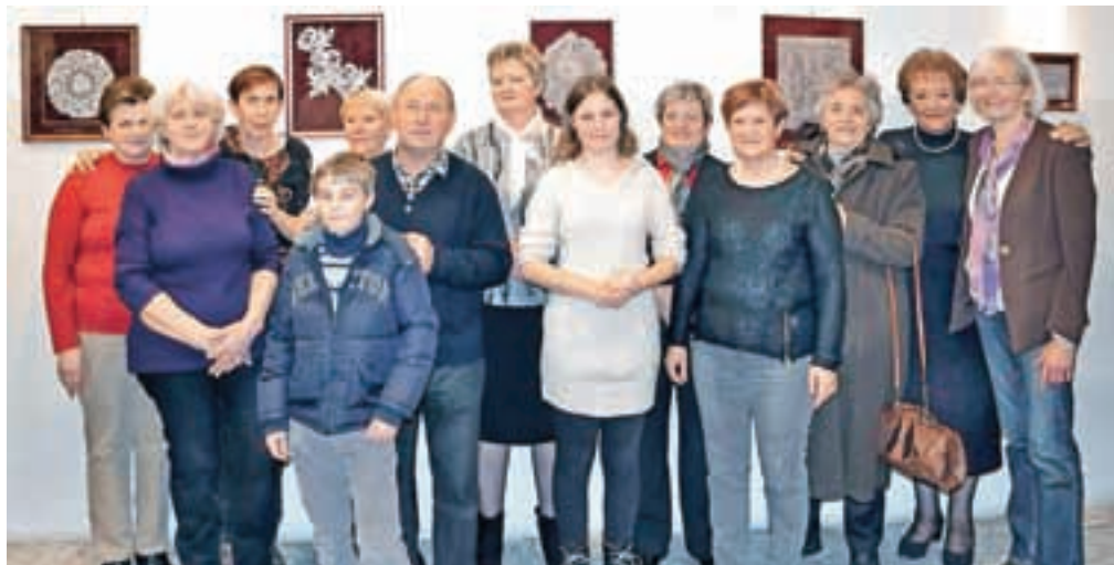
Članice in člana Klekljarskega društva Veronike iz Nevelj že četrtič razstavlja čipkarske mojstrovine v občinski stavbi.

zbrane je pozdravil tudi župan Marjan Šarec ter se klekljaricam zahvalil za razstavljenih dela, rekoč, da tako sedanjí čas kot občinska stavba potrebuje lepe stvari. Odprtje razstave čipk so s petjem polepšali mekinjski pevci Zdravka Berlica. Čudoviti mojstrski izdelki, ki ogrejejo pogled, dušo in srce, so stanki s potrebnim znanjem, potrpežljivostjo, veseljem in vztrajnostjo, na ogled pa bodo v času uradnih ur v občinski stavbi še do začetka februarja.