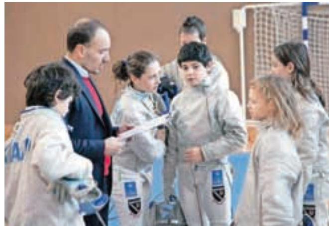
Med mladimi se morda skriva naslednik Rudolfa Cvetka, prvega Slovenca, ki je osvojil medaljo na olimpijskih igrah.