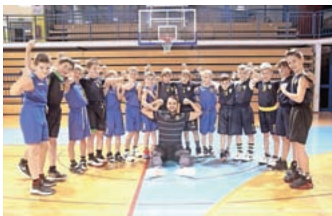
Mladi košarkarski upi