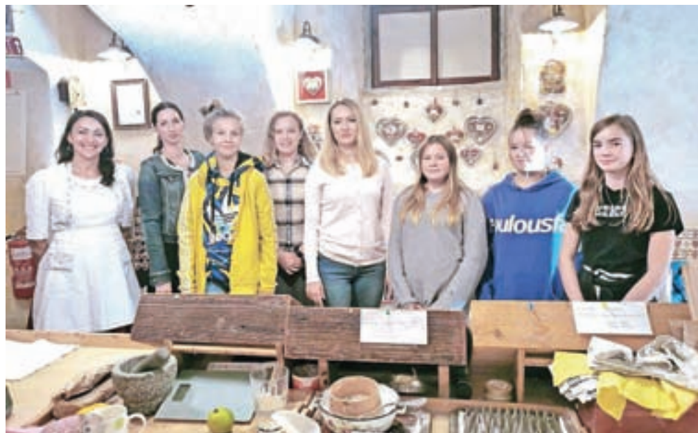
V muzeju lectarstva

Na mestu, kjer danes stoji muzej, so se z lectarstvom ukvarjali že od leta 1766. Tu hranijo petdeset in več let staro umetelno izdelano medeno pecivo različnih oblik in velikosti, vse od okraska v obliki dojenčka do okraska za jelko. Prijazna lectarka nam je razložila postopek izdelave medenih okrasov, ki traja kar 14 dni. Postopek izdelave namreč vključuje sušenje izdelkov, peko in okraševanje. Pri okraševanju izdelek pobarvajo z rdečo barvo, narejeno iz želatine, vode in jedilne barve. Včasih so rdečo barvo delali iz jagodičevja, zaradi česar so bili medeni okraski precej manj živahnih barv kot danes. Po barvanju se izdelek suši en dan, nato sledi okraševanje, pri čemer se okrasek obrobi z belo barvo iz škroba, sladkorja in jedilne barve. Srce se poljubno okraši z že prej izdelanimi rožicami in ogleđalci, nanj