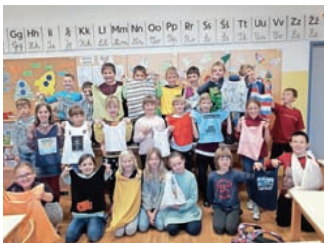
Oblačila za ponovno uporabo

nosti predstavili koristne nasvete, kako oblačilom podaljšamo življenjsko dobo. Z učenci 7. in 8. razredov smo izvedli »darovalnico oblačil«, saj so učenci 8. razredov lahko prinesli opran, čist in lepo ohranjen kos oblačila, ki ga ne nosijo več, učencem 7. razreda.