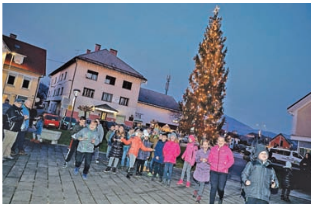
Sredi občinskega središča so prižgali luči na božično-novoletnem drevesu.