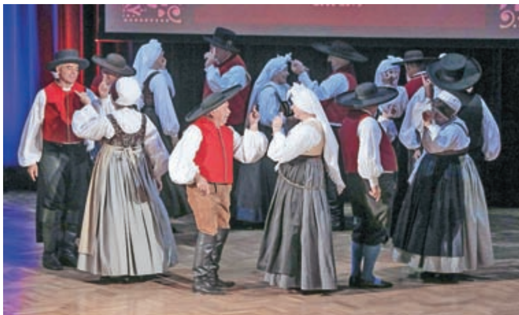
Šenčurski folkloristi so počastili desetletnico delovanja.