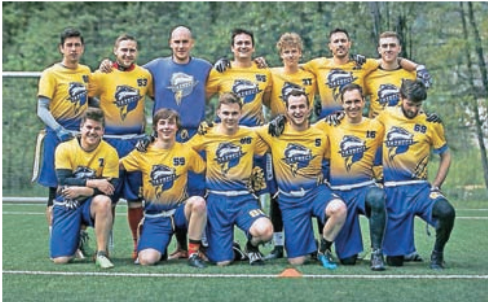
Zmagovalci Kranjski jazbeci

Pred kratkim se je končala letošnja tekmovalna sezona, šesta po vrsti, in v njej so prvič naslov državnega prvaka osvojili Kranjski jazbeci, ekipa iz občine Šenčur, ki je v ligi tekmovala prvič.