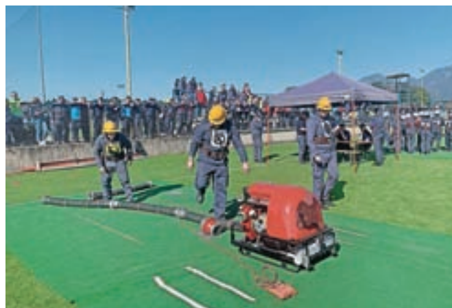
Na regijskem tekmovanju v Športnem parku Šenčur je tekmovalo več kot tisoč gasilcev.

Šenčur – Na regijskem tekmovanju, ki sta ga organizirali Gasilska zveza (GZ) Gorenjske in Gasilska zveza Kokra, se je med seboj pomerilo 129 ekip. Na državno tekmovanje, ki bo potekalo tretji konec tedna v maju naslednje leto v Celju, se je uspelo uvrstiti 22 ekipam. Tekmovalci so tekmovali v vajah z motorno brizgalno, hidrantom, vedrovko, vaji raznoterosti, razvrščanju in štafetnem teku na štiristo metrov brez ovir. Pomerilo se je več kot dva tisoč prostovoljnih gasilcev. "Namen tovrstnih tekmovanj je preverjanje operativne sposobnosti prostovolj-