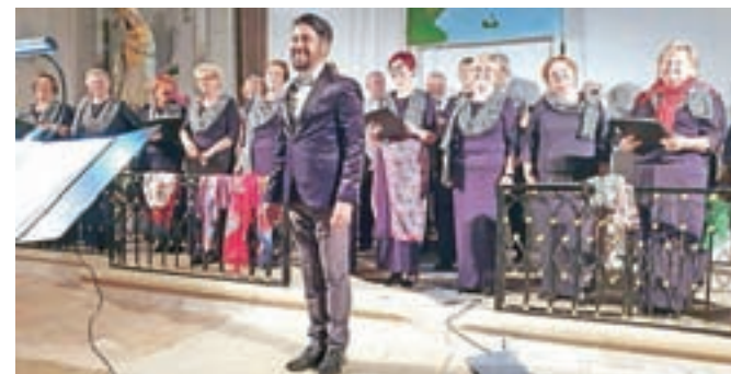
Z enega od nastopov v Franciji

gočnih gotskih cerkvah in muzejih, ogledali tamkajšnje znamenitosti. Sicer pa so priredili več nastopov. Posebno odmevna sta bila dva koncerta v cerkvah v krajih Genneteil in Boce. Velika cerkev v kraju Genneteil, ki sprejme tristo poslušal-