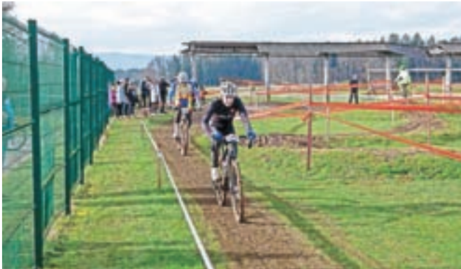
Nastopilo je skoraj sto tekmovalcev, ki so se pomerili v različnih kategorijah.

Nastopilo je skoraj sto tekmovalcev iz petih držav, ki so se pomerili v različnih kategorijah.