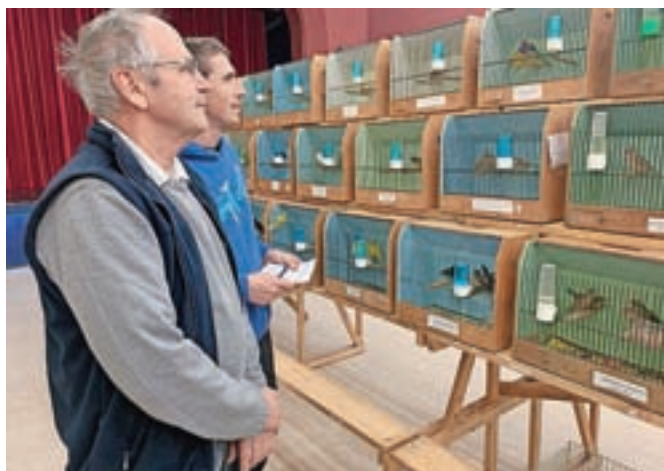
Društvena razstava ptic na Visokem