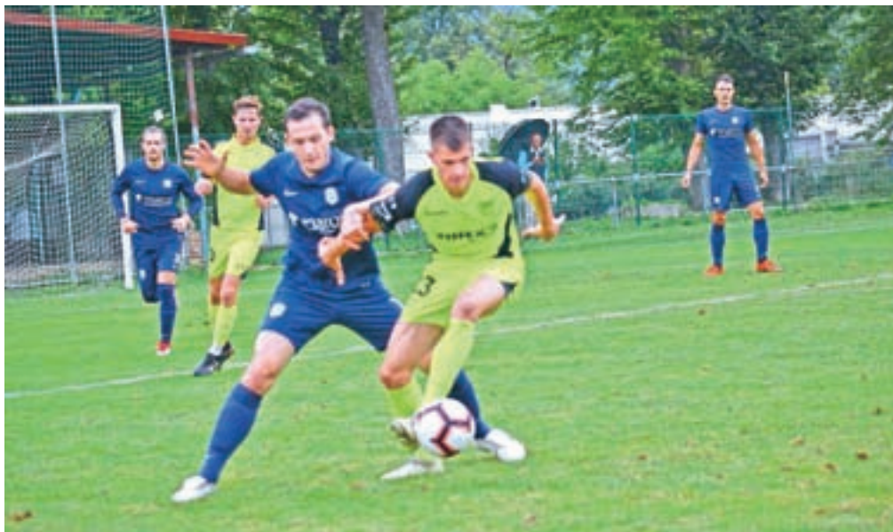
Nogometaši Šenčurja uspešni v prvem delu tekmovalne sezone

Šenčur – Članska ekipa Tinxeta Šenčur je jesenski del v tretji ligi končala na petem mestu. Kazalo je še bolje, saj je Šenčur po odigranih osmih krogih celo vodili na lestvici, na koncu pa so z dvema porazoma nekoliko pokvarili vtis, a kljub temu obdržali stik z vrhom. Odlično pa gre v tej sezoni selekcijama mladincev in kadetov, ki nastopata v drugi slovenski ligi. Po jesenskem delu prvenstva so skupno na tretjem mestu, kar je najboljši rezultat mladinskega pogona v zadnjih letih. Veliko se je pred začetkom sezone pričakovalo tudi od starejših dečkov, katerih cilj je uvrstitev v prvo ligo. Trenutno jim kaže zelo dobro, saj so po dvanajstih odigranih krogih na prvem mestu. "Članska ekipa je v prvem delu sezone med prvo peterico, kar je bil nekako osnovni cilj sezone, kazalo je še bolje in verjamem, da smo s to ekipo na koncu lahko zelo visoko. Nekaj smole smo imeli s poškodbami, saj sta se že ob uvodu v sezono poškodovala dva ključna igralca ekipe. Tretja liga je potem, ko se je združila z zahtodnim delom, zagotovo pridobila kakovost. Spremljamo dobre in zanimive tekme, kar potrjuje tudi dej-