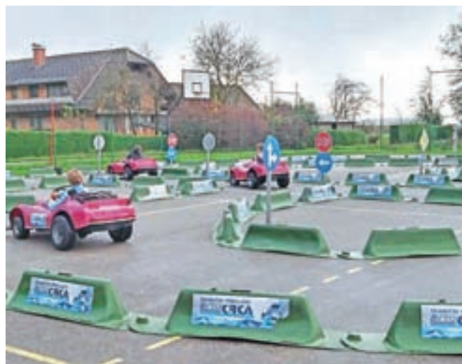
Vožnja na poligonu z malimi avtomobili

Četrtošolci in petošolci so se sredi oktobra udeležili izobraževalnega programa preventivne vzgoje otrok v cestnem prometu. Obiskali so nas predavatelj iz programa Jumicar. Teoretičnemu delu je sledila še praktična vožnja na igrišču, kjer so organizatorji postavili poligon za vožnjo z malimi avtomobili. Pri vožnji so učence in učenci morali upoštevati osnovne prometne znake. Ugotovili so, da vožnja ni tako enostavna, kot so misli-