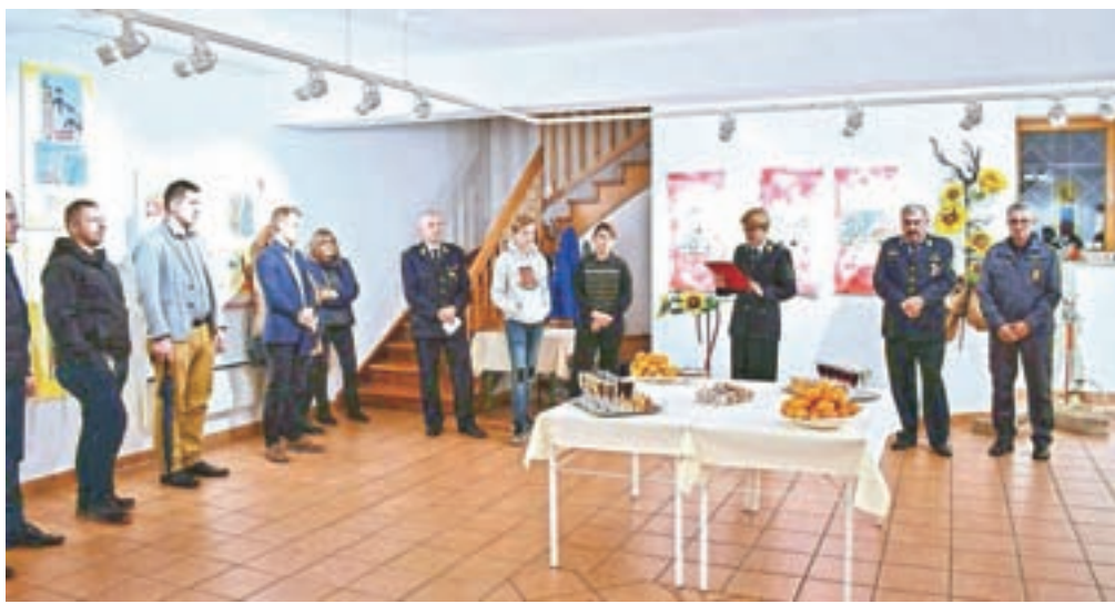
Razstava likovnih del mladih ustvarjalcev na temo meseca požarne varnosti