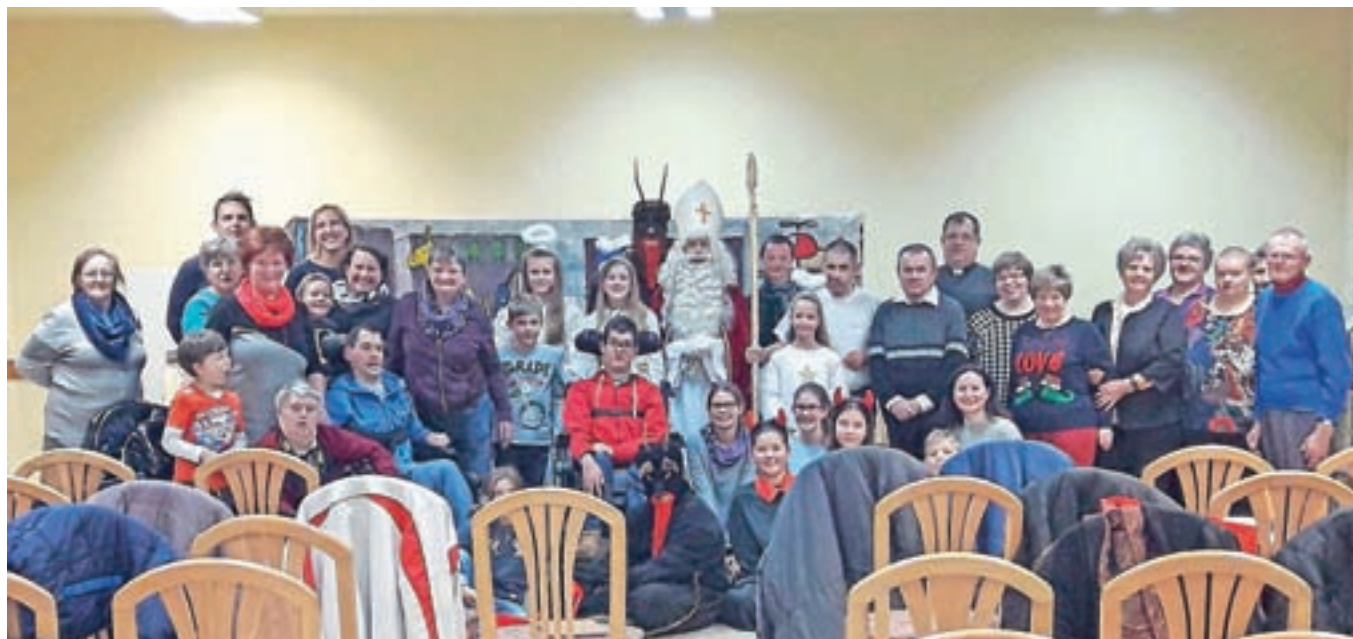
Miklavž s parkeljmi in angelčki je obiskal Vero in luč.

Kako je leto hitro minilo, bi se lahko reklo. In zopet je tu veseli december z adventnim časom, ko nas obišče prvi decembrski dobrotnik, Miklavž.