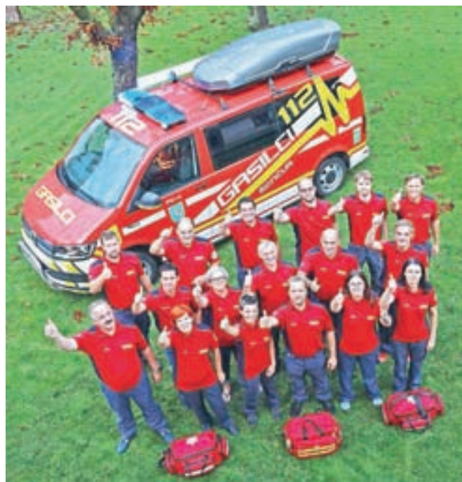
Vedno pripravljene prvi posredovalci

Ker smo v operativni enoti PGD Šenčur že pred leti začeli formirati enoto prvih posredovalcev (PPO), od lani, ko smo praznovali 120-letnico društva, pa smo jo dodatno povečali, želimo občanom Šenčurja predstaviti, kako enota deluje. Imamo hiter odzivni čas (povprečno nekaj minut) in smo na mestu posredovanja v povprečju nekaj minut pred prihodom nujne medicinske pomoči (NMP). To je za povečanje možnosti preživetja veliko. Prvi posredovalci moramo najprej opraviti dvodnevni tečaj iz oživljanja, ki ga organizira in izvede Zdravstveni dom Kranj. Ob koncu tečaja opravimo izpit, s katerim si pridobimo licenco, ki jo moramo nato obnavljati vsako leto. Med tem časom izvajamo tudi redne vaje. Na ta način smo prvi posredovalci ustrezno strokovno usposobljeni in pripravljene za ukrepanje. Kot navaja dr. Mohor iz ZD Kranj, se z vsako minuto, ko se srce ustavi in ničesar ne naredimo, zmanjša verjet-