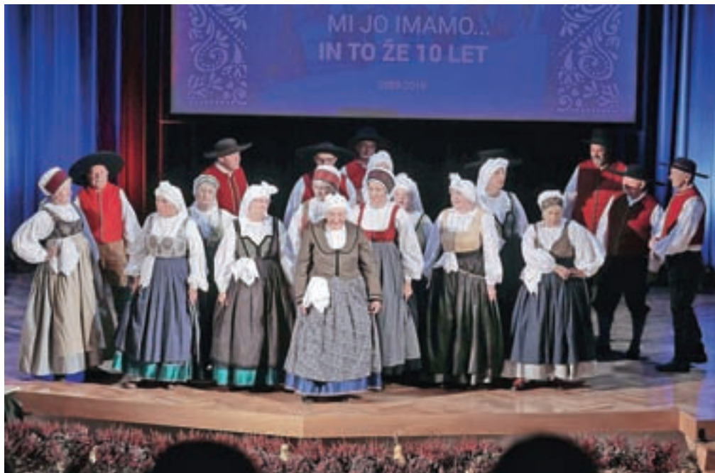
Prireditev Mi jo imamo... In to že deset let