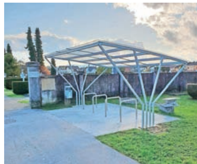
Nadstrešnice in nasloni za kolesa

jo Ukrepi trajnostne mobilnosti v občini Šenčur. Naložbo sofinancirata Republika Slovenija in Evropska unija iz kohezijskega sklada. Kazalnika učinka operacije oziroma predmet operacije so postavitev nadstrešnice za kolesarje pri OŠ Šenčur in pri pokopališču Šenčur ter postavitev tridesetih kolesarskih naslonov. Vrednost izvedenih del je 41.492,00 evra brez DDV oziroma 50.620,24 evra z DDV.