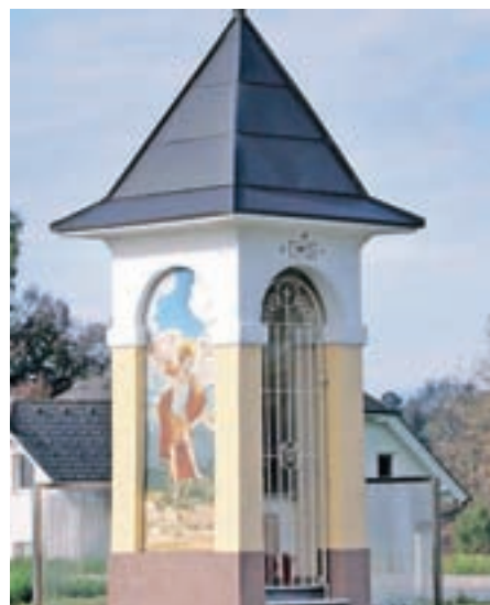
Obnovljeno znamenje ob cesti Visoko–Hotemaže

Občina Šenčur je v zadnjih dveh letih obnovila znamenja ob cesti Visoko–Hotemaže, na Olševku in na Prebačevem. Vsa znamenja so vpisana v register kulturne dediščine. Za posege so bili pridobljeni kulturno varstveni pogoji, ki jih izda Zavod za varstvo kulturne dediščine, Območna enota Kranj.