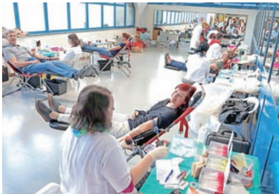
Na terenski krvodajalski akciji v Šenčurju