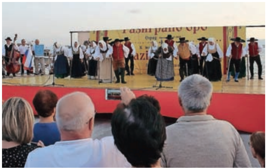
Šenčurjani navdušili z bergeltancem