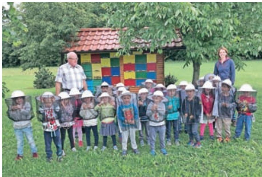
Na obisku pri čebelarju

Številna društva in posamezniki v Šenčurju ter okolici so pripravljene sodelovati z vrtcem in nam radi pokažejo svoje delovanje.