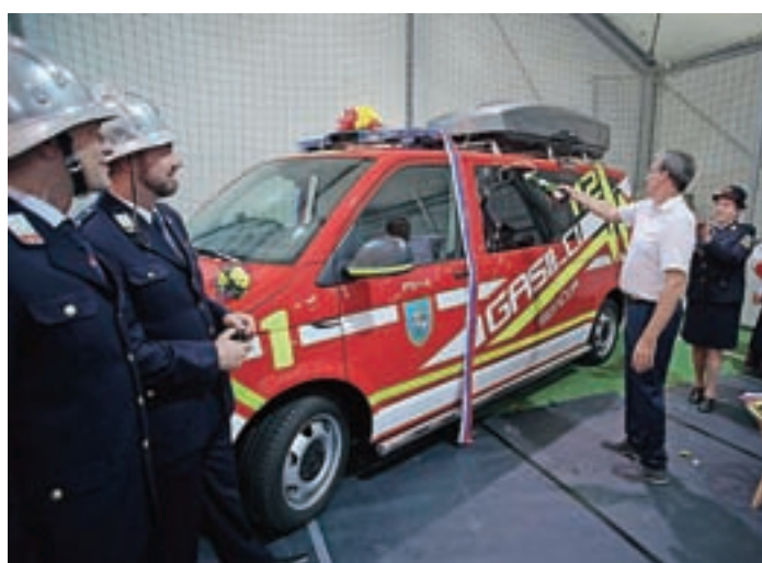
Krst novega poveljniškega vozila