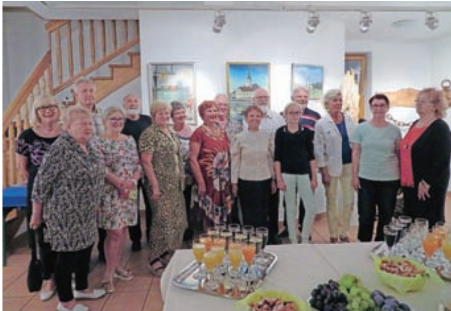
Ustvarjalci likovnega srečanja Hiše čez cesto razstavljajo v šenčurskem muzeju.