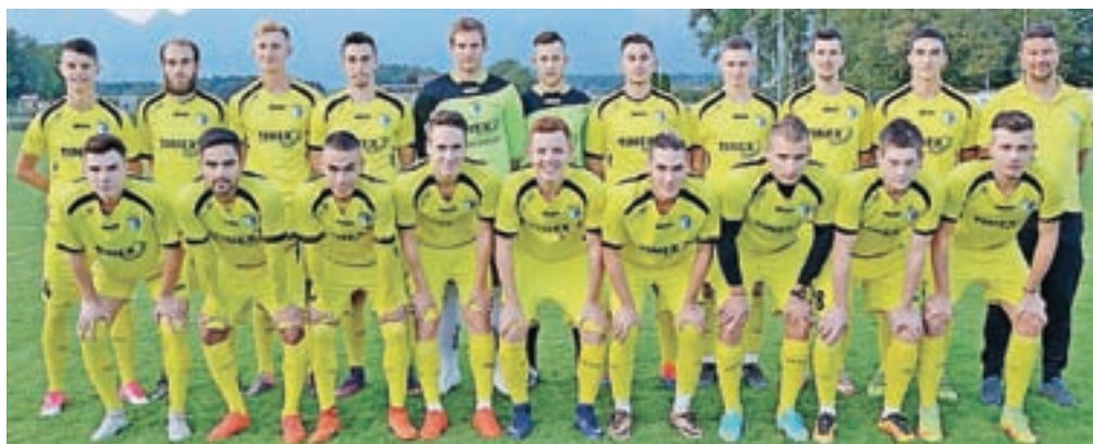
Članska ekipa NK Tinex Šenčur

V klubu, kjer je več kot dvesto otrok, še naprej dobro delajo z mladimi. Za vse nogometaše pa bo velika pridobitev igrišče z umetno travo, primerno za treninge in tekmovanja.