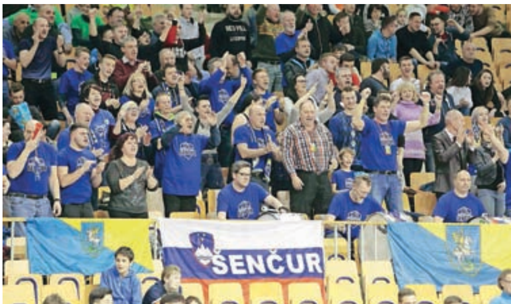
Navijači šenčurskih košarkarjev ob pokalnem uspehu v Ljubljani

Posebno zadovoljni so s člansko ekipo, ki je letos dosegla največji uspeh v zgodovini kluba. V polfinalu 17. Pokala Spar so premagali Krko (z rezultatom 89:82), v