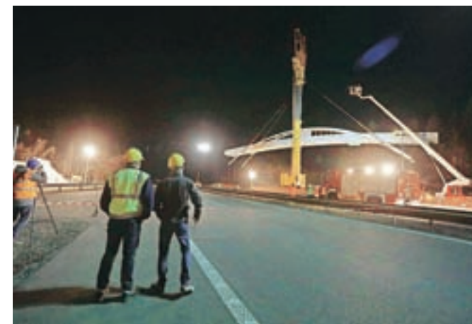
Dne 27. marca so z velikim dvigalom prenesli most na njegovo mesto.