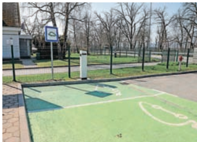
Polnilnica električnih vozil pri šoli v Trbojah

Šenčur – Občina Šenčur ima trenutno šest polnilnic za električna vozila, od tega so štiri namestili lani. Letos so bili ponovno uspešni na razpisu Eko sklada, tako da bodo postavili dve novi polnilnici: ena bo pri poslovnem objektu na pokopališču ob Gasilski cesti v Šenčurju, druga pa na začetku naselja Voge na Miljah ob obstoječem ekološkem otoku. Tako bo v občini osem polnilnic za električna vozila, torej domala po vsem območju občine. Prvo leto so jih namestili pri športni dvorani v Šenčurju in pri kulturnem domu Visoko, lani pa pri starem gasilskem domu v Vogljah, pri vaškem in športnem domu v Voklem, pri pokopališču Trboje in pri Osnovni šoli Trboje. Aleš Puhar napoveduje, da bodo na priporočilo nadzornega odbora letos objavili razpis za upravljalca polnilnic.