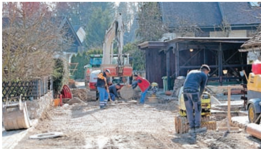
Letos bodo zaključili tretjo fazo komunalnega urejanja Sajovčevega naselja.

"Ob prazniku jim čestitam in jih vabim na praznične prireditve: 20. aprila bo slavnostna akademija s podelitvijo priznanj letošnjim občinskim nagrajencem, 23. aprila pa jih vabim na slovesno odprtje mostu čez avtocesto. Sicer pa lahko več o prazničnem dogajanju preberete v današnjem Juriju."