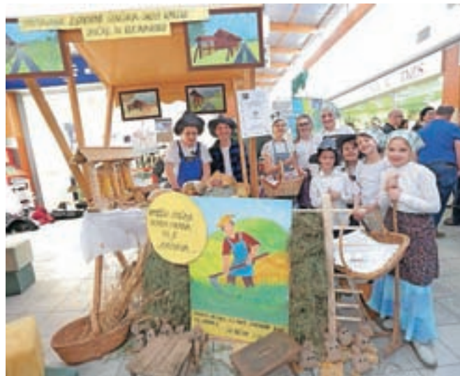
Šenčurski učenci na tržnici v okviru dogodka Turizmu pomaga lastna glava

Učenci turističnega podmladka so vse šolsko leto pisali projektno nalogo z naslovom Spoznavanje zgodovine Šenčurja skozi kmečke običaje in kulinariko, ki je nujno potrebna za udeležbo na turistični tržnici. Letos so nam pri kulinarični predstavitvi občine Šenčur priskočile na pomoč