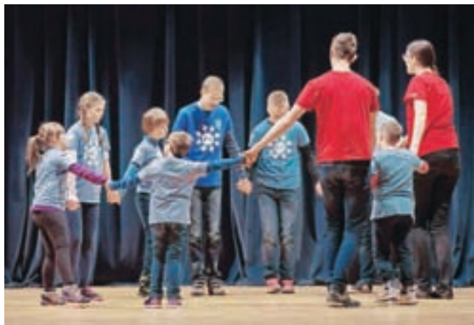
Nastopila je tudi plesna skupina Sončki, plesalci s posebnimi potrebami.