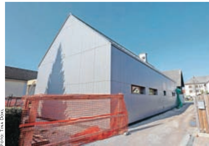
Medgeneracijski objekt pri Blagneči hiši bo kmalu dograjen.

"V športnem parku gradimo nogometno igrišče z umetno travo. Odločitev je bila sprejeta, ker želimo našim športnikom omogočiti normalne treninge, ne da bi se pretirano uničevala travnata površina na igrišču, kjer se sicer odvijajo tekme. Lani se nam je namreč zgodilo, da smo imeli s sanacijo igrišča kar nekaj stroškov. Imamo veliko mladine, ki bo lahko trenirala na umetni travi. S tem se bo lažje počakalo na celovito obnovo športnega