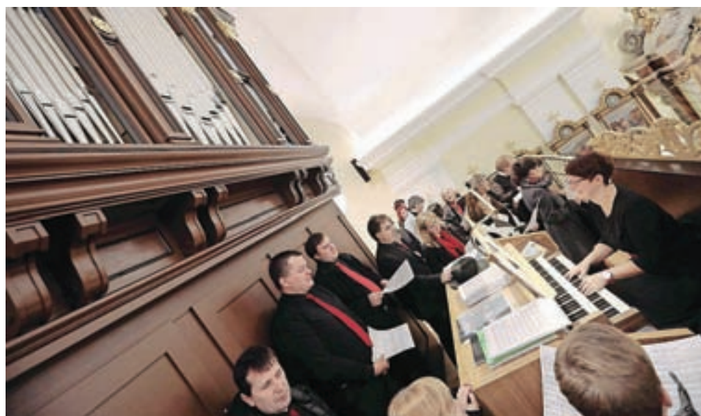
Nove šenčurske orgle decembra ob prvem koncertu

Orgle imajo 25 registrov, s transmissijami iz glavnega piščalja v pedal se možnosti