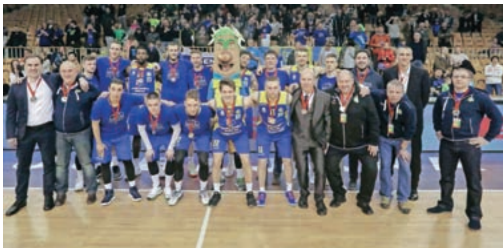
In še "gasilska" za spomin

Sobota, 14. aprila, ob 19. uri Šenčur GGD : Rogaška Sreda, 18. aprila, ob 18. uri Šenčur GGD : Sixt Primorska Sreda, 25. aprila, ob 20. uri Šenčur GGD : Šentjur Ponedeljek, 30. aprila, ob 20. uri Šenčur GGD : Helios Suns