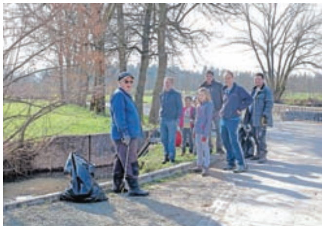
Čistilni akciji so se pridružili tudi krajanji vseh generacij na Lužah.