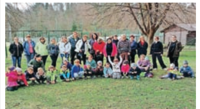
Udeleženci Poti prijateljstva

Pot je odlična za različne vrste rekreacije, poleti pa nudi prijetno ohladitev. Otroci pa so poudarili, da moramo ohranjati čisto naravo in smeti pospraviti za sabo.