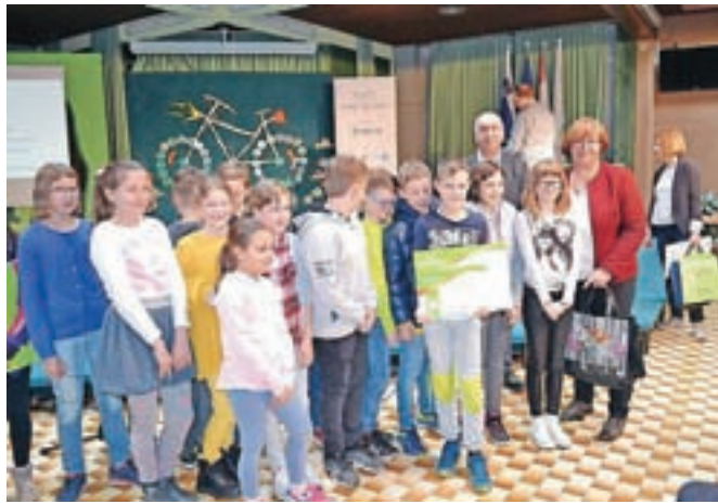
Petošolci iz šenčurske šole: varno na kolesu

Učenci šenčurske šole znova vključeni v projekt Varno na kolesu. Za zmago jim manjka samo še nekaj izkušenj.