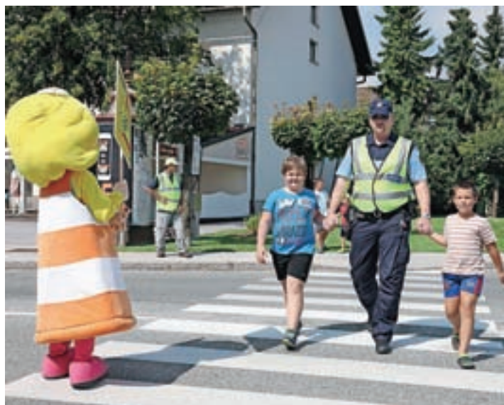
Varno na poti v šolo

Varno v novo šolsko leto so tudi letos stopili novi prvošolci in se pridružili drugim učencem, ki šolske poti premagujejo že več let. Kot že zadnjih nekaj let so jih na pot pospremili člani AMD Šenčur in SPV Šenčur ter policisti. Ti so bili prisotni pred vsemi šolskimi stavbami. Pozorni so bili tako na učence kot na njihove starše, preverjali so, ali upoštevajo dogovore o varnem prihajanju v šolo. Prvošolci so prejeli rumene rutice in kresničke, ki jim bodo v pomoč pri boljši vidljivosti na cesti. Rumene rutice bodo še eno šolsko leto nosili tudi vsi drugošolci, ki že lahko v šolo prihajajo sami, peš ali z avtobusom. AMZS pa je poskrbel, da sta letos maskoti Anja in Zdravko že pred začetkom šolskega leta opozarjali vse voznike, da se učenci kmalu vrnejo na ceste, šolske poti in je potreba še večja pozornost. Maskoti sta letos obiskali tudi Šenčur, kjer sta voznike opozarjali na začetek šolskega leta.