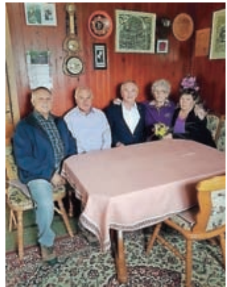
Pri Mariji Černoga