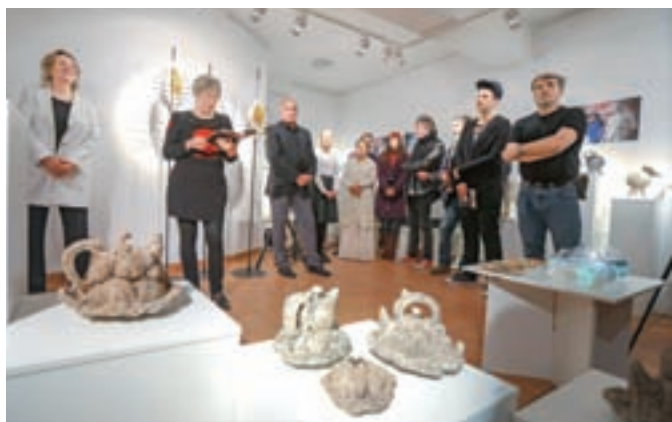
Z odprtja razstave Mednarodnega simpozija umetniške keramike V-ogljje 2017 v Muzeju Šenčur.