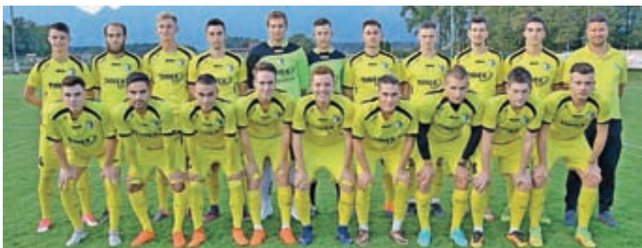
Članska ekipa Tinex Šenčur