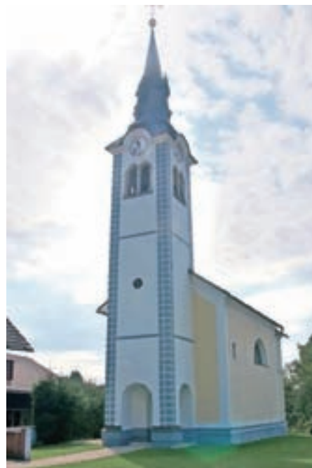
Cerkev na Prebačevem

za opravljeni cerkveni obred in darovano sveto mašo, nato pa zbrane povabil na kmetijo Novak, kjer je bilo prijetno druženje in pogostitev z domačimi slaščicami prebačevskih gospodinj. Ob tej priliki se iskreno zahvaljuje vsem vaščanom Prebačevega, še posebno ključarjema ter gospodinjama, ki so poskrbeli za lepo izpeljano praznovanje ob petstoti obletnici prve omembe cerkve.