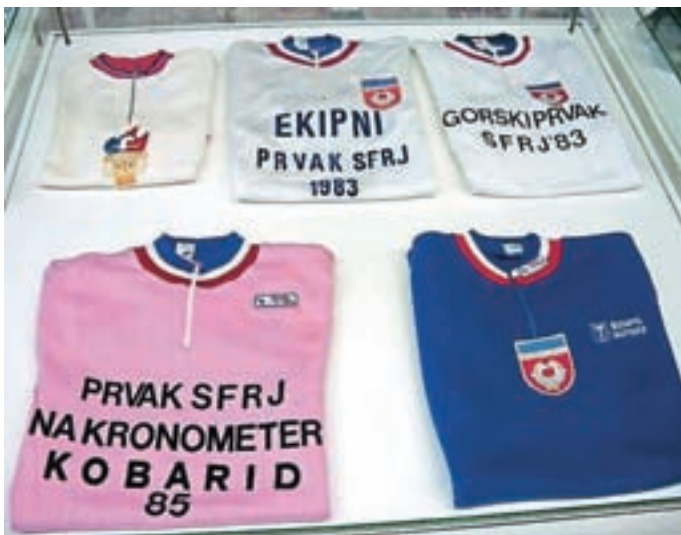
S priložnostne razstave ob 60-letnici KK Kranj