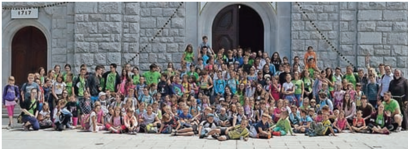
Udeleženci oratorija na Sveti Gori

človeku, s tem se nebesa sklanjajo k človeku. Dotik je vedno nekaj osebnega, pravijo organizatorji oratorija. Marija je tudi tista, ki nam pomaga priti v nebesa. S temi sporočili se je letos družilo okoli 180 mladih. Med drugim so romali tudi na Sveto Goro, kjer je pred Marijino baziliko nastala tale skupinska fotografija.