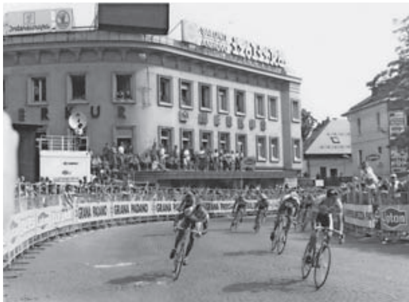
Udeleženci Gira na Jelenovem klancu leta 1994