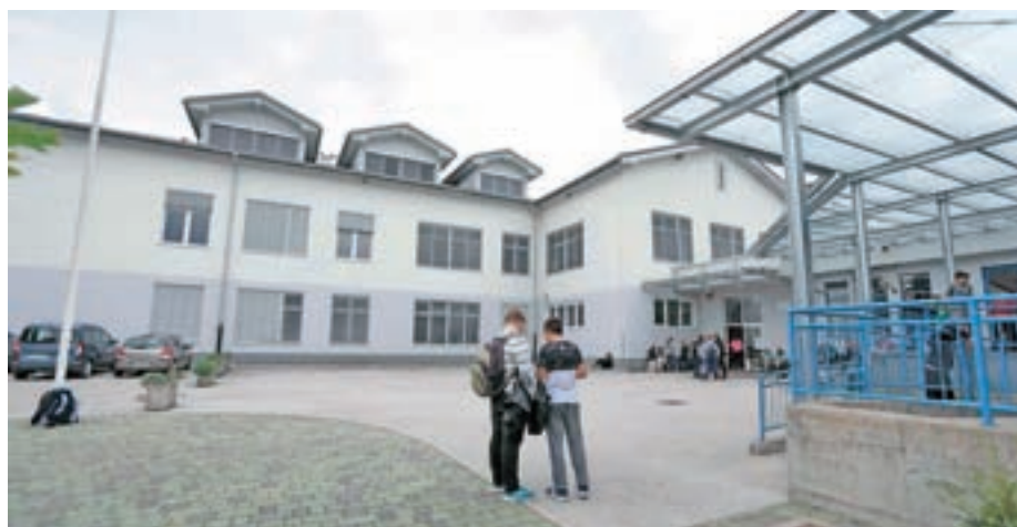
Tudi na strehi OŠ Šenčur je sončna elektrarna.

Občina z izvedenimi projekti v obnovljive vire energije z opisanim projektom optimizacije merilnih mest potrjuje svoje prizadevanje k izvajanju ukrepov varovanja okolja, učinkovite rabe in vgradnjo obnovljivih virov energije. Izveden primer pa je zelo reprezentativen primer optimizacije merilnih mest z združitvijo, ki se lahko aplicira in izvede tudi na drugih objektih, javnih in zasebnih. Pogoj je dovolj velika priključna moč in bližina porabnikov, ki so predmet potencialne združitve. Za dodatne informacije o projektu optimizacije merilnih mest se lahko obrnete na izvajalca projekta, to je Gorenjske elektrarne, in sicer na po elektronski pošti na e-naslov info@gek.si .