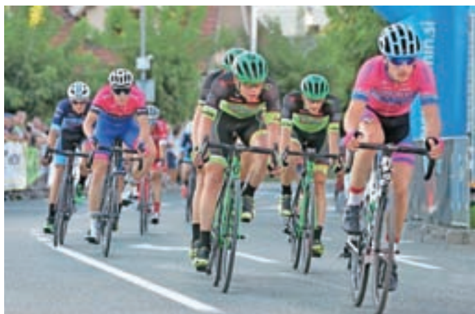
Kolesarji in kolesarke so se letos pomerili za 19. Veliko nagrado Šenčurja.