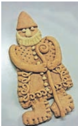
Krožkarji so iz testa oblikovali decembrske dobre može, parkeljne, srčke ...

Skromne prehranjevalne navade Šenčurjanov so prekinila pričakovanja praznikov s ta boljšimi jedmi, ki so prispevale k prazničnemu razpoloženju. Kajžarska hči je etnologinji Anki Novak povedala: »Otroci smo komaj čakali na veliko noč. Takrat smo tudi pri nas tržiške bržole pekli, pa budelj je moral biti in potica ...« "Priboljške" v prazničnem času so Šenčurjani upravičevali z