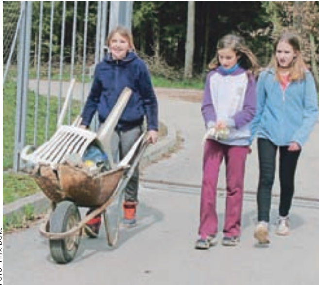
Prvo soboto v aprilu so čistili tudi v občini Šenčur.