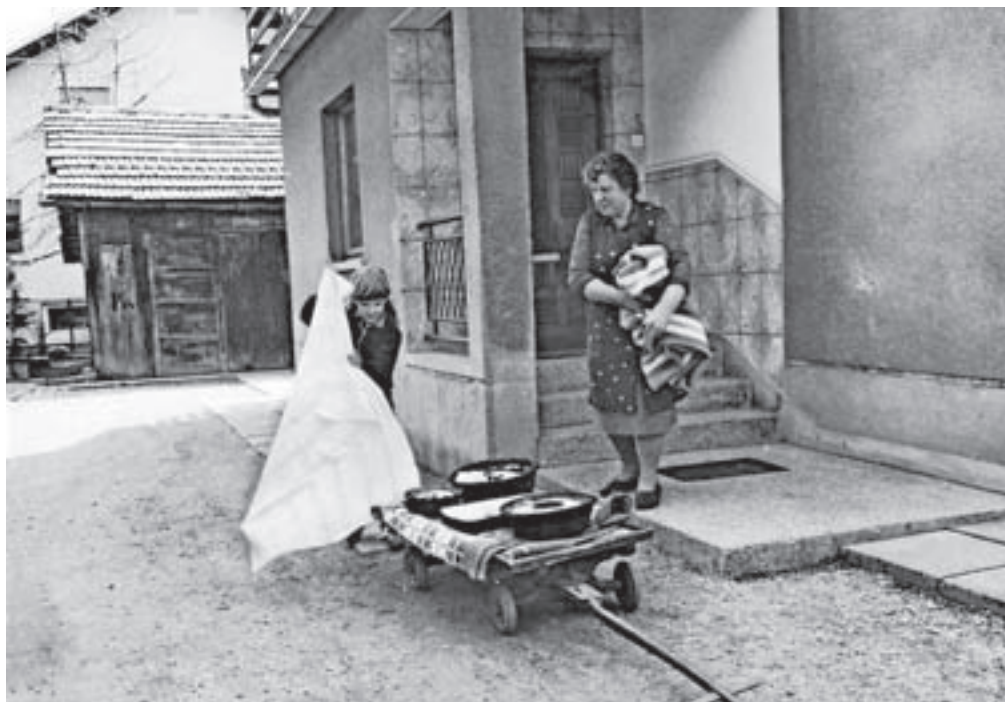
Rozmanova mama zлага potico, kolač in budelj na samotežni voziček, s katerim bo jedi odpeljala v pekarno Umnik, kjer jih bodo spekli.

Dan spomina na mrtve je bil kot praznik z religiozno zasnovano preoblikovan v državni praznik. Ljudje so molili, da bi dušam v vicah zagotovili prehod v nebesa. Verjeli so, da bodo ta dan prišle duše umrlih domov, zato so v hišah pustili luč, spraznili klopi in na mizo postavili hrano. Bolj kot urejanju grobov so se posvetili notranji pripravi. Za vse svete so pekli prešice, hlebčke iz ajdove moke, in jih dajali beračem, da so molili za duše pokojnih. V zimskem