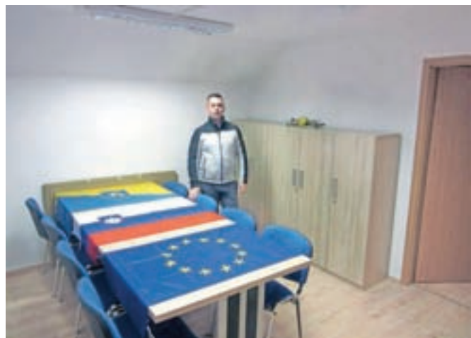
V pisarni VS Prebačevo