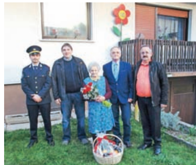
Pri Kalinovi Mici na Lužah