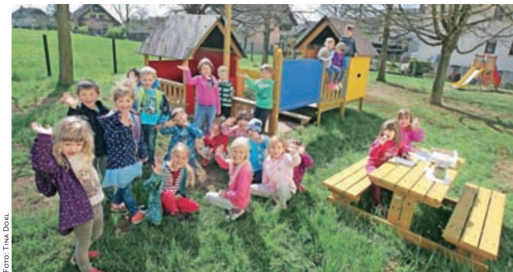
Ob letošnjem občinskem prazniku se veselijo tudi novih igral pri vrtcu Janček na Visokem.