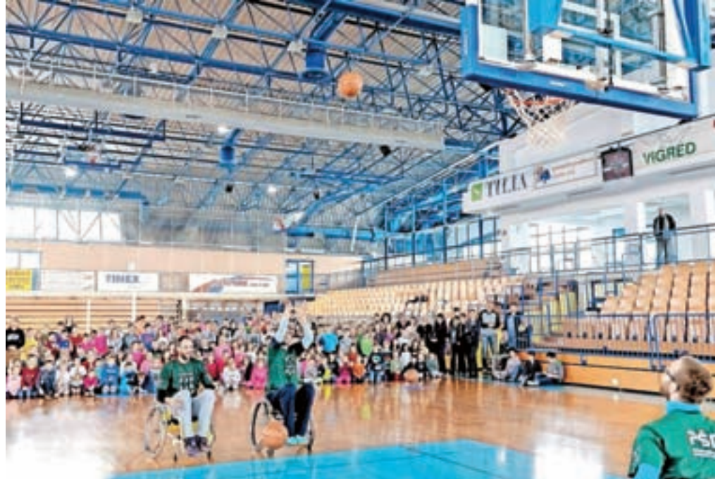
Profesionalni košarkarji so ugotovili, da je igranje košarke na invalidskih vozičkih vse prej kot enostavno.