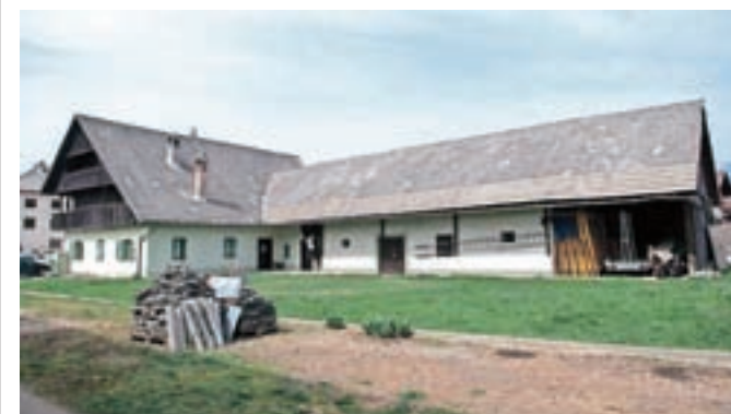
Kjer je sedaj gospodarsko poslojpa, bodo v Blagnetovi hiši uredili medgeneracijski center.

Prav tako poteka postopek za spremembo gradbenega dovoljenja za obnovo Blagnetove hiše. Ob milejših pogojih Zavoda za varstvo kulturne dediščine bodo pridobili več prostora in bo tako na mestu obstoječega gospodarskega poslojpa urejen medgeneracijski center.