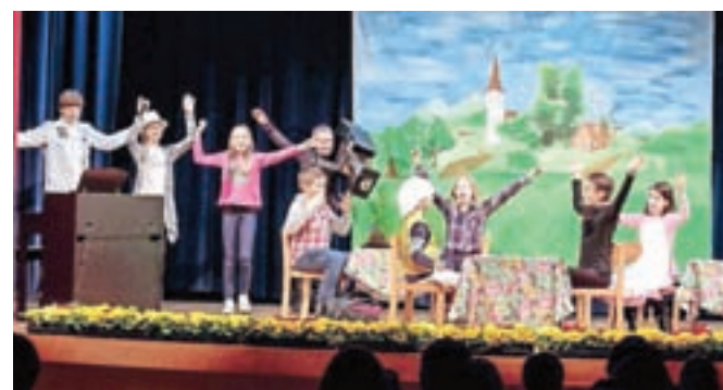
Otroci so za materinski dan pripravili prisrčen program.

Šenčur – Pomlad je čas najrazličnejših prireditev. Dne 19. marca je KUD Simon Jenko Trboje v domu krajanov v Šenčurju pripravilo prireditev v počastitev materinskega dne. Potekala je pod naslovom Dobra mama je tista, ki zna poskrbeti zase. Kulturni program so prisrčno izvedli otroci in razveselili svoje mame, babice in druge navzoče med občinstvom.