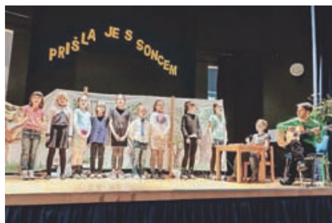
V Voklem so pozdravili pomlad.