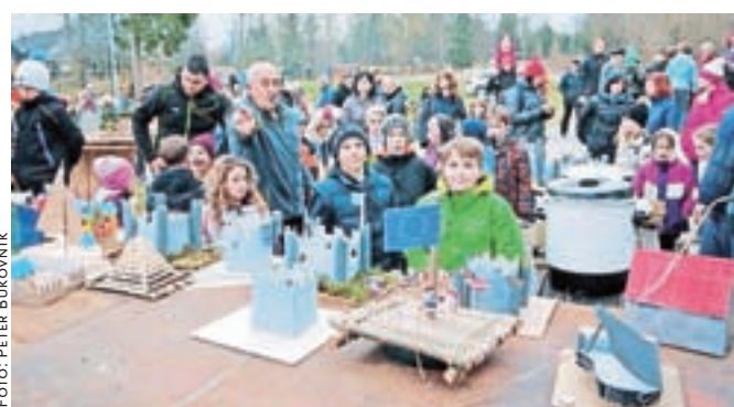
Ustvarjalni učenke in učenci POŠ Olševek so izdelali ekološke gregorčke najrazličnejših barv in oblik.