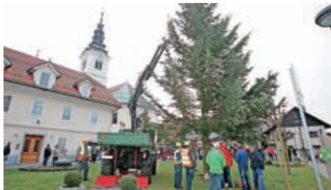
Šestnajst metrov visoka jelka krasi praznične dni v Šenčurju.