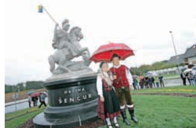
Oktobra so v krožišču Šenčur-Voklo postavili skulpturo sv. Jurija.

novo podobo vhoda v občinsko središče, pa so prisluhnili kulturnemu programu društva Utrip, cerkvenemu pevskemu zboru župnije Šenčur Vse za Jurija in Pihalnemu orkestru Šenčur. V prejšnji številki Jurija smo obljubili, da bomo v praznični objavili imena donatorjev, ki so omogočili postavitev skulpture sv. Jurija. Donacije se še naprej zbirajo in ko bo seznam darovalcev dokončen, bo tudi objavljen. Dotlej pa hvala vsem, ki so prispevali za skulpturo, ki je v prazničnih decembrskih dneh tudi osvetljena.