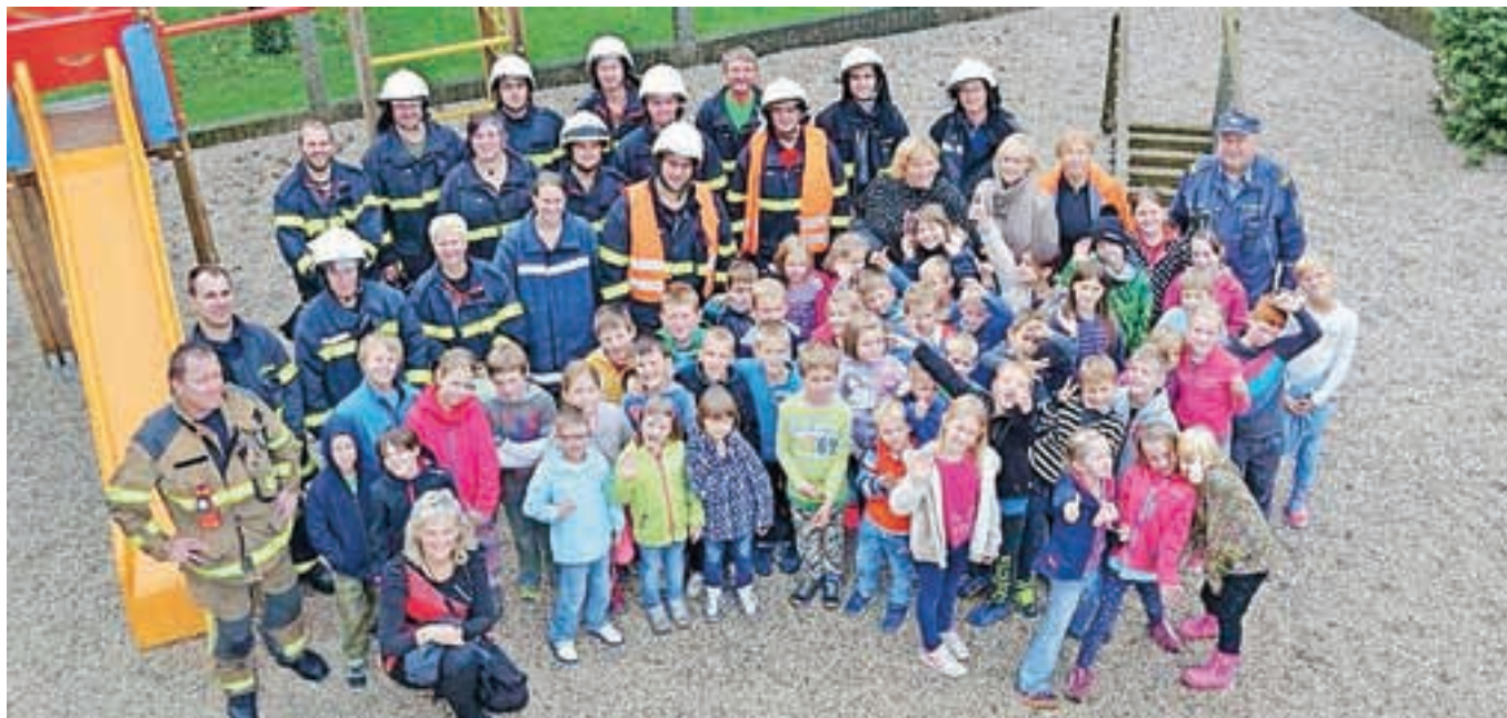
Otroci so se disciplinirano zbrali na šolskem dvorišču.

Oktober so prostovoljni gasilci iz Voklega v tamkajšnji podružnični šoli uprizorili požarno vajo. Otroci so spoznali delo gasilcev in se naučili, kako ravnati v primeru požara.