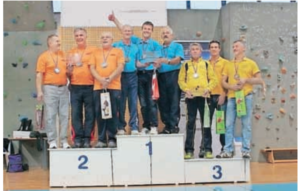
Zmagovalci prstometa na stopničkah

Bila je prva tekma za pokal Slovenije 2015/16, sicer pa drugi spominski turnir, posvečenem prezgodaj preminulemu pobudniku in soustanovitelju te priljubljene igre Borisu Brezarju. Udeležilo se ga je rekordnih 55 ekip s 165 igralci in igralkami z gorenjske, primorske in ljubljanske regije. Vsaka ekipa šteje tri tekmovalce, ki jo lahko sestavljajo tudi neregistrirane igralkice in igralci prstometa. Bili so vrhunski dvoboji, kjer je ob zaključkih poleg koncentracije in natančnih metov odločala tudi sreča.