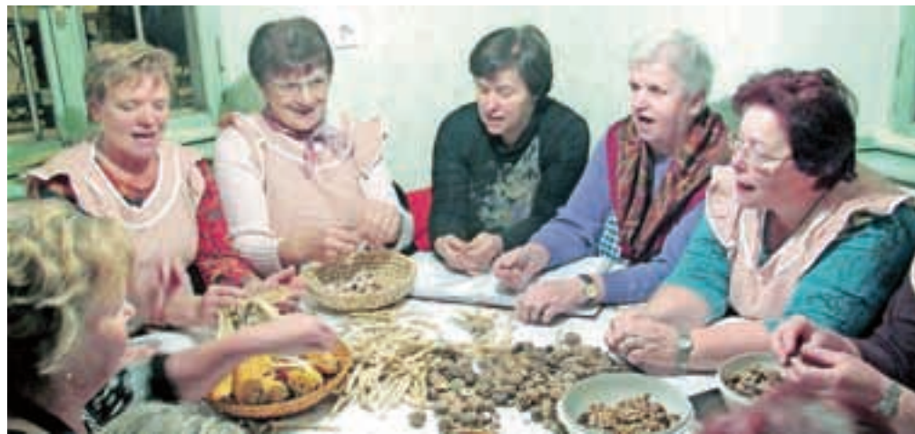
V Hiši čez cesto gojijo ljudsko petje.

Najpomembnejše je, da hiša živi. Vsak prvi petek v mesecu se družimo ob prepevanju ljudskih pesmi. Gostili smo trbojske ljudske pevke in z njimi prepevali ob prebiranju fižola, rofkanju koruze in prebiranju orehov. Prihajajo ljudje iz bližnje in daljne okolice. Namen je ohranjanje kulturne dediščine, uživanje v petju, sprostitve in druženje. Prav tako se srečujemo v hiši vsak tretji četrtek v mesecu na literarnih utrinkih. Prebiramo pesmi, ki smo jih napisali udeleženci večera. Gostimo tudi že uveljavljene pesnike. Naš cilj je, da ob koncu sezone izdamo pesniško zbirko v hiši predstavljenih pesmi. Na ta druženja vabimo vse, ki radi napišete kakšno pesem, pravljico ali kratko zgodbo. Kulturno dediščino ohranjamo tudi z