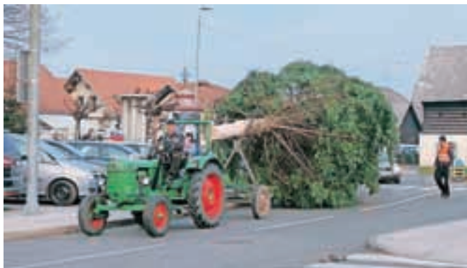
Božično drevo je z Olševka v Šenčur pripeljal traktor oldtajmer.