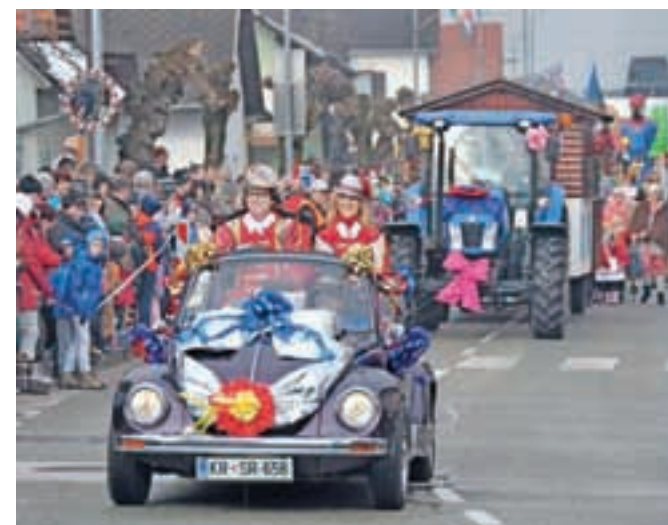
Godlarji na pustni povorki