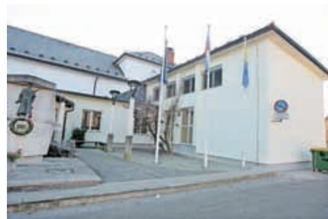
Obnovljeno pročelje Kulturnega doma Visoko