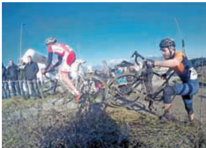
Na krožni progi so bile tudi ovire – naravne in umetne, ki so tekmovanje naredile še bolj zanimivo. Prvi ciklokros v Šenčurju je uspel.

Ciklokros v Šenčurju je 5. decembra potekal v organizaciji Kolesarskega društva Šenčur v sodelovanju s podjetjem Cycling United Ljubljana. Proga je bila krožna in speljana v okolici Poslovne cone v Šenčurju. Potekala je po asfaltu, pesku, travnikih, njivah in gozdnih poteh. Na trasi so bile umetne in naravne ovire, kar je tekmo-