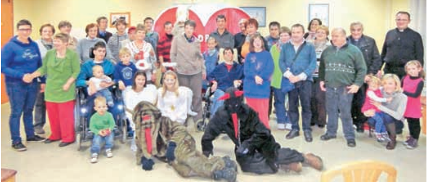
Dobri mož Miklavž je obdaroval tako lučkarje kot člane animacijske skupine.

Pa je leto naokrog, kot bi mignil, kot radi rečemo. In zopet je tu adventni čas, poln pričakovanj, milosti in obdarovanj. Tudi 'lučkarji' ga doživljamo lepo.