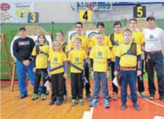
Mladi šenčurški lokostrelci so uspešno nastopili na mladinskem dvoranskem tekmovanju v Tricezimu v Italiji.