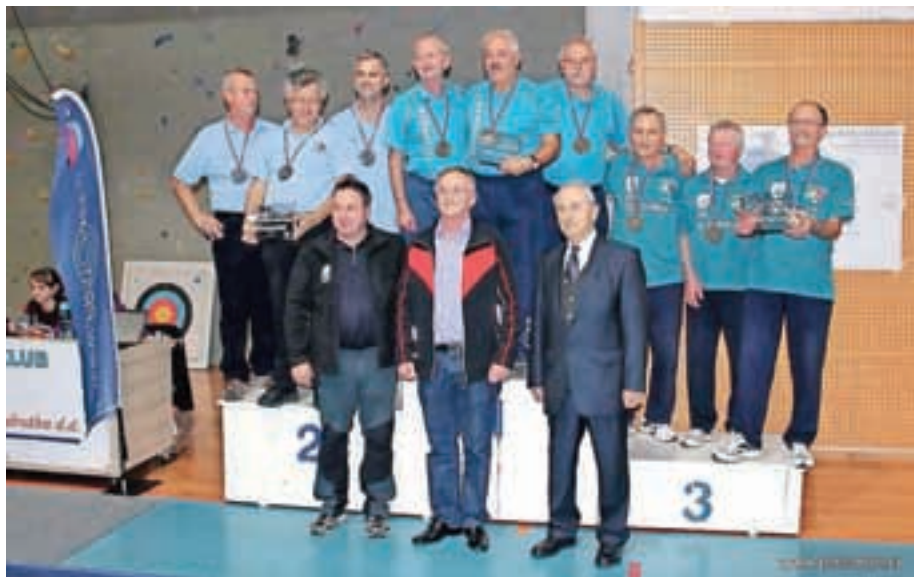
Najuspešnejše ekipe na Brezarjevem memorialu

Sredi novembra je v športni dvorani v Šenčurju potekalo tekmovanje ekip v prstometu za pokal Memoriala Borisa Brezarja, ki je štel tudi za pokal Slovenije.