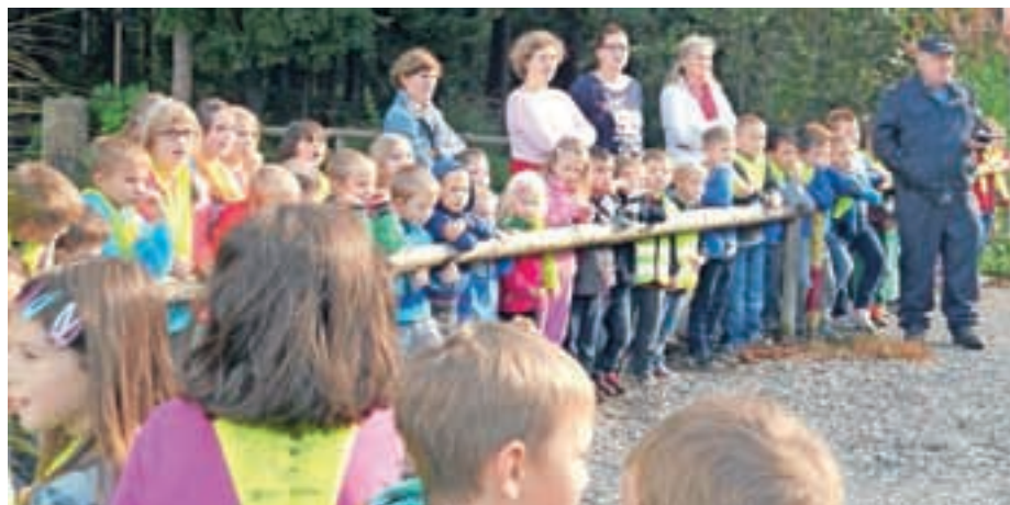
Nad gasilsko vajo smo bili navdušeni, saj je bila izredno zanimiva tako za šolske kot za vrtčevske otroke.