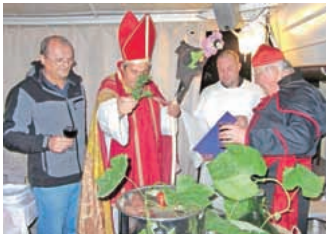
Krst vina v lokalu Alo-Alo

V Šenčurju so letos ustanovili Društvo ljubiteljev vina, ki je pripravilo že več dogodkov – od družinskega dneva do krsta vina.