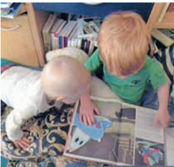
Kjer berejo mamice, pogosteje berejo tudi otroci.