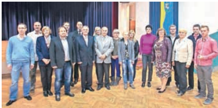
Novi sedemnajstčlanski občinski svet

Občinski svet je takoj poprijel za delo, v tem času izpeljal že tri redne seje, na katerih so svetniki med drugim potrdili tudi proračun za prihodnje leto in imenovali vsa delovna tele-