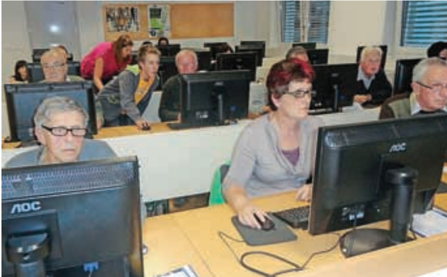
Odraslim smo v svet računalniške pismenosti pomagali prostovoljci iz vrst učencev šole, dijakov in študentov.

Bliža se najlepši čas v letu, čas, namenjen družini, prijateljstvu, vsem, ki so nam blizu ... Želimo vam zdravo in uspešno leto 2014.