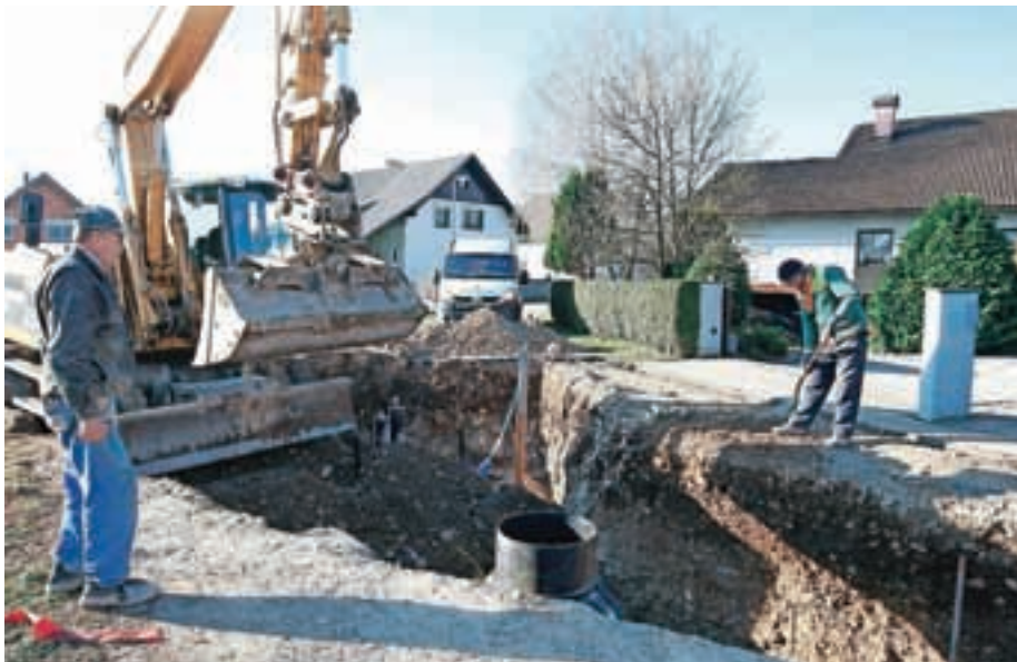
Gradnja kanalizacije na Visokem

Istočasno z gradnjo fekalne kanalizacije bodo uredili tudi meteorno kanalizacijo, javno razsvetljavo, vodovodno omrežje in ceste, drugi lastniki in upravljavci pa bodo poskrbeli za obnovo svojih vodov in naprav. »Novi pridobitvi bosta tudi plinovodno in optično omrežje,« je napovedal Puhar in pojasnil, da so v letošnjem letu že zgradili kanal med Srednjo vasjo in Lužami, končali bodo tudi dela na kanalu Luže-Olševku, zgradili pa so tudi že tlačni vod v Hotemažah. Dela te dni še vedno potekajo tudi na dveh kanalih na Visokem.