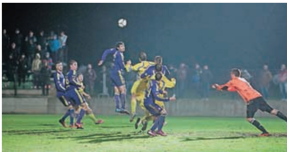
Šenčurjani so se v pokalnem tekmovanju dostojno upirali favoriziranemu Mariboru.