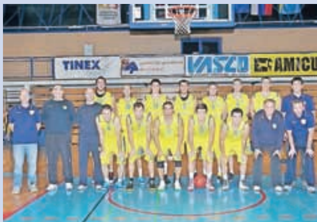
Člansko ekipo čaka pokalni izizz.

Kljub prazničnim dnevom se tekmovanja in treningi za vse selekcije Košarkarskega kluba Šenčur Gorenjska gradbena družba nadaljujejo. V tekmovanja so vpete tudi še nekatere mlajše selekcije, medtem ko se druge že pripravljajo na spomladanski začetek nove košarkarske sezo-