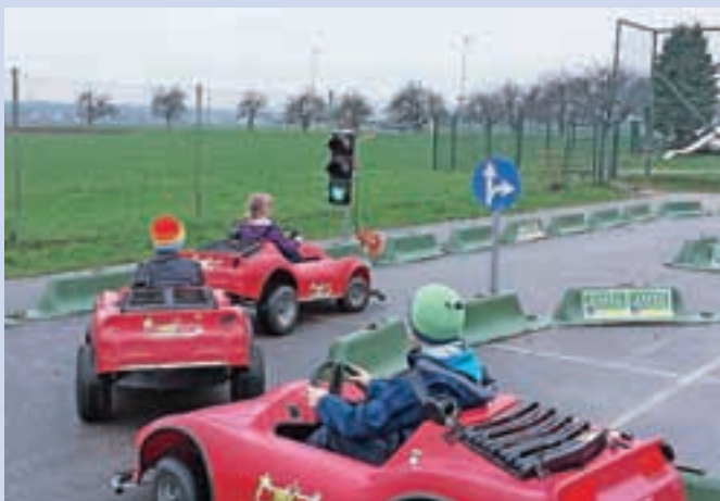
Četrto- in petošolci so se v okviru programa Jumicar seznanjali s prometnimi pravili.

S pričetkom šolskega leta smo večjo pozornost spet posvetili prometnim dejavnostim. Udeležence v prometu je potrebno opozoriti, da so se v šolske klopi vrnili učenci. Na prvi šolski dan so jih v šolske