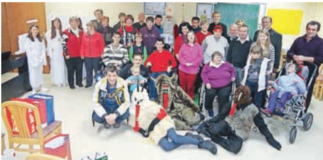
Sv. Miklavž svoje dobre ni izkazoval le s prijaznimi besedami, ampak je »lučke« tudi obdaroval.

Tudi srečanje na drugo adventno nedeljo je bilo veselo. Začeli smo ga s sveto mašo, ki jo je daroval kaplan Marko. Nadaljevali smo v učilnici, kjer nas je pričakala dramska skupina Sončni žarek, ki je predstavila igrice z naslovom Čudeži se še dogajajo. Bistvo te zgodbe je dobrota, ki se skriva v vsakemu izmed nas, le kdaj pa kdaj jo je treba malo vzpodbuditi. Pa naj bo to pri otrocih ali pri nas, odraslih. Skupaj z mladimi igralci smo priklicali sv. Miklavža. Prišel