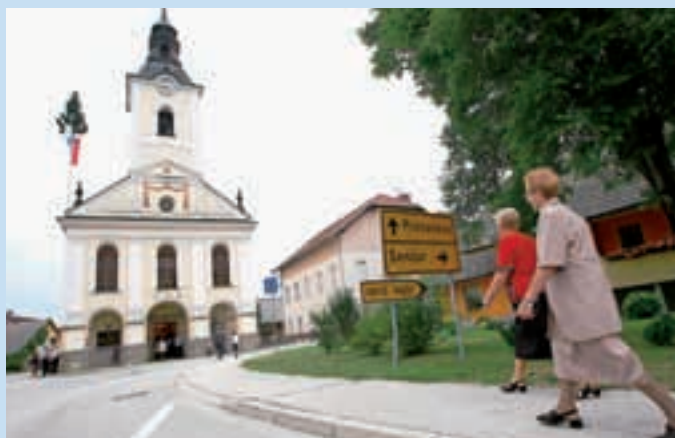
Podružnična cerkev sv. Jerneja v Voklem je stara 150 let.