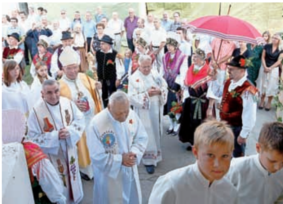
V Trbojah so slavili 100-letnico ustanovitve župnije.