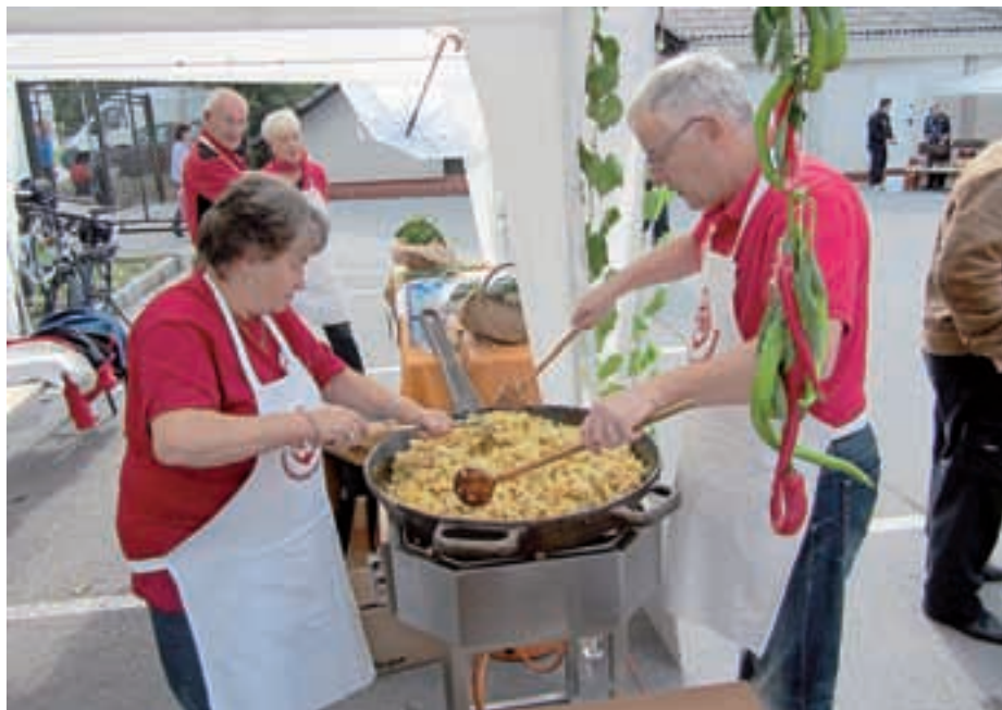
Krompir so člani TD Šenčur pražili tudi na Krompirjevi humanitarni prireditvi v Domači vasi na Primskovem.