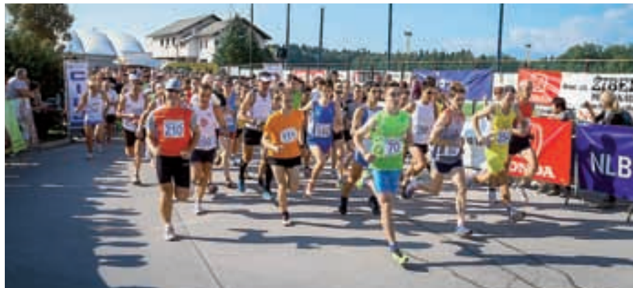
Šenčurski tekaški izziv privabi vsako leto več tekačev.

Klasična desetka po Šenčurju in njegovi okolici se imenuje tudi Krompirjev tek, saj ga Šenčurjani, in to praženega s polovico klobase, po tekmi razdelijo med vse nastopajoče. Šenčurski tek se imenuje tudi Šenčurski izziv, kar je tudi prvi od treh delov teka. Dolžina proge je bila 10 kilometrov. Start in cilj pa v Šenčurju v športnem parku. Trasa je tekače vodila po ulicah Šenčurja in urejenih poljskih poteh. Drugi del teka pa je Rekreativni izziv. Dolžina proge je bila 1,2 kilometra. Potekala je okrog prireditvenega prostora, zato je bila primerna tudi za otroke. Tretji del pa je Šenčurski izziv letos štel kot zaključna tekma Gorenjskega pokala 2012.