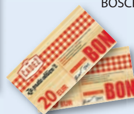
ali darilni bon mesarstva Čadež v vrednosti 20 EUR