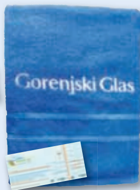
ali kopalna brisača s celodnevno vstopnico za Terme Snovik