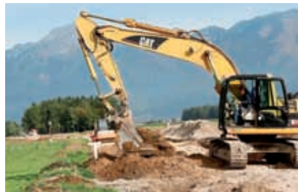
Dela na cesti Visoko–Šenčur intenzivno potekajo.

V poletnem času je občina opravila predvidene rekonstrukcije lokalnih cest. Dela so že končana na cestah Voklo–Voglje in Trboje–občinska meja. Na obeh cestah sta zgrajena otoka za umirjanje prometa, urejena sta odvodnjavanje in javna razsvetljava. Med Voklim in Vogljami je zgrajen tudi pločnik, razen na delu ceste, kjer od lastnice niso uspeli pridobiti potrebnega soglasja. Dela trenutno intenzivno potekajo na cesti Šenčur–Visoko, kjer bo zgrajena tudi kolesarska steza. V prihodnjem tednu pričakujejo polaganje že prvih metrov asfalta. Investicija bo v celoti končana v prvi polovici novembra.