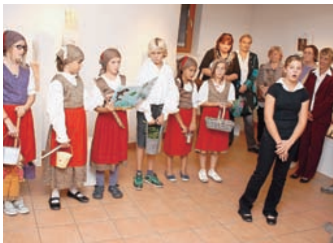
Večer so popestrili mladi člani KUD Valentin Kokalj Visoko.