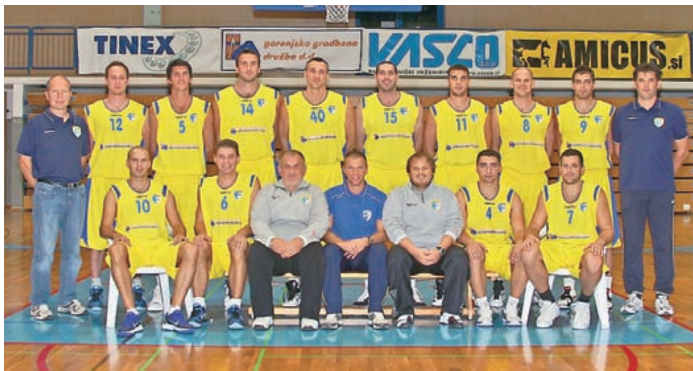
Članska ekipa v letošnji sezoni

Košarkarski klub Šenčur Gorenjska gradbena družba je v letošnjo sezono stopil tudi na samostojno pot.