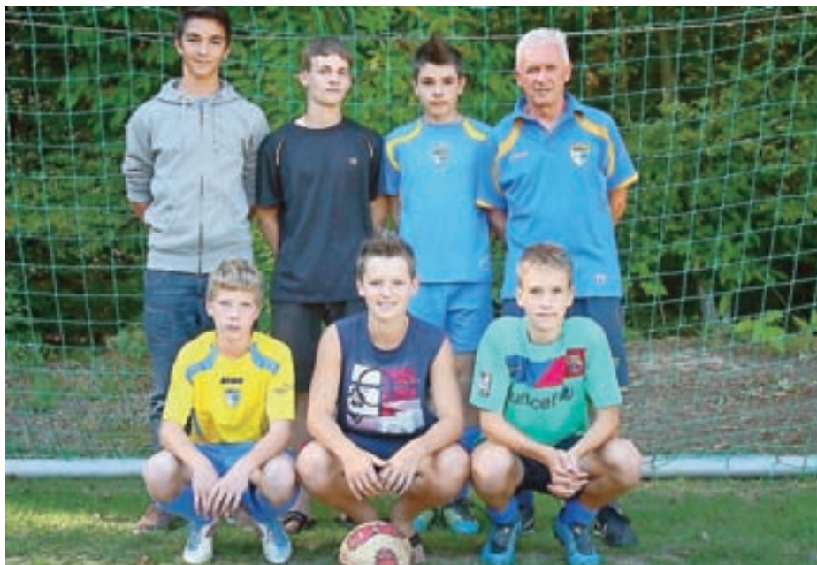
Mladi šenčurski nogometaši so na julijskem MTG Turnirju - Združeni za mir uspešno zastopali Gorenjsko.