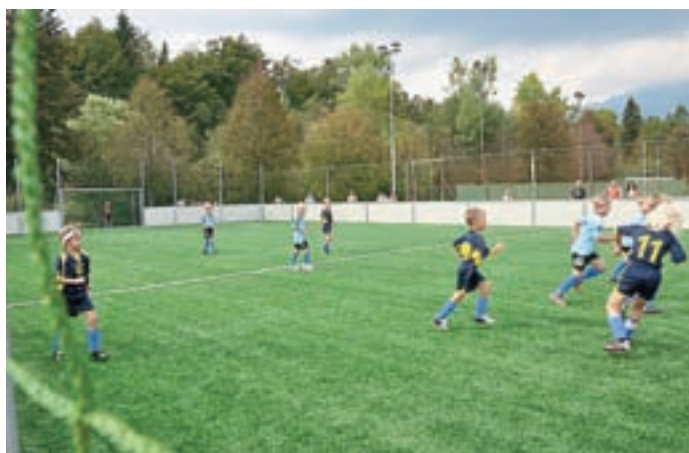
Novo nogometno igrišče z umetno travo