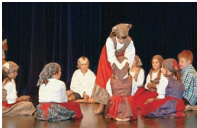
Na akademiji so se sprehodili skozi zgodovino Visokega in Milj.