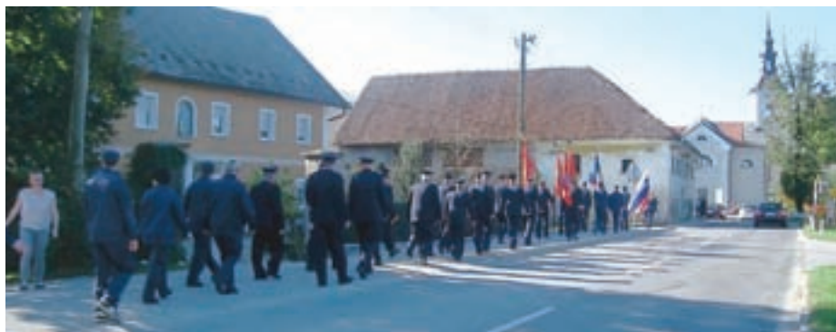
Gasilske maše so se 2. oktobra udeležili tudi člani drugih gasilskih društev.

Že sredi septembra pa je v športnem parku Rapa potekalo tretje srečanje članic Gasilske zveze Kokra. Za udeleženske, bilo jih je približno štirideset, so pripravili tudi preizkušnjo: preteči ali prehoditi so morale dva kilometra dolgo pot, vmes pa so jih na petih točkah čakale različne naloge. Simon Šubič