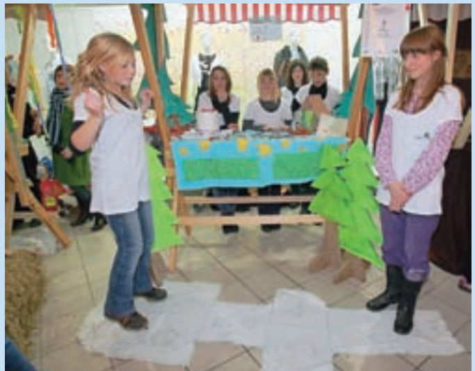
Učenci so Vikend pod zeleno smreko predstavili tudi na turistični tržnici v Kranju.