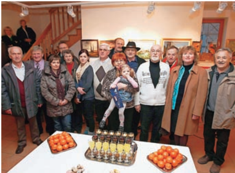
Razstavljalci iz Likovnega društva Preddvorski samorastniki in društva Ante-Pante iz Železne Kaple

Marca je v muzeju potekala likovna razstava Pustne maske, na kateri je avtor Alojz Štirn iz