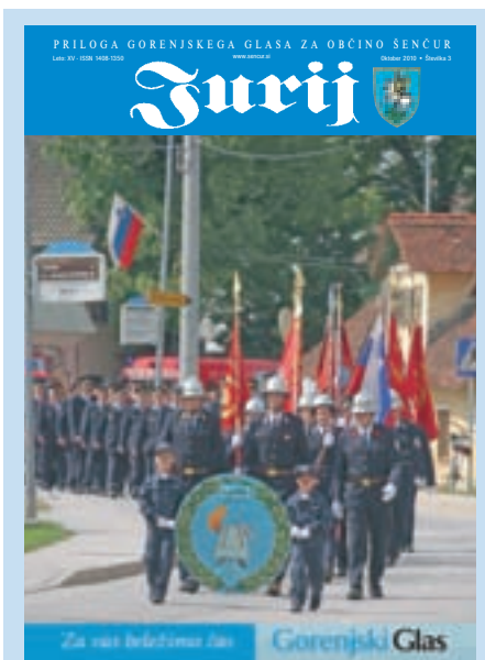
Na naslovnici: 90 let PGD Luže, foto: Tina Dokl

JURIJ (ISSN 1408-1350) je priloga Gorenjskega glasa za občino Šenčur. Prilogo pripravlja Gorenjski glas, odgovorna urednica Marija Volčjak, urednik priloge Simon Šubic, fotografija Gorenjski glas. Oglasno trženje Mirjam Pavlič, 031/698-627. Priprava za tisk Gorenjski glas, d.o.o., tisk: Tiskarna Littera picta, d. o. o.. Jurij številka 2 je priloga 54. številke Gorenjskega glasa, 9. julija 2010, dobijo pa jo vsa gospodinjstva v občini Šenčur brezplačno. Naklada: 2.850 izvodov.