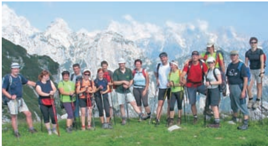
Pohodniki na Debeli peči

Uspešno smo pripravili tudi dva družinska športna piknika, na katerem ni manjkalo športnih iger, glasbe, jedače in pijače. Udeležba je bila izvrstna.