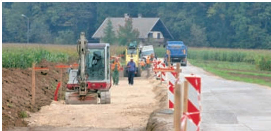
Začetek rekonstrukcije ceste Voklo-Prebačevo