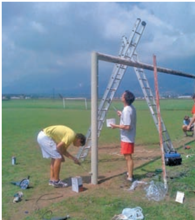
Nogometno igrišče na Olševku - Storžice - so obnovili s prostovoljnimi delom.