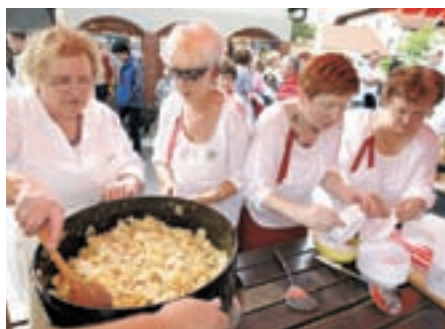
Utrinek z lanskega Praznika krompirja