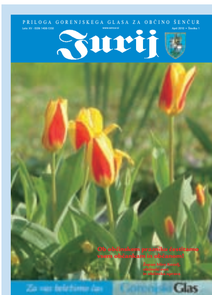
Na naslovnici: Tulipani

”Ločeno zbiranje odpadkov je uvedeno že ta mesec. Komunala Kranj je vsem občanom poslala ustrezna obvestila in navodila v zvezi z novim načinom odlaganja odpadkov, po katerem bodo gospodinjstva ločeno zbirala mešane in biološke odpadke ter odpadno embalažo. V nadaljevanju bodo delavci Komunale Kranj zabojnike z mešanimi odpadki opremili s čipi, saj bodo smeti tehtali, kar bo vplivalo na končno ceno za posamezno gospodinjstvo. Ločeno zbrani odpadki, kot so papir, steklo, plastična embalaža, pločevinke in biološki odpadki, gredo v nadaljnjo obdelavo in z njimi ni drugih stroškov kot z odvozom. Zaračunavanje stroškov ravnanja z odpadki bo po novem, zaradi tehtanja, bolj pravično. Ravnanje z odpadki bo po novem precej bolj zahtevno, a bo ob našem pametnem ravnanju vseeno lahko cenejše, ob brezbriznem odnosu pa lahko tudi dražje. Opozoriti je treba, da bo Komunala Kranj preverja-