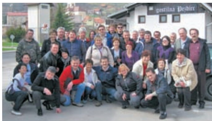
Skupinska slika s "tadolge" krvodajalske akcije KO RK Visoko-Milje-Luže