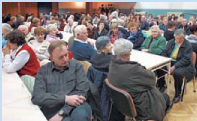
Občni zbor društva upokojencev je bil dobro obiskan.