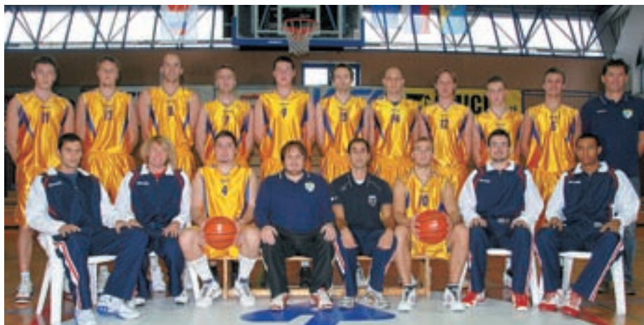
Ekipa KK Šenčur CPK mladi se je uvrstila v drugo slovensko košarkarsko ligo.