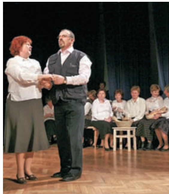
Folklorna skupina Šenčur je navdušila z nastopom na občnem zboru Društva upokojujencev Šenčur.