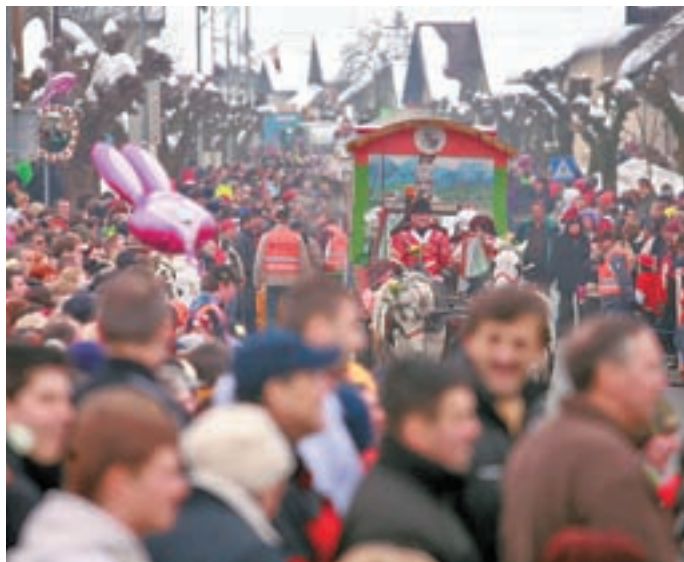
Godlarska pustna povorka je bila spet množično obiskana.

Šenčurski Godlarji letos praznujejo okrogli jubilej, saj so pred dvajsetimi leti organizirali prvo pustno povorko.