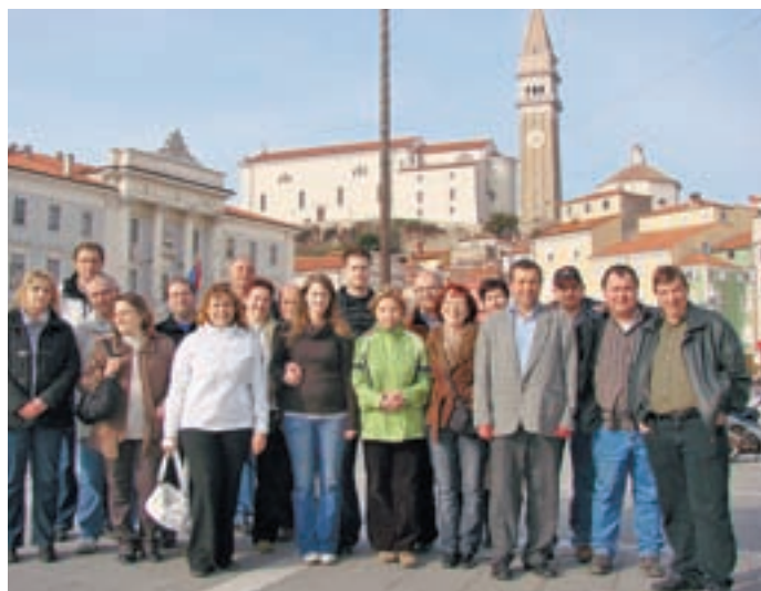
Voklanci so si ogledali tudi Piran.