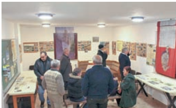
Razstava starih razglednic z naslovom Naši kraji skozi čas