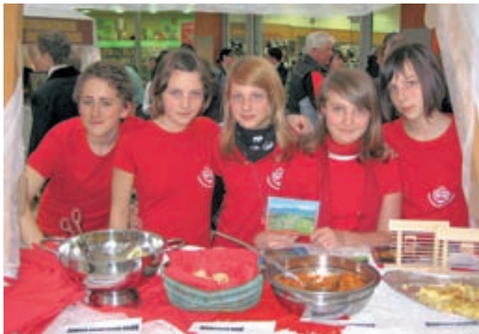
Učenci so na turistični tržnici ponujali tudi krompirjeve jedi.