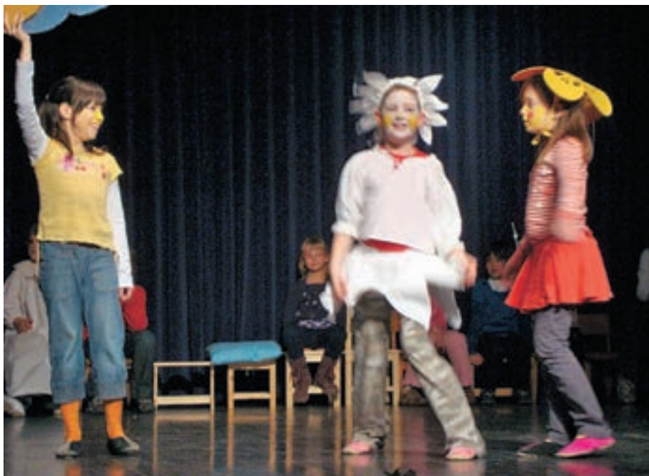
V našem društvu velik poudarek dajemo našim najmlajšim.

Gostili smo tudi dve celovečerni predstavi, februarja komedijo absurda Plešasta pevka, marca pa komedijo Scapinove zvijače.