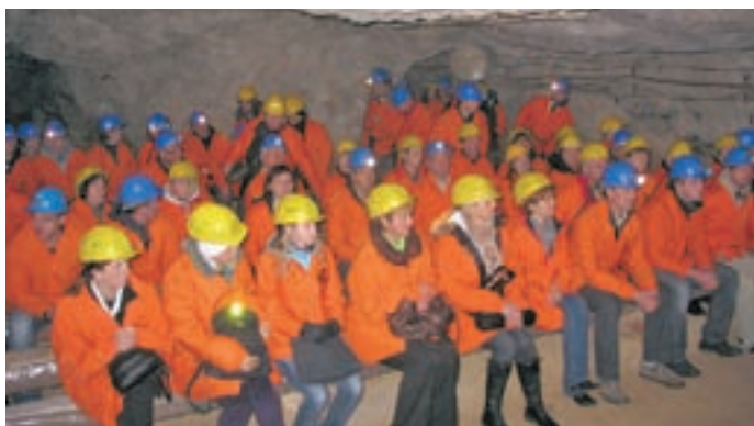
Krvodajalci iz Hotemaž in Olševka v rudniku v Mežici