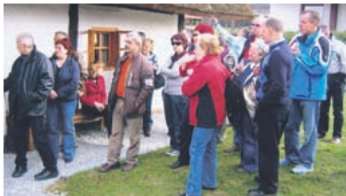
Krvodajalci iz Šenčurja in Srednje vasi pred Matjaževo domačijo v vasi Paha nad Šmarjeto