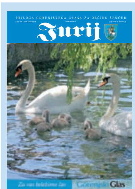
Na naslovnici: Labodja družina

JURIJ (ISSN 1408-1350) je priloga Gorenjskega glasa za občino Šenčur. Prilogo pripravlja Gorenjski glas, odgovorna urednica Marija Volčjak, urednik priloge Simon Šubic, fotografija Gorenjski glas. Oglasno trženje Mirjam Pavlič, 031/698-627. Priprava za tisk Gorenjski glas, d.o.o., tisk: SET, d.d., Vevče. Jurij številka 2 je priloga 53. številke Gorenjskega glasa, 7. julija 2009, dobijo pa jo vsa gospodinjstva v občini Šenčur brezplačno. Naklada: 2.850 izvodov.