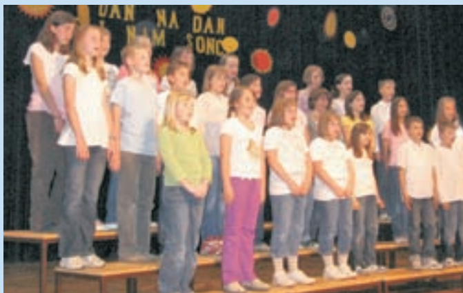
Otroški pevski zbor OŠ Šenčur

Za učiteljski pevski zbor je bila organizacija omenjene revije uvod v pestro dogajanje, ki je sledilo, saj smo se že naslednji dan predstavile na mednarodnem koncertu Učiteljeva pesem v Trzinu, v soboto, 16.