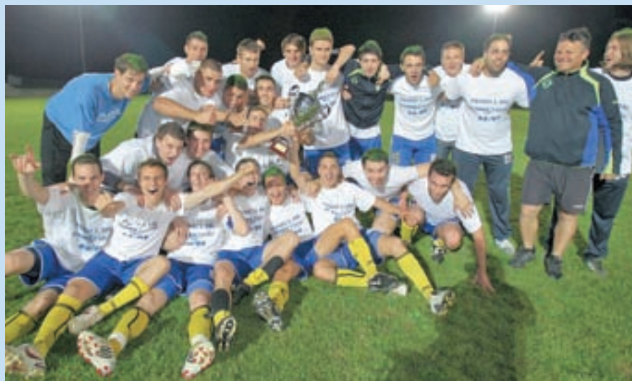
Veseli ob zmagi v 3. SNL - Zahod