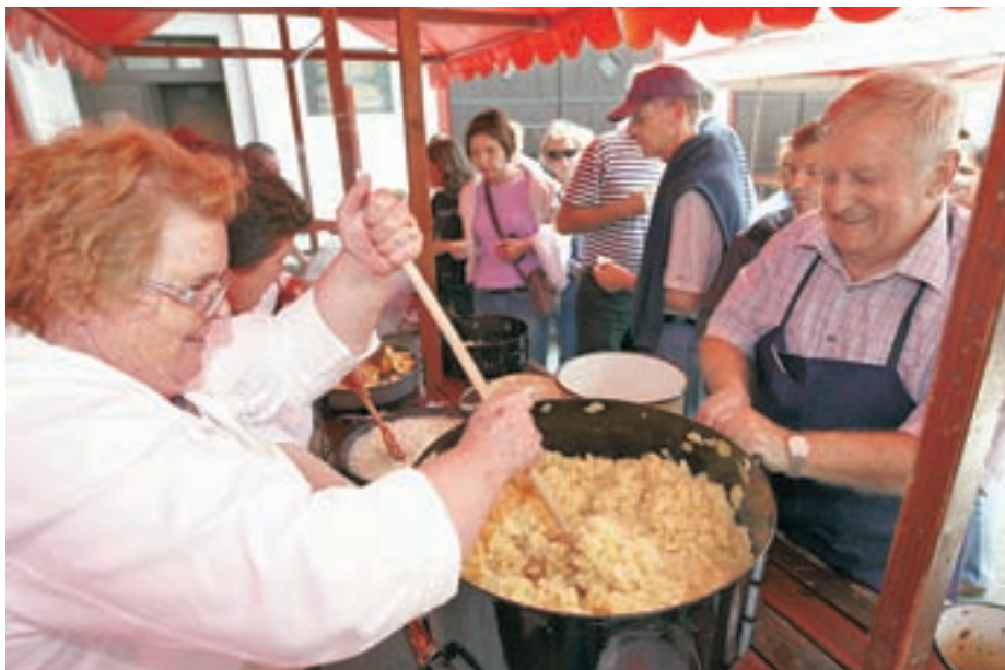
Letos je bilo na voljo več praznega krompirja kot na lanski prireditvi, je pa bilo treba zanj odšteti en evro.