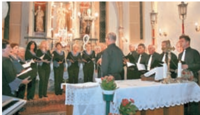
Šenčurski zvon je letni koncert že tretjič pripravil v cerkvi sv. Radegunde v Srednji vasi.