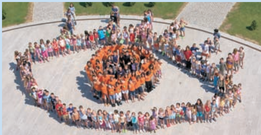
Skupinska fotografija iz lanskega oratorija z naslovom Odpri oči