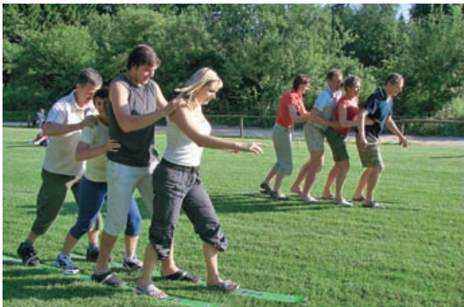
Tek na smučeh je vedno najzanimivejši.