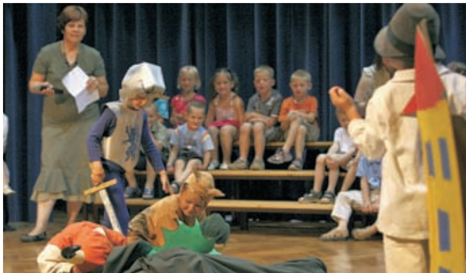
Otroci so prikazali, kako je vitez Jurij premagal zlobnega zmaja.