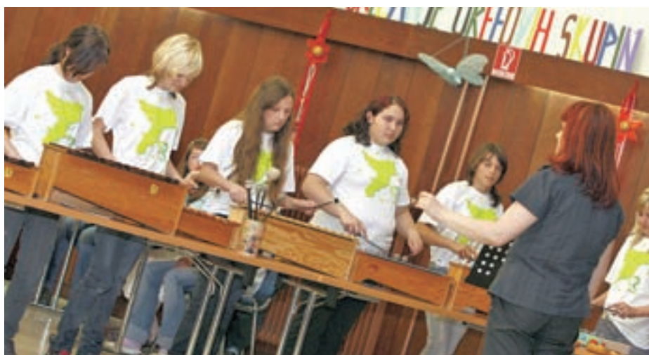
Predstavila se je tudi Orffova skupina iz Radelj pri Dravi.

Da našim otrokom ne bo dolgčas, bomo v KUD-u pripravili ustvarjalne delavnice. Potevale bodo v Športnem parku Rapa, in sicer od 10. do 15. avgusta, vsak dan od 10. do 12. ure. Delavnice so brezplačne. Ustvarjali bomo z naravnimi materiali. Da ne bo preveč enolično, bomo šli tudi v naravo in materiale sami nabrali. Otroci zelo radi ustvarjajo in so potem ponosni na svoje izdelke.