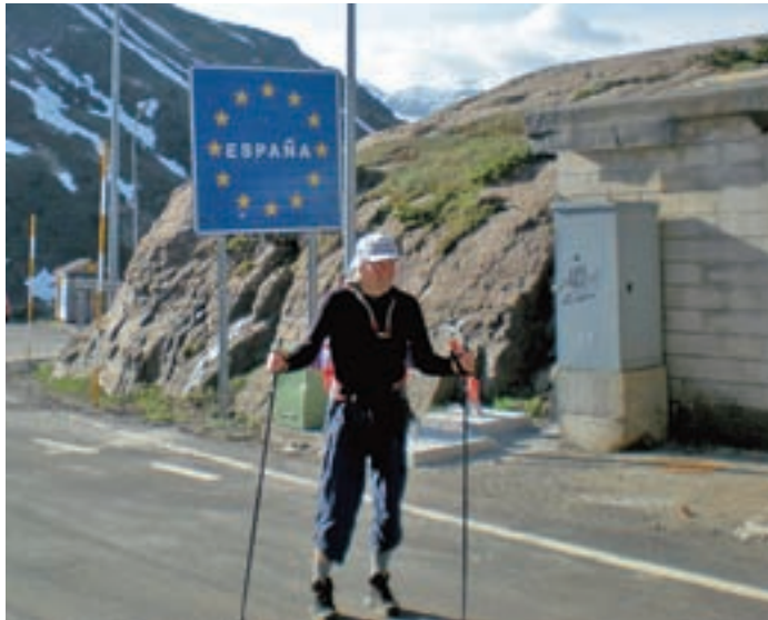
Na meji med Francijo in Španijo