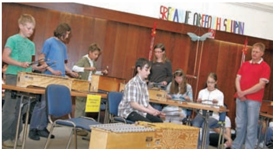
Orffova skupina iz OŠ Šenčur