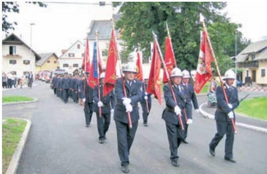
Slovesnost ob 110-letnici delovanja PGD Voglje se je pričela z gasilsko parado, na kateri so sodelovala tudi druga gasilska društva v občini Šenčur.