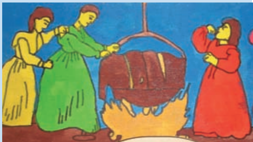
Maja Rogelj: Perejo ob kotlu