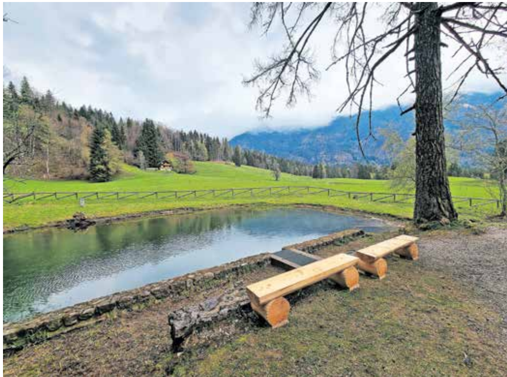
Zoisov park z novimi klopami ob jezeru

V bližini parka se je mogoče okrepčati v Domu Pristava, ki je stalno odprt in je nekdanja Zoisova pristava z vklesano letnico 1647. Nedaleč stran je tudi Kurirčkov dom, kjer je urejen gorskokolesarski učni center, ki je namenjen vsem navdušencem nad gorskim kolesarstvom. V centru si je mogoče izposoditi kolesa in opremo za gorsko kolesarstvo, gorski kolesarji se lahko preskusijo na poligonu, v neposredni bližini pa poteka tudi turnokolesarska pot Trans Karavanke.