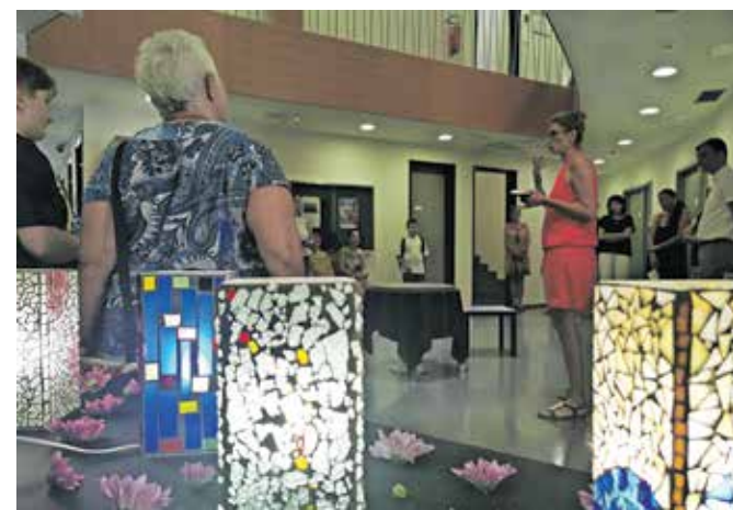
Nastale so tudi namizne lučke v tehniki mozaik.