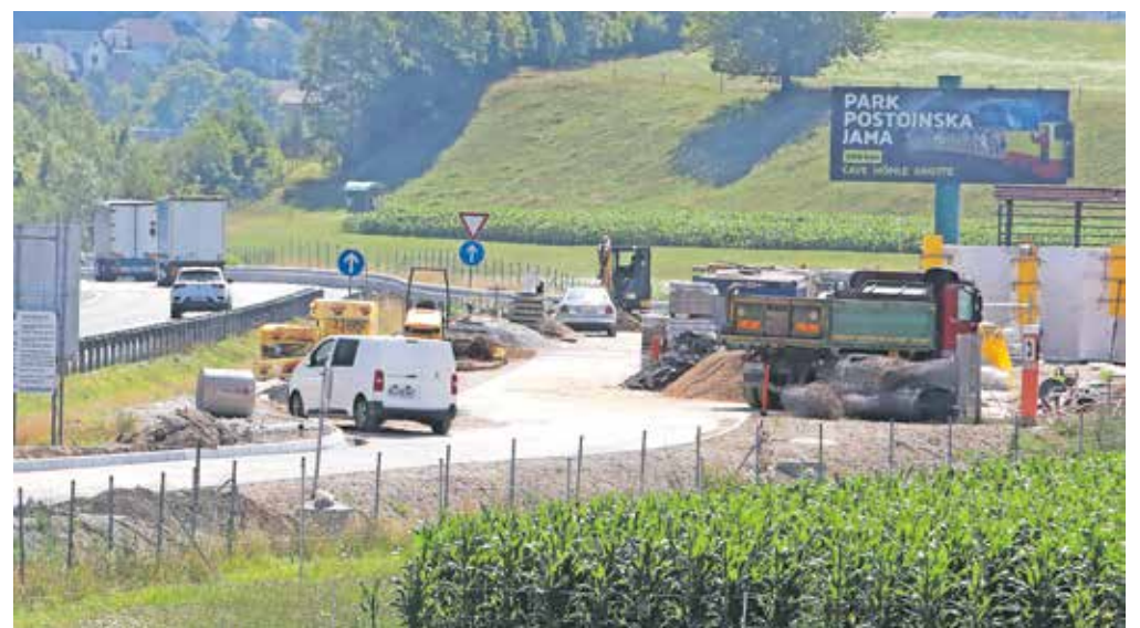
Obnova počivališča Lipce jug že poteka, še letos naj bi začeli dela tudi na drugi strani avtoceste na počivališču Lipce sever.

»Pri veliki večini potnikov v tranzitu so mala počivališča prvi in morda tudi edini stik s Slovenijo. Imenovali bi jih