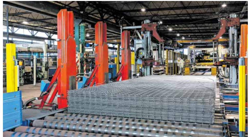
Kovinar Jesenice je največji proizvajalec armaturnih mrež na območju nekdanje Jugoslavije.

Podjetje je od leta 2007 v italijanski lasti, lastnik je skupina Pittini, ki je ena večjih jeklarskih korporacij v Evro-