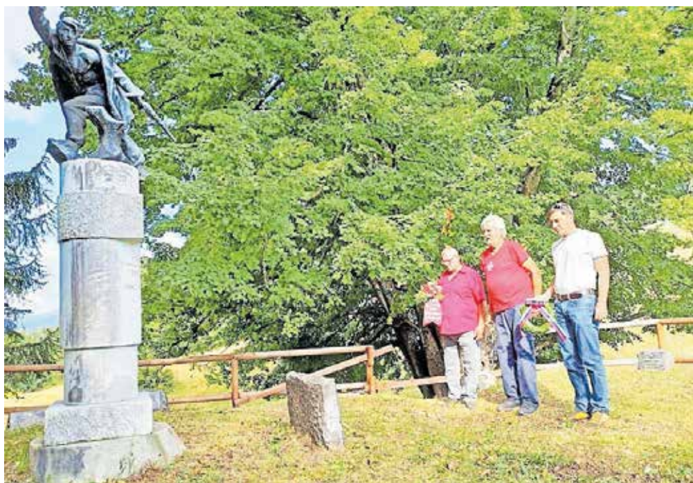
Polaganje venca k spomeniku na Obranci