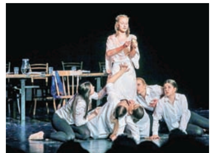
Iz devete simfonije

(1. b); najboljša scena: Kdaj smo zdej?; najboljša kostumografija: Iz devete simfonije; najboljši gledališki list: Iz devete simfonije; najboljša koreografija: Kdaj smo zdej? in posebna nagrada žirije: Zadnja večerja (3. a). Prvi večer se je festivala udeležil tudi jeseniški župan Blaž Račič, ki je čestital vsem ustvarjalcem in dejal, da ga veseli, da mladi tudi na ta način bolje spoznajo in vzljubijo kulturo in umetnost.