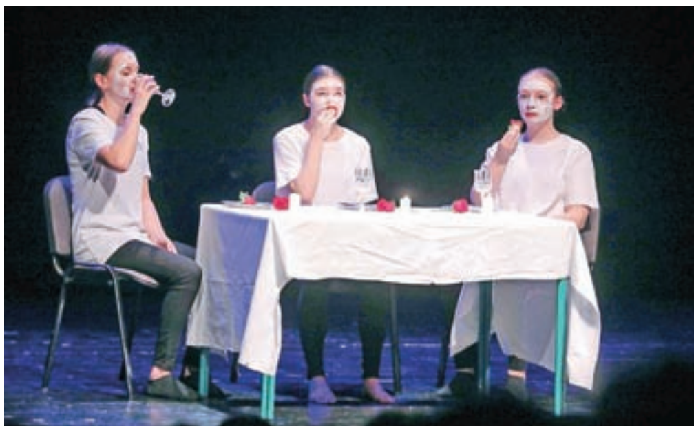
Zadnja večerja