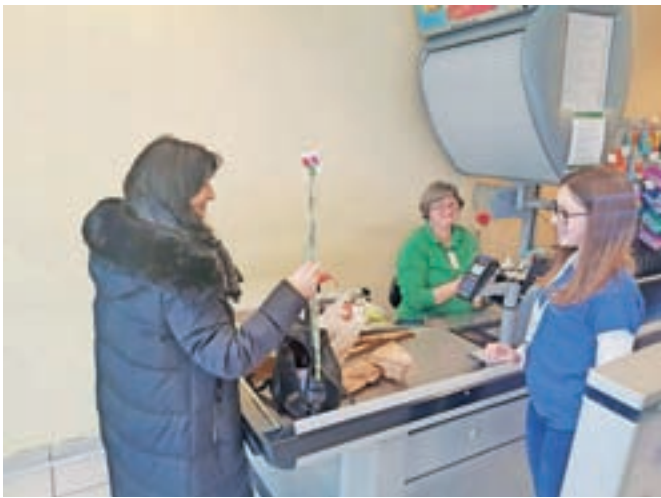
Z nageljčki so razveselili ženske.