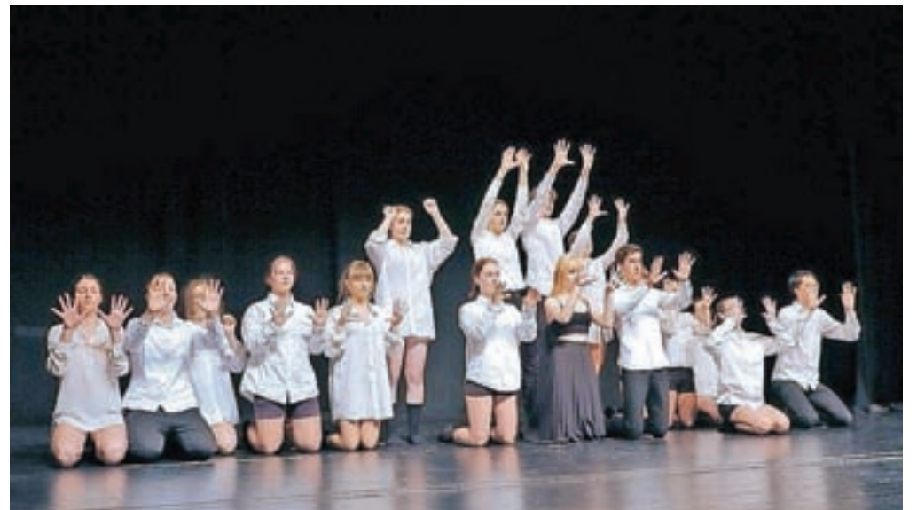
Kdaj smo zdej?