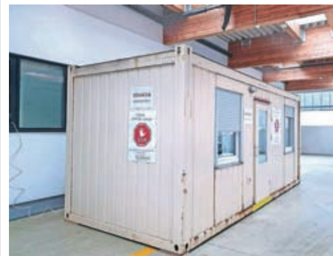
Pred urgentnim centrom v bolnišnici je zabojnik, namenjen pregledu pacientov, ki izkazujejo simptome možne okužbe s koronavirusom.

Tudi v Zdravstvenem domu Jesenice opozarjajo, naj pacienti s simptomi možne okužbe s koronavirusom ne obiskujejo zdravstvenega doma, temveč naj najprej po telefonu pokličejo osebnega zdravnika, pri katerem bodo prejeli nadaljnja navodila in ki jih bo po potrebi napotil na testiranje na sprejemno točko pred Splošno bolnišnico Jesenice.