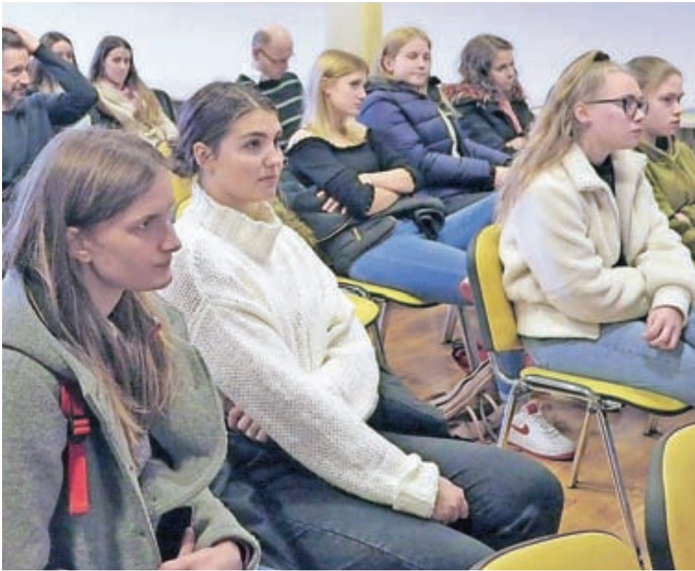
Srečanja so se udeležili tudi dijaki tretjega letnika turizma na Srednji gostinski in turistični šoli Radovljica.

Ob tej priložnosti na obisk vsako leto povabijo razred dijakov Srednje gostinske in turistične šole Radovljica ter ponudnike turističnih namestitev v občini, da bi ti svojim gostom lahko predstavili celotno turistično ponudbo Jesenic z okolico in morda tudi manj znane,