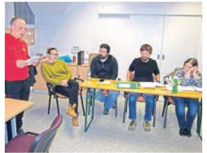
Z občnega zbora društva

jam možnost, da drugo leto prevzamete funkcijo predsednika društva. Sprejmite izziv in prevzemite vodstvo. Vsi bomo veseli novega vetera in novih idej, s tem pa tudi promocije našega lepega kraja." Predsednik je v poročilu o delu v lanskem letu med drugim poudaril dobro delo turističnega podmladka in skupno izdajo zloženke Sprehod po vasi skozi otro-