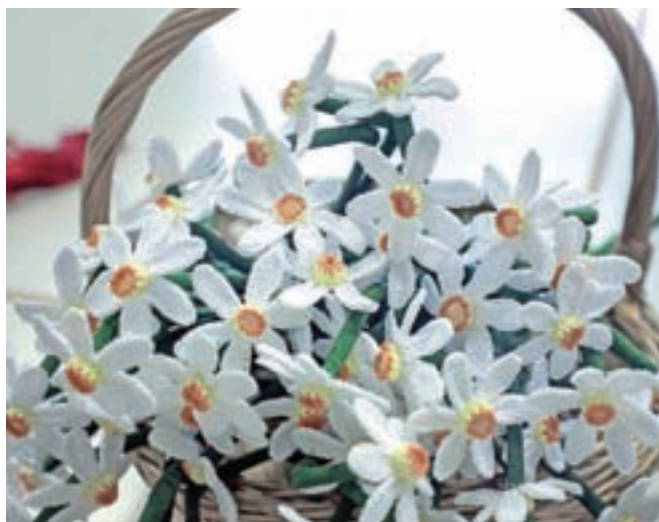
Kvačkane narcise bodo del šopkov, ki jih bodo podarili jeseniškimi občinskimi nagrajencem.