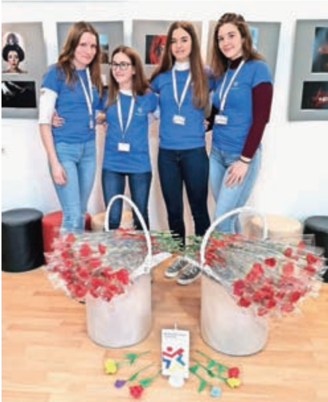
Dekleta, ki so sodelovala v ulični akciji

Kot so ob tem poudarili v Mladinskem centru Jesenice, dan žena praznujemo v okrog sto državah po svetu in je simbol boja za žensko enakopravnost.