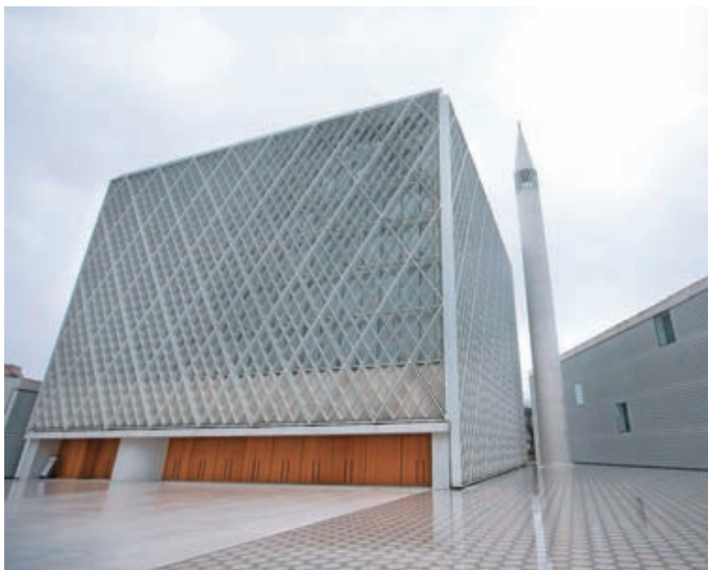
Džamija je zasnovana po vzoru kaabe, črne kocke iz Meke, ob njej samostojno stoji minaret. V sklopu centra je sicer šest objektov, vsi so bele barve, narejeni iz betona, stekla in lesa, obdani so z belo železno konstrukcijo.