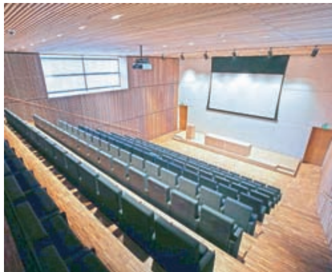
V sklopu centra so uredili tudi predavalnico.

sestavlja šest objektov v beli barvi, narejeni so iz betona, stekla in lesa, obdani pa so z belo železno konstrukcijo. Srce centra je džamija, ki je v obliki kocke, po vzoru kaabe, črne kocke iz Meke. Ob njej samostojno stoji štirideset metrov visok minaret, v sklopu centra so še upravni objekt, kjer deluje muftijev urad, izobraževalni objekt z učilnicami, večnamensko