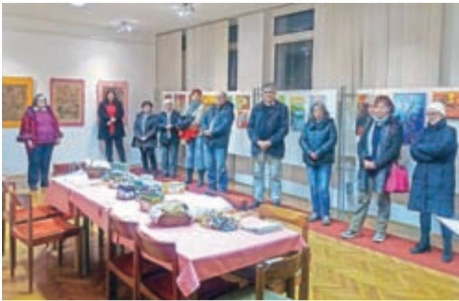
Z odprtja razstave

sprosti. To je tudi oblika te šole, da vsak dela po svojih vzgibih, Brina mi pri tem pomaga. Razstavo sem pripravila za spodbudo vsem, ki bi radi slikali in risali," je povedala Darinka.