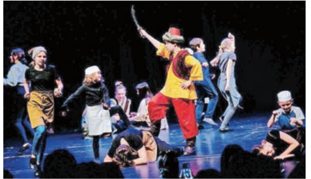
Produkcija gledališke šole: Bal Lander in njegovi razbojniki