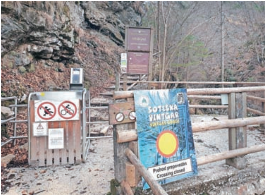
Predvideno je, da bodo turisti vstopali v sotesko Vintgar v Podhomu in izstopali pri slapu Šum. Od tam so označene pešpoti, ki vodijo skozi Hom v Zasip ali na Blejsko Dobravo.