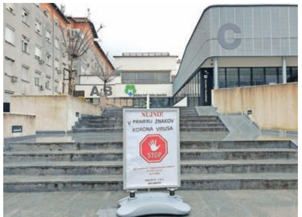
Zaradi koronavirusa je na Jesenicah odpovedanih tudi precej prireditev.

Tako je tudi na Jesenicah kar nekaj prireditev odpovedanih, med drugih nocojšnji koncert Gradske glazbe Pag in klope SOL. Vse marčevske prireditve je odpovedalo tudi Gledališče Toneta Čufarja Jesenice, prav tako