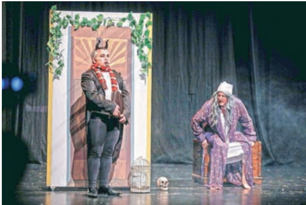
Teater, prof.: Smešna zgodba o čarovniku Faustu

ski kaos dijakov iz 2. c, Navihanci iz 3. a, Lubice Bubice iz 3. b in Šacijini Angelčki iz 4. a. Trije razredi so na festivalu sodelovali prvič, pose-