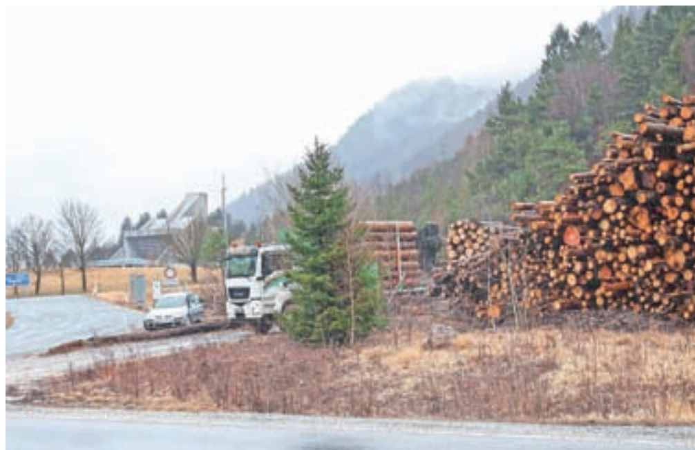
Na zemljišču tik ob predoru bo Cengiz postavil kamp za delavce, ki bodo sodelovali pri gradnji.

Ob tem Cengiz ureja vse potrebno, da bo na zemljišču v neposredni bližini predora postavil kamp za delavce, ki bodo gradili drugo cev. Gre za zemljišče, ki je v lasti Agrarne skupnosti (AS) Dovje - Mojstrana, na njem pa je Gozdno gospodarstvo (GG)