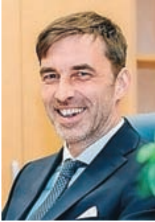
Župan Blaž Račič

Pomena sodelovanja prostovoljcev se zavedamo tudi na Jesenicah. Naša pričakovanja o številu prijavljenih so bila upravičena, odziv pa kaže, da ima dejavnost tudi v občini Jesenice podporo med prostovoljci. To je bistveno. Zato izkoristim priložnost in se zahvaljujem vsem, ki so se prijaviili za opravljanje te humane dejavnosti in bodo v prihodnje prostovoljno prevažali starejše od doma do zdravnika, v knjižnico, v trgovino in po drugih opravkih.